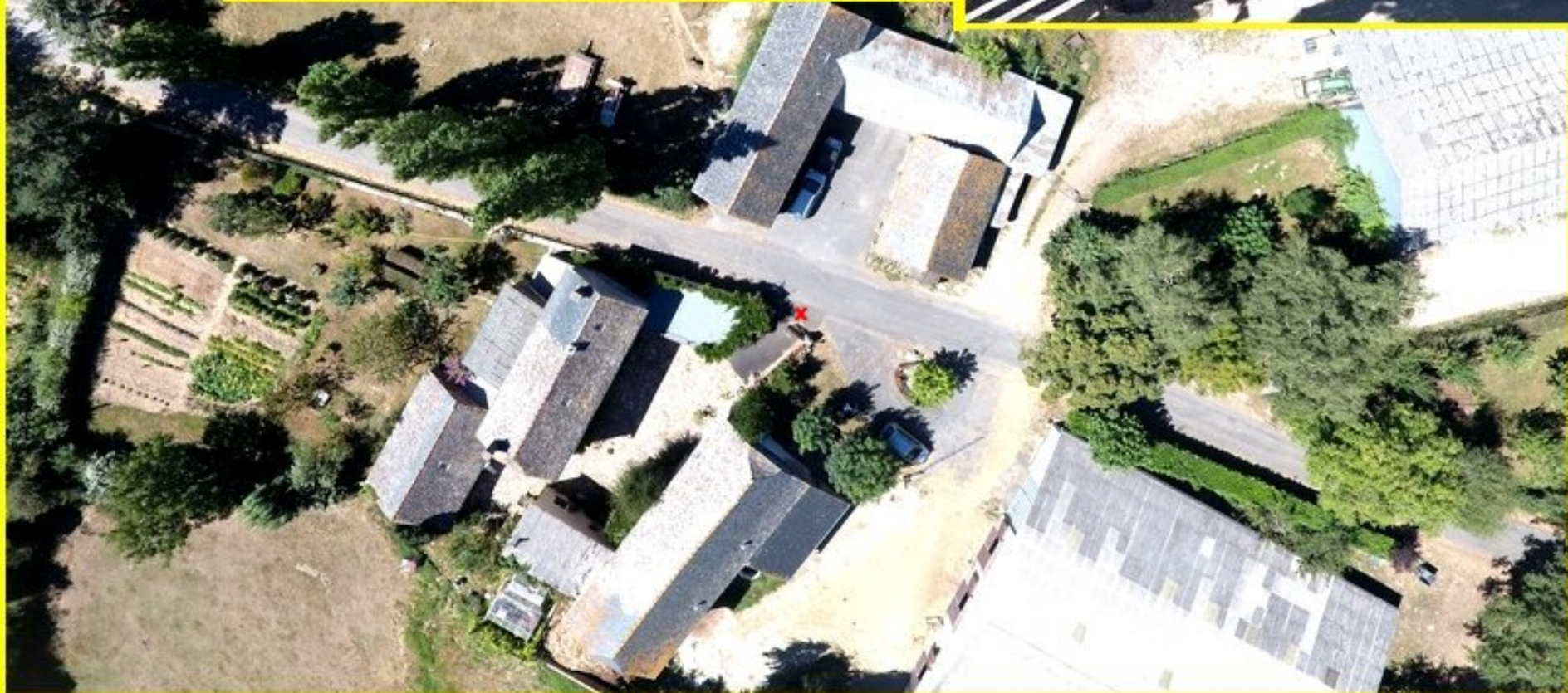
La Lande Rulhac Saint Cirq (12120)