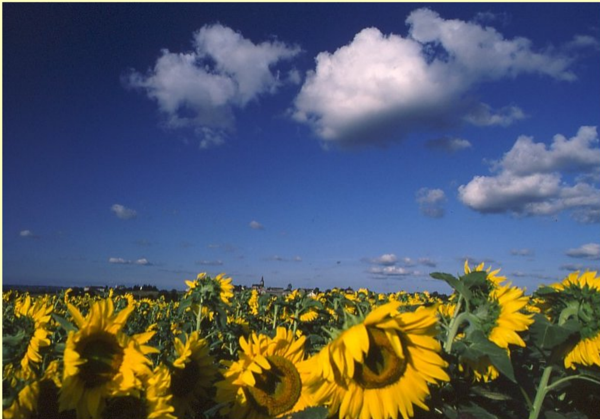
derrière les tournesols, Meljac...