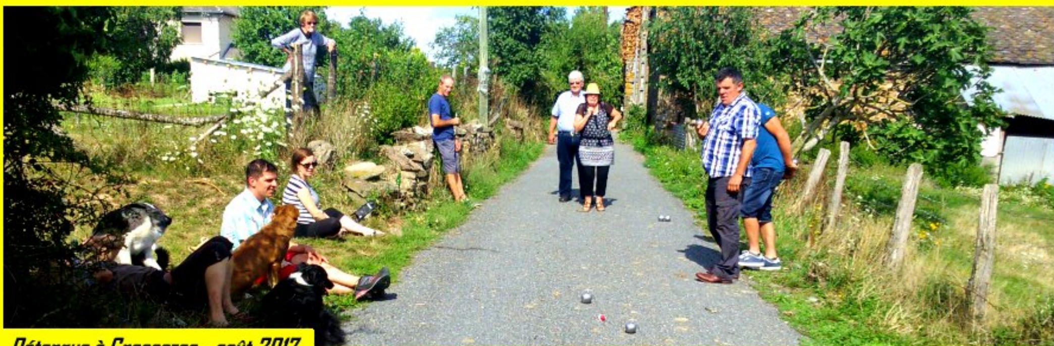
Pétanque à Grascazes - août 2017