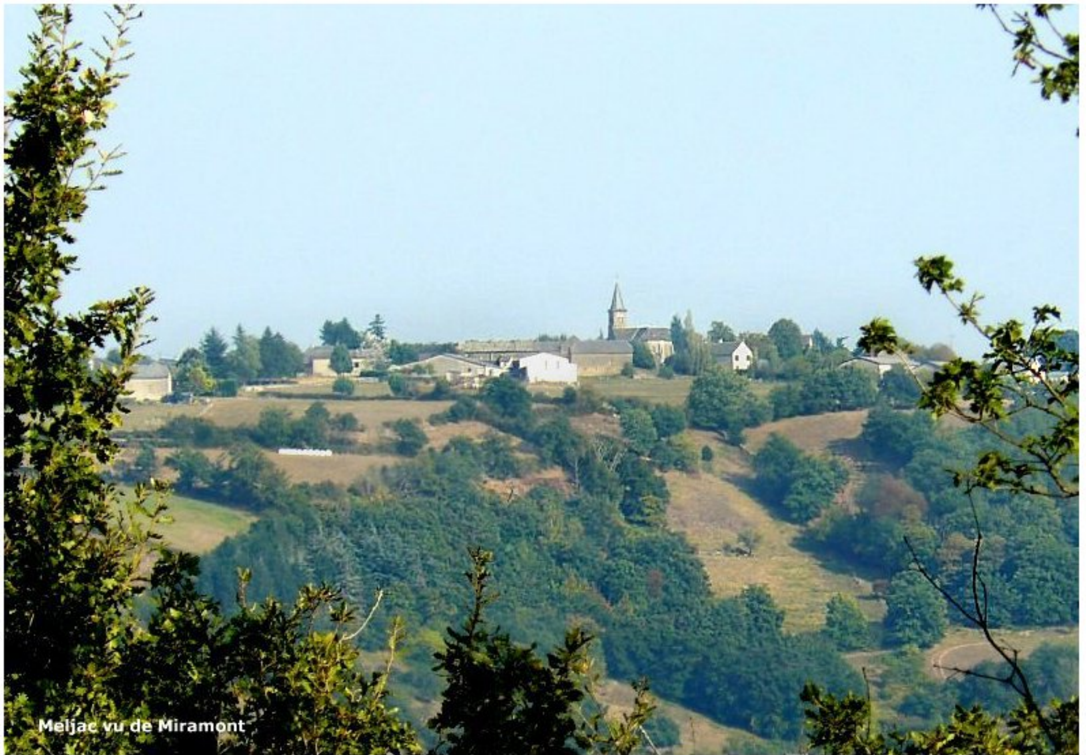
Meljac vu de Miramont