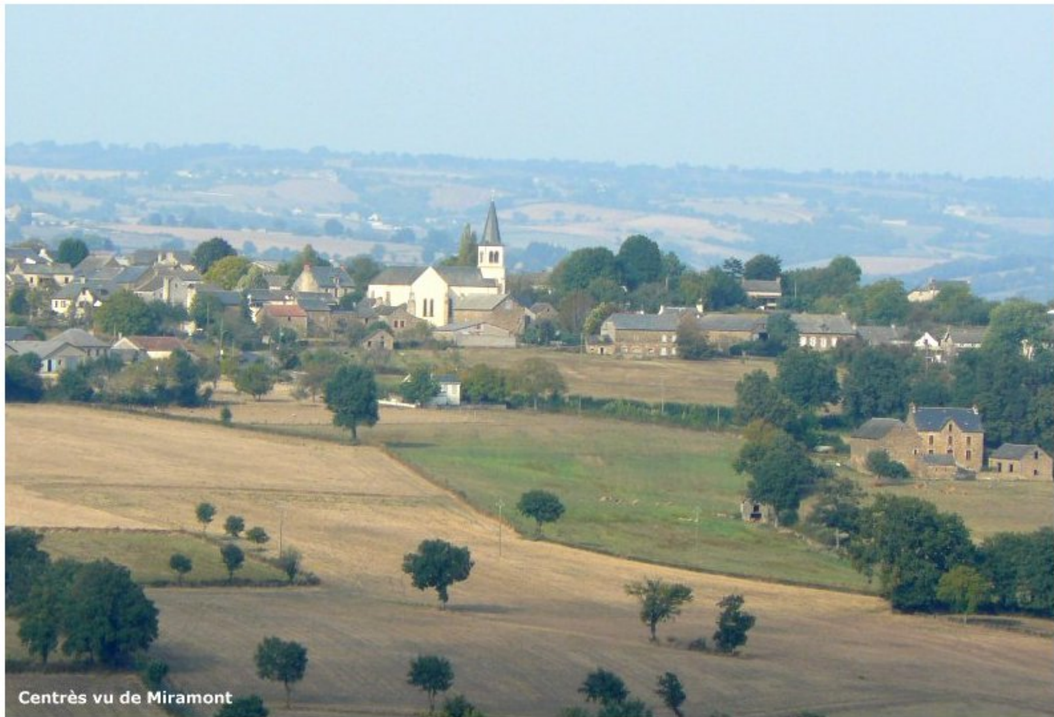
Centres vu de Miramont