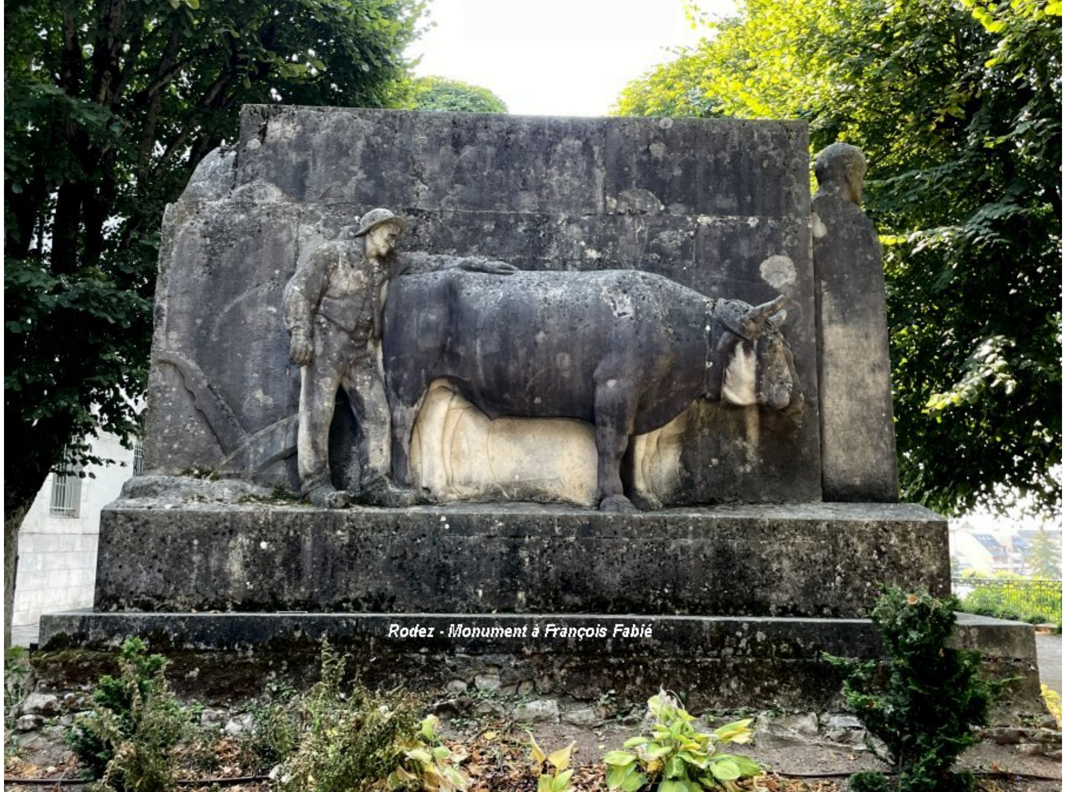
Rodez - Monument à François Fabié