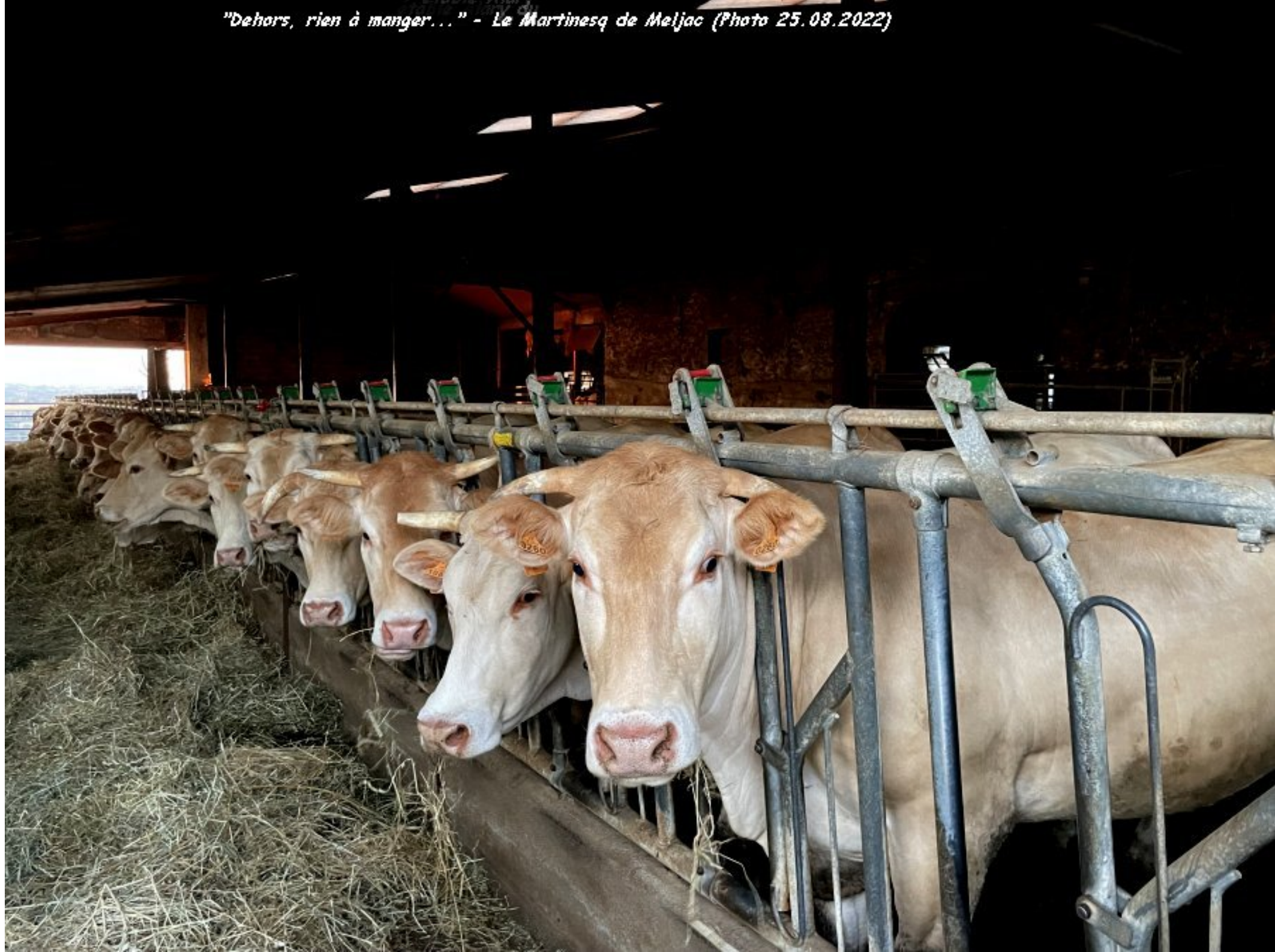
"Dehors, rien à manger..." - Le Martinesq de Meljac (Photo 25.03.2022)