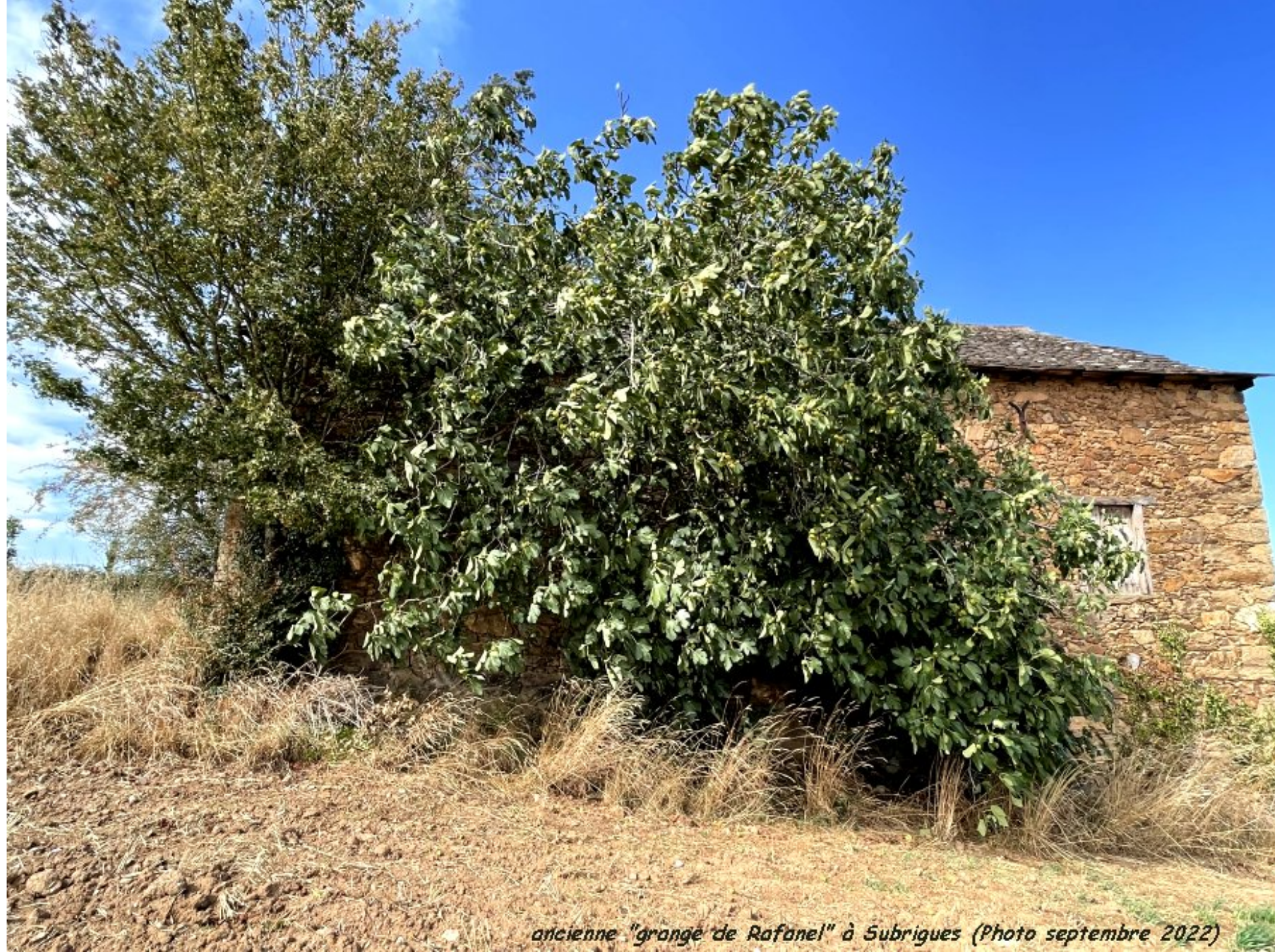
ancienne "grange de Rafanel" à Subrigues (Photo septembre 2022)