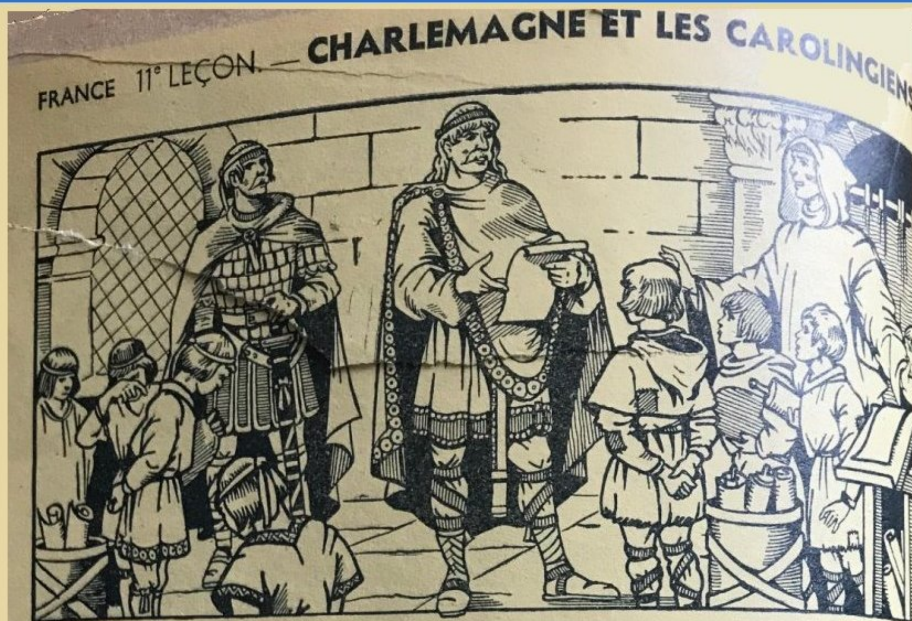
Charlemagne visite une école.

pour la prochaine sortie du 15 septembre des aînés de Meljac avec La Selve à Millau / Montpellier le Vieux