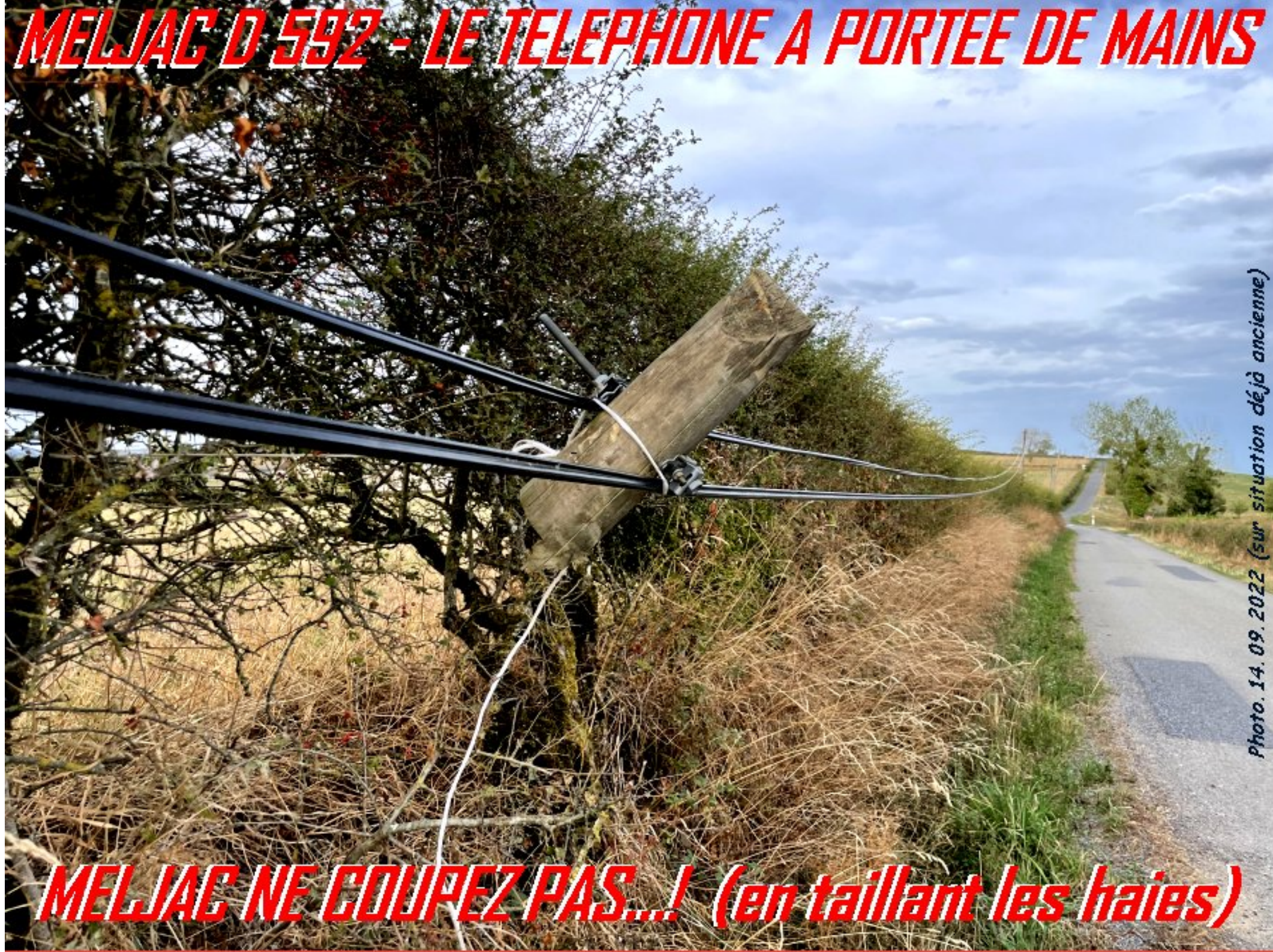
Photo. 14.09.2022 (sur situation déjà ancienne)

MELJAC NE COUPEZ PAS...! (en taillant les haies)