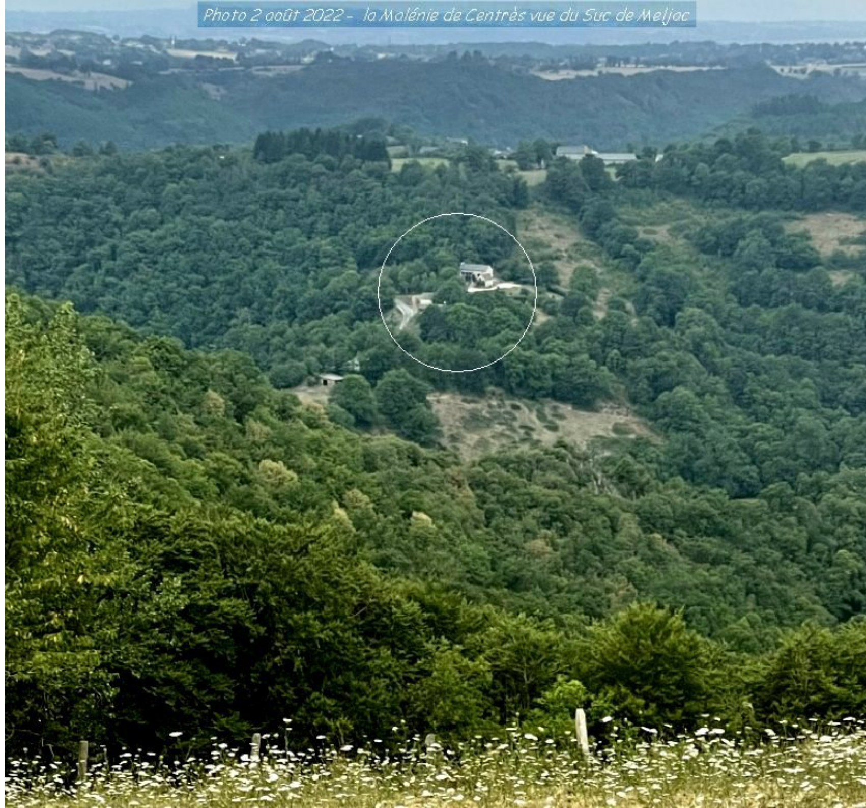
Photo 2 août 2022 - la Malénie de Centres vue du Suc de Meljac