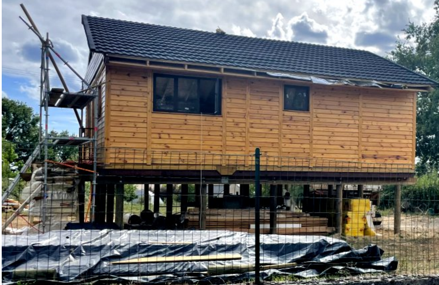
Maison sur pilotis en construction à l'entrée de Meljac - les travaux avancent (Photo 8 septembre 2022)