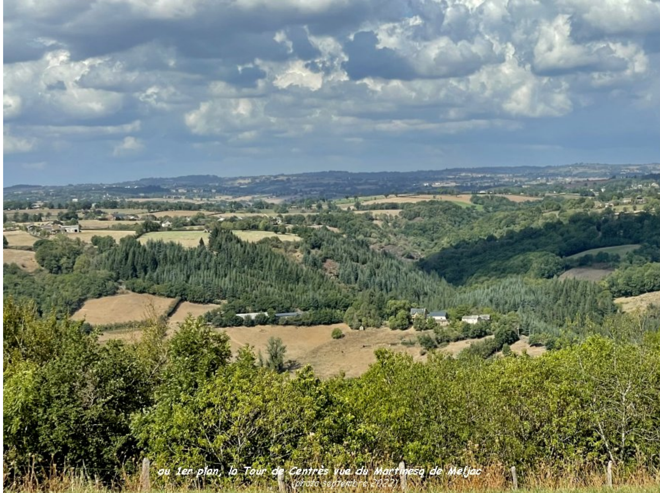
au 1er plan, la Tour de Centrès vue du Martinesq de Meljac (photo septembre 2022)