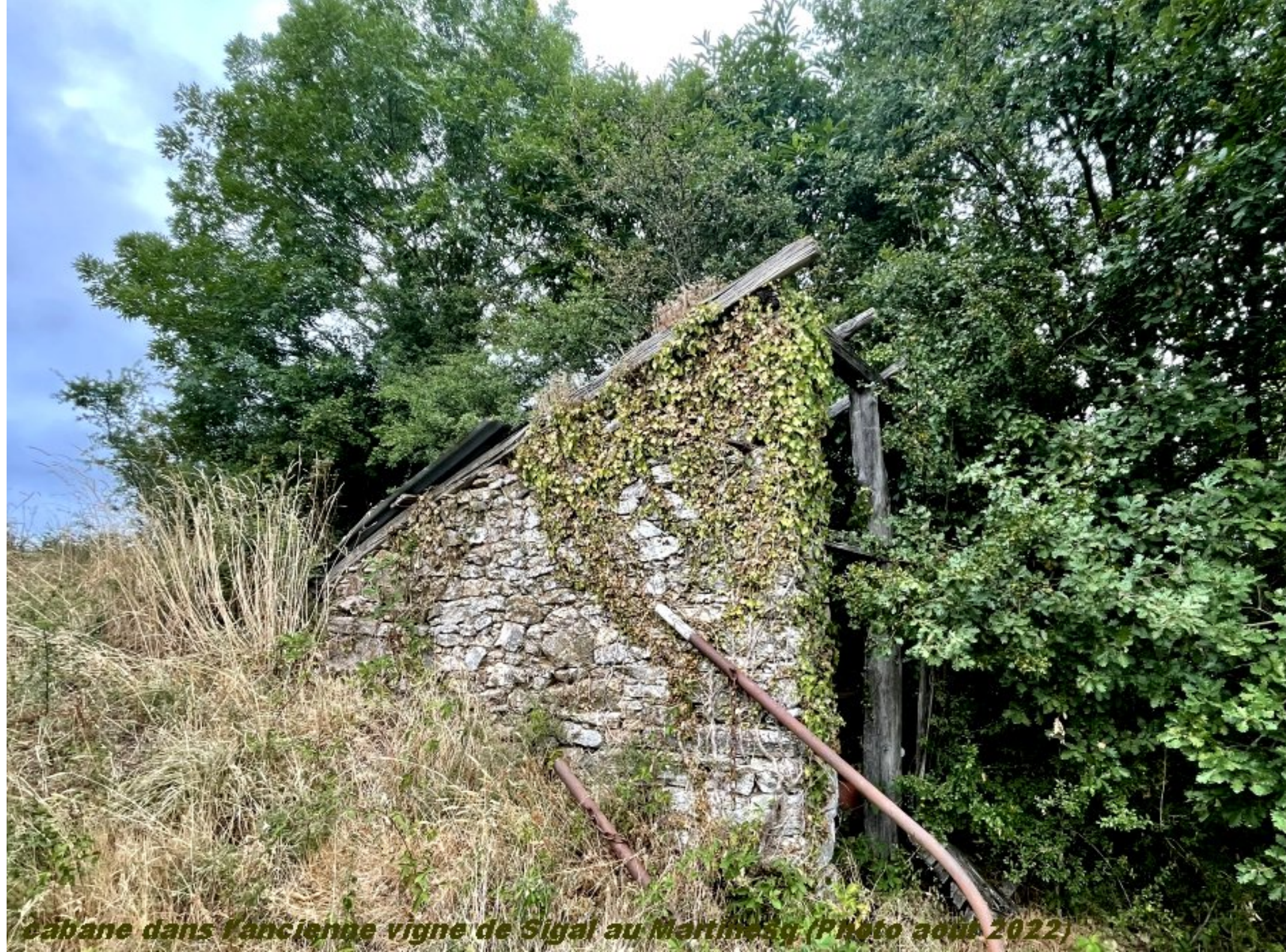
Cabane dans l'ancienne vigne de Sigal au Martinèsq (Photo août 2022)