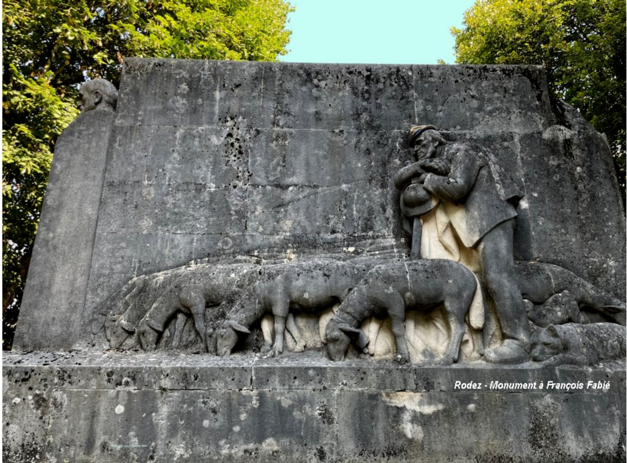
Rodez - Monument à François Fabié