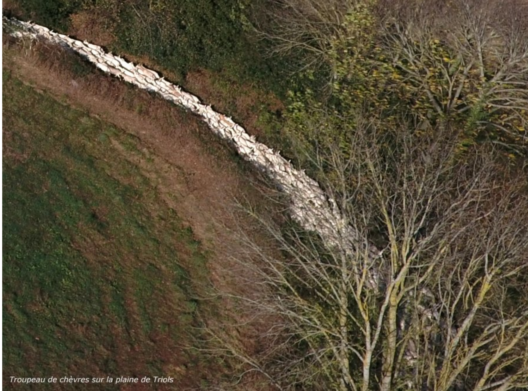
Troupeau de chèvres sur la plaine de Triols