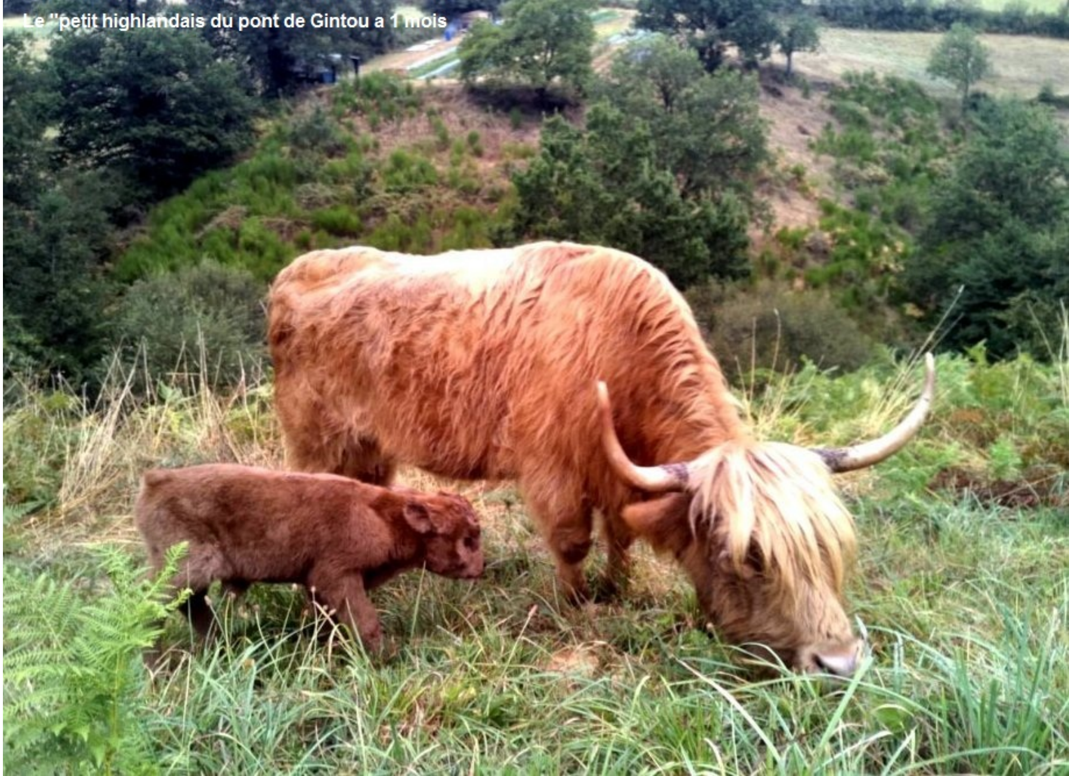
Le "petit highlandais du pont de Gintou a 1 mois