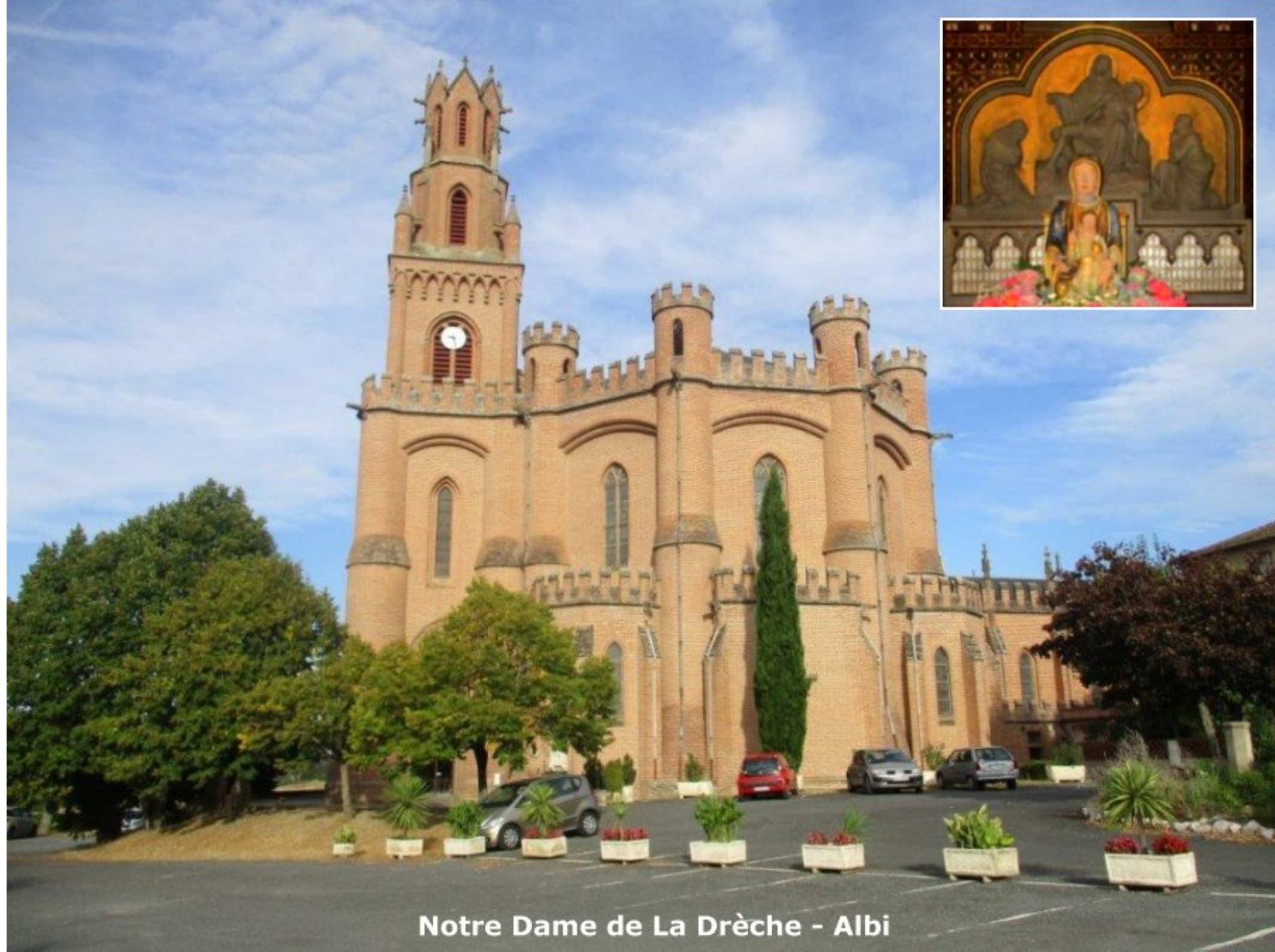
Notre Dame de La Drèche - Albi