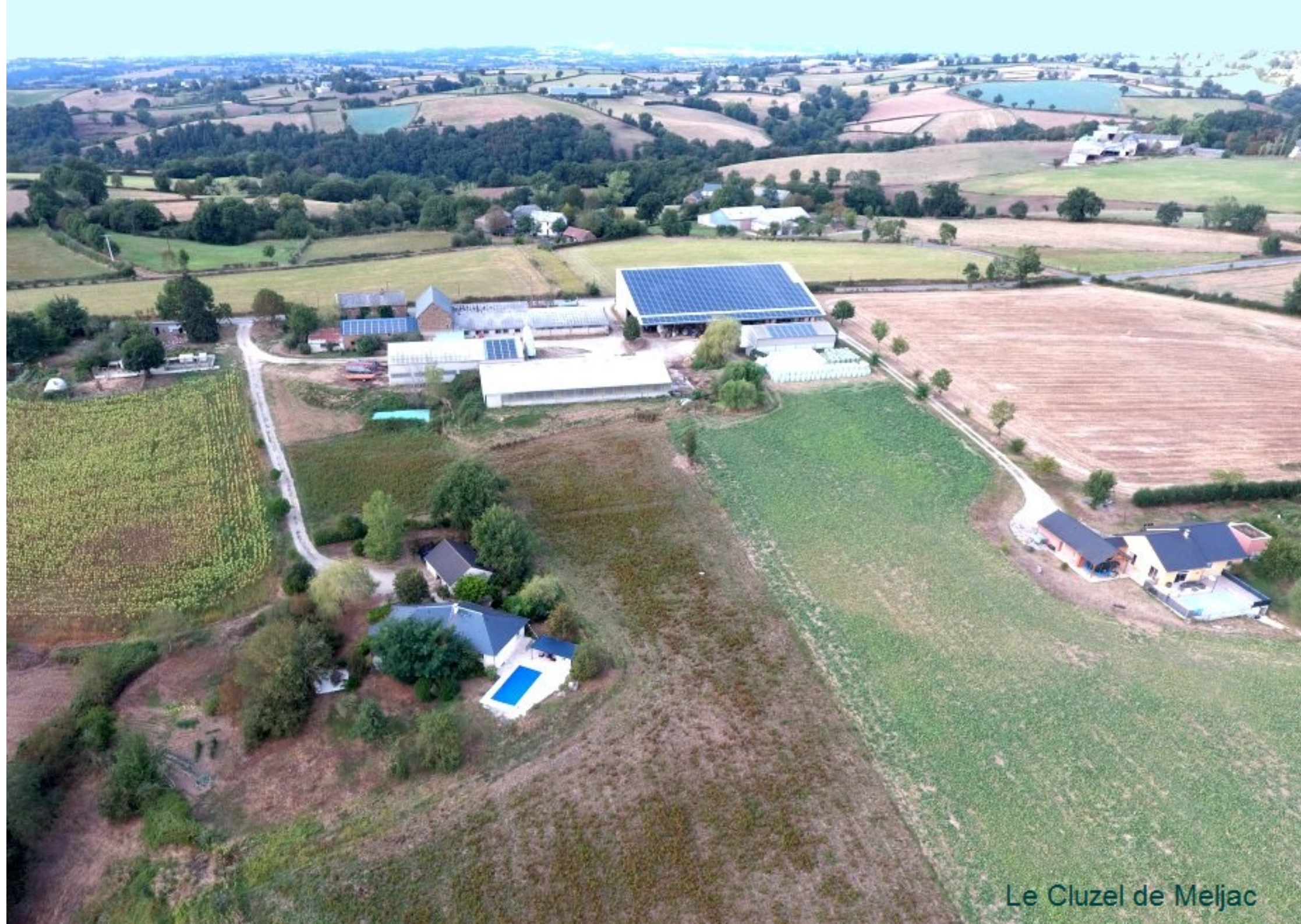
Le Cluzel de Meljac