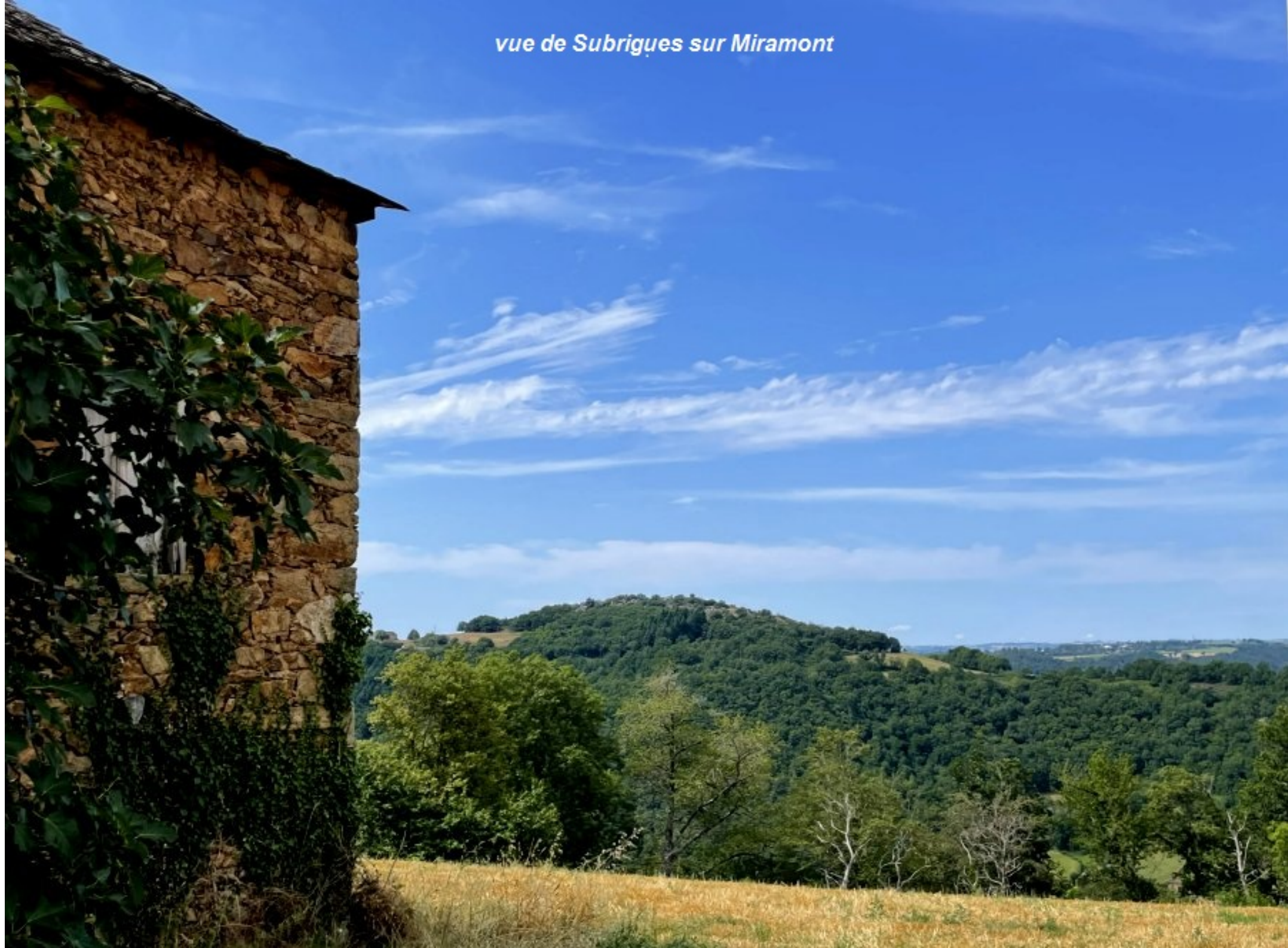
vue de Subrigues sur Miramont