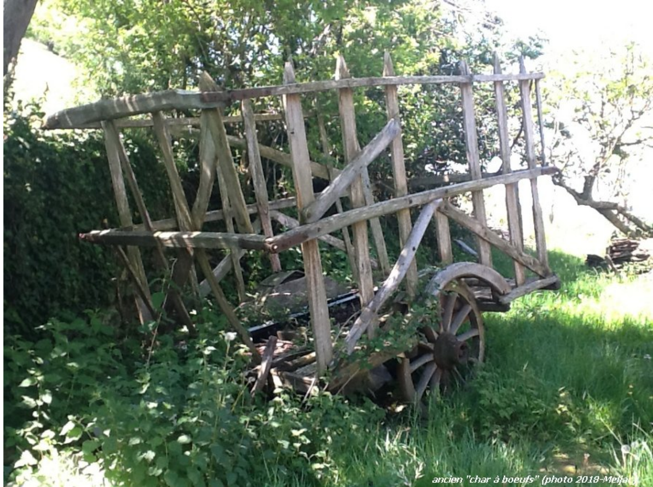
ancien "char à boeufs"