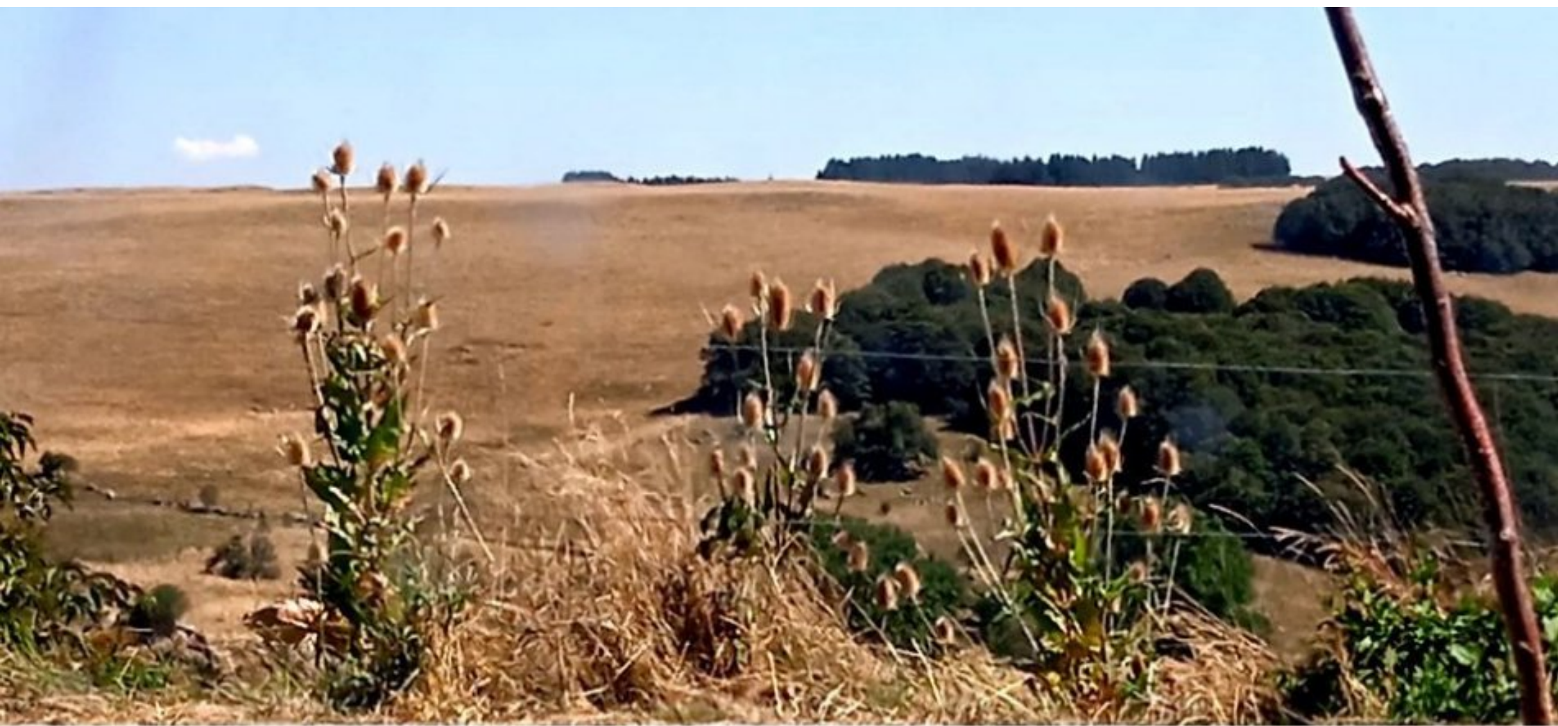
Sortie en Aubrac... "qui s'y frotte s'y pique" (Photo Francie Almayrac 10 septembre 2023)