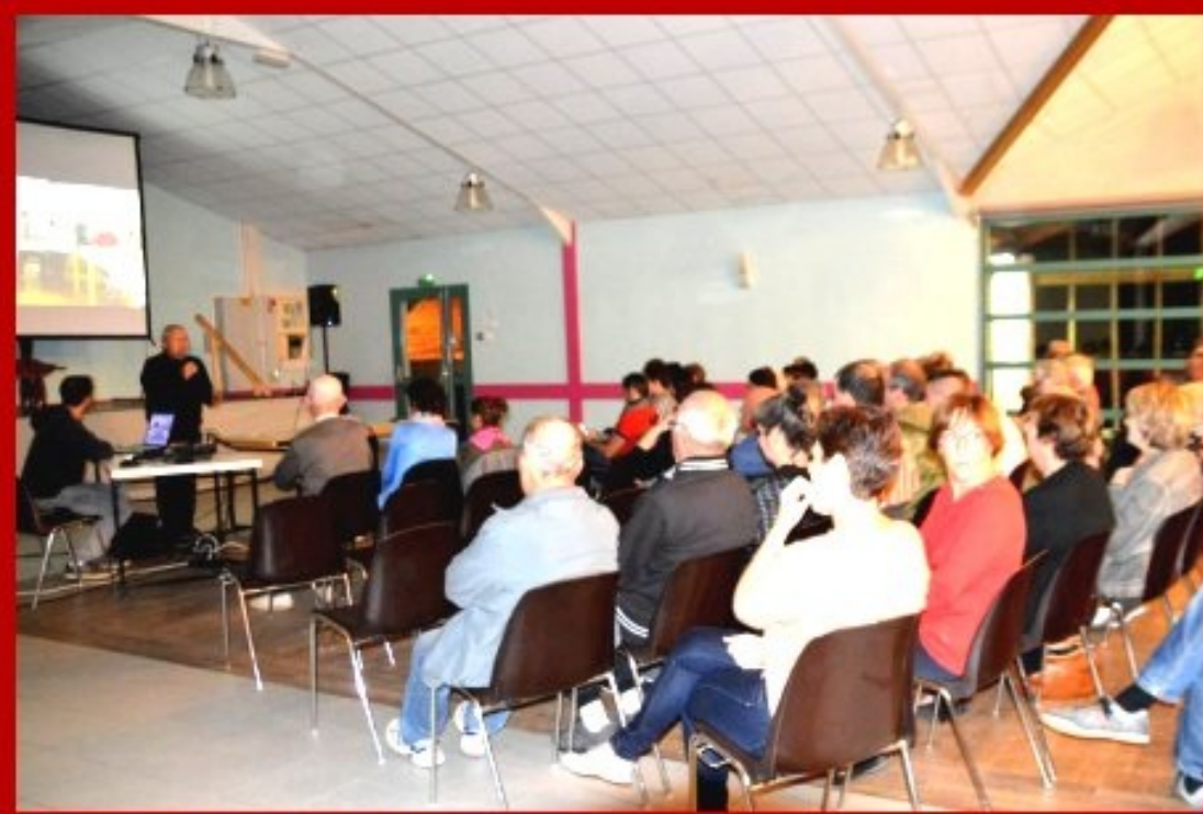
19 octobre 2018 - Soirée Meljac.Net