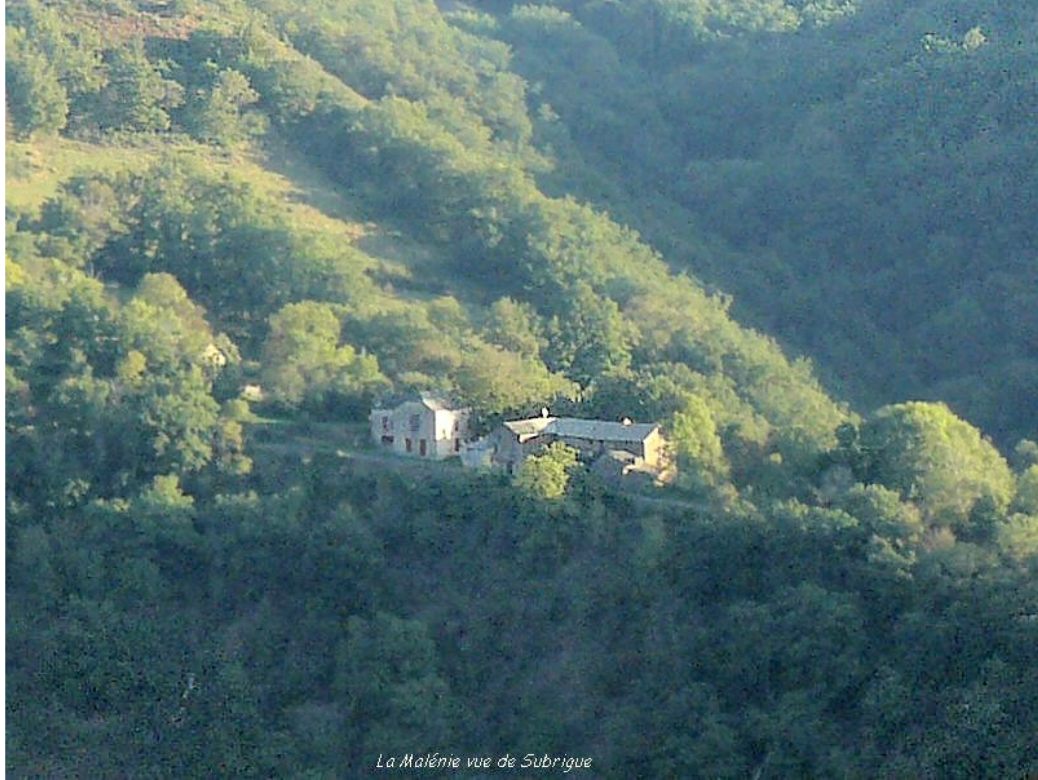
La Malénie vue de Subrigue