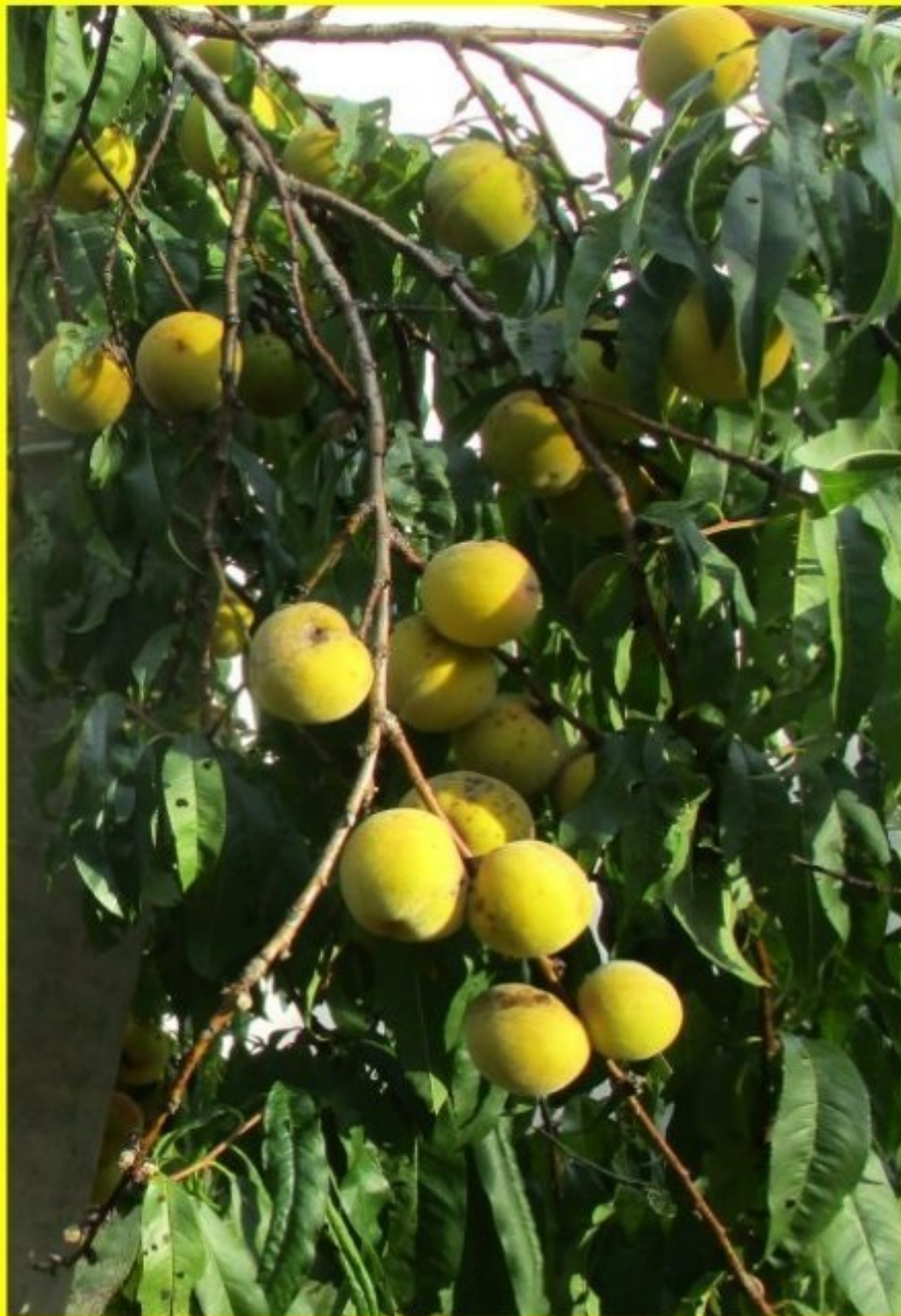
"avec cette chaleur, raisins et pêches de vignes mûrissent ensemble" La Bessière 11 septembre 2023