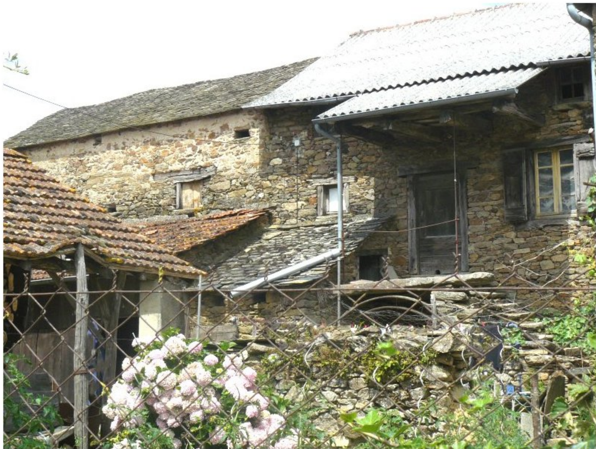
maison vieille Robert - la Tapie