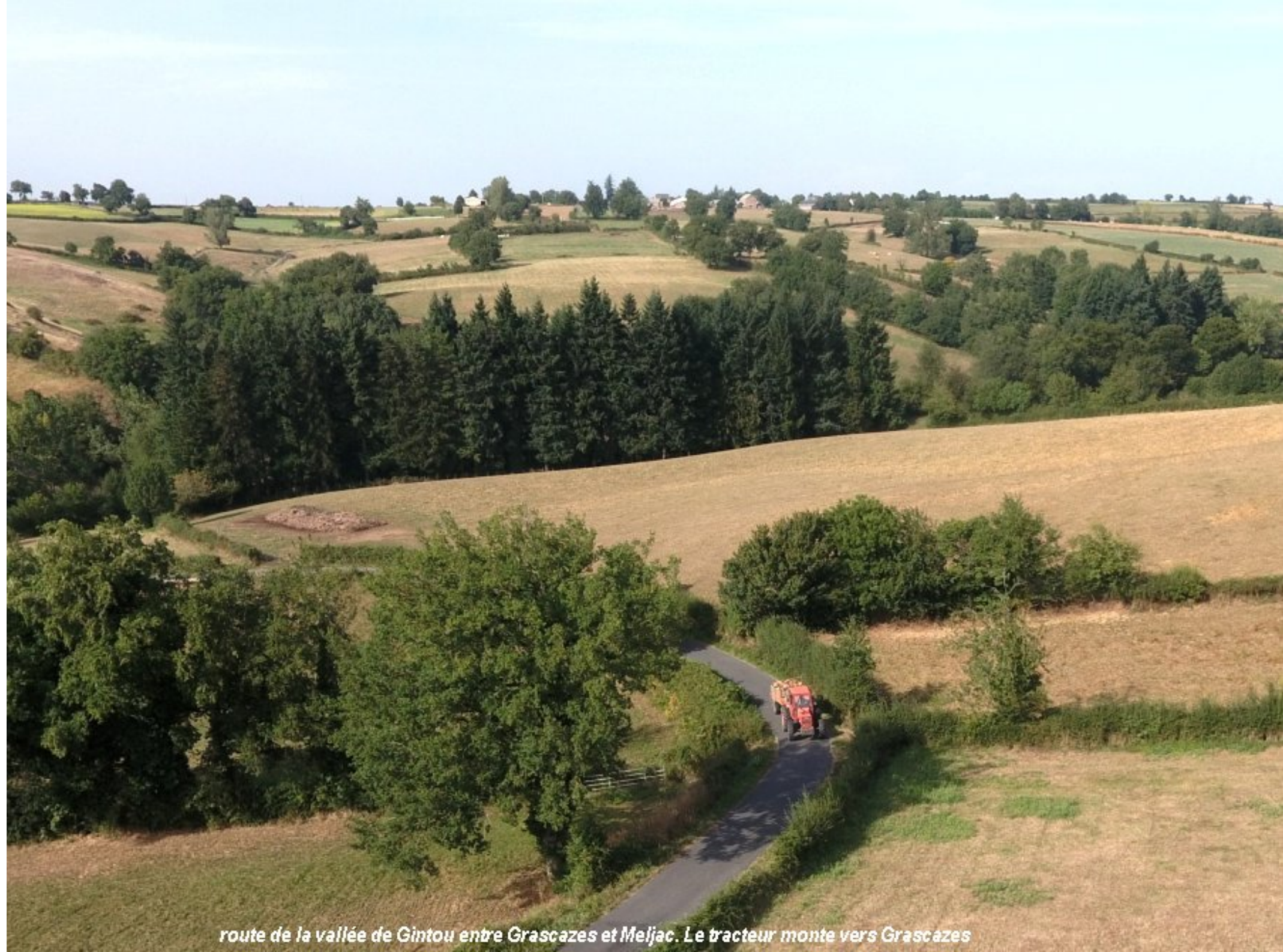
route de la vallée de Gintou entre Grascazes et Meljac. Le tracteur monte vers Grascazes