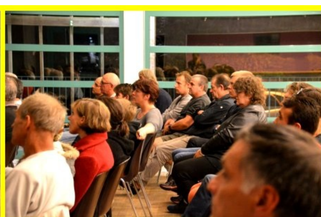
19 octobre 2018 - Soirée d'automne Meljac.Net