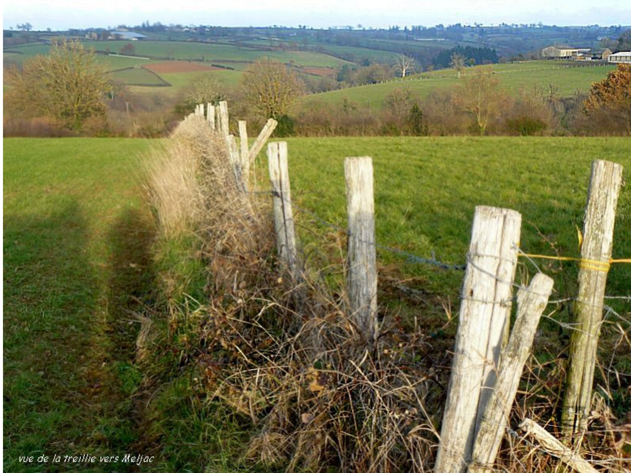
vue de la treillie vers Meljac