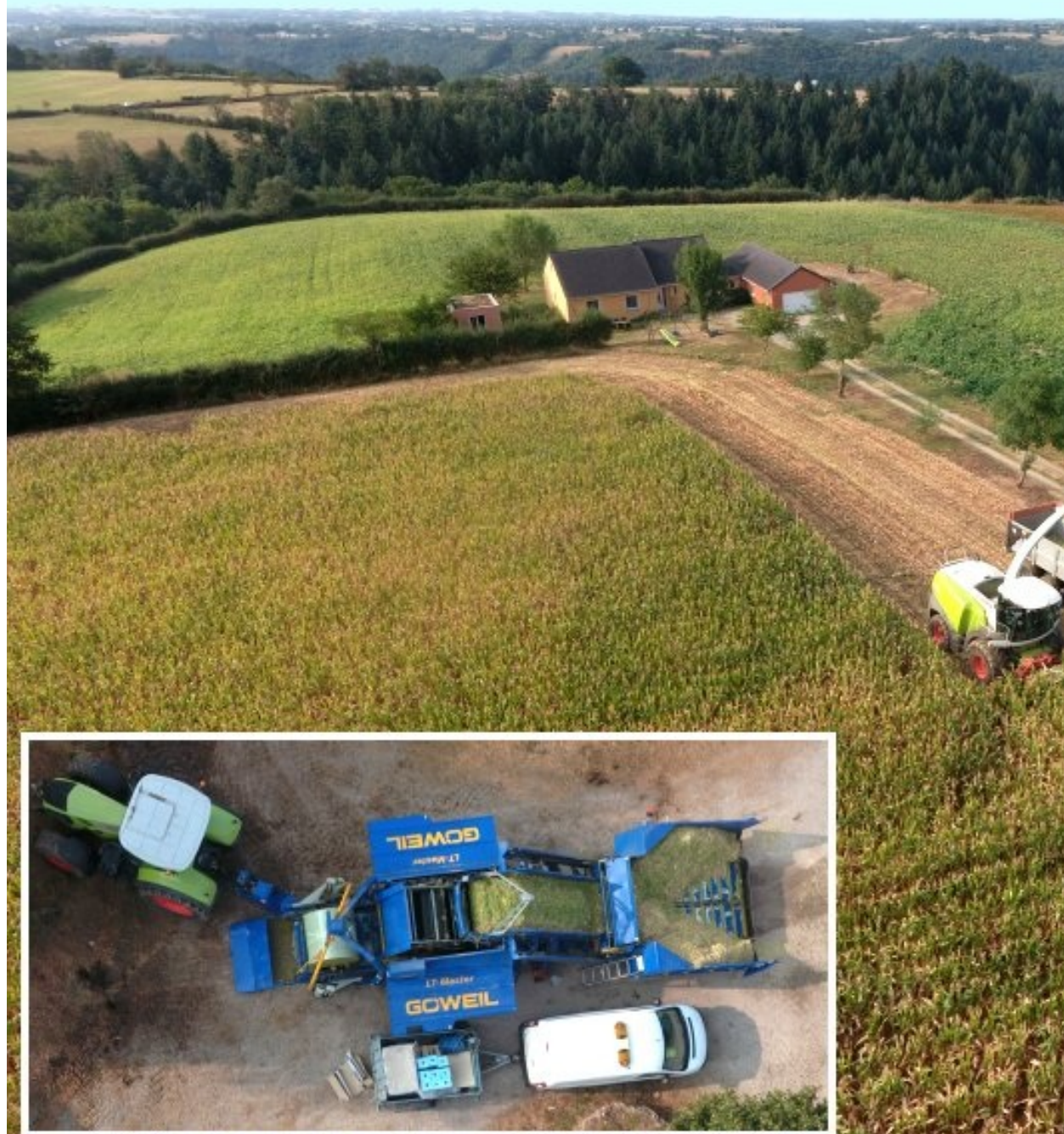
ensilage au Cluzel de Meljac - Photo 29 août 2023