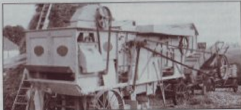
■ une machine rutilante