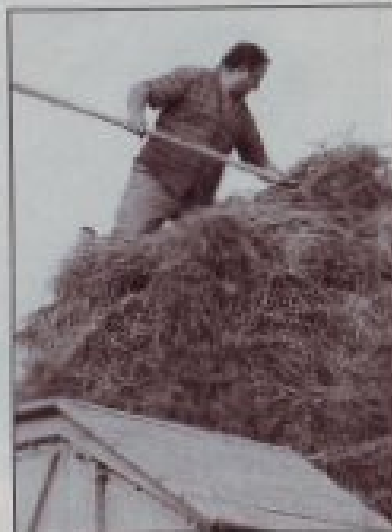
■ premières gerbes