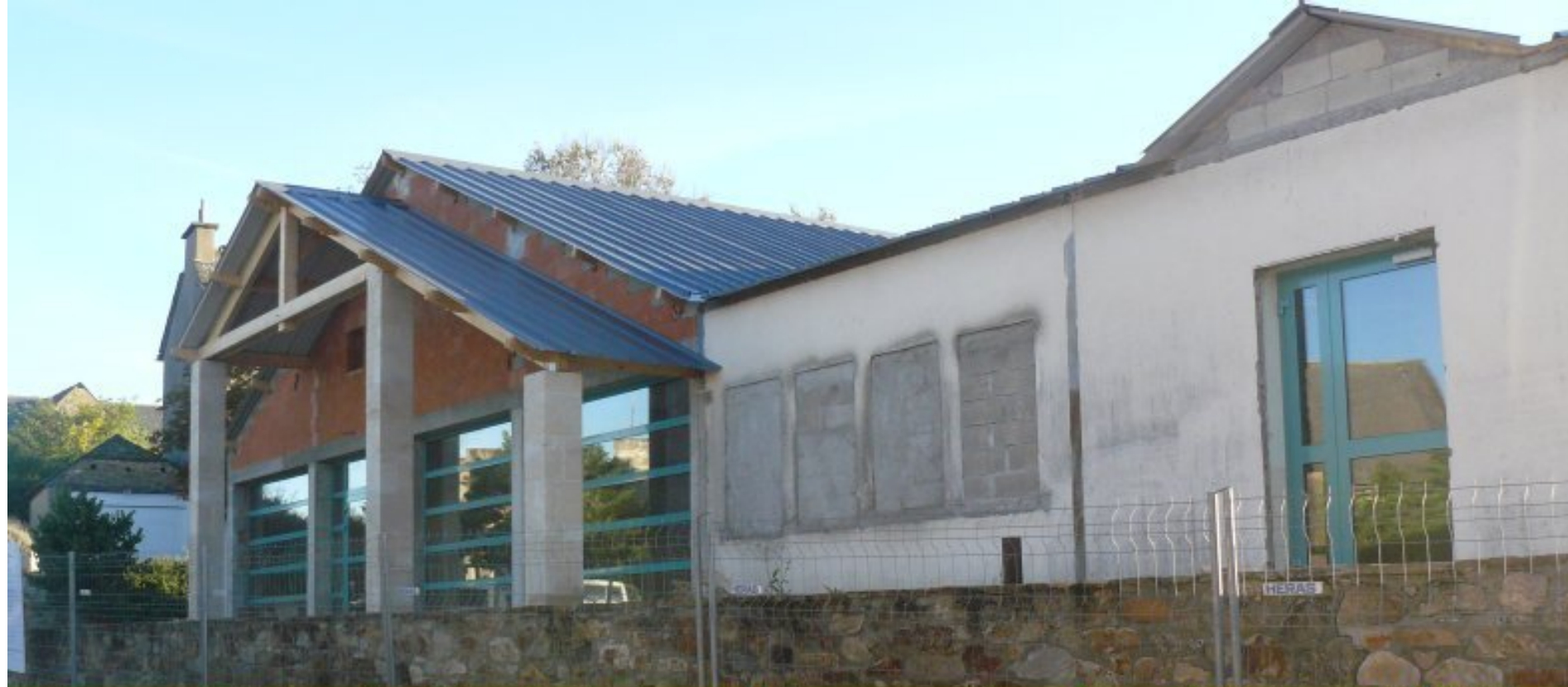
Les travaux de rénovation de la salle des fêtes de Meljac se poursuivent