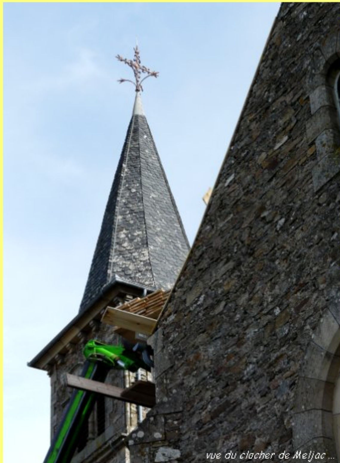
vue du clocher de Meljac ...