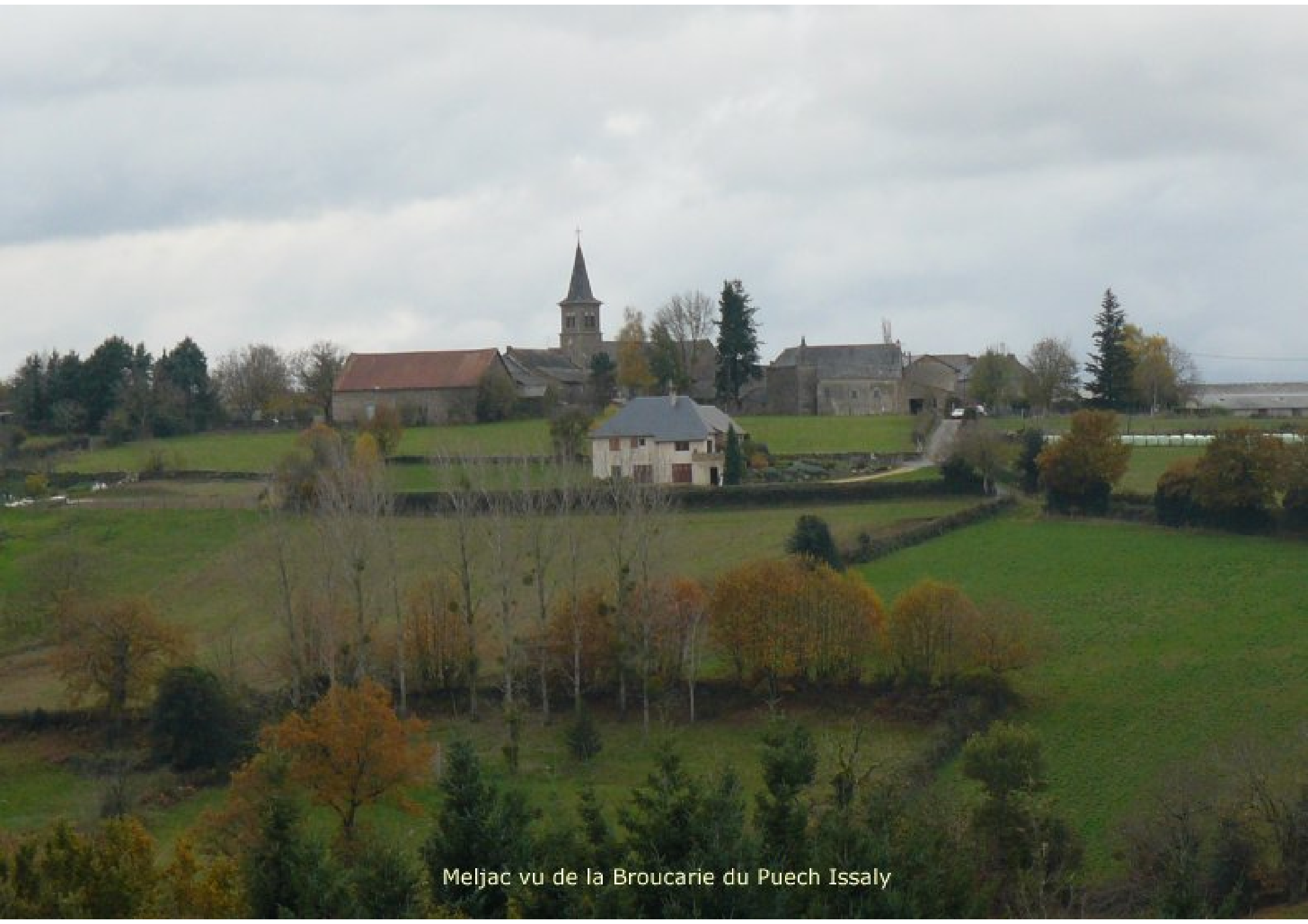
Meljac vu de la Broucarie du Puech Issaly