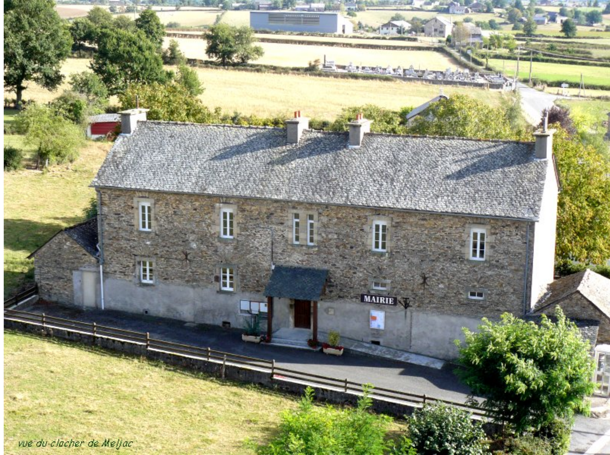
vue du clacher de Meljac