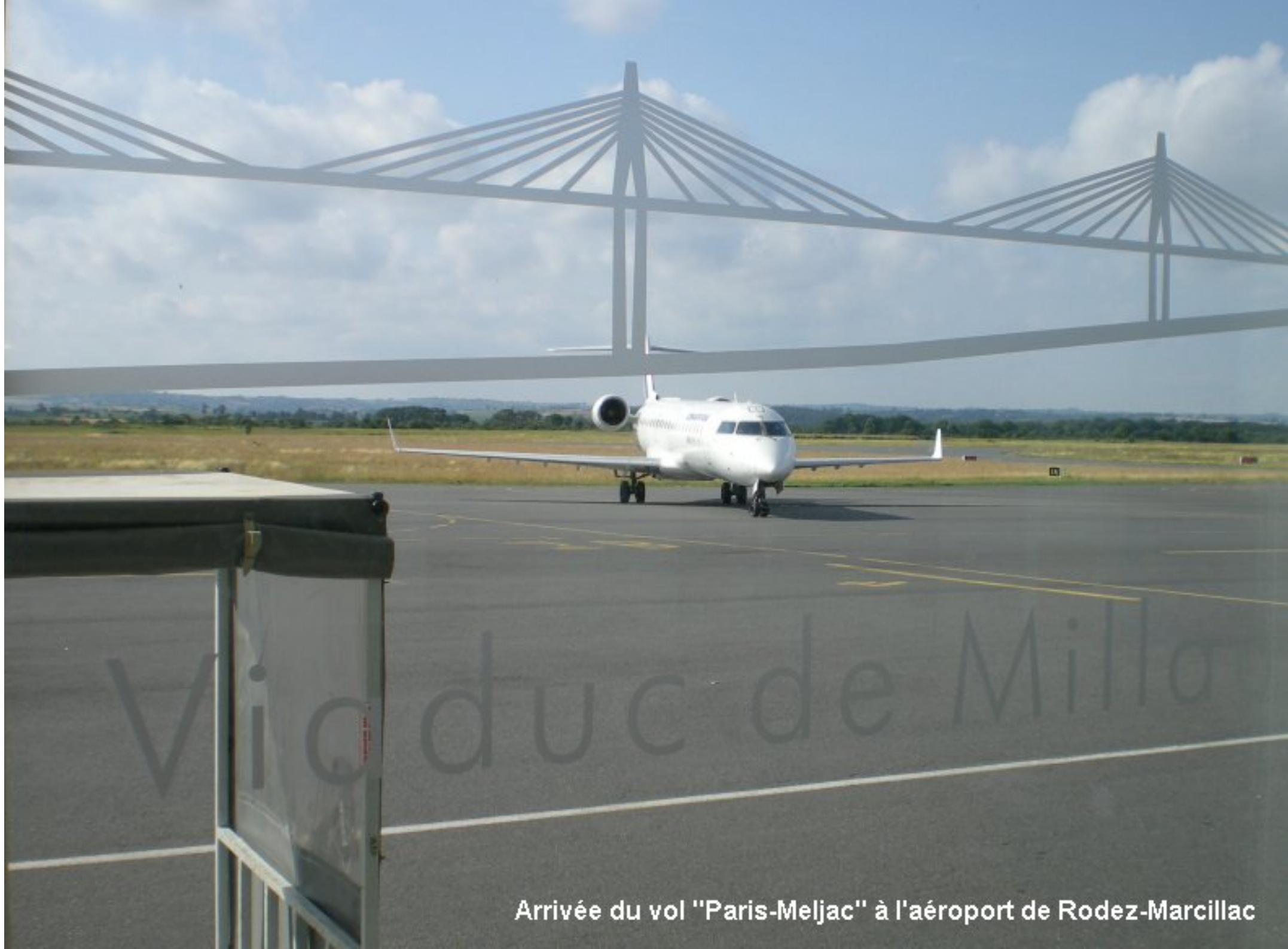
Arrivée du vol "Paris-Meljac" à l'aéroport de Rodez-Marcillac