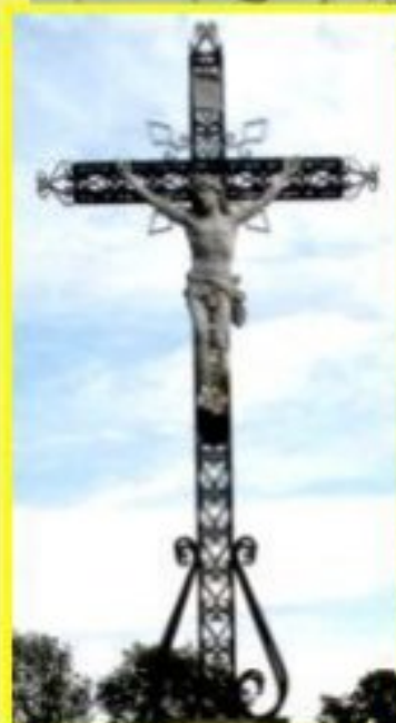
Croix du Jubilé de 1966