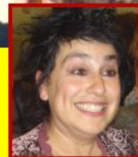
Salle des fêtes de Meljac - 21octobre 2010