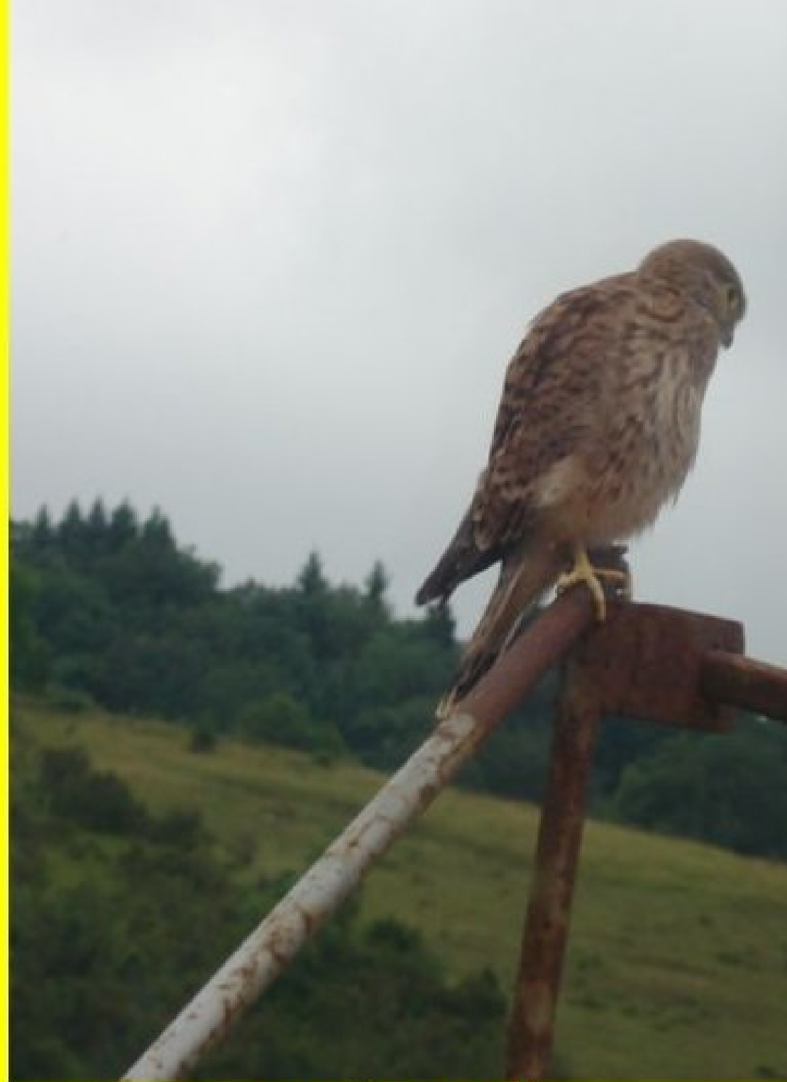
jeunes faucons "squatters" de pigeonnier... et premières sorties...