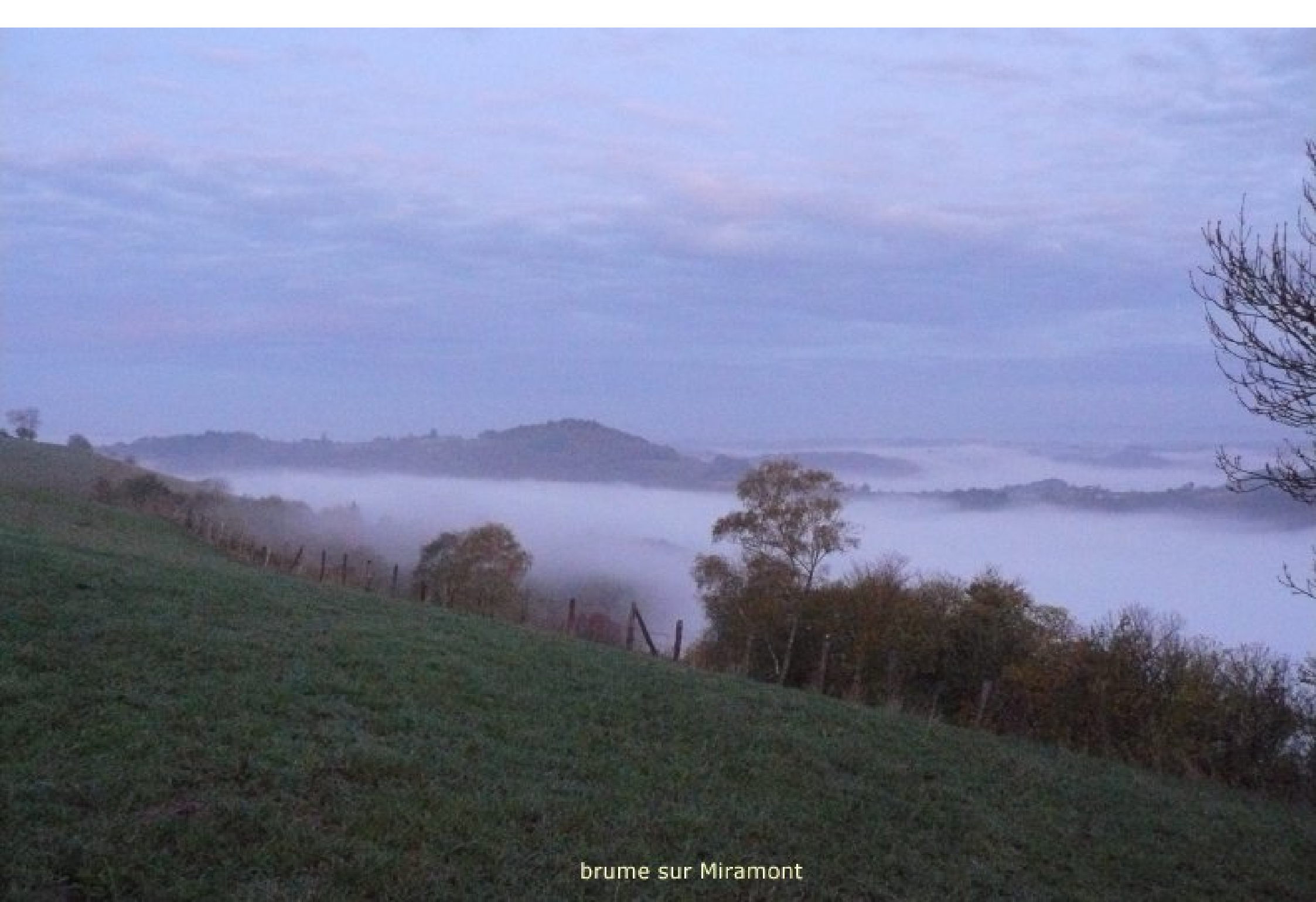
brume sur Miramont