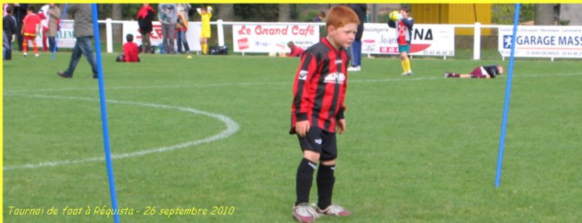
Tournai de foot à Réquista - 26 septembre 2010