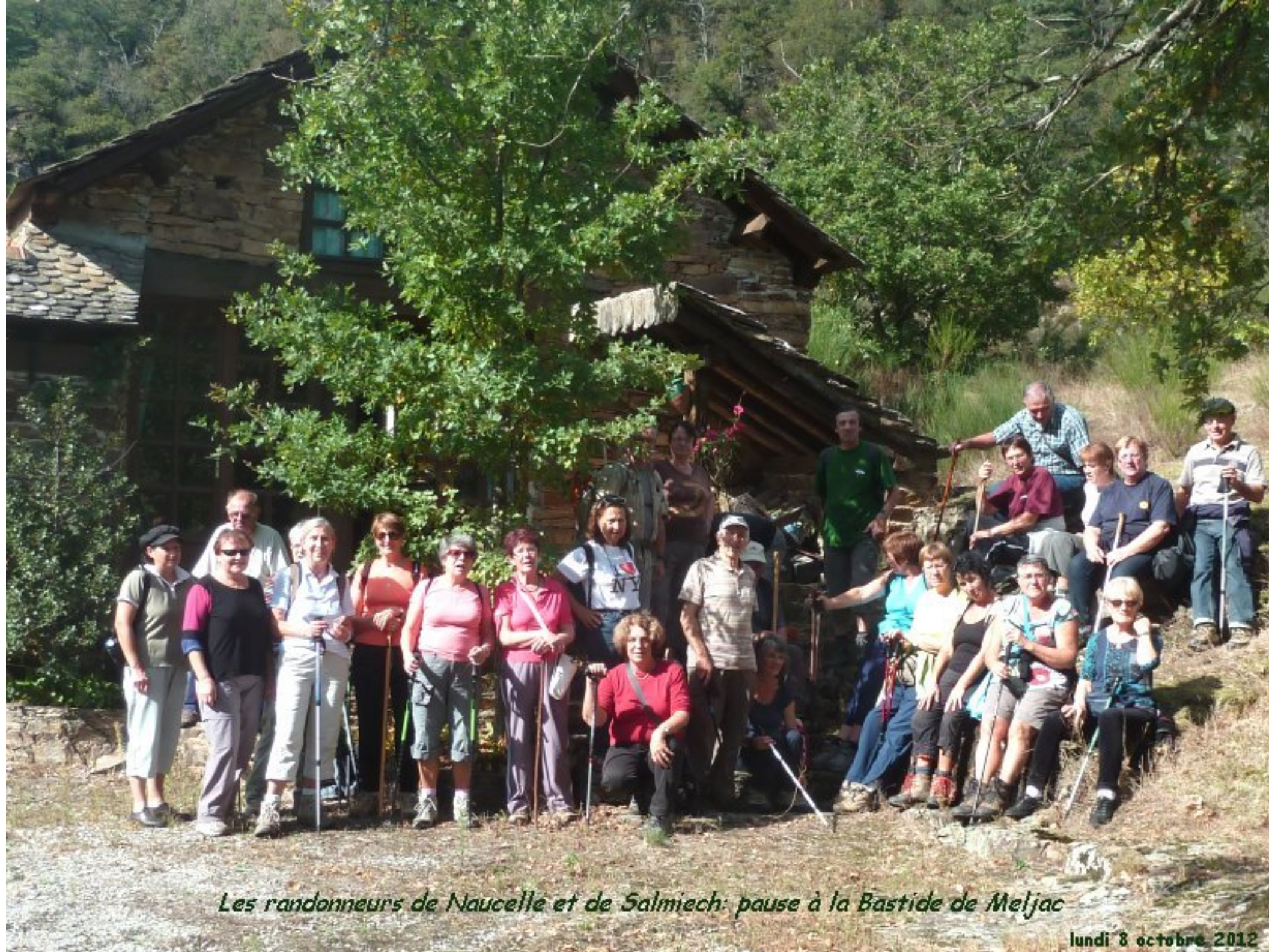
Les randonneurs de Naucelle et de Salmiech: pause à la Bastide de Meljac