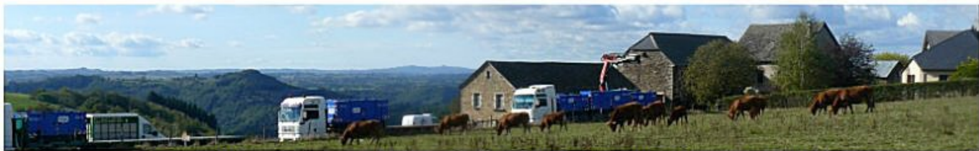
Travaux EDF - Meljac lundi 15 octobre 2012 : les équipes ERDF "remballent" les matériels installés un peu partout sur la commune pour assurer l'alimentation électrique du village pendant la durée des travaux.