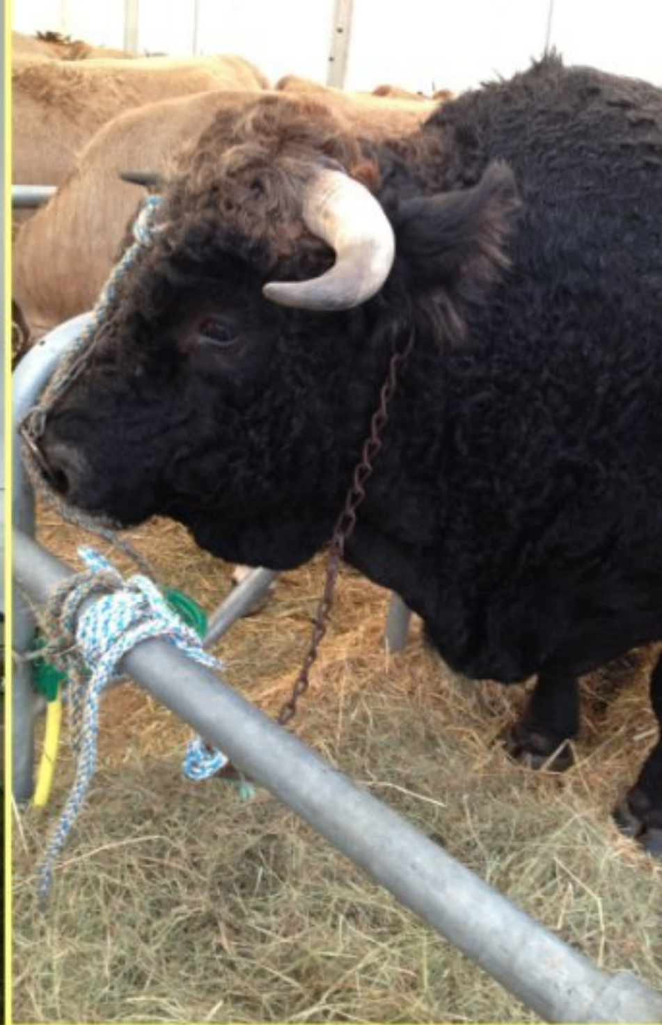
Concours de la race d'Aubrac - Laguiole 12 & 13 octobre 2012