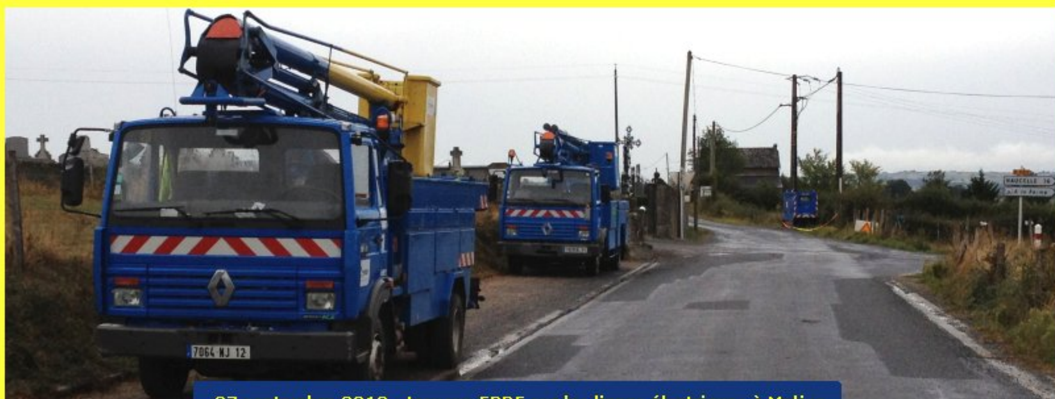
27 septembre 2012 - travaux ERDF sur les lignes électriques à Meljac