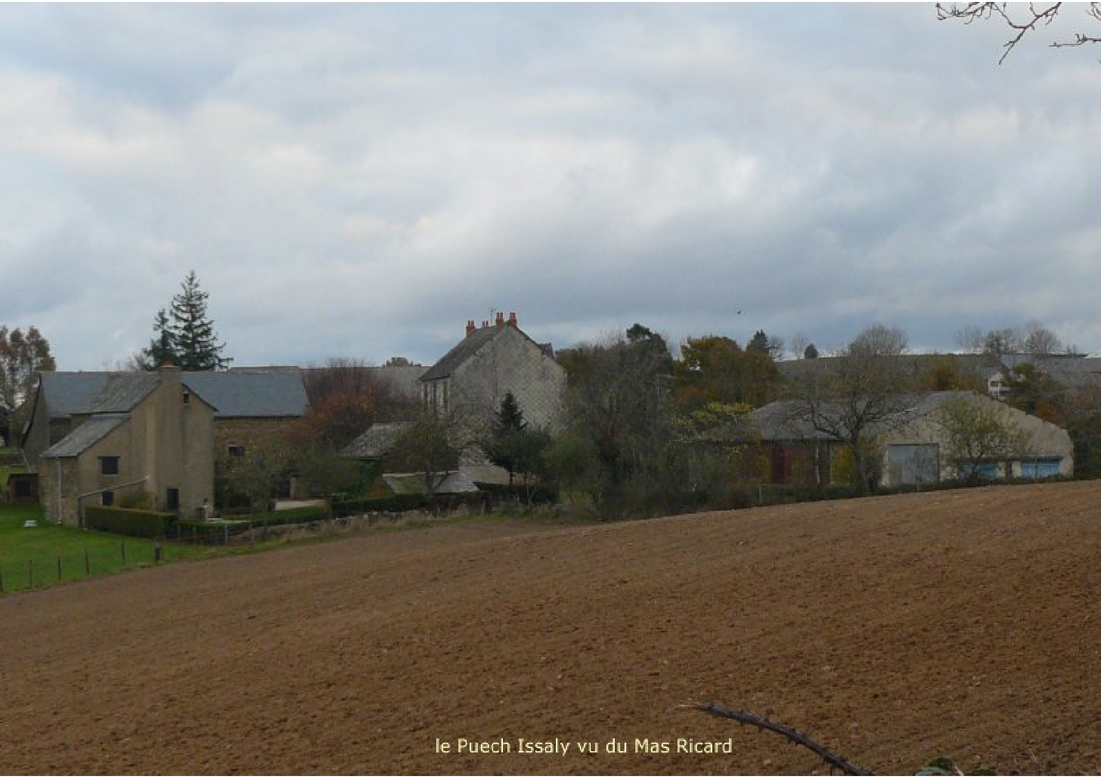
le Puech Issaly vu du Mas Ricard