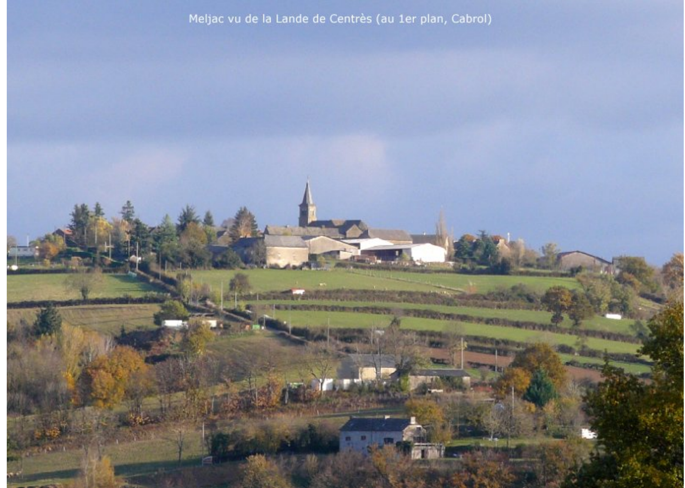
Meljac vu de la Lande de Centrès (au 1er plan, Cabrol)