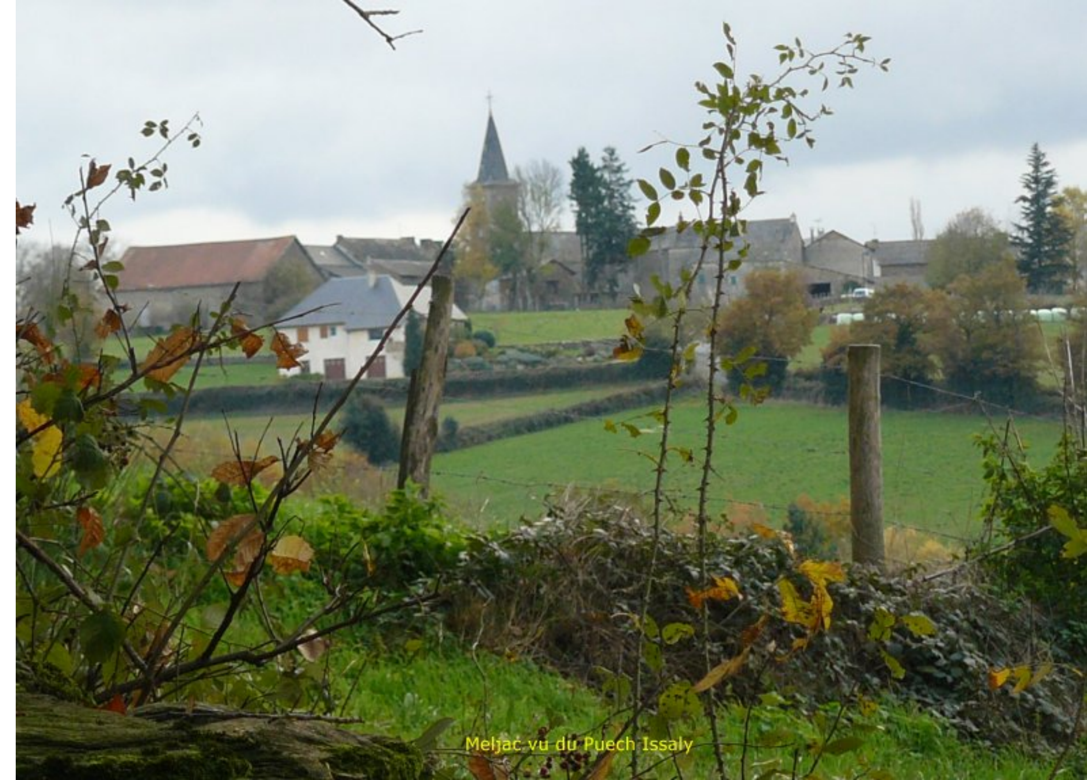
Meljac vu du Puech Issaly