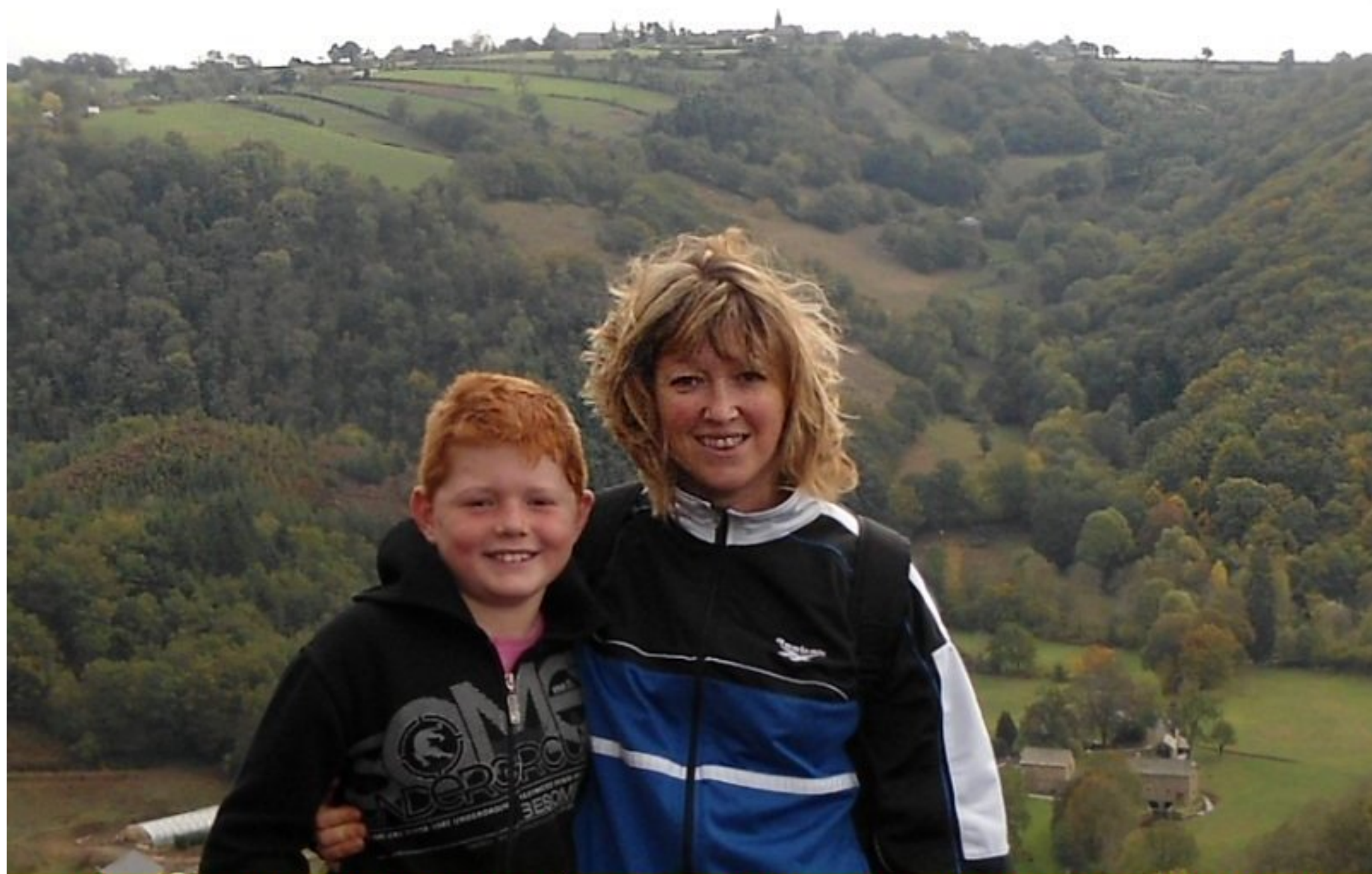
A l'horizon le village de Meljac vu de Centrès par des meljacois qui "randonnent" avec les "caminaïres" de Centrès