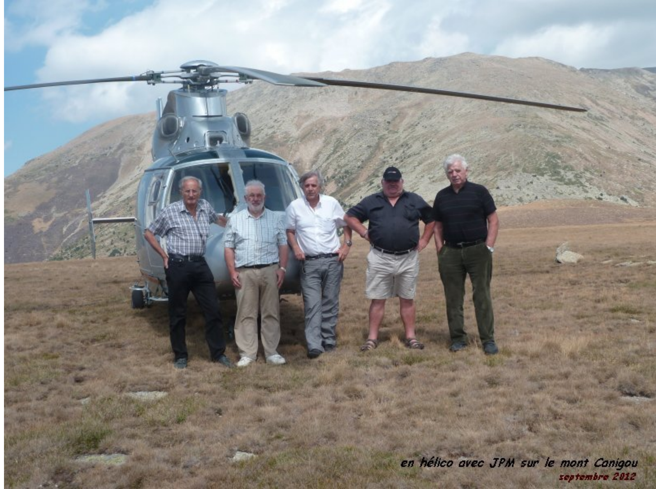
en hélico avec JPM sur le mont Canigou septembre 2012