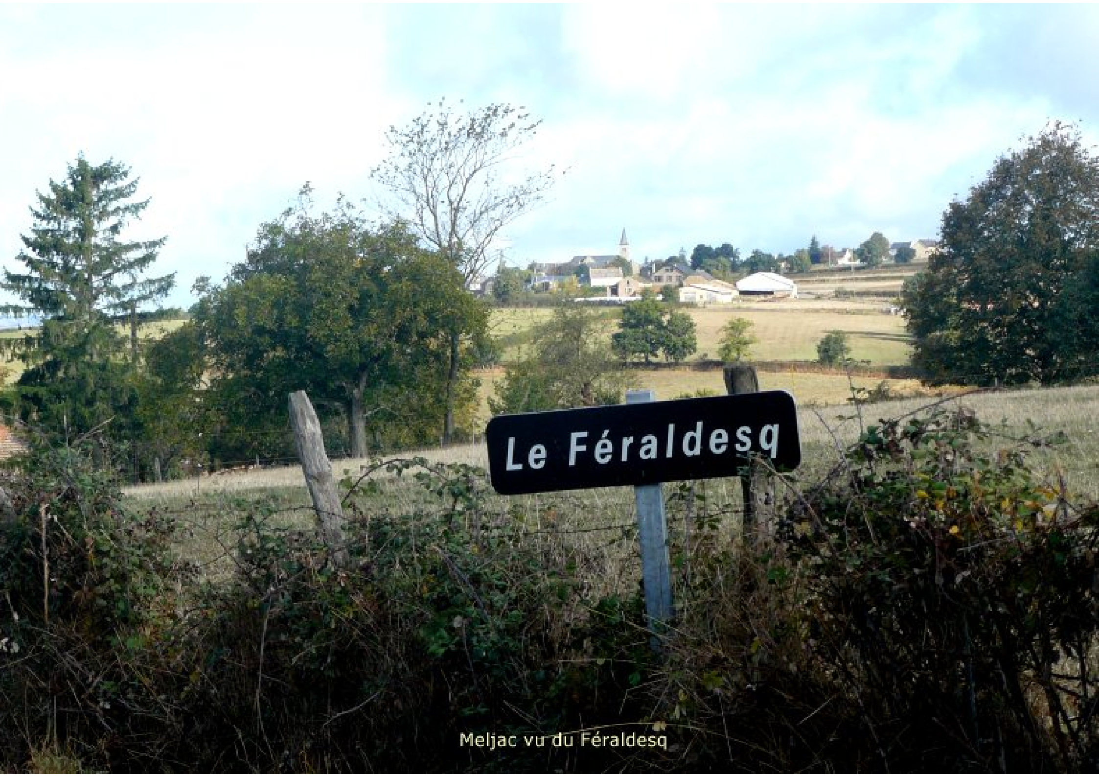
Meljac vu du Féraldesq