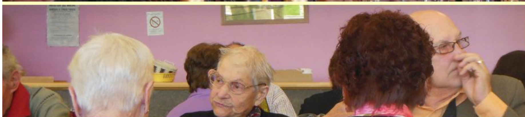
Les Aînés de Meljac-La Selve à Meljac le 17 octobre 2013