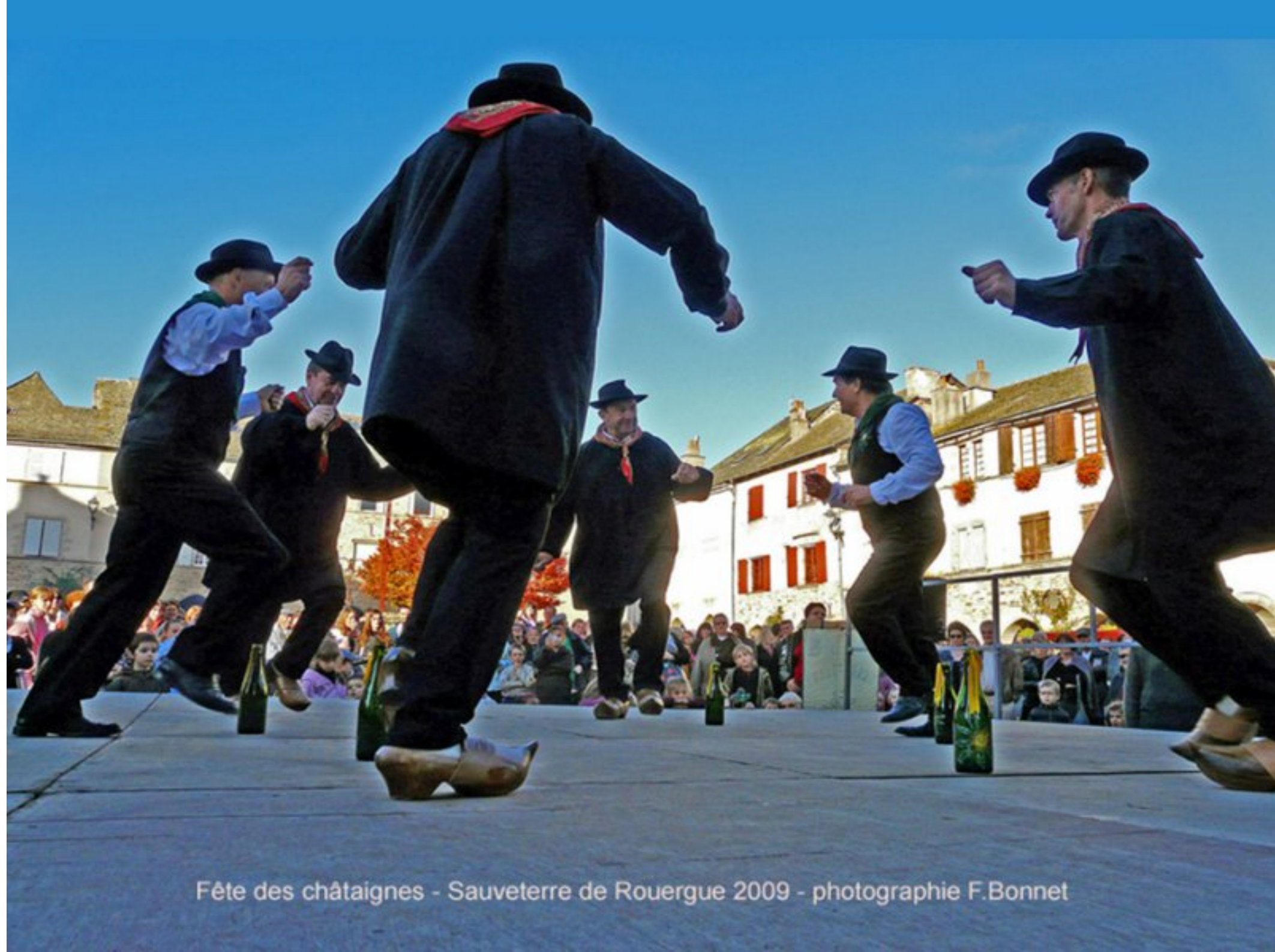
Fête des châtaignes - Sauveterre de Rouergue 2009