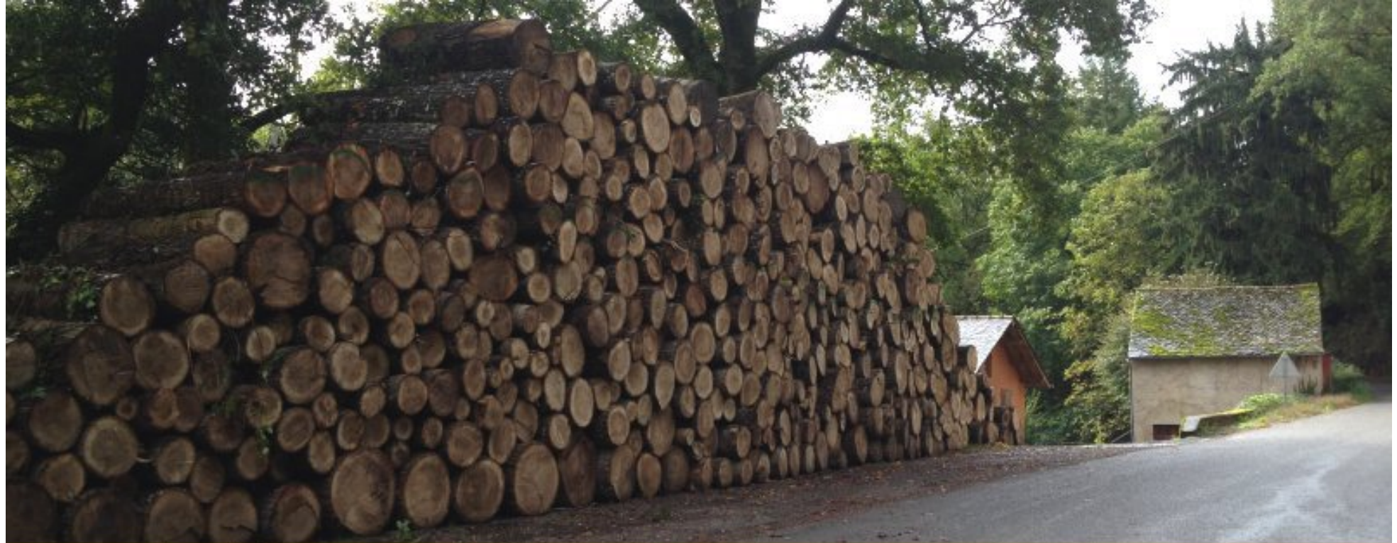
A la Fabrèguerie, sous l'ancien "arbre-orchestre", on stocke... (Photo; 16 octobre 2013)