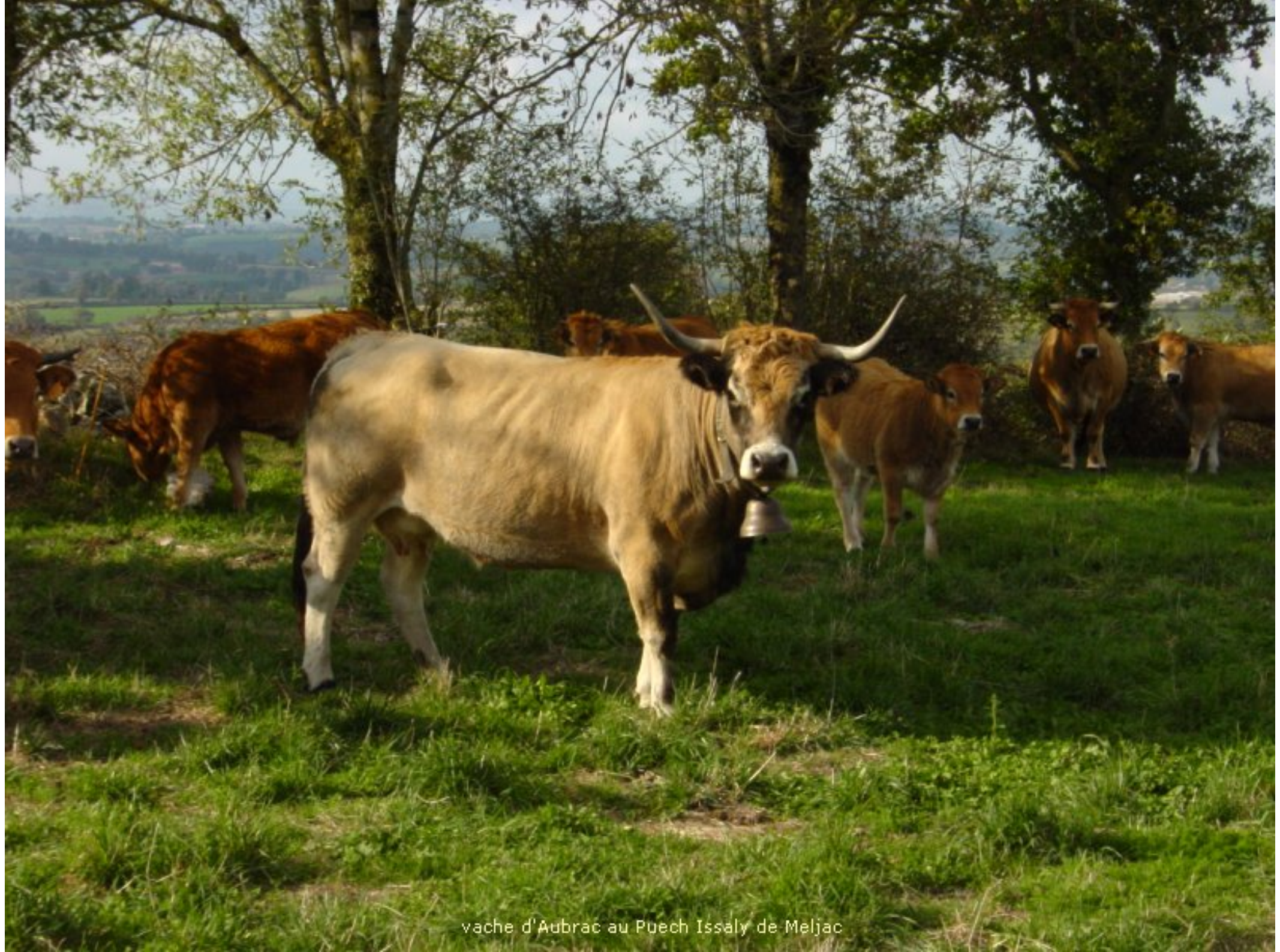
vache d'Aubrac au Puech Issaly de Meljac