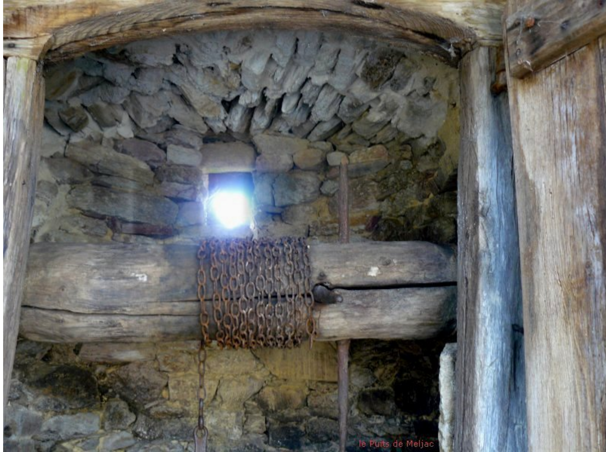
le Puits de Meljac