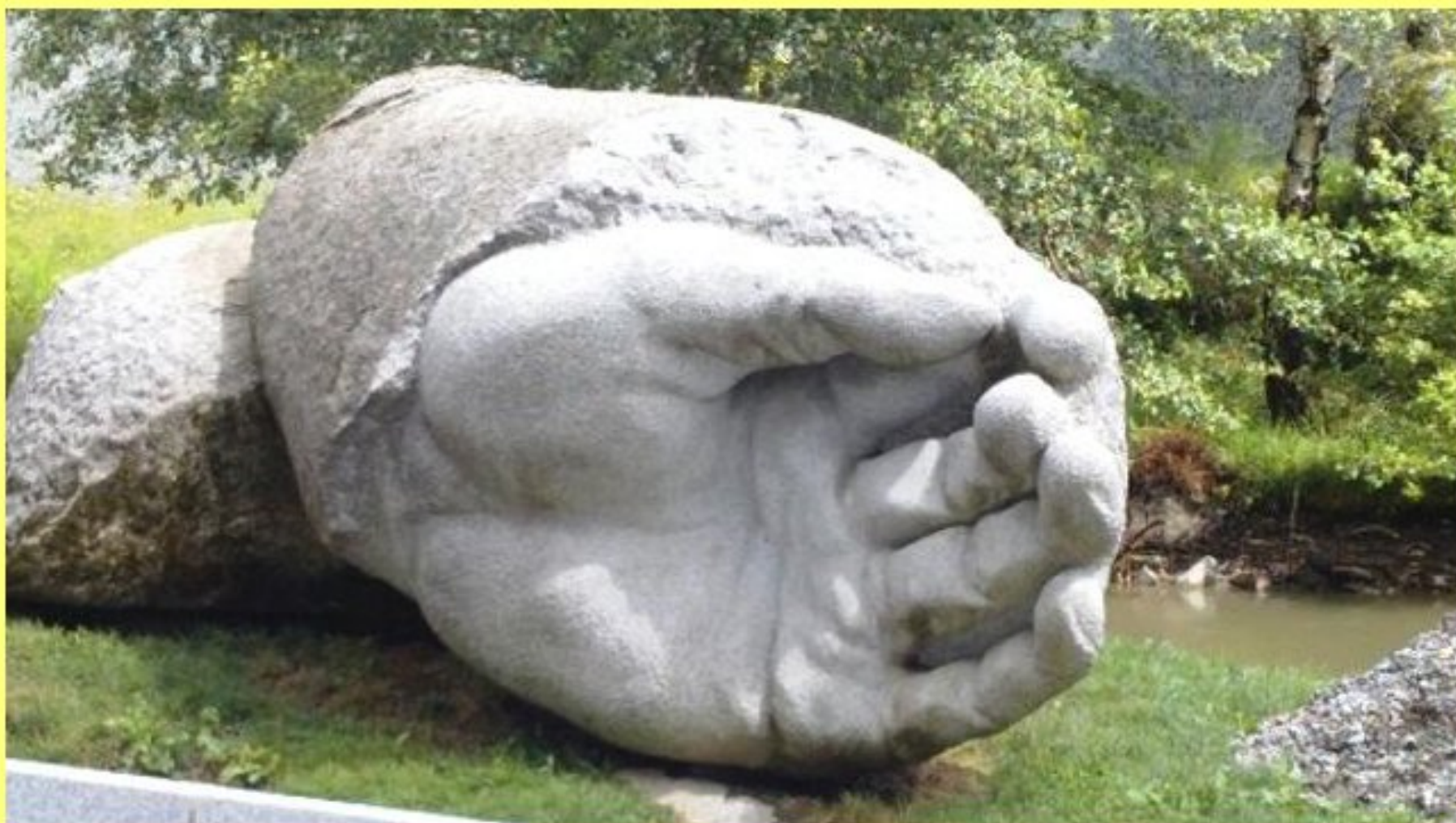
"main tendue" sur le Sidobre