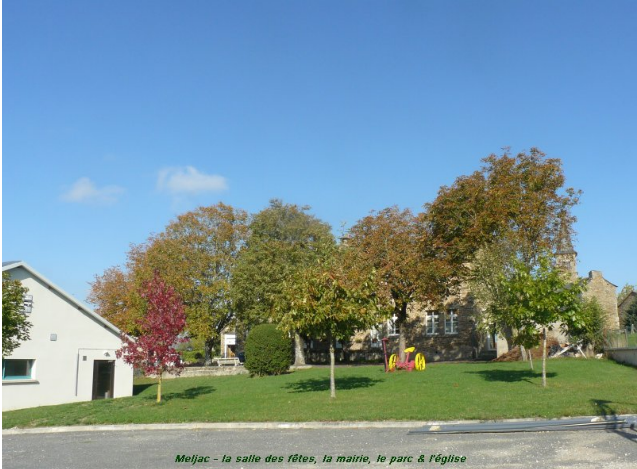
Meljac - la salle des fêtes, la mairie, le parc & l'église