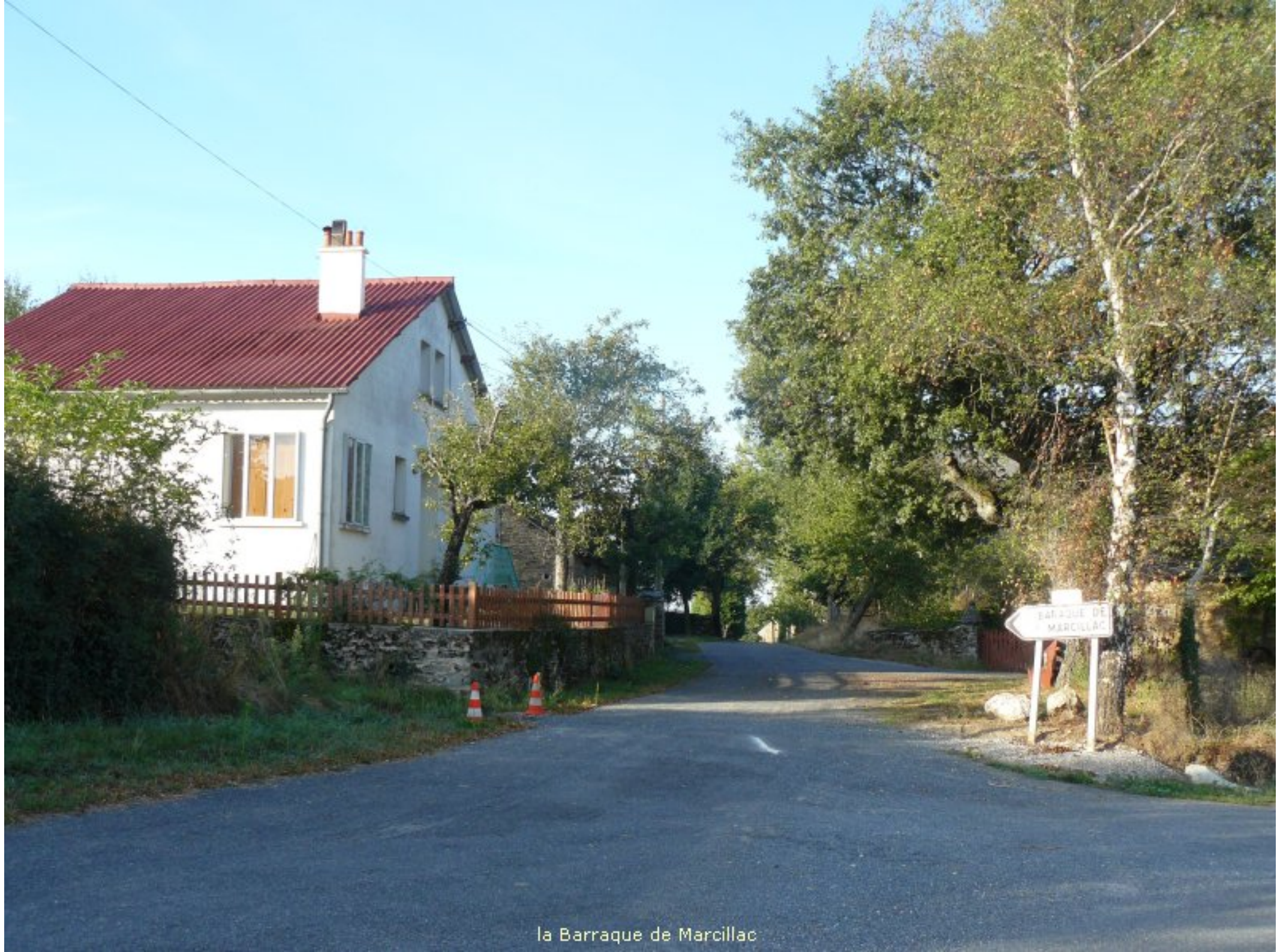
la Barraque de Marcillac