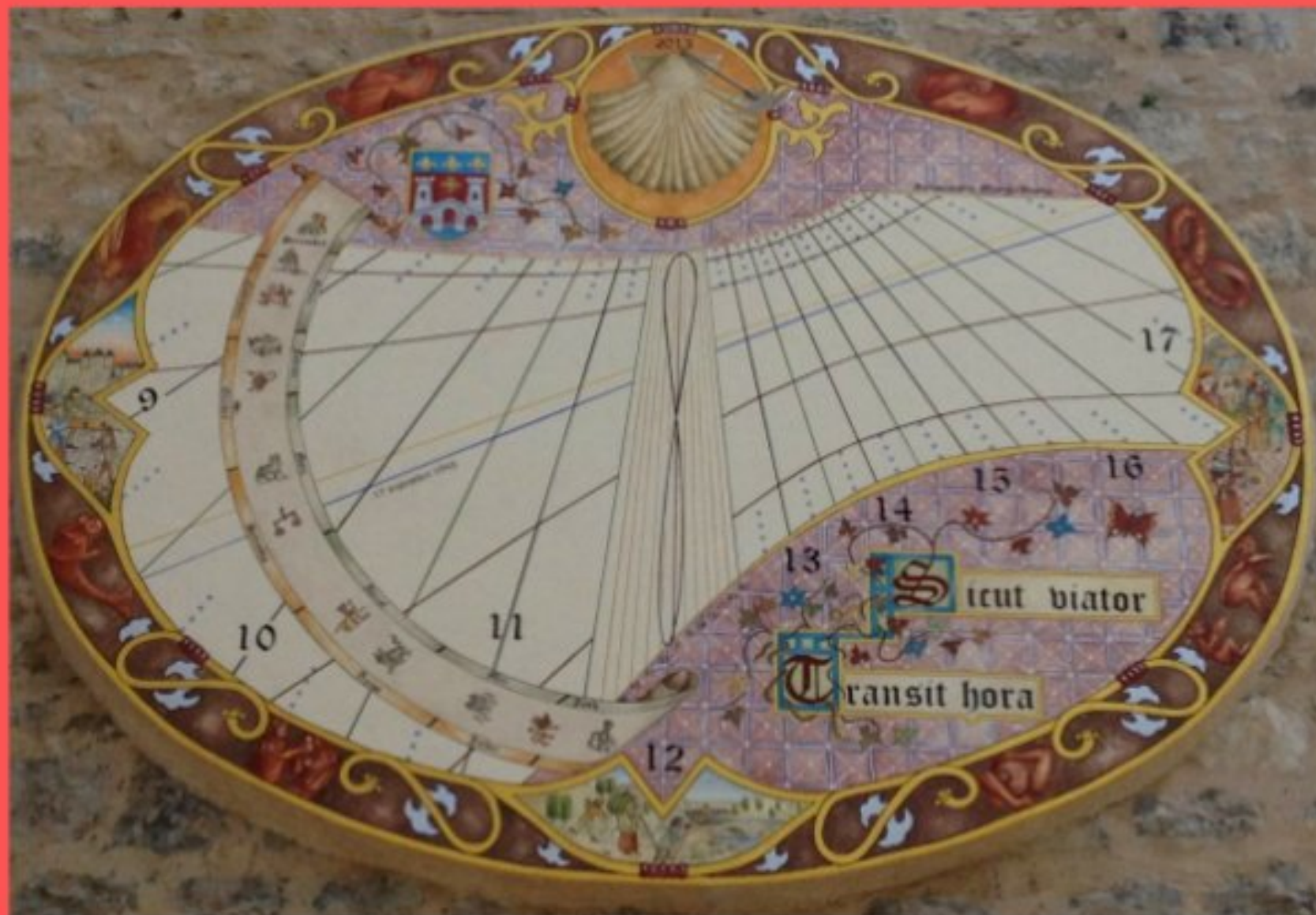
Cadran solaire sur le mur du Languedoc à Villefranche de Rouergue