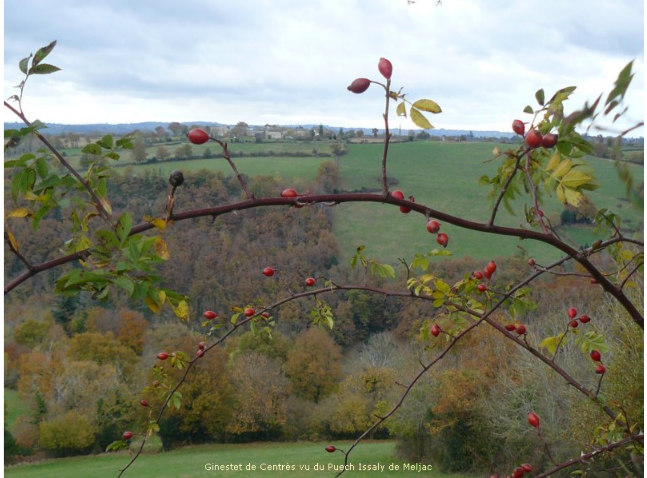
Ginestet de Centrès vu du Puech Issaly de Meljac