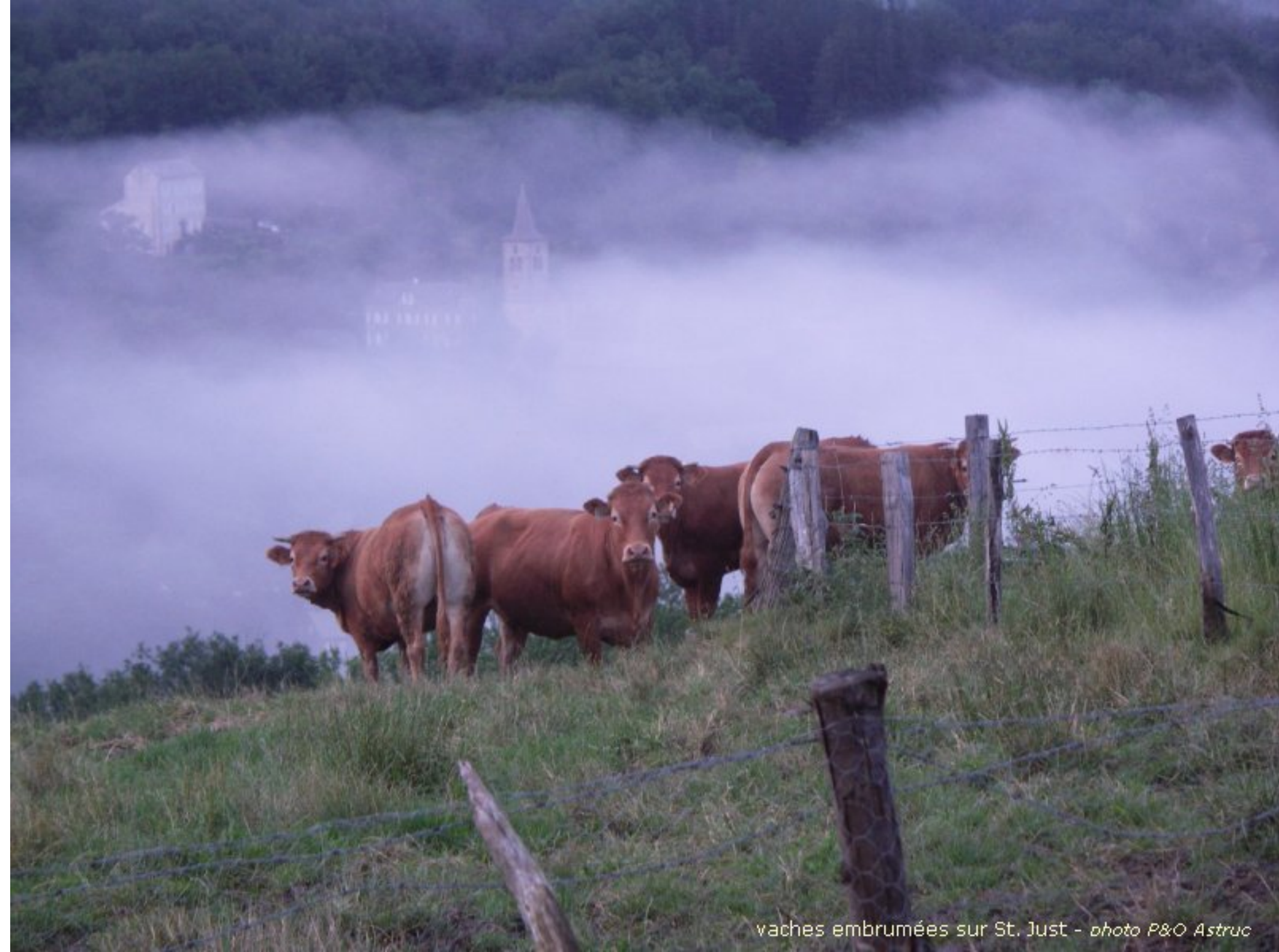
vaches embrumées sur St. Just