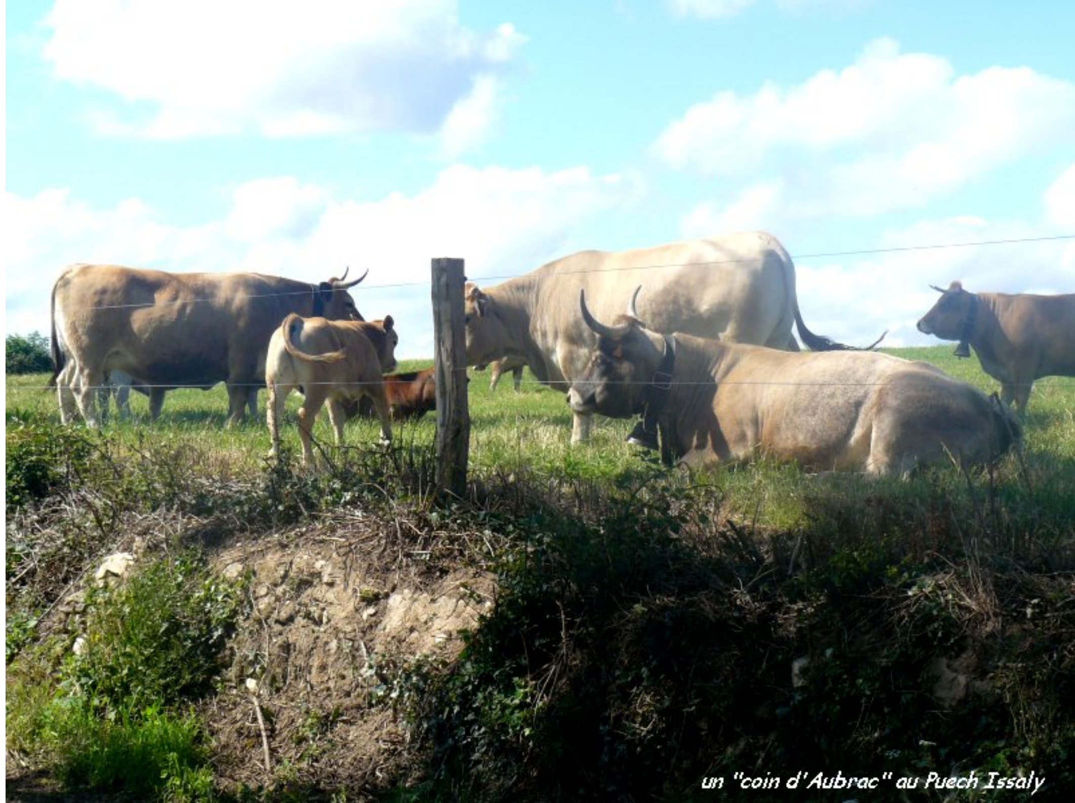
un "coin d'Aubrac" au Puech Issaly