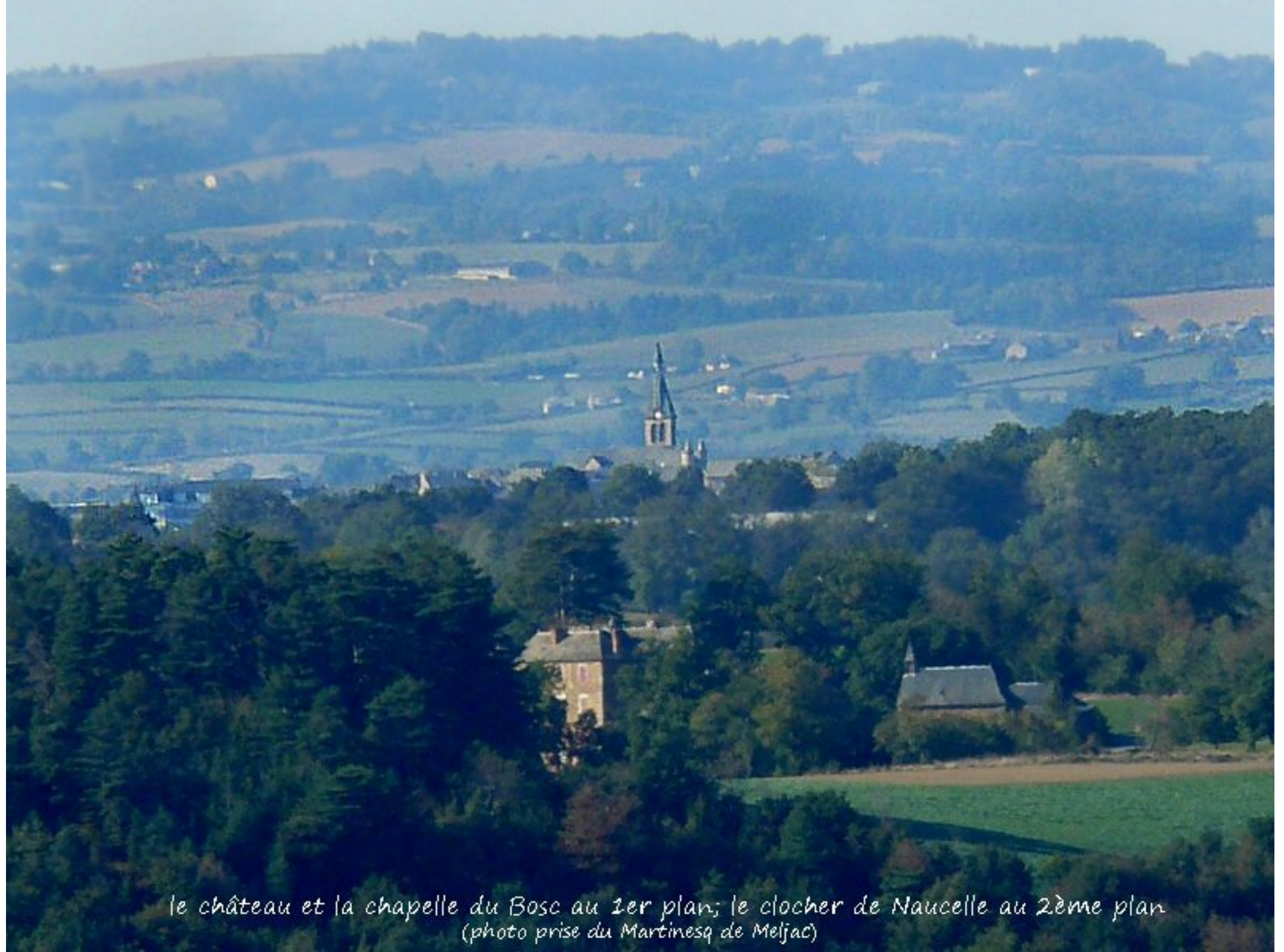
le château et la chapelle du Bosc au 1er plan; le clocher de Naucelle au 2ème plan (photo prise du Martinesq de Meljac)