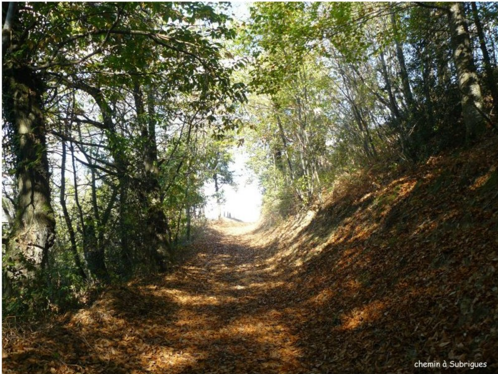
chemin à Subrigues