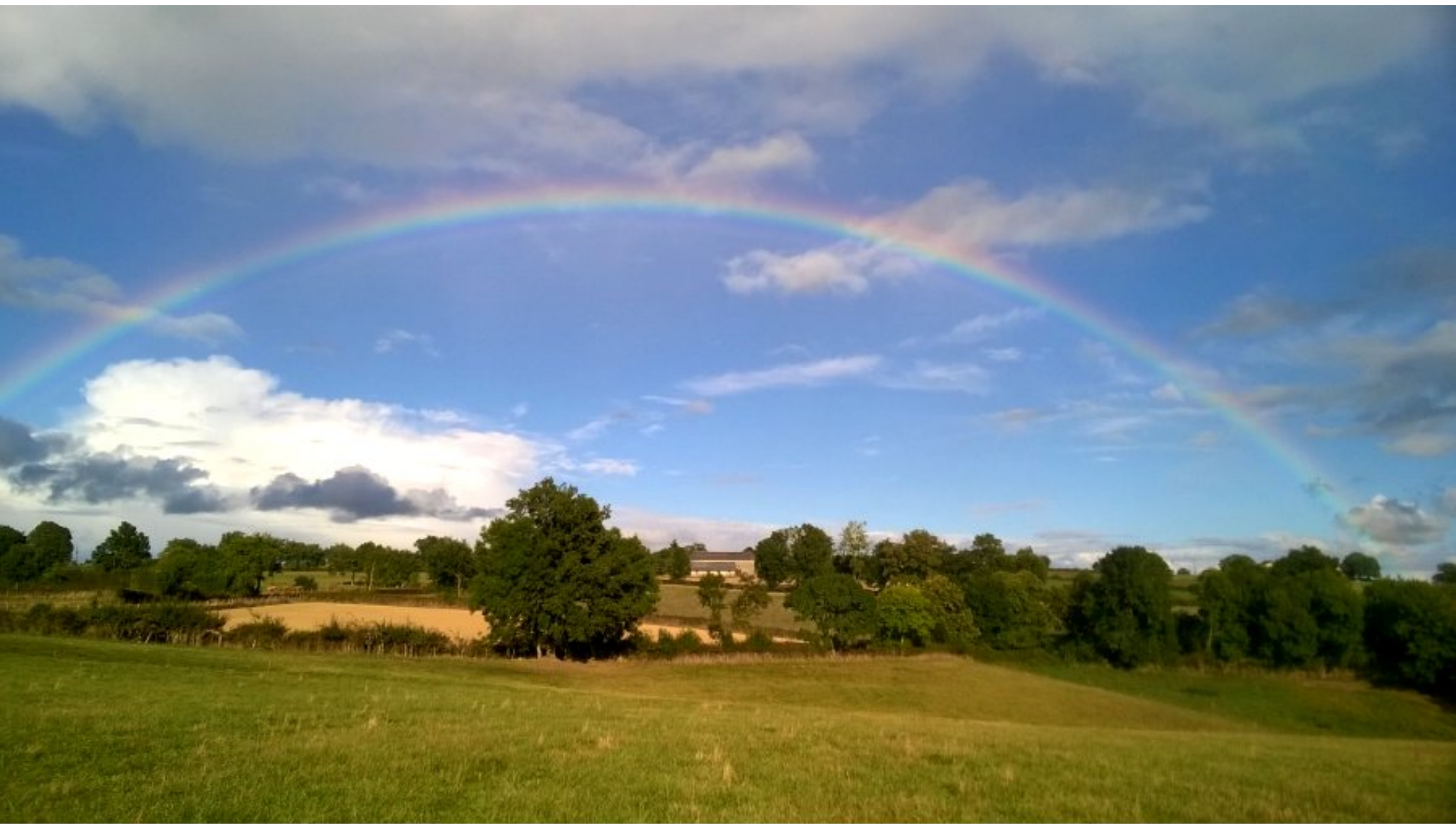
La Barraque de Marcillac vue du Cluzel - Samedi 16 septembre 2017