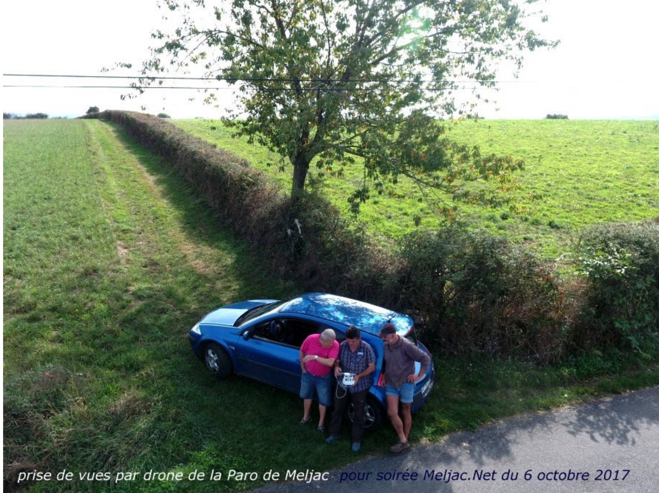
prise de vues par drone de la Paro de Meljac pour soirée Meljac.Net du 6 octobre 2017