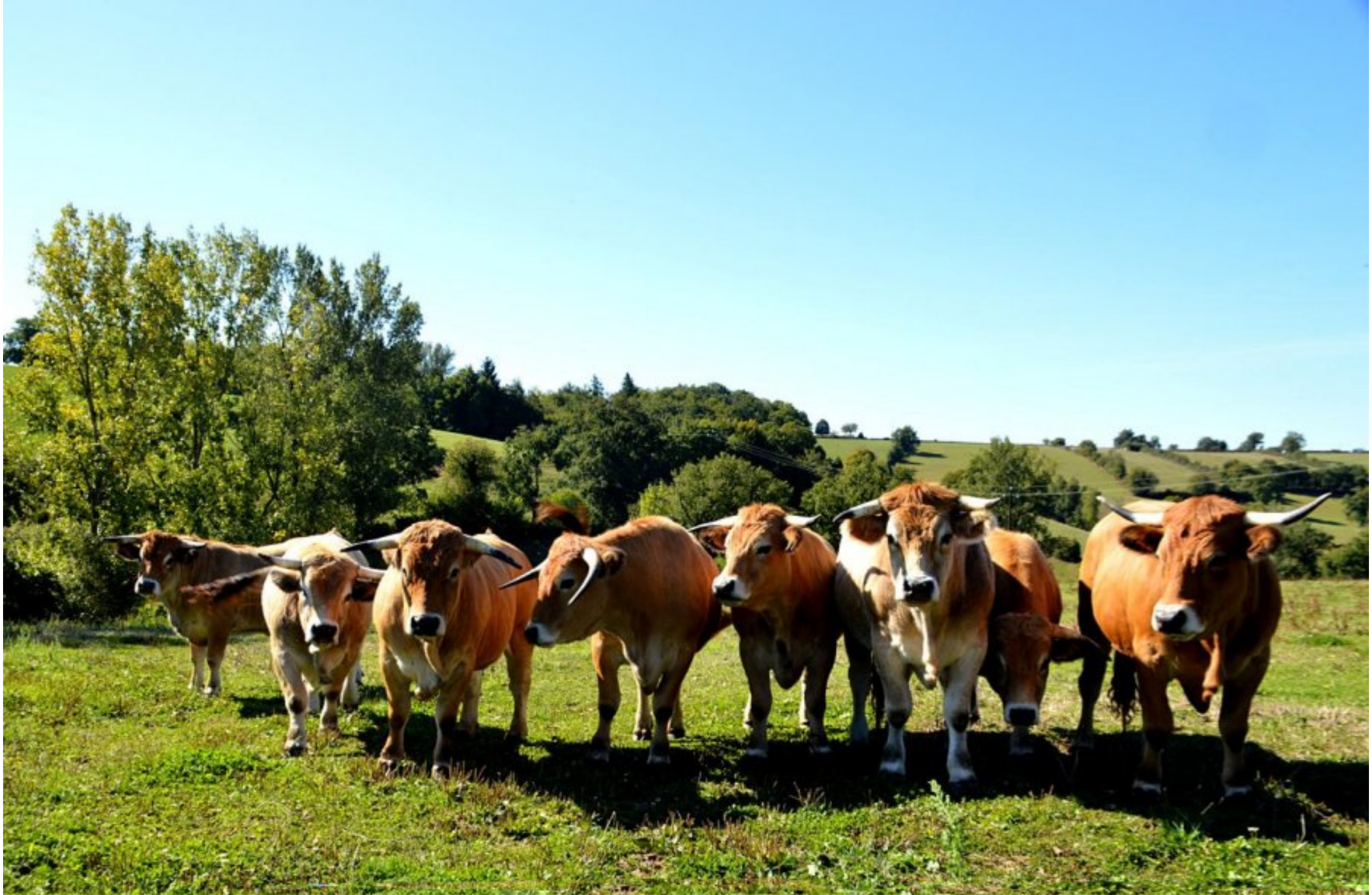
Belle "brochette": ce sont les boeufs élevés au Puech Issaly de Meljac pour le prochain concours de Baraqueville