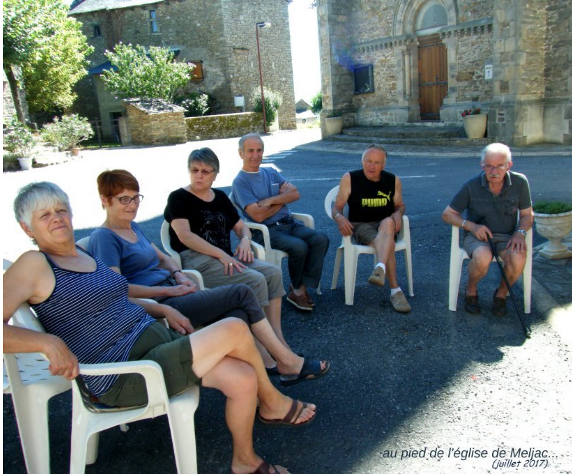
au pied de l'église de Meljac... (juillet 2017)