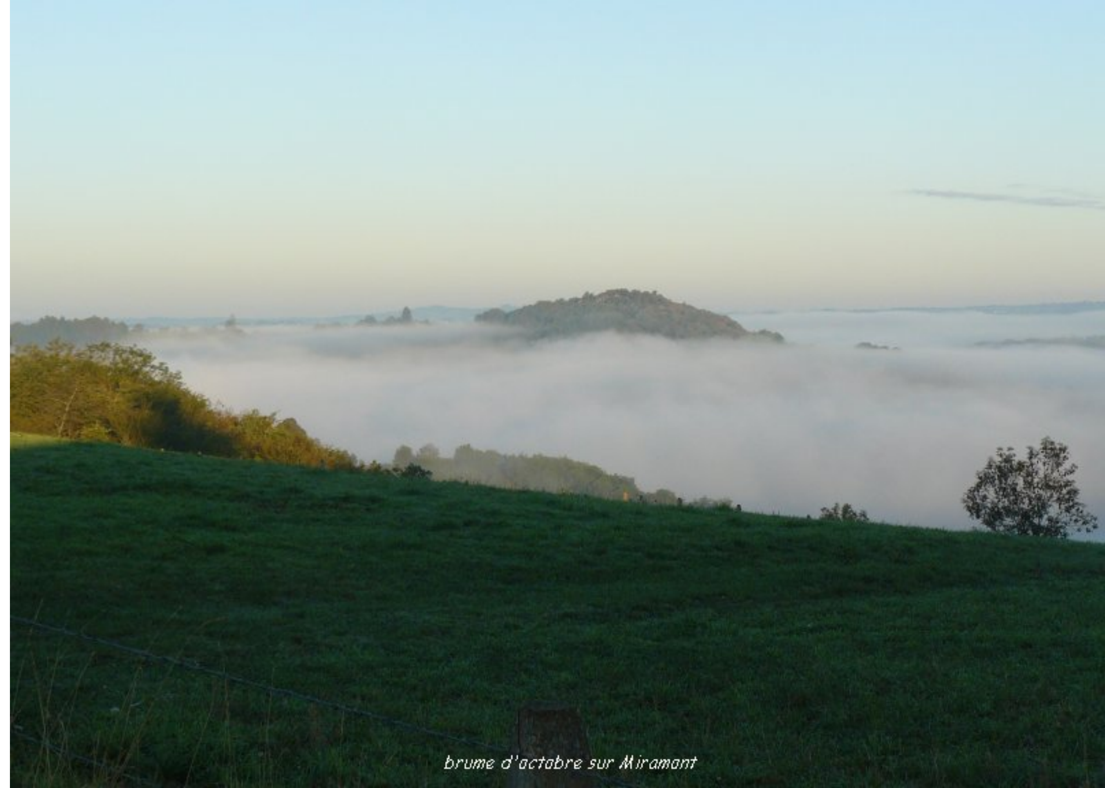
brume d'octobre sur Miramont