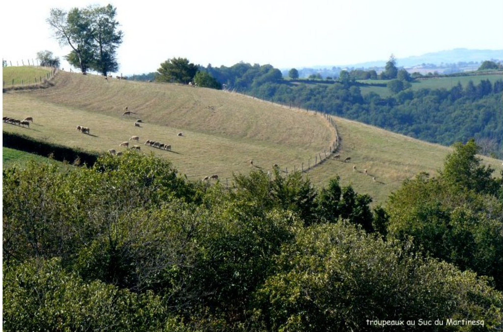
troupeaux au Suc du Martinesq