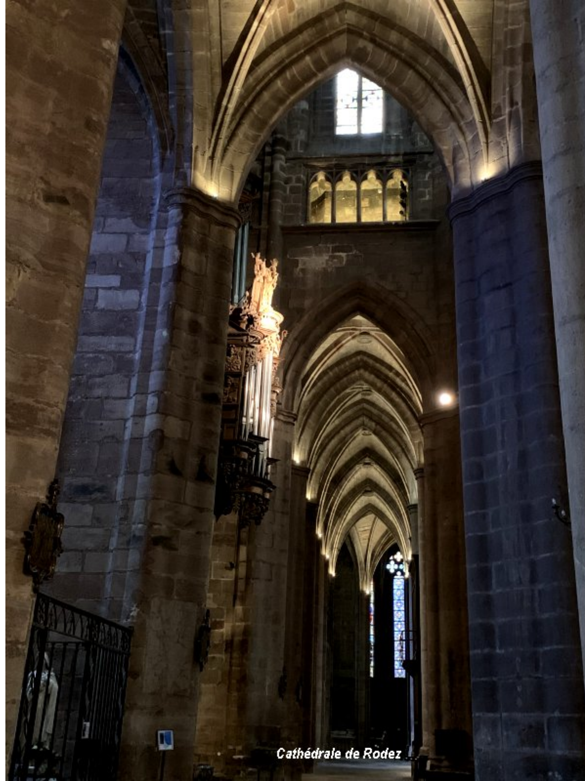
Cathédrale de Rodez