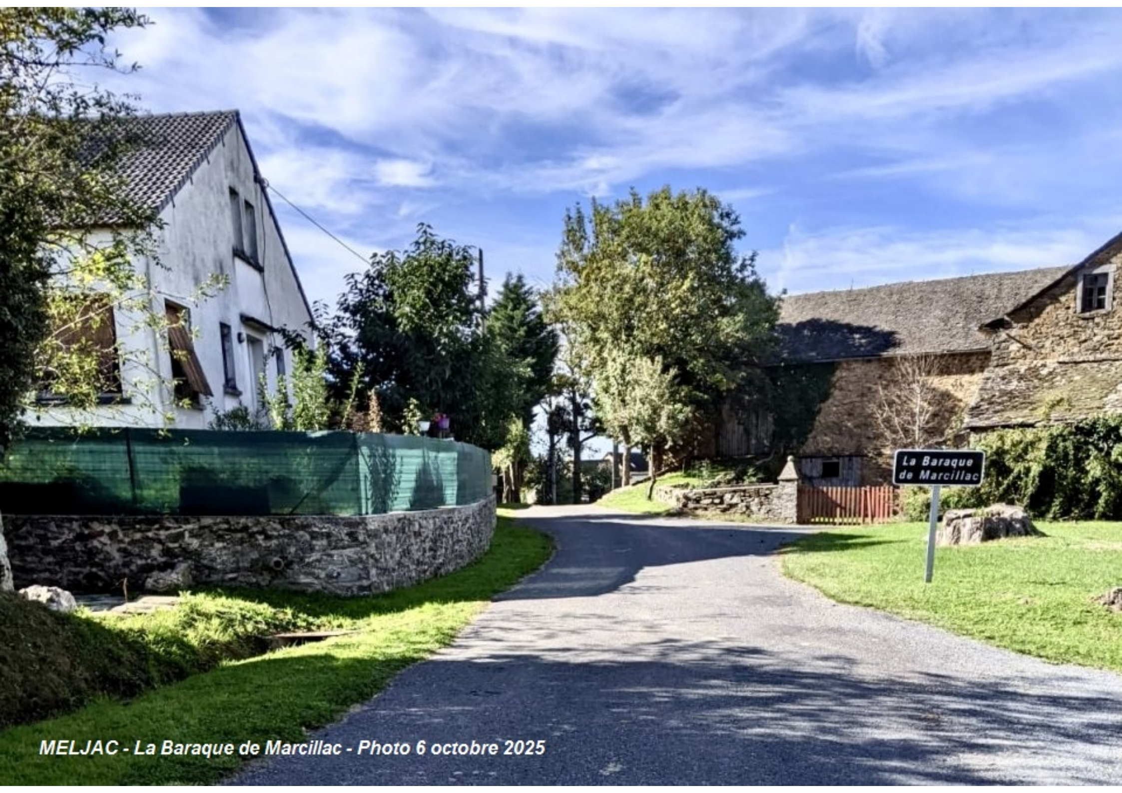
MELJAC - La Baraque de Marcillac - Photo 6 octobre 2025