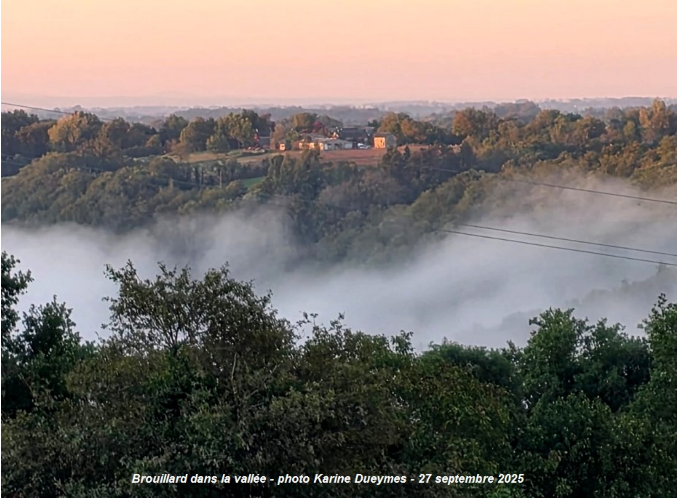
Brouillard dans la vallée - photo Karine Dueymes - 27 septembre 2025