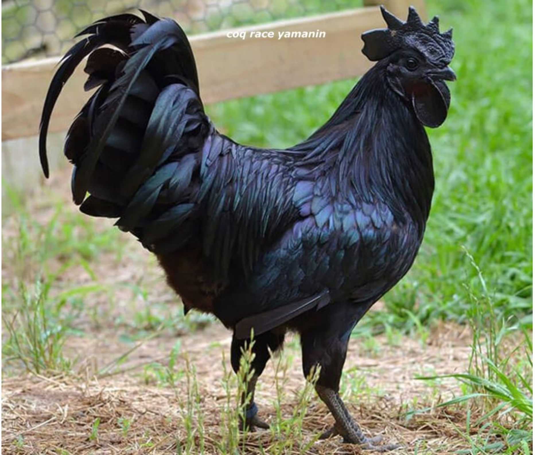
coq race yamanin