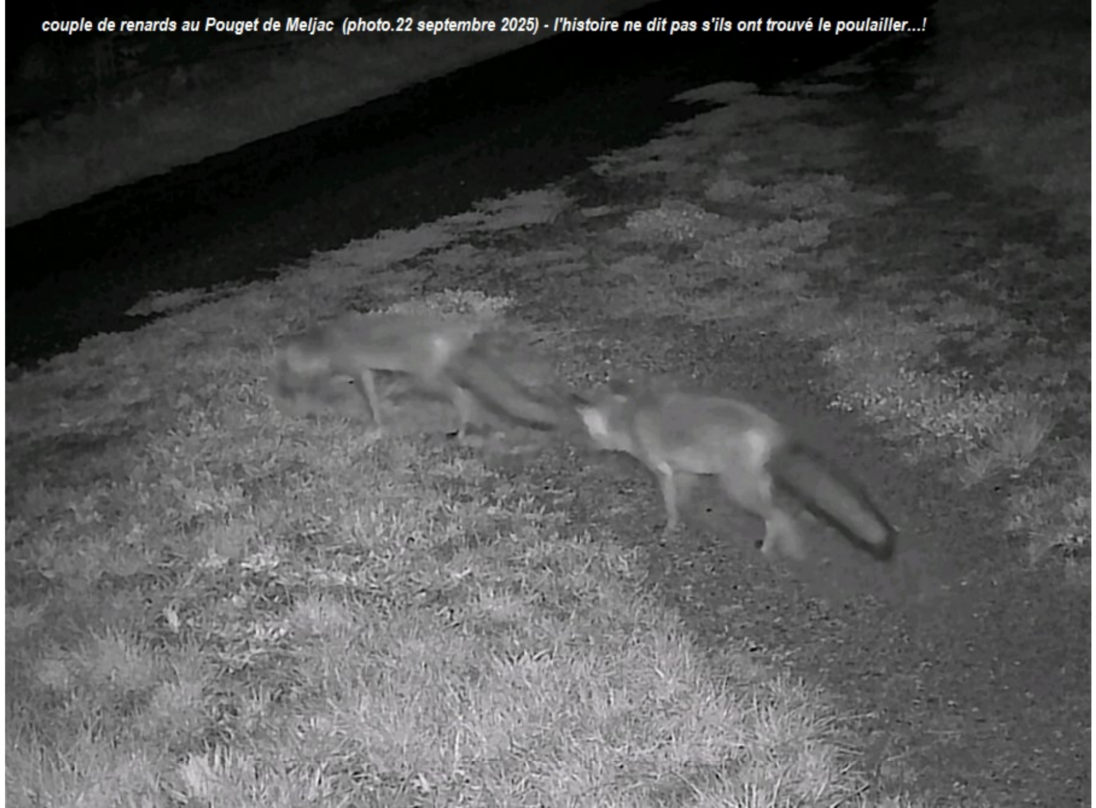
couple de renards au Pouget de Meljac (photo.22 septembre 2025) - l'histoire ne dit pas s'ils ont trouvé le poulailler...!