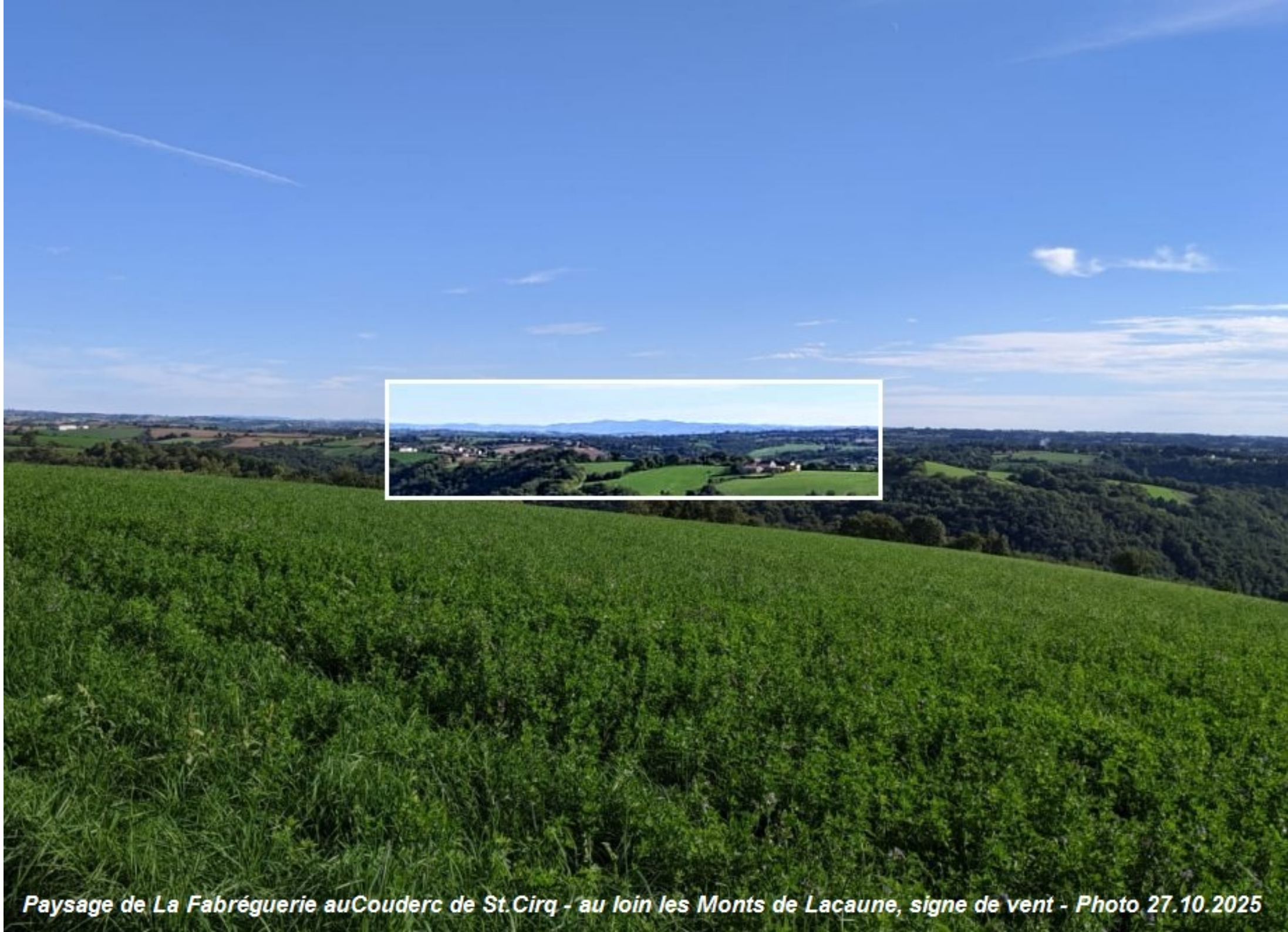
Paysage de La Fabréguerie au Couderc de St.Cirq - au loin les Monts de Lacau, signe de vent - Photo 27.10.2025