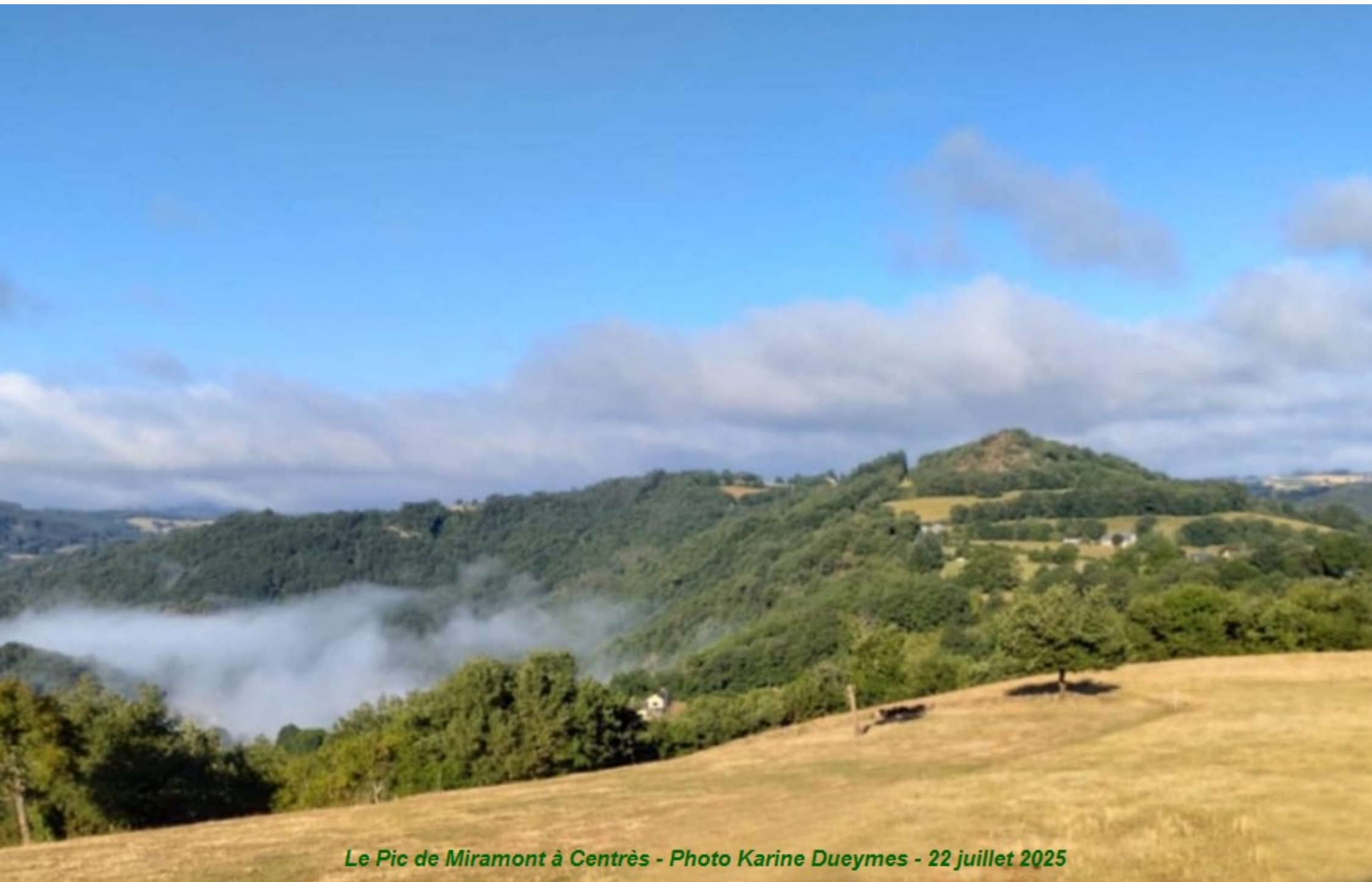
Le Pic de Miramont à Centres - 22 juillet 2025