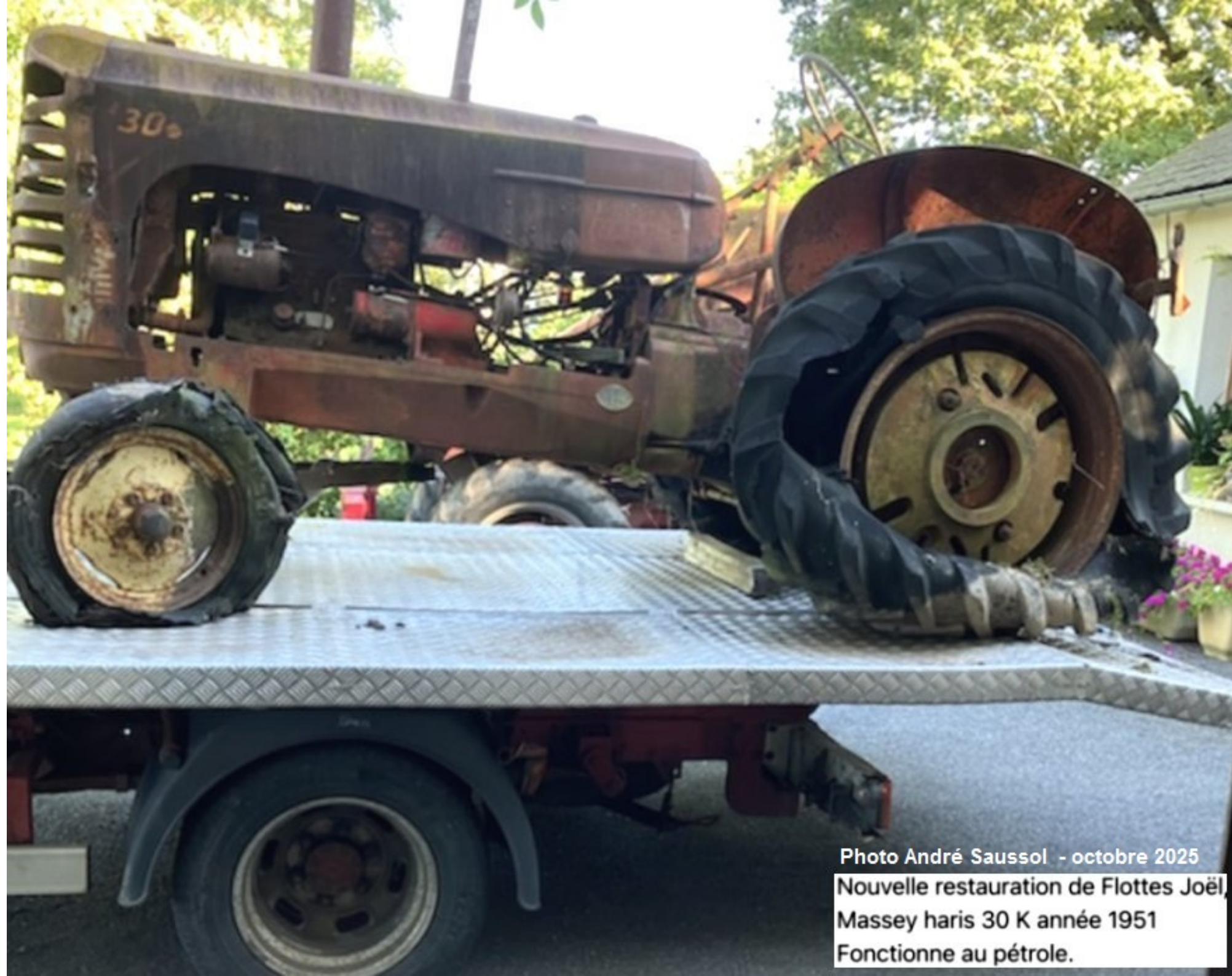
Photo André Saussol - octobre 2025 Nouvelle restauration de Flottes Joël Massey haris 30 K année 1951 Fonctionne au pétrole.