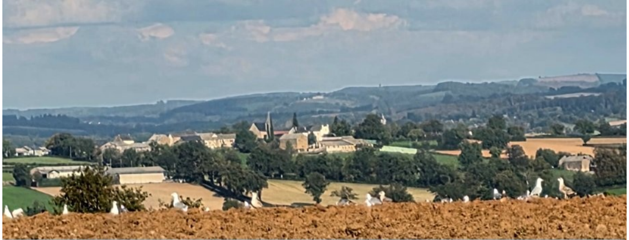
dans les labours entre Rullac et La Selve, des mouettes 14 septembre 2025