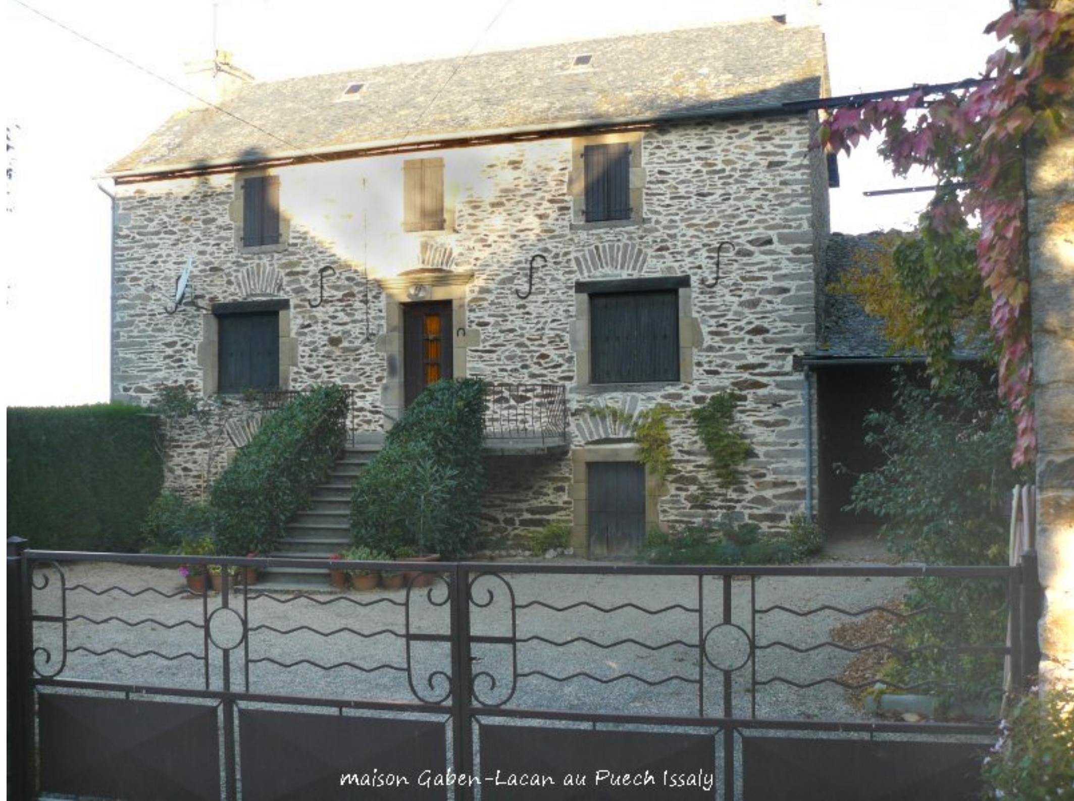
maison Gaben-Lacan au Puech Issaly