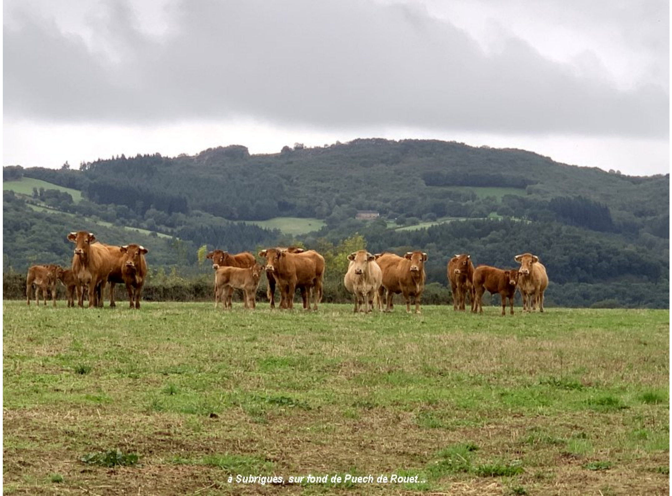
à Subriguès, sur fond de Puech de Rouet...