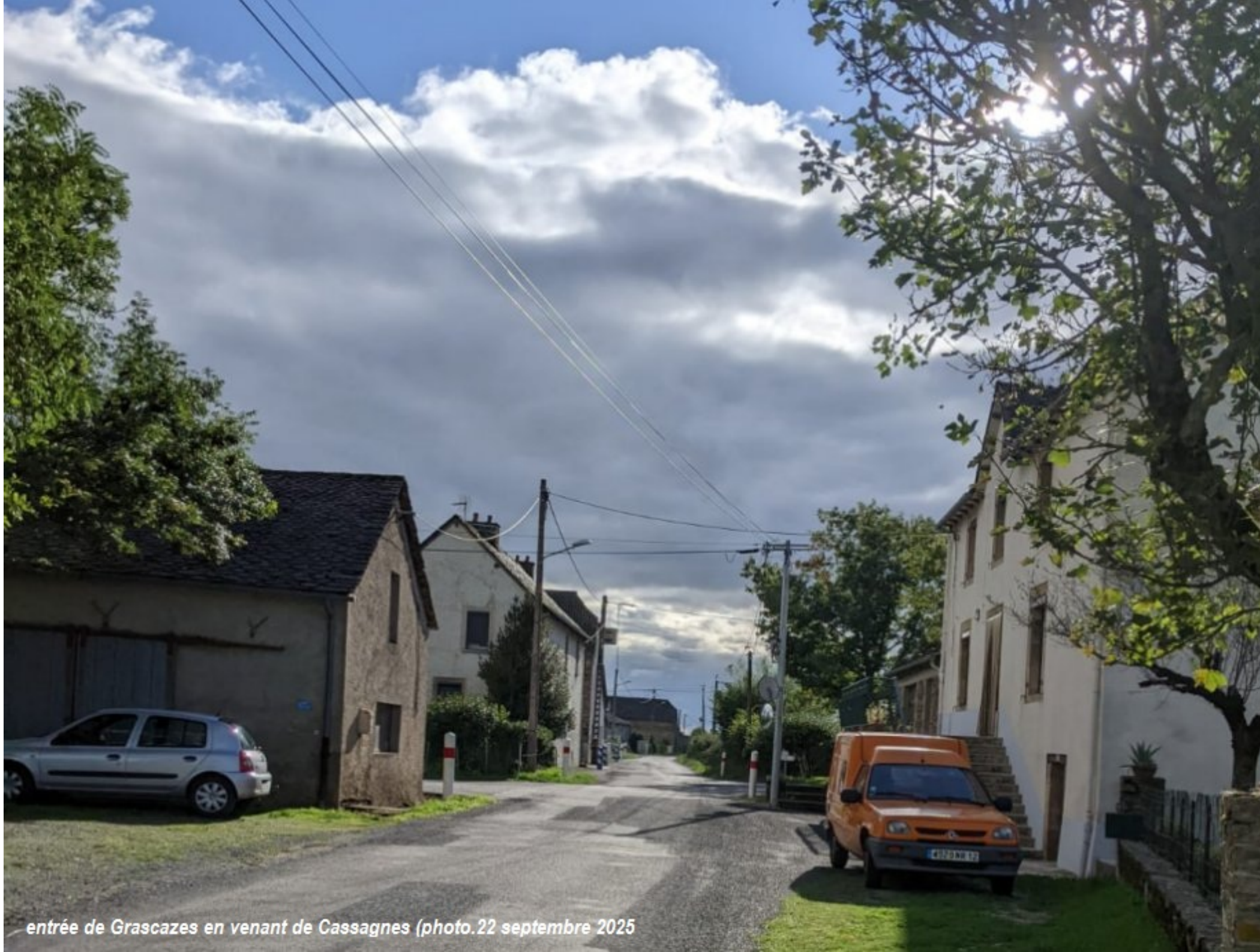
entrée de Grascazes en venant de Cassagnes (photo.22 septembre 2025)