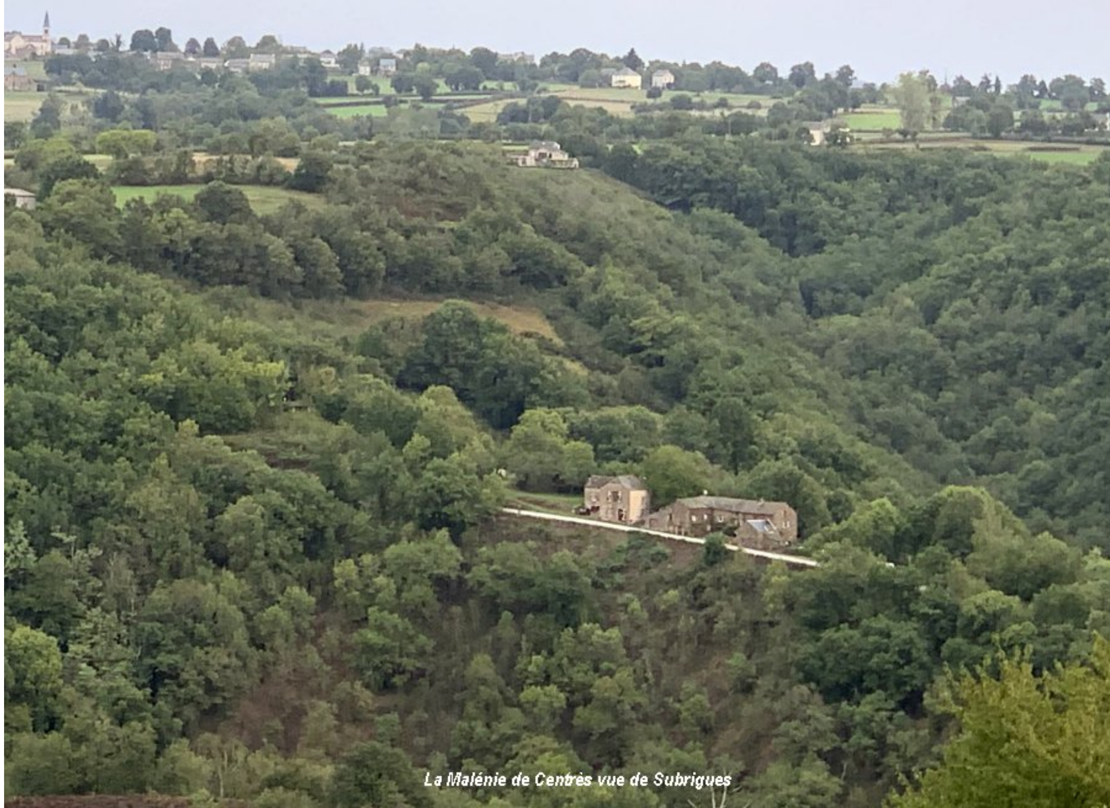
La Malénie de Centès vue de Subrigues