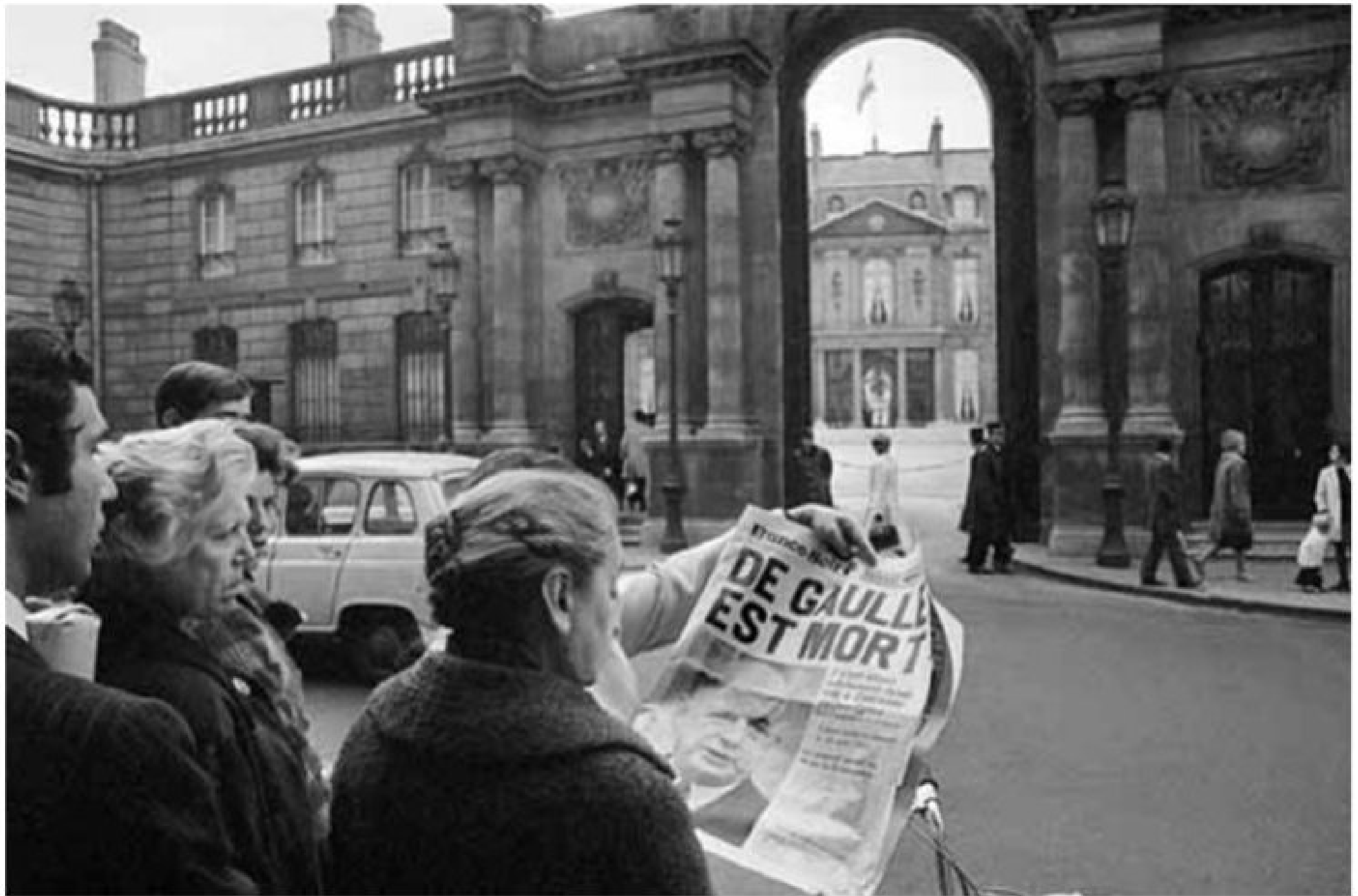
Charles De Gaulle, né le 22 novembre 1890 à Lille dans le département du Nord et décédé le 9 novembre 1970, il y a de cela 40 ans, à Colombey-les-Deux-Églises (Haute-Marne) où il est enterré.