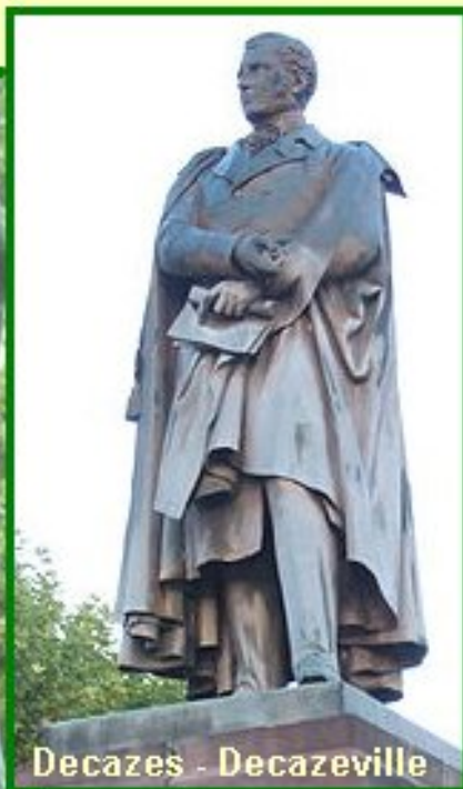
Decazes - Decazeville