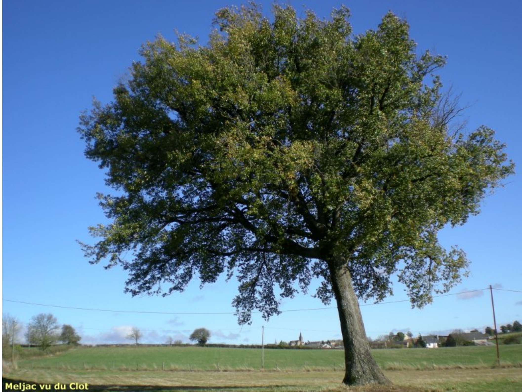
Meljac vu du Clot