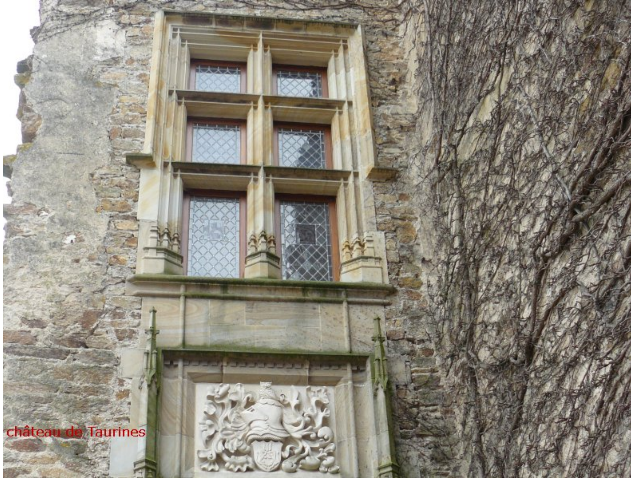
château de Taurines