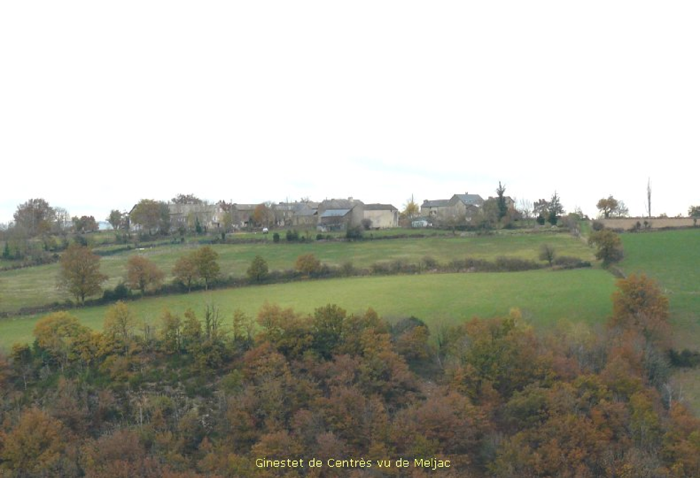
Ginestet de Centrès vu de Meljac