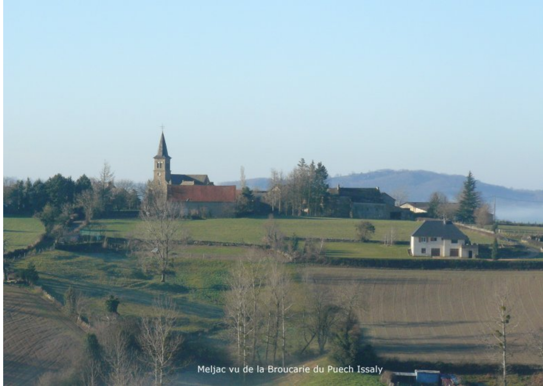
Meljac vu de la Broucarie du Puech Issaly