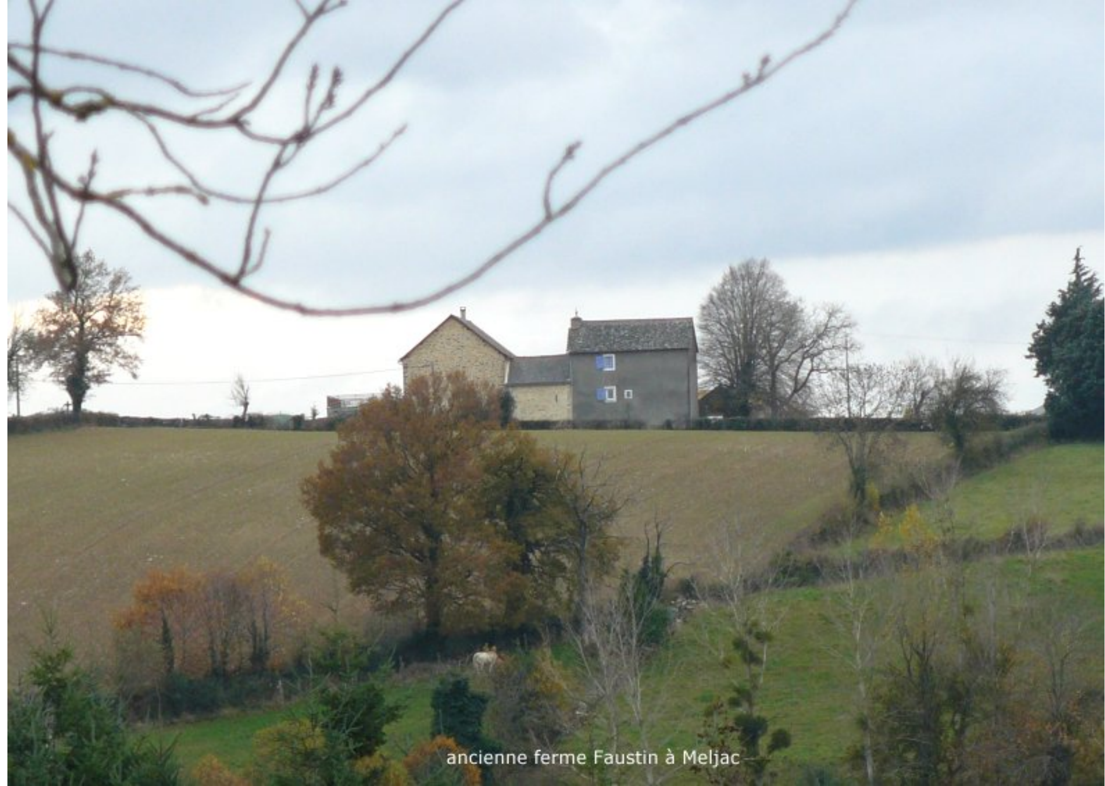
ancienne ferme Faustin à Meljac