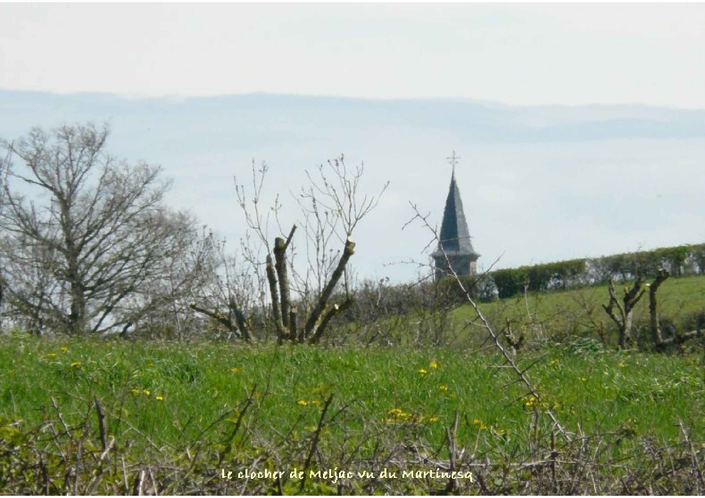
le clocher de Meljac vu du Martinesq