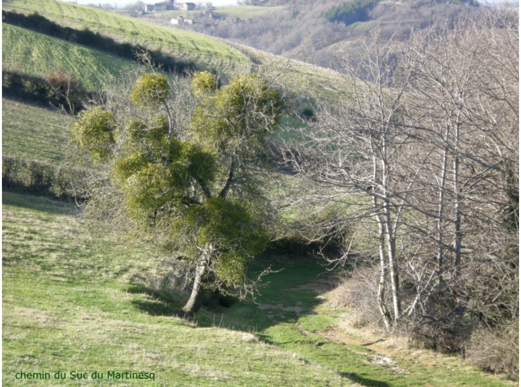
chemin du Suc du Martinesq