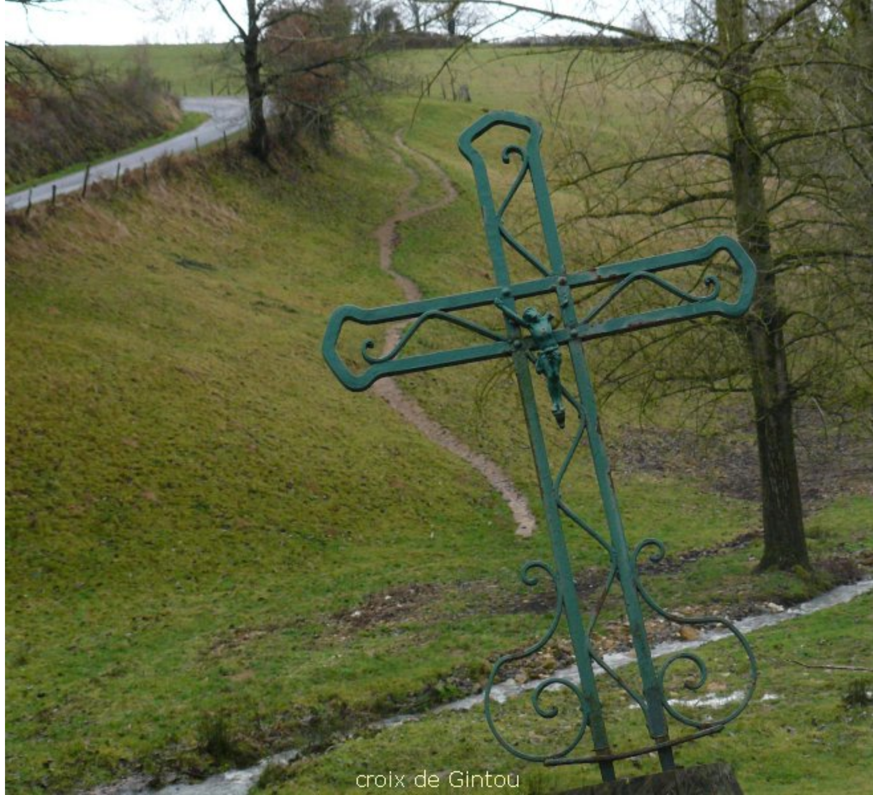
croix de Gintou