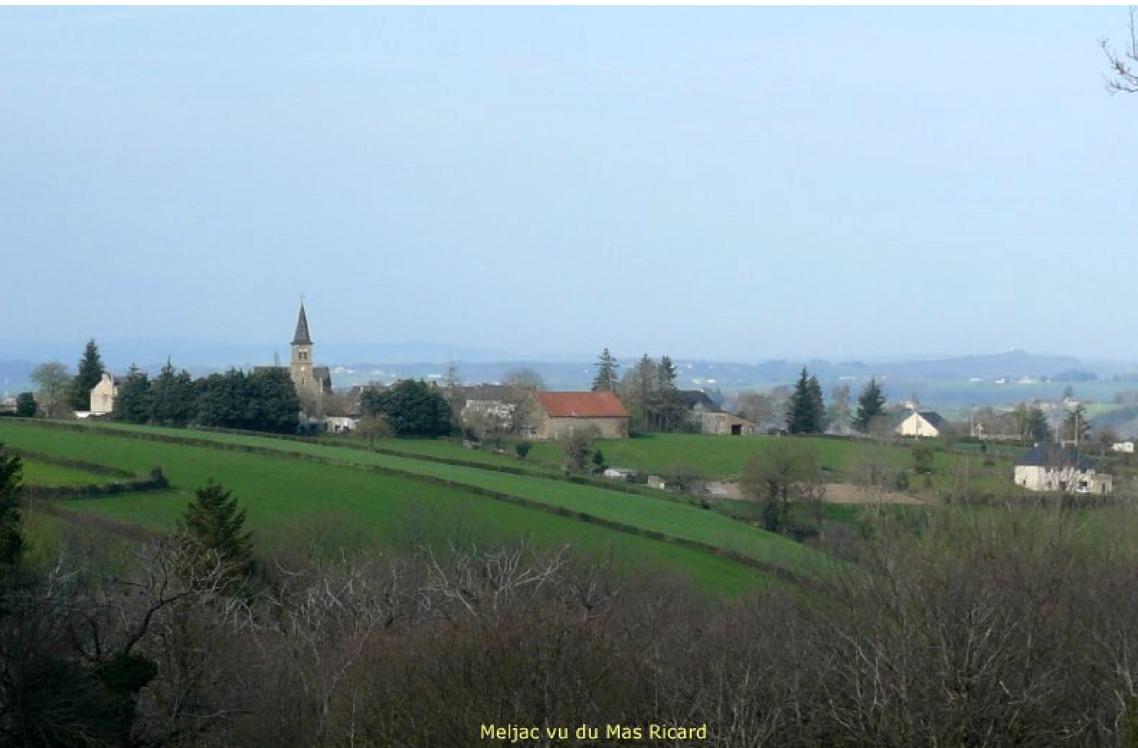
Meljac vu du Mas Ricard