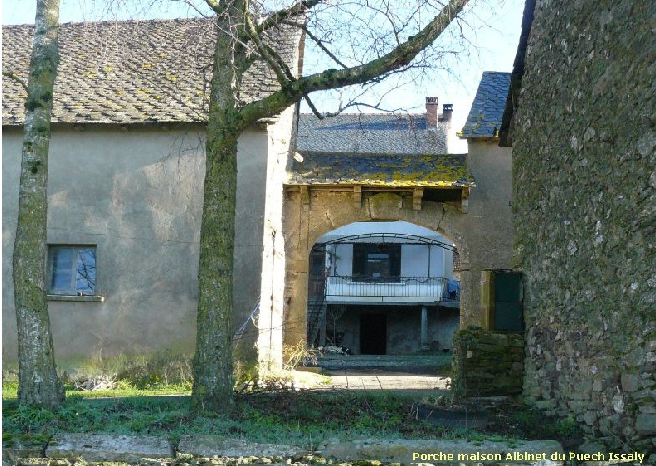
Porche maison Albinet du Puech Issaly