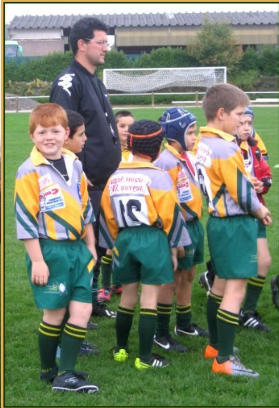
L'équipe de rugby Lévézou - Ségala (Meljac) à Naucelle, samedi 12 novembre 2011