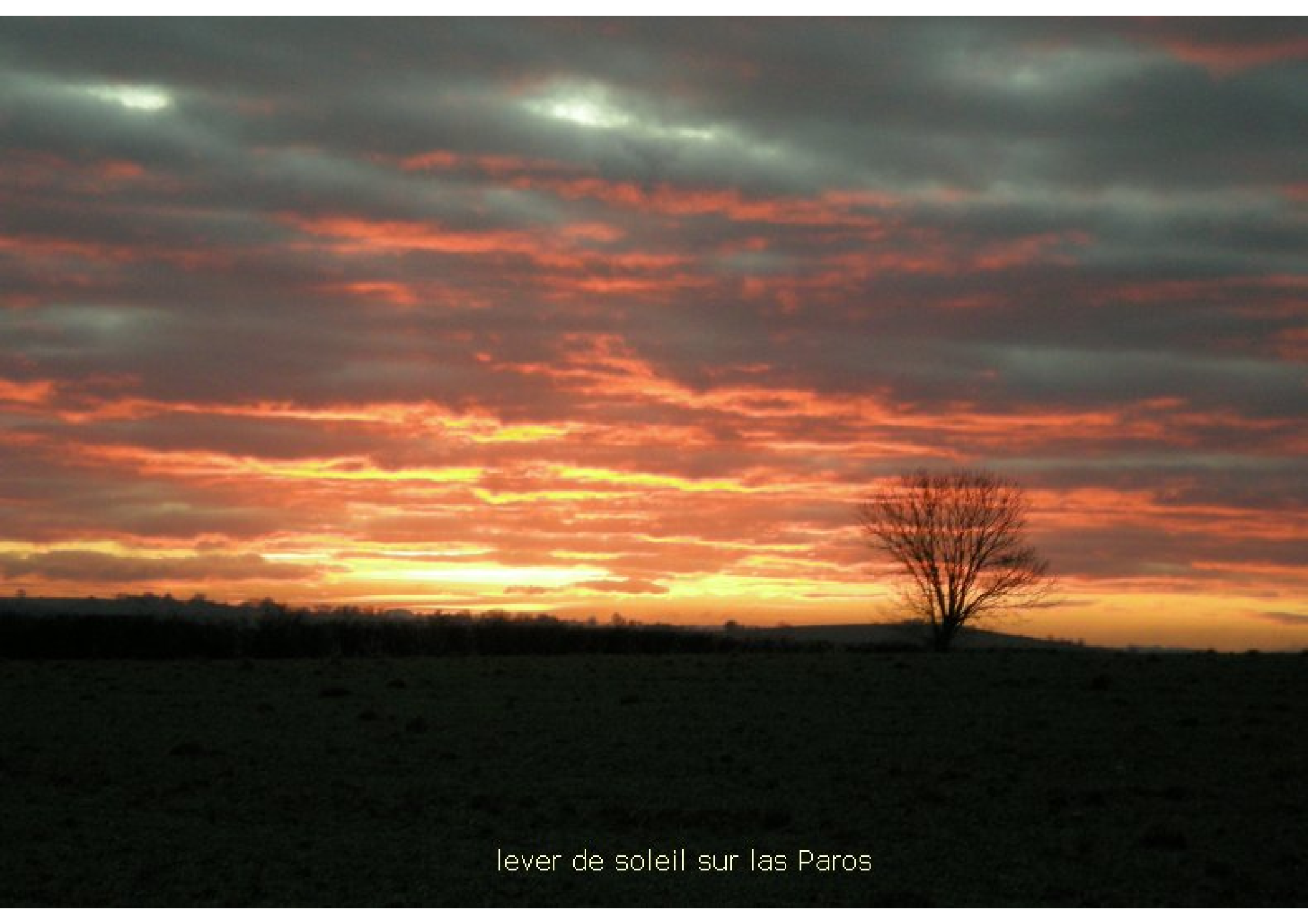
lever de soleil sur las Paros