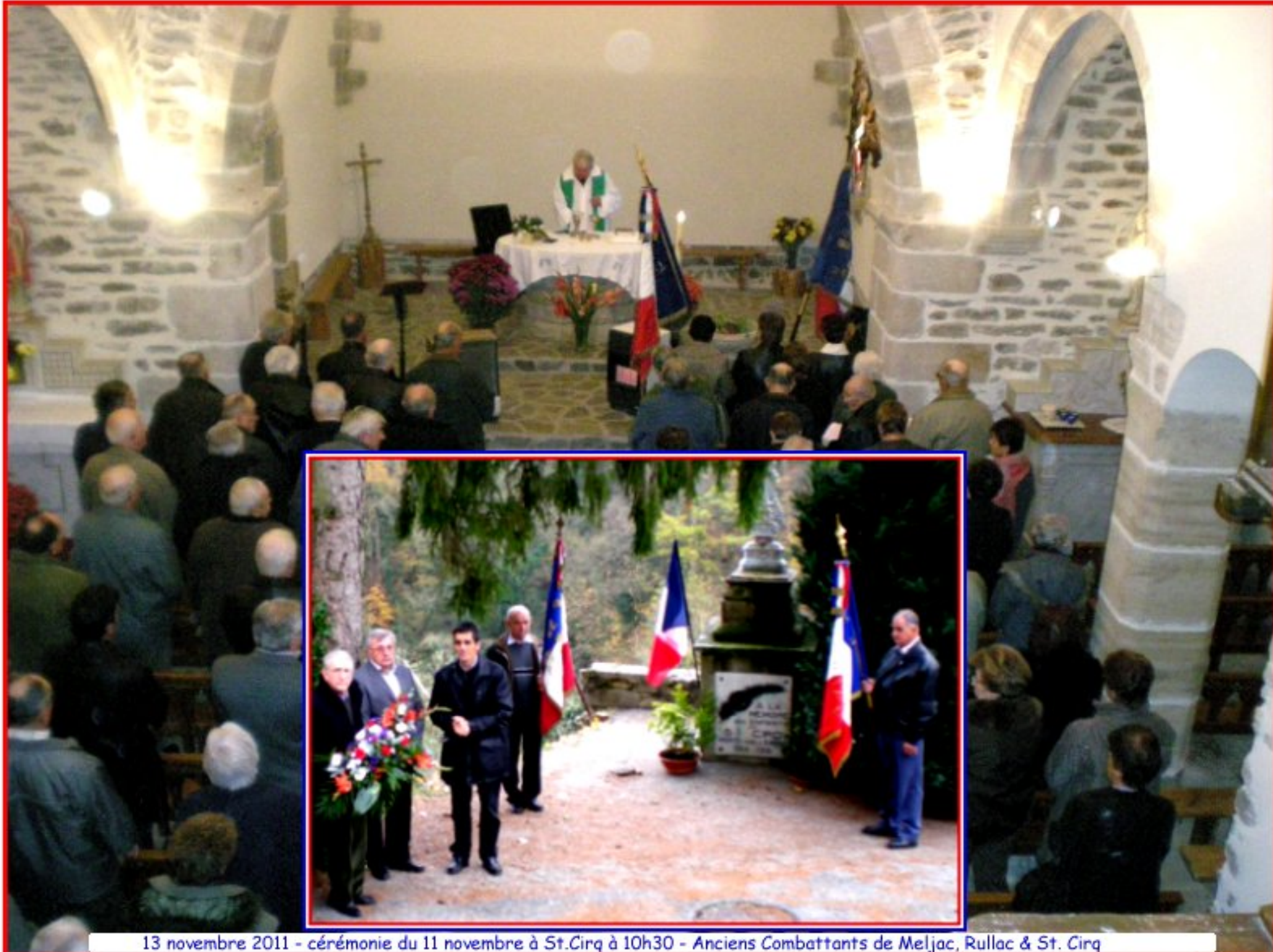
13 novembre 2011 - cérémonie du 11 novembre à St.Cirq à 10h30 - Anciens Combattants de Meljac, Rullac & St. Cirq