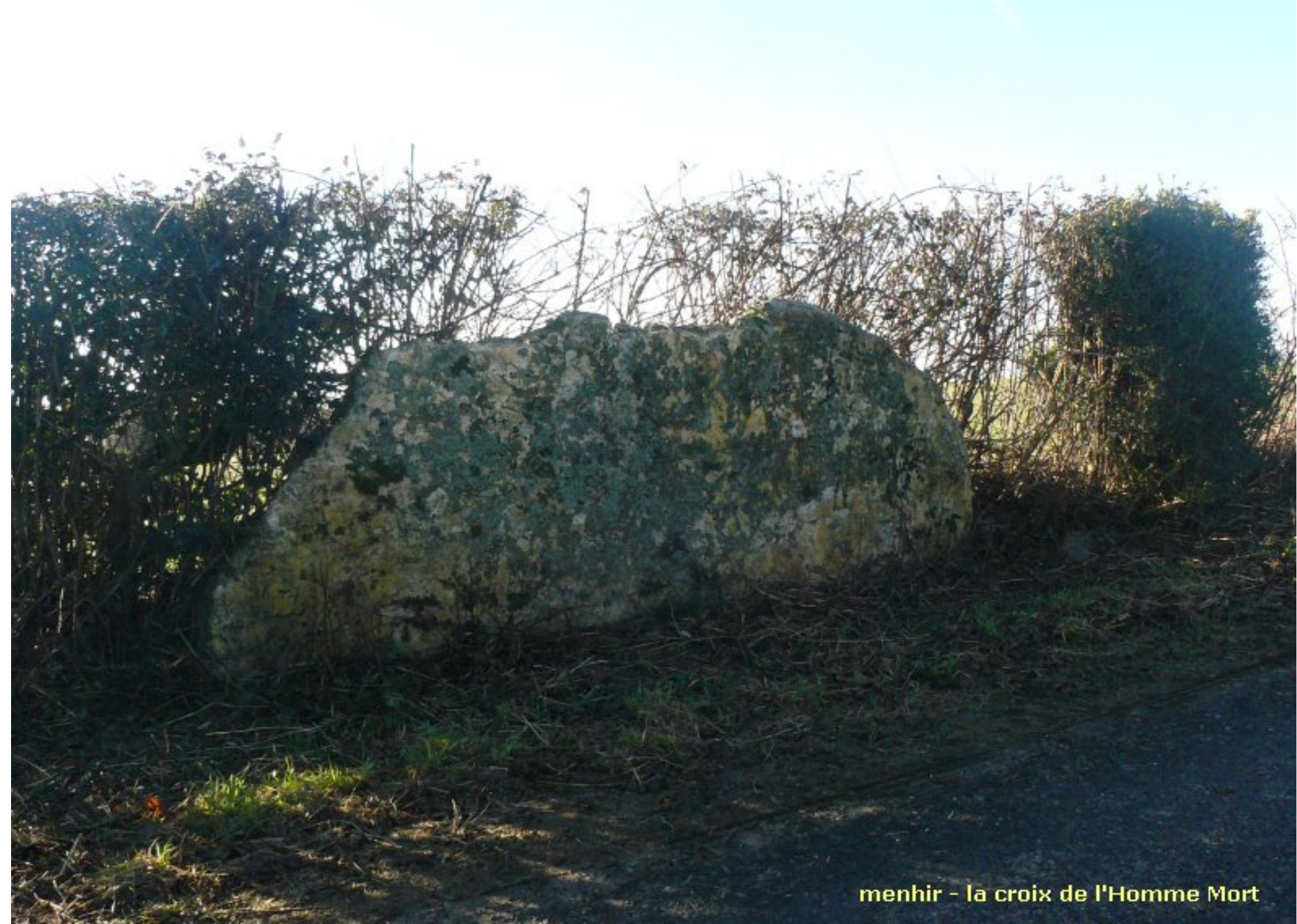
menhir - la croix de l'Homme Mort