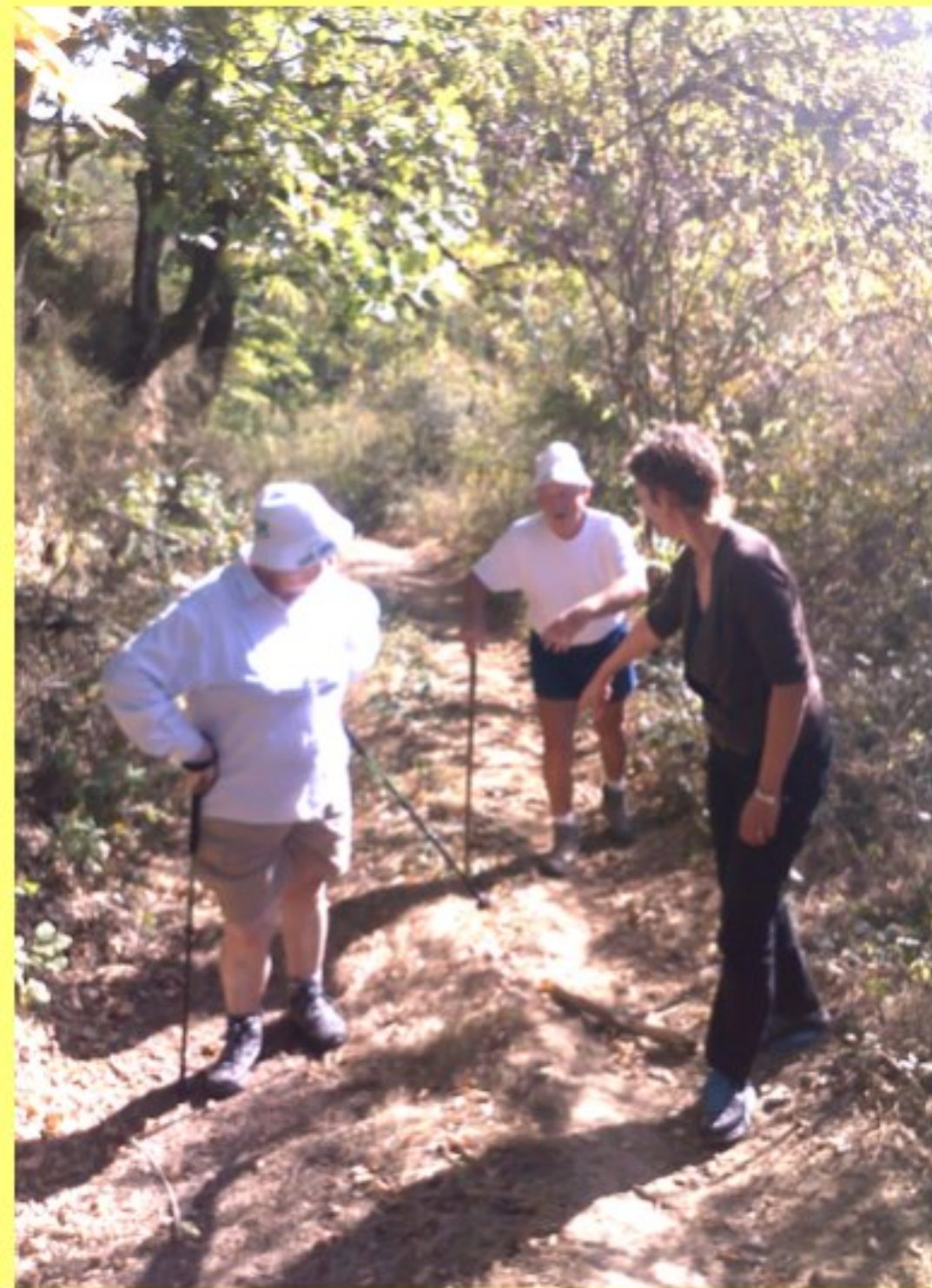
Randonnée de Grascazes à Curagnol - septembre 2011