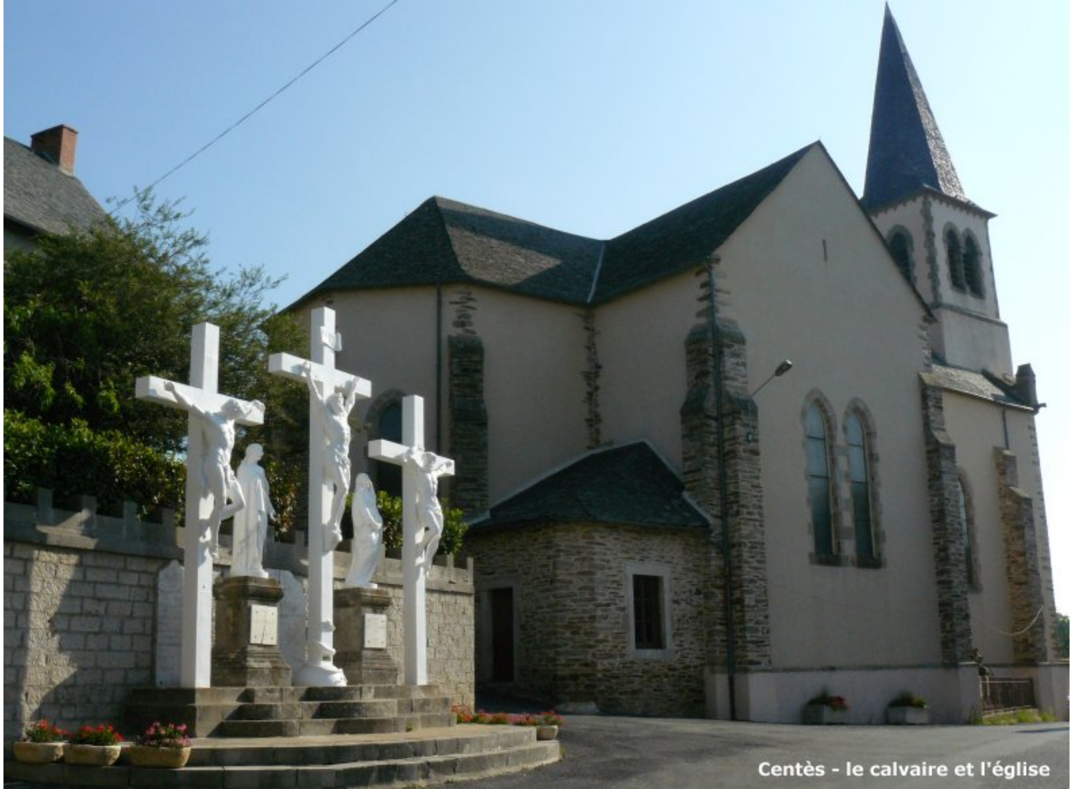
Centès - le calvaire et l'église