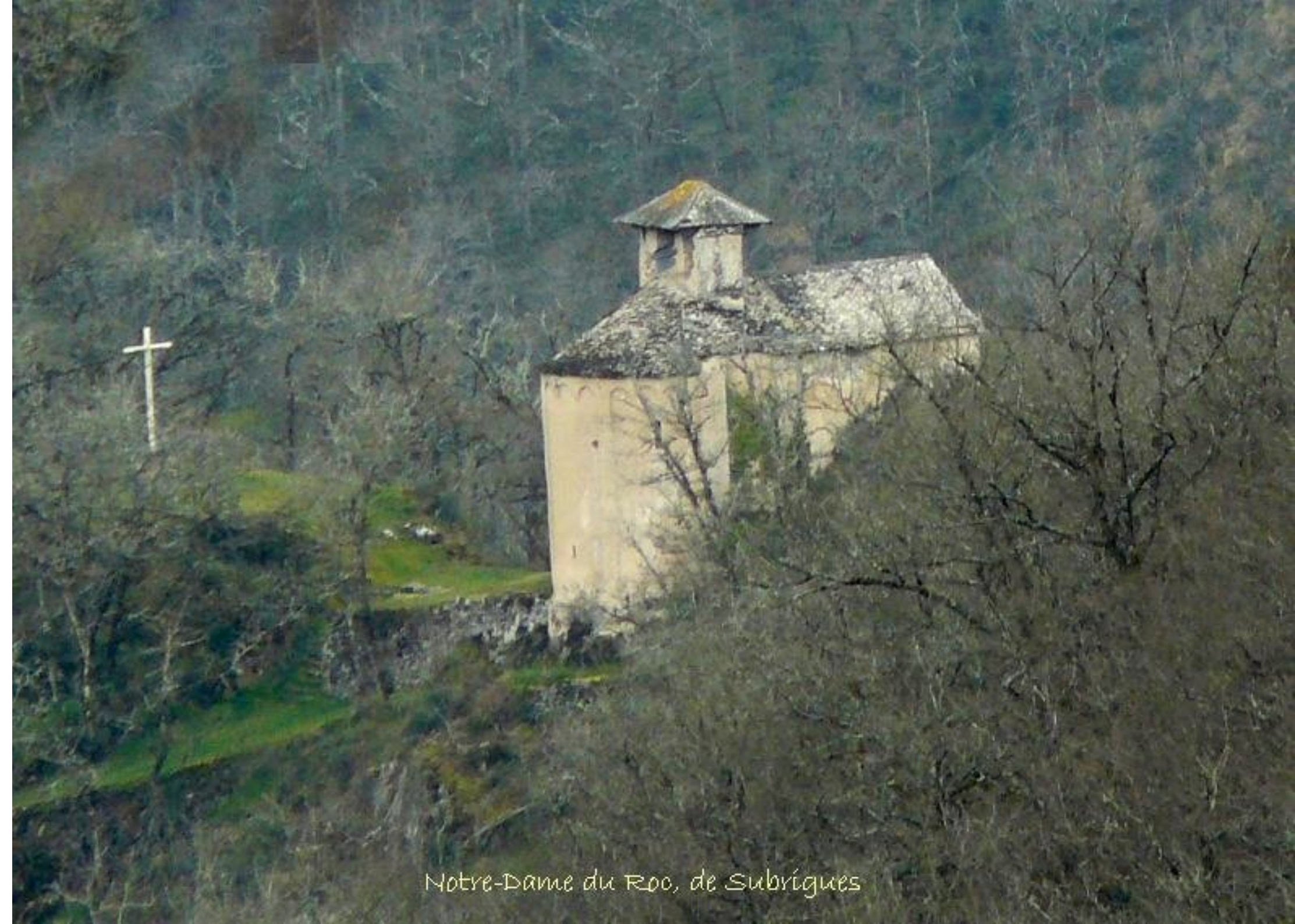
Notre-Dame du Roc, de Subrigues