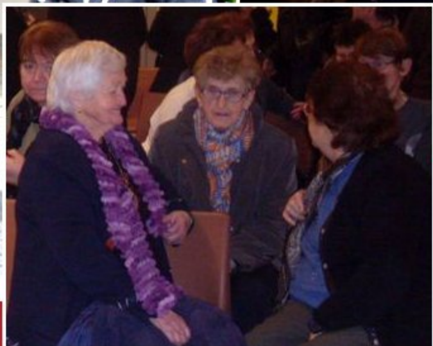
TELETHON de RULLAC dimanche 24 novembre 2013