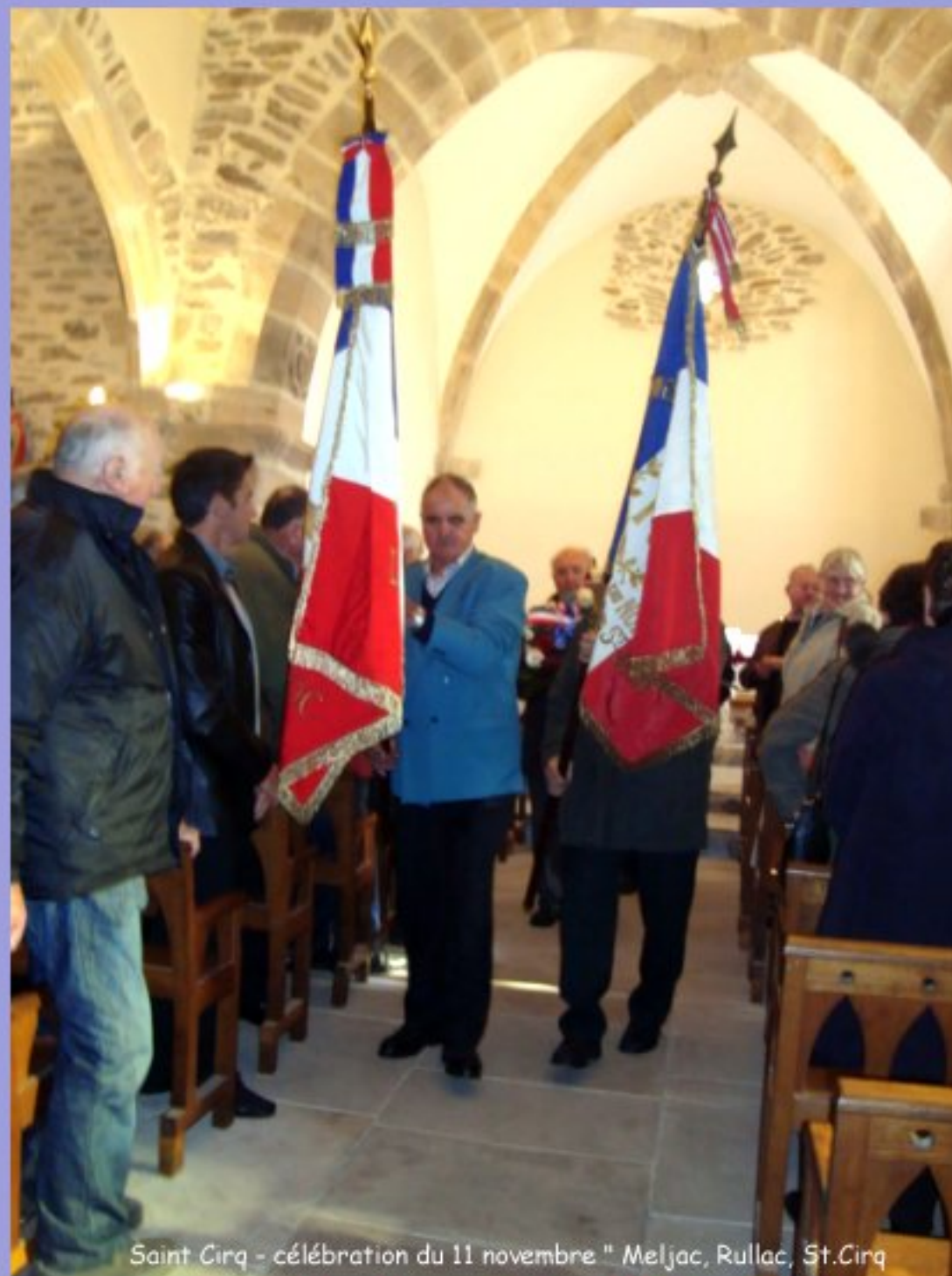
Saint Cirq - célébration du 11 novembre " Meljac, Rullac, St.Cirq