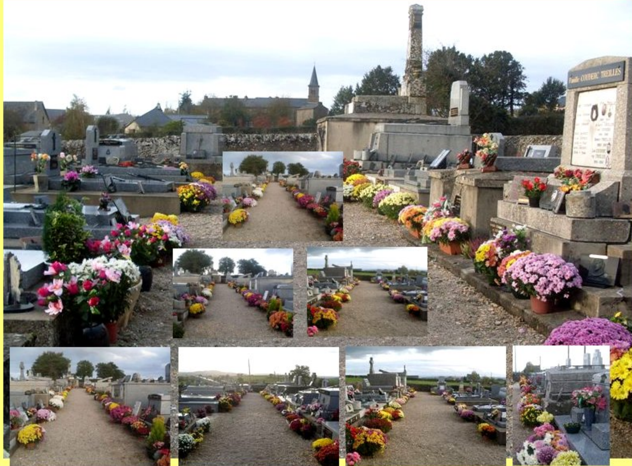
La Toussaint fleurie au cimetière de Meljac