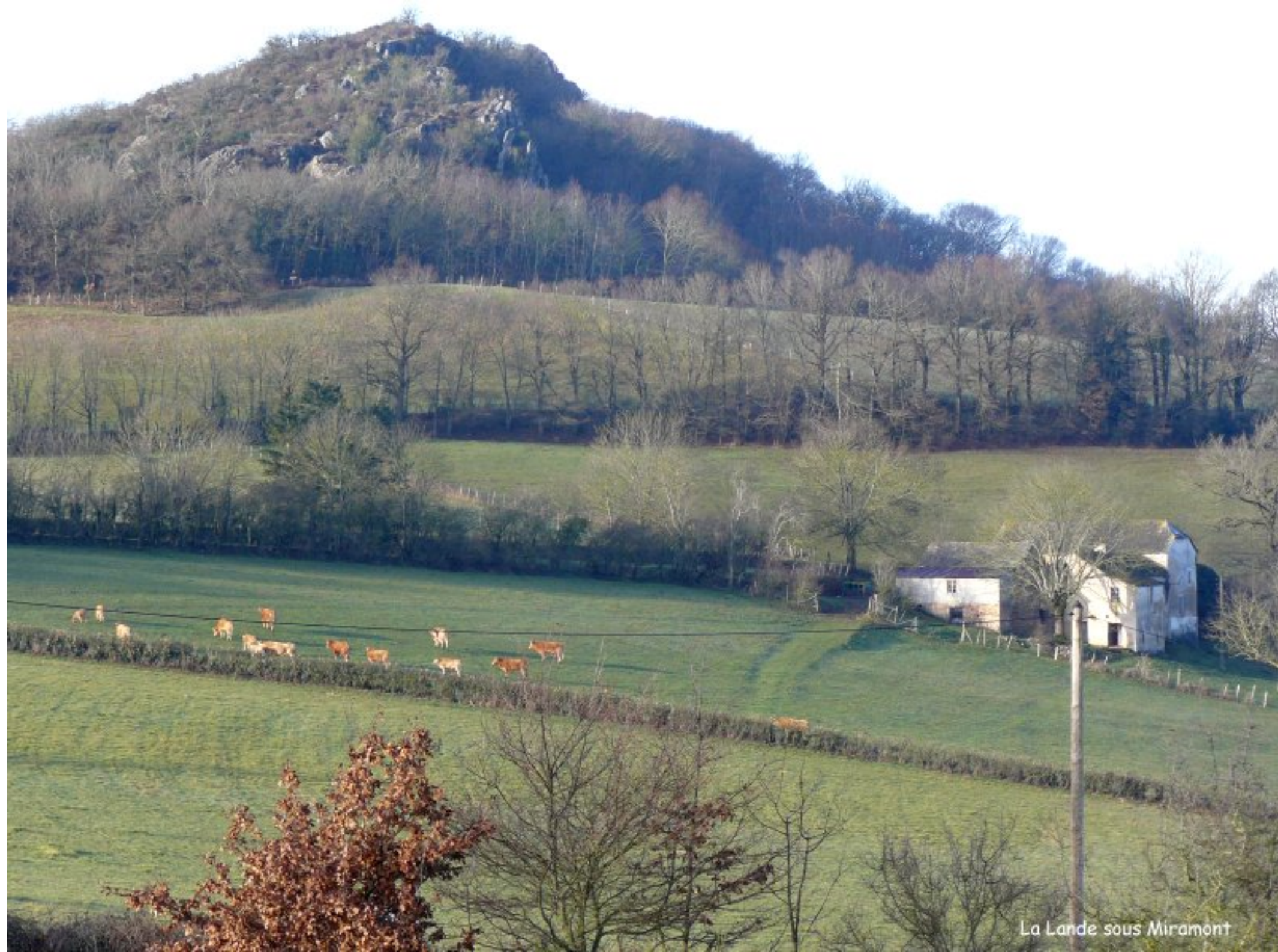
La Lande sous Miramont