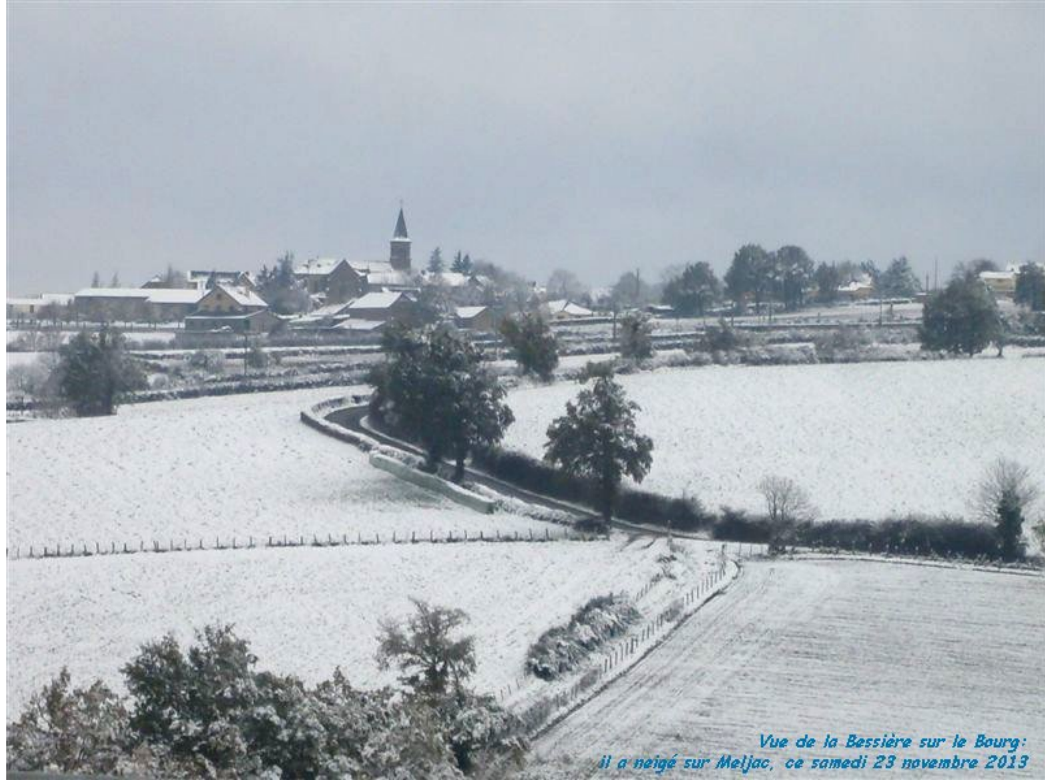
Vue de la Bessière sur le Bourg: il a neigé sur Meljac, ce samedi 23 novembre 2013