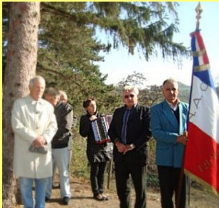
Cérémonie au Monument aux Morts à Saint-Cirq le 13 novembre 2011