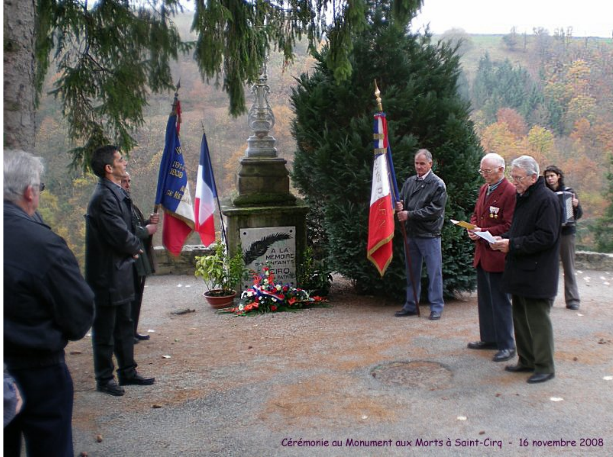
Cérémonie au Monument aux Morts à Saint-Cirq - 16 novembre 2008