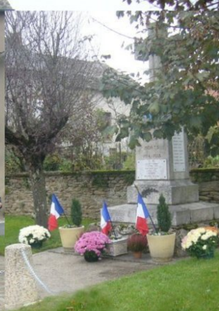
Cérémonie au Monument aux Morts à Meljac - 11 novembre 2007