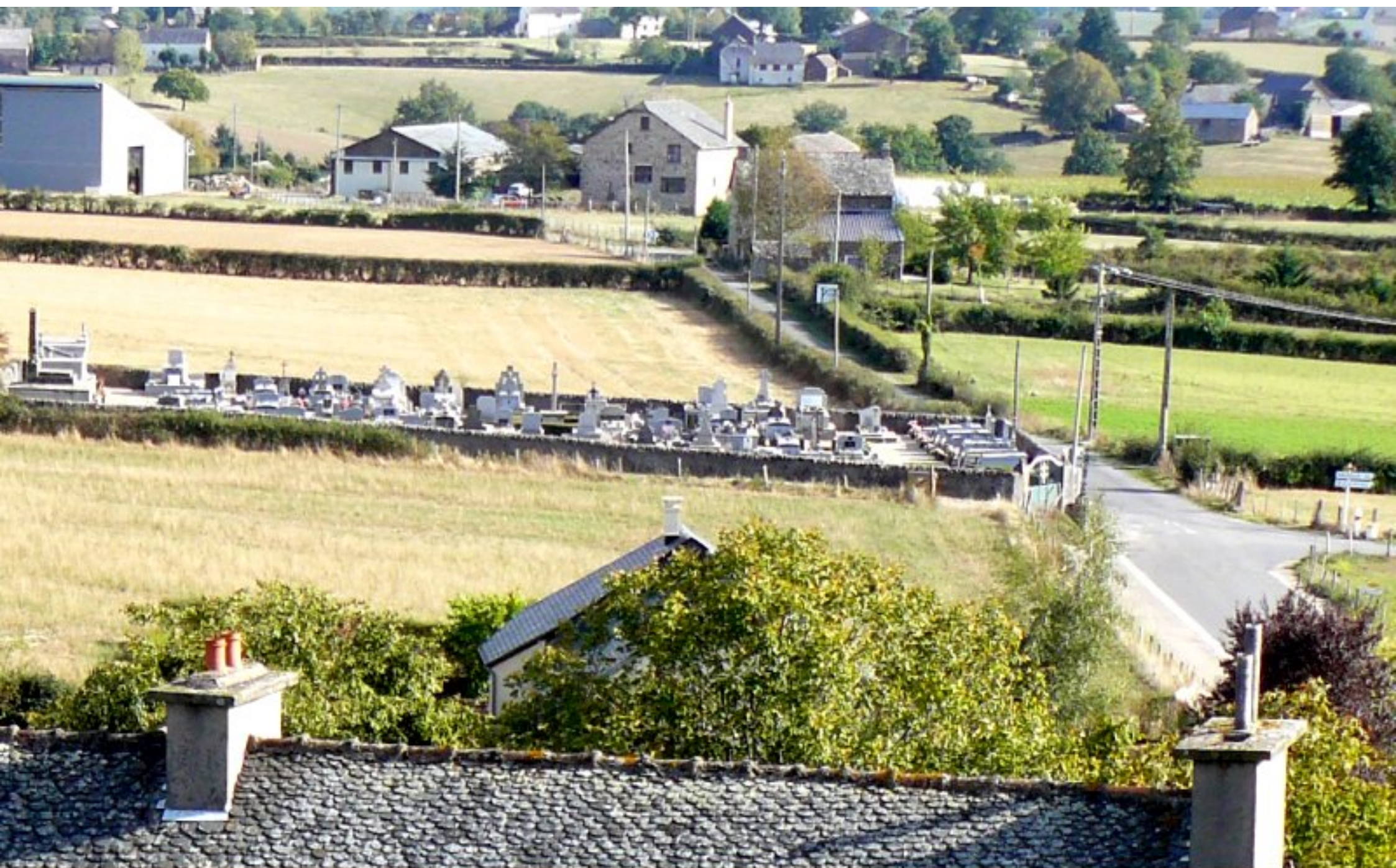
Le cimetière de Meljac sur fond de Soulages