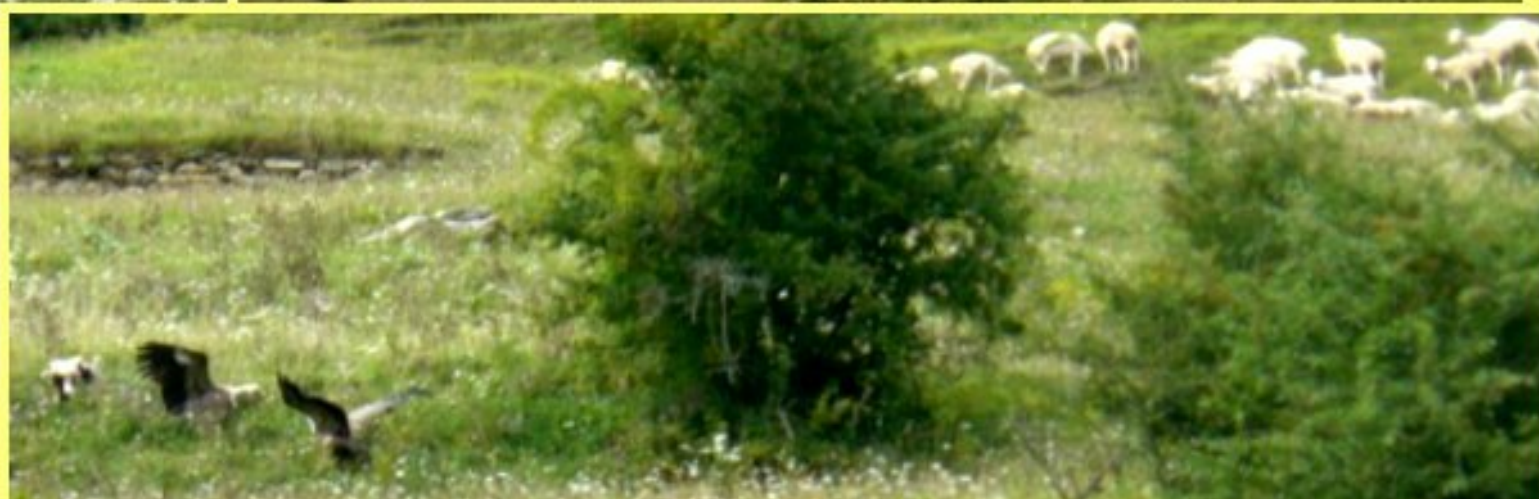
sur les hauts de Bourg d'Oueil (Marignac-Luchan)