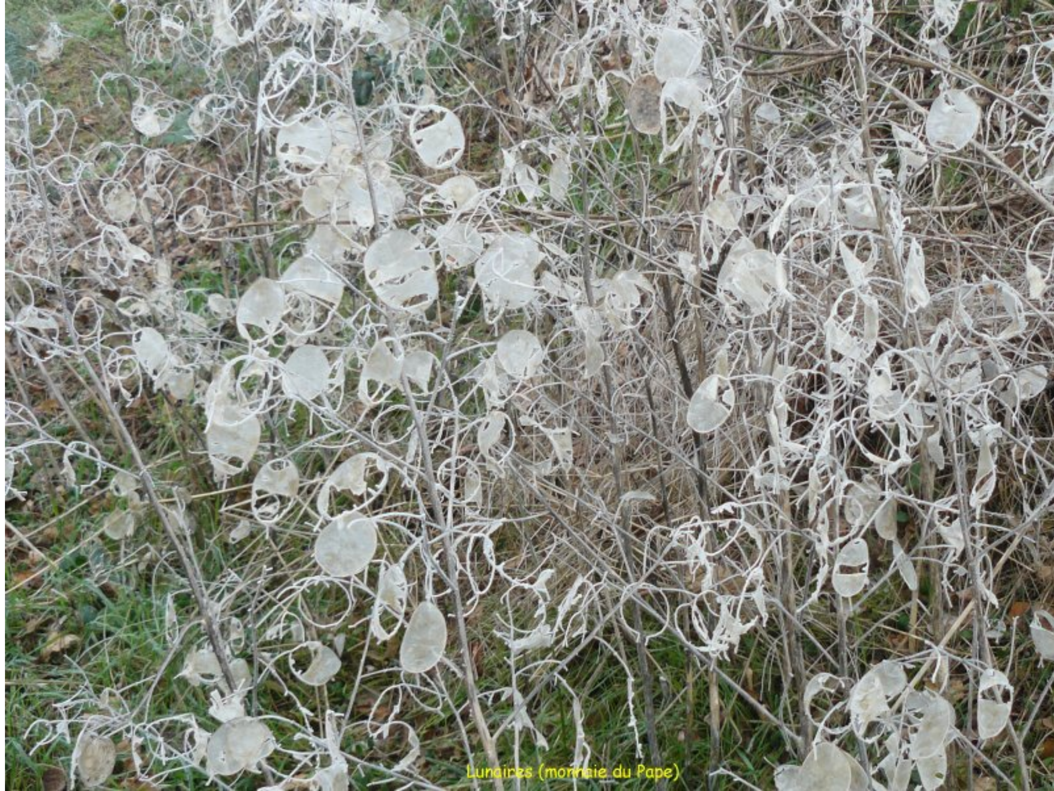
Lunaires (montée du Pape)