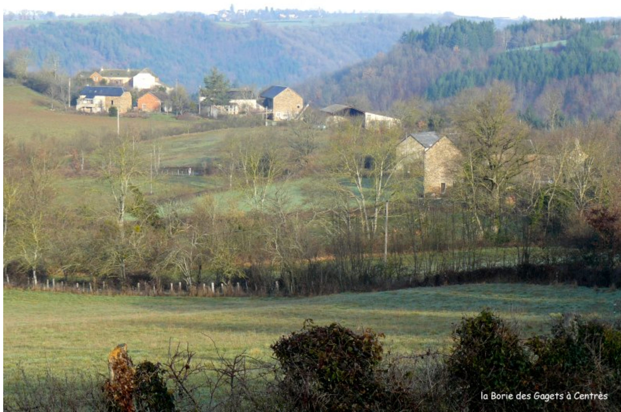
la Borie des Gagets à Centrès