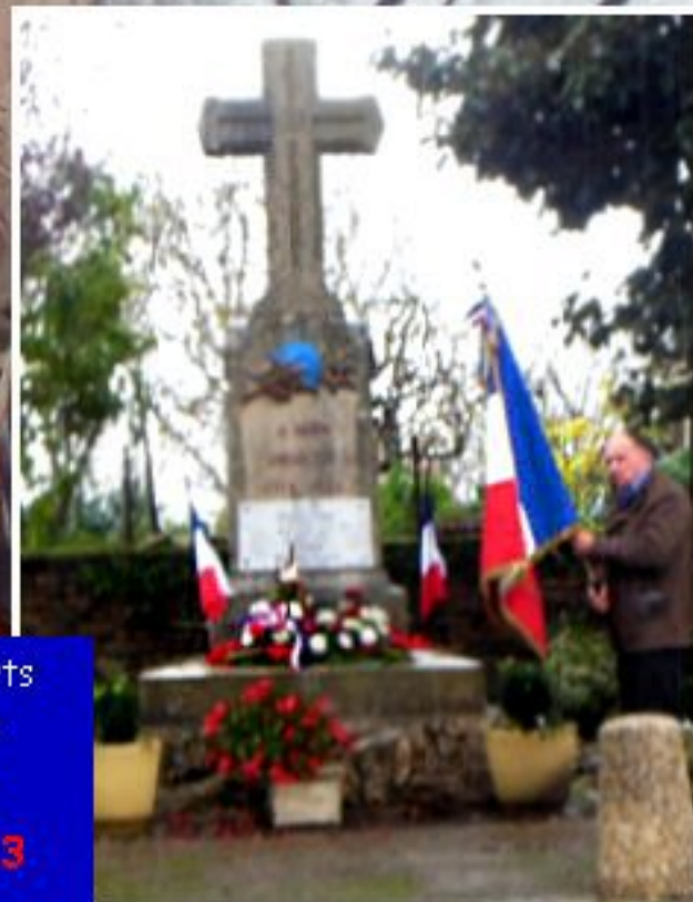
Cérémonie au Monuments aux Morts Messe des Anciens Combattants de Meljac - Rullac - Saint Cirq Meljac le 10 novembre 2013