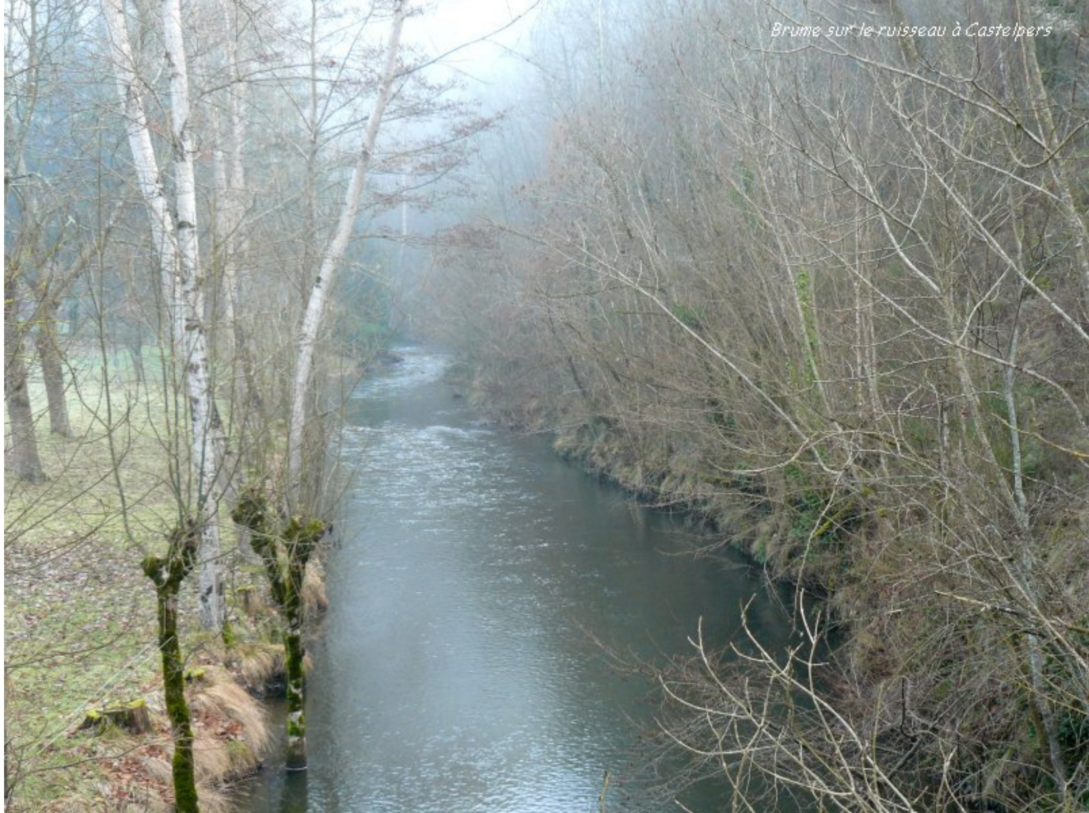
Brume sur le ruisseau à Castelpers