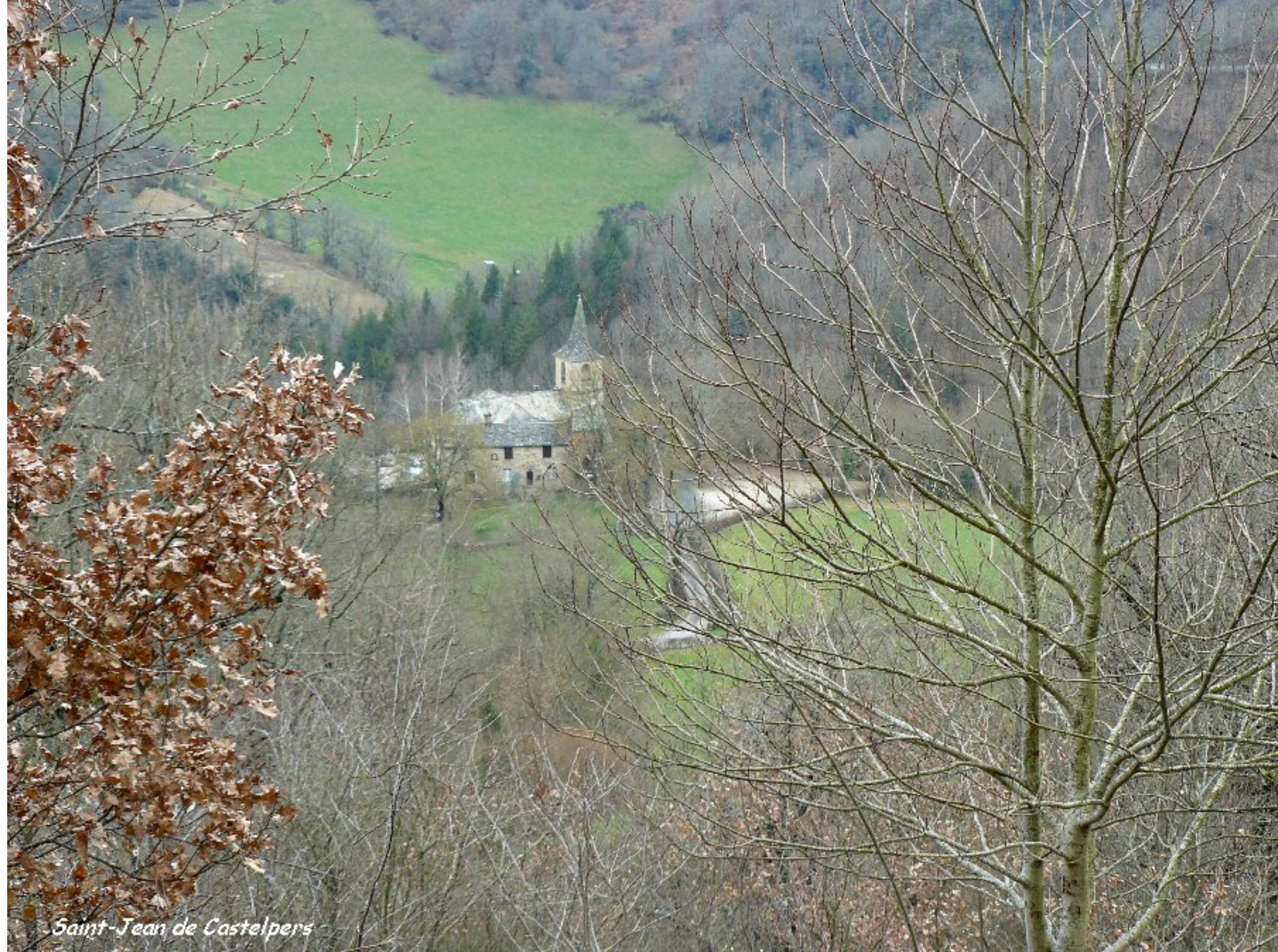
Saint-Jean de Castelpers