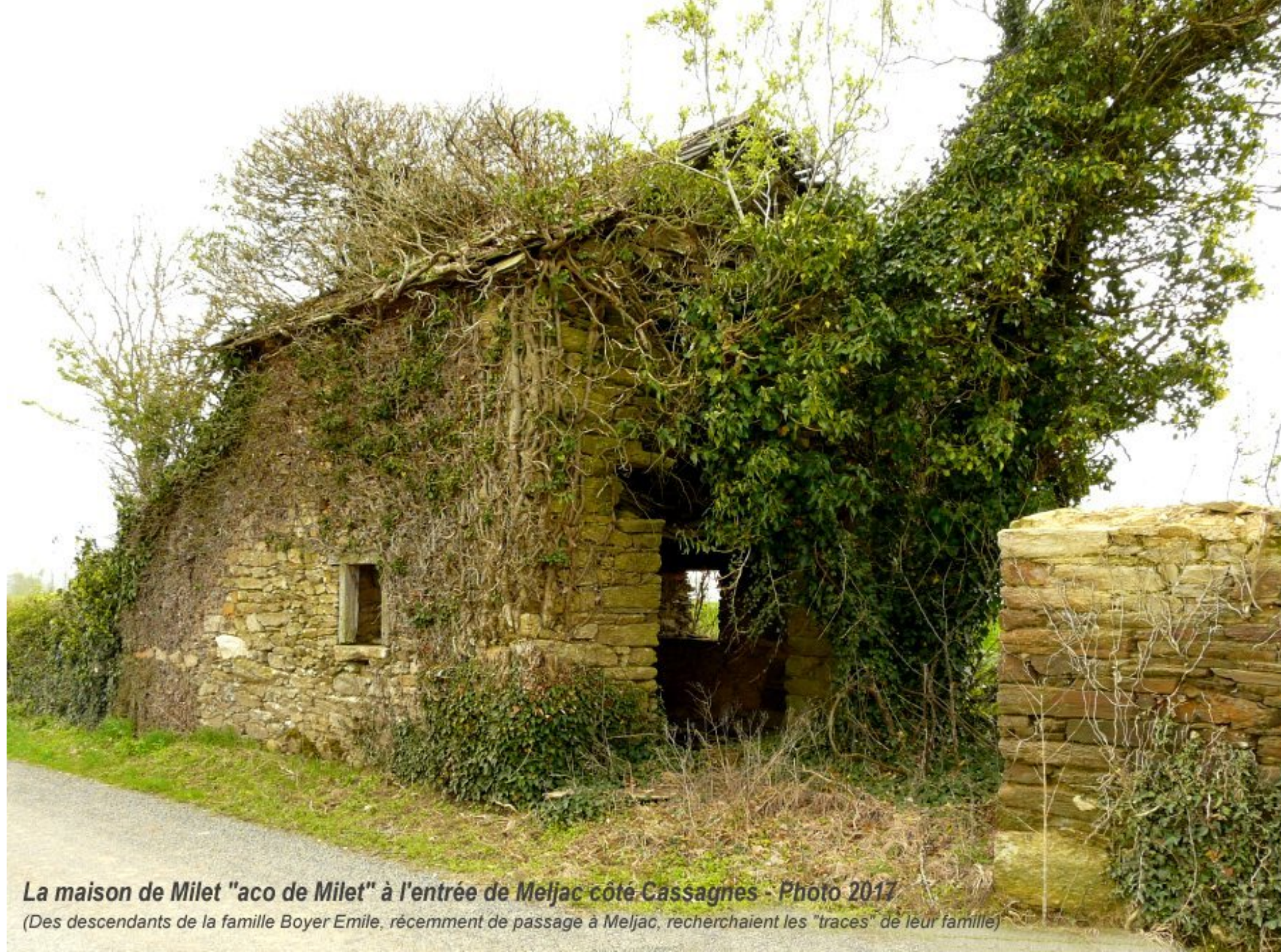
La maison de Milet "aco de Milet" à l'entrée de Meljac côté Cassagnes - Photo 2017

(Des descendants de la famille Boyer Emile, récemment de passage à Meljac, recherchaient les "traces" de leur famille)