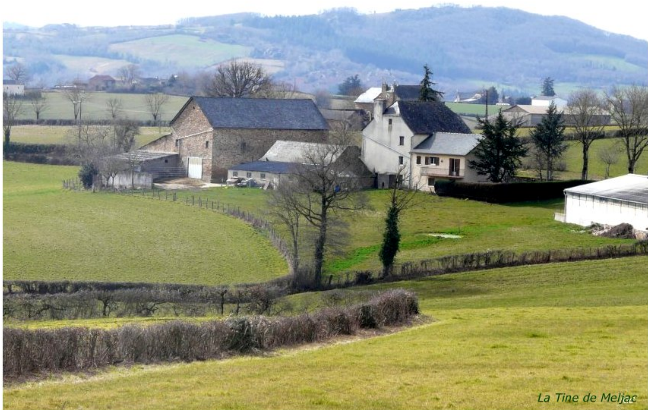
La Tine de Meljac