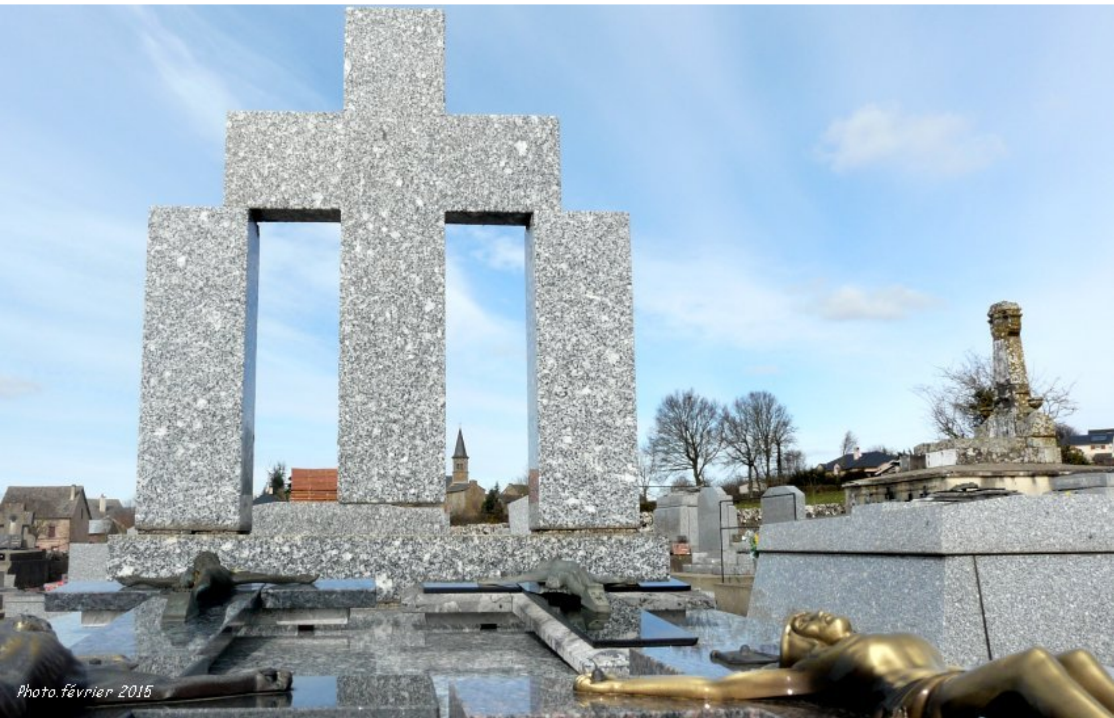
Photo. février 2015