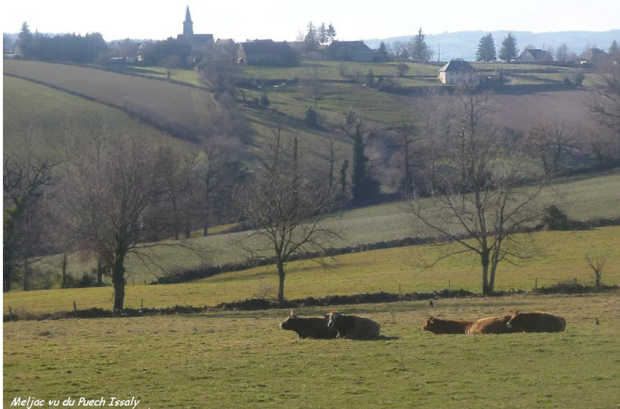
Meljac vu du Puech Issaly