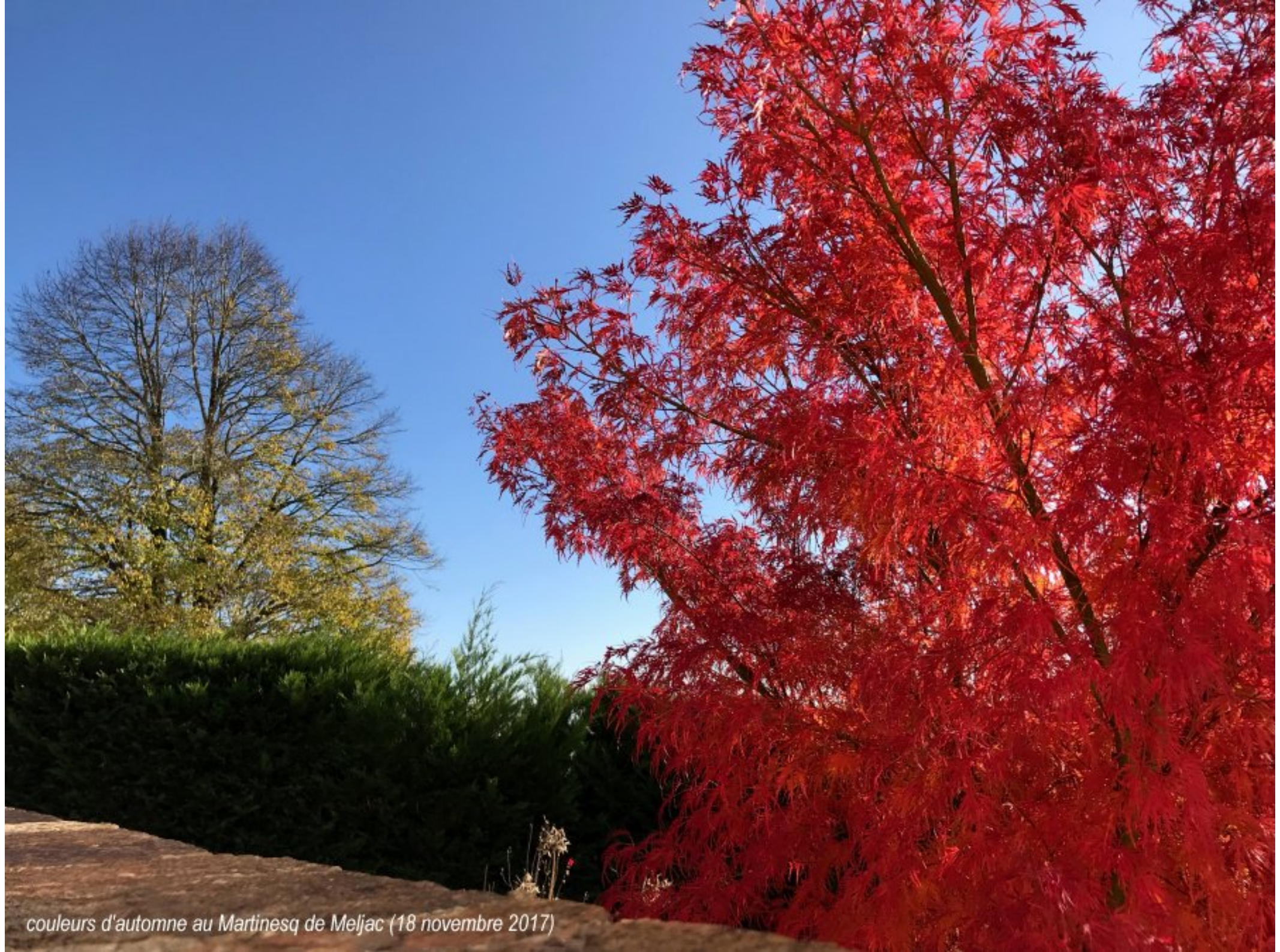
couleurs d'automne au Martinesq de Meljac (18 novembre 2017)