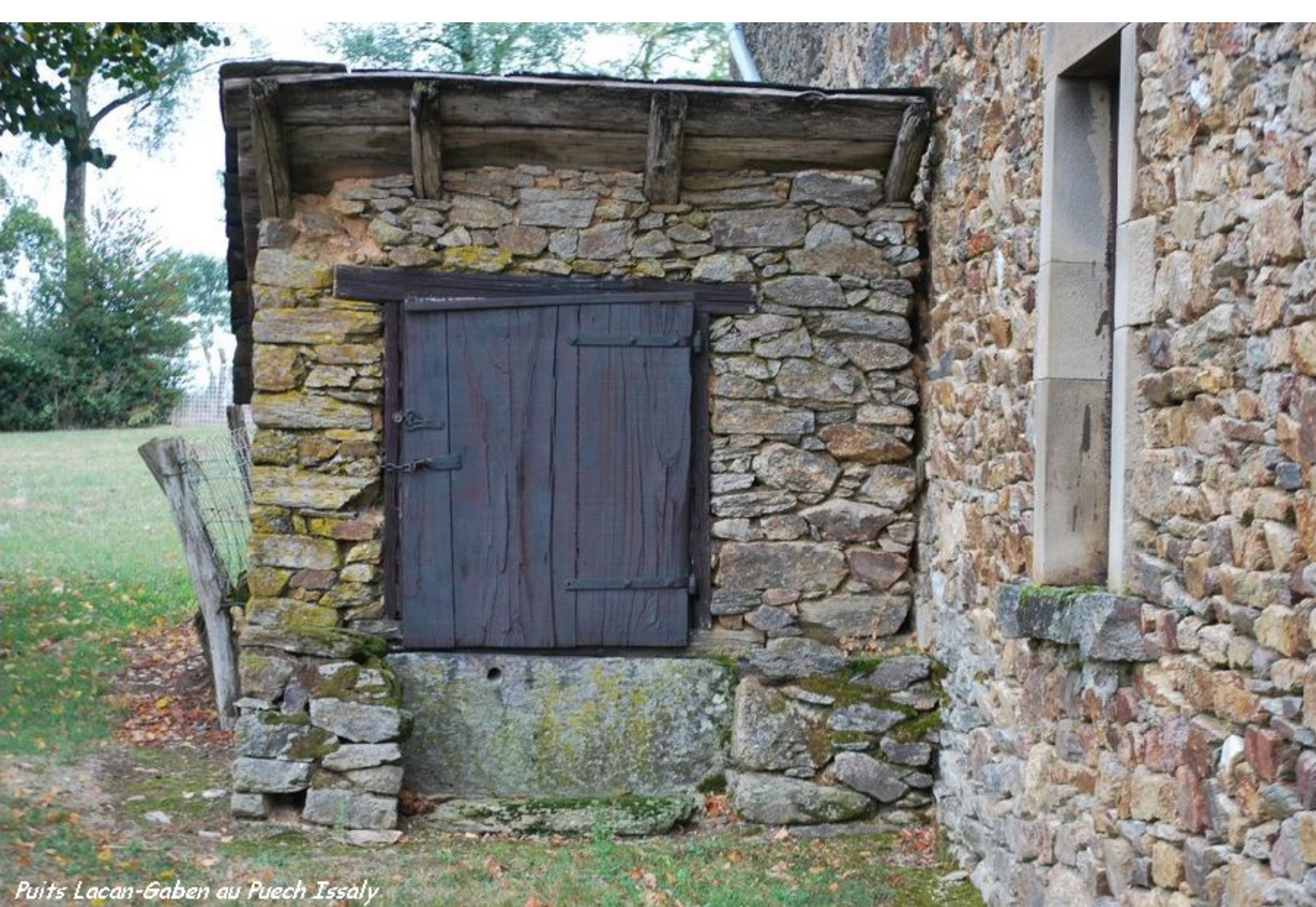
Puits Lacan-Gaben au Puech Issaly