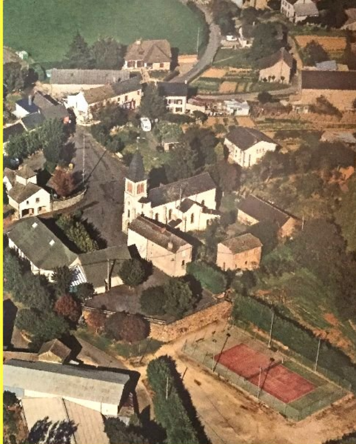
Rullac St-Cirq (Années 2000)