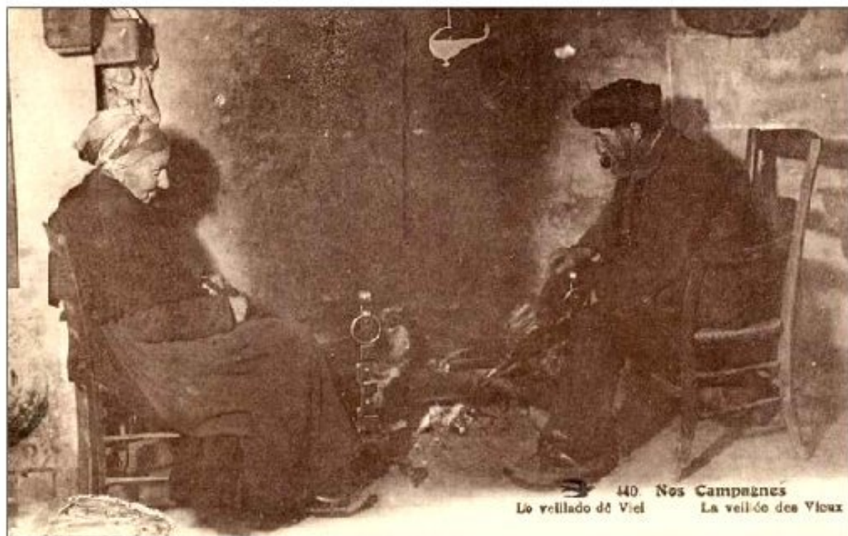
40. Nos Campagnes La veillée de Viel La veillée des Vieux

« Le Rouergue Républicain » du 7 novembre 1952