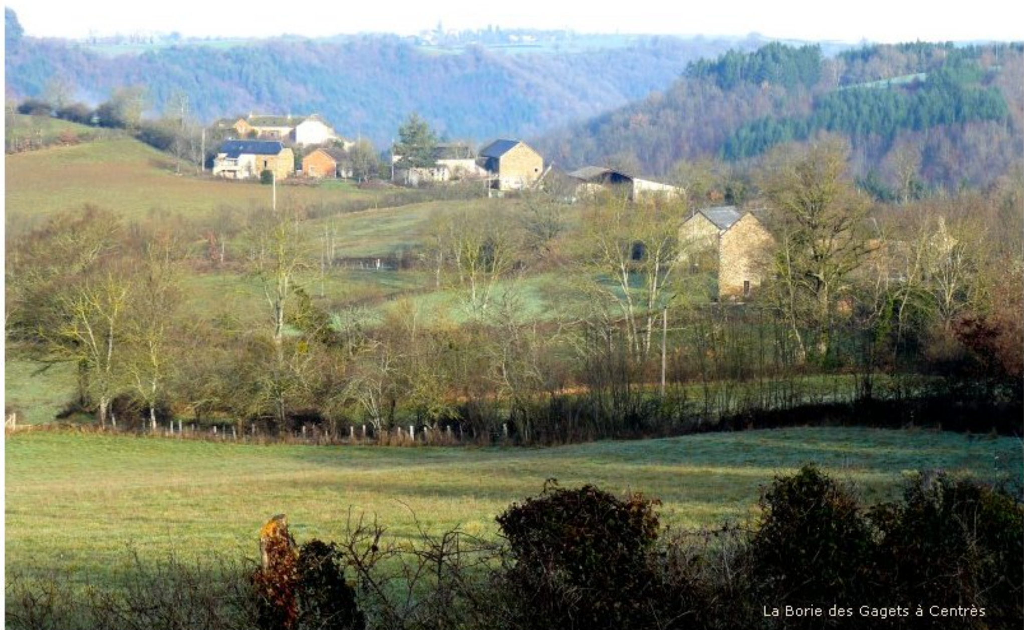
La Borie des Gagets à Centrès