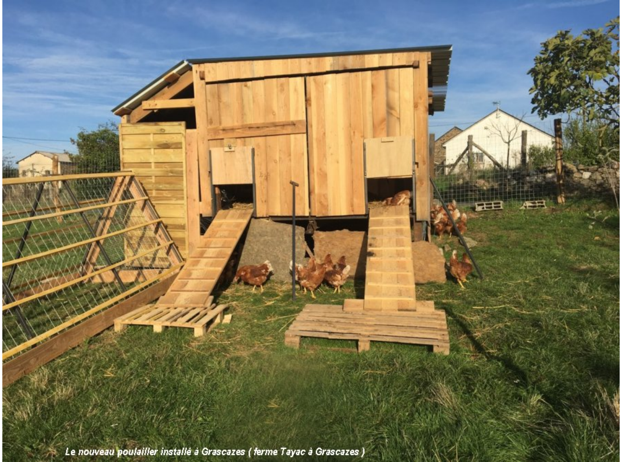
Le nouveau poulailler installé à Grascazes ( ferme Tayac à Grascazes )