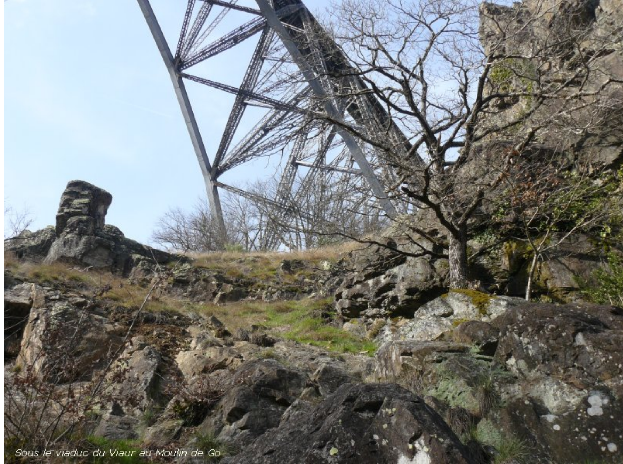
Sous le viaduc du Vaur au Moulin de Go