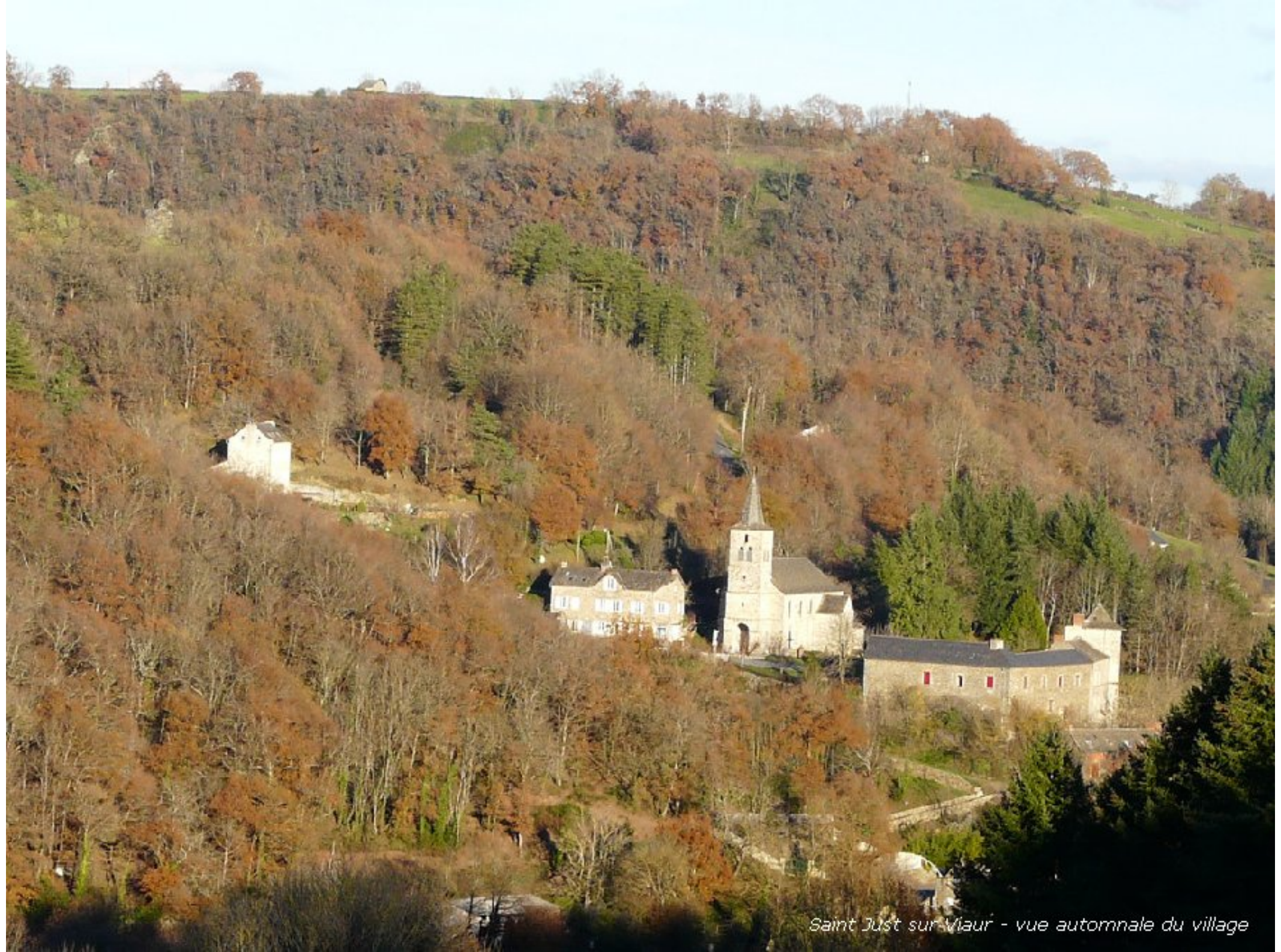
Saint Just sur Vialar - vue automnale du village