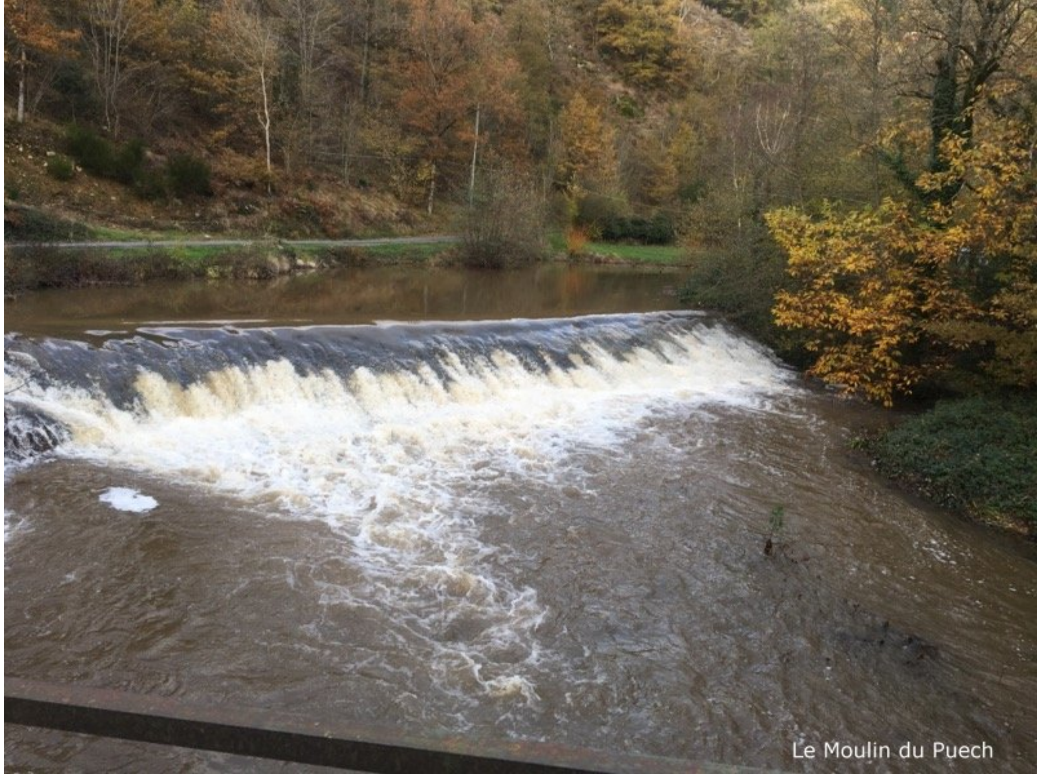
Le Moulin du Puech