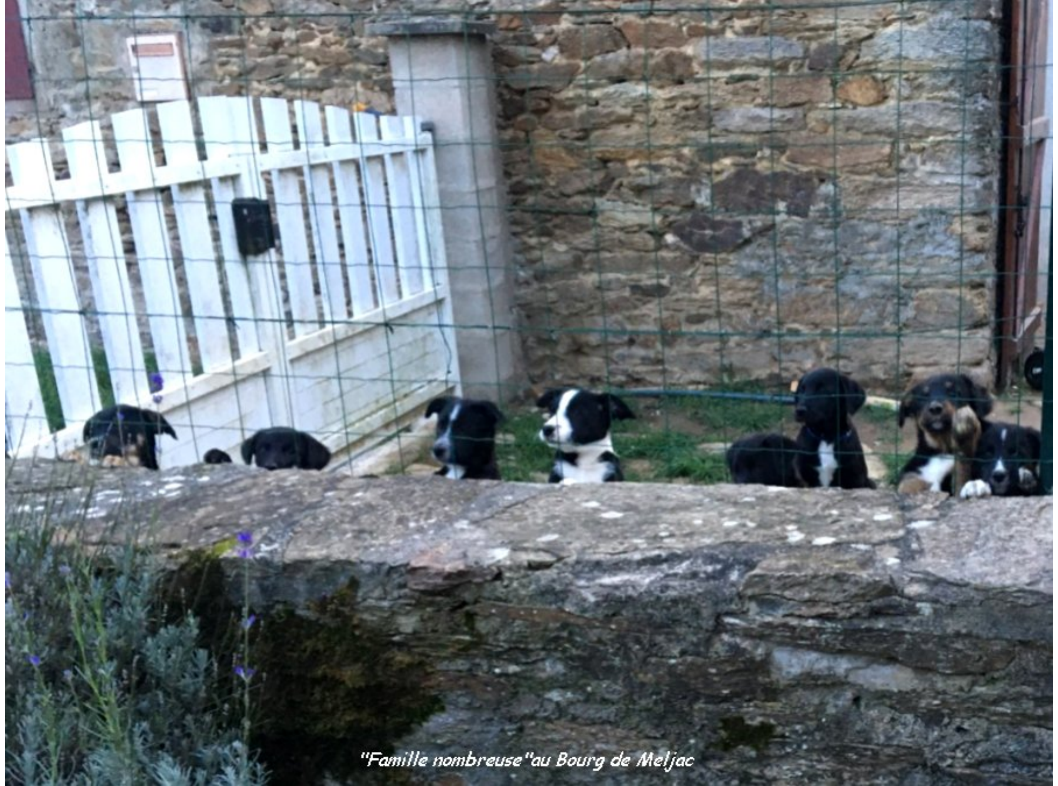
"Famille nombreuse" au Bourg de Meljac