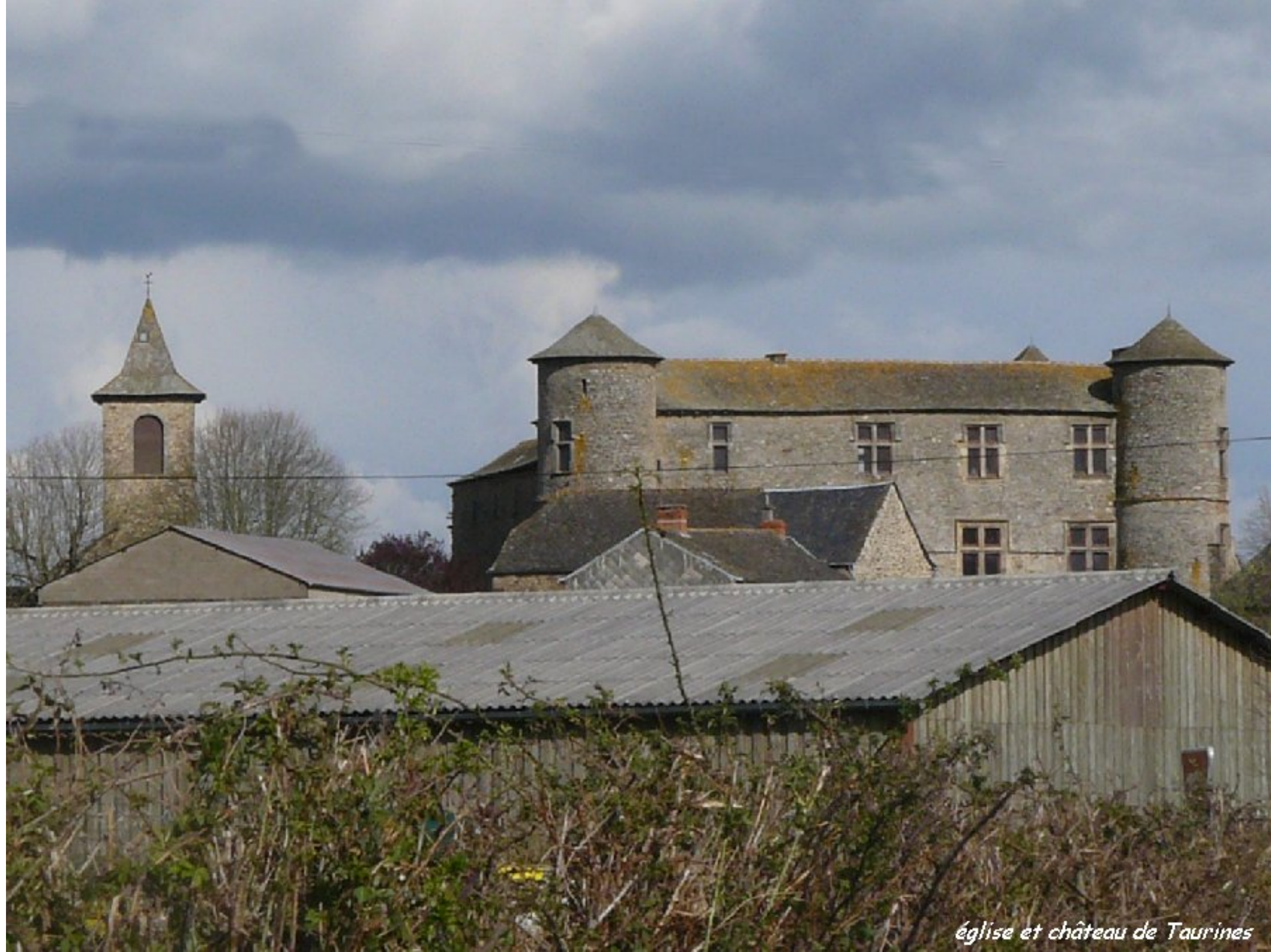
église et château de Taurines