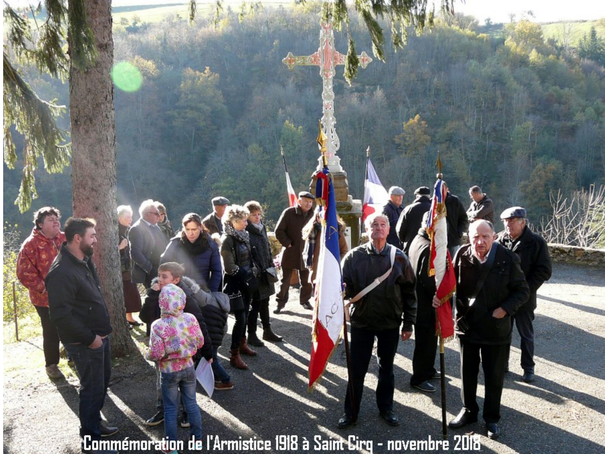
Commémoration de l'Armistice 1918 à Saint Cirq - novembre 2018