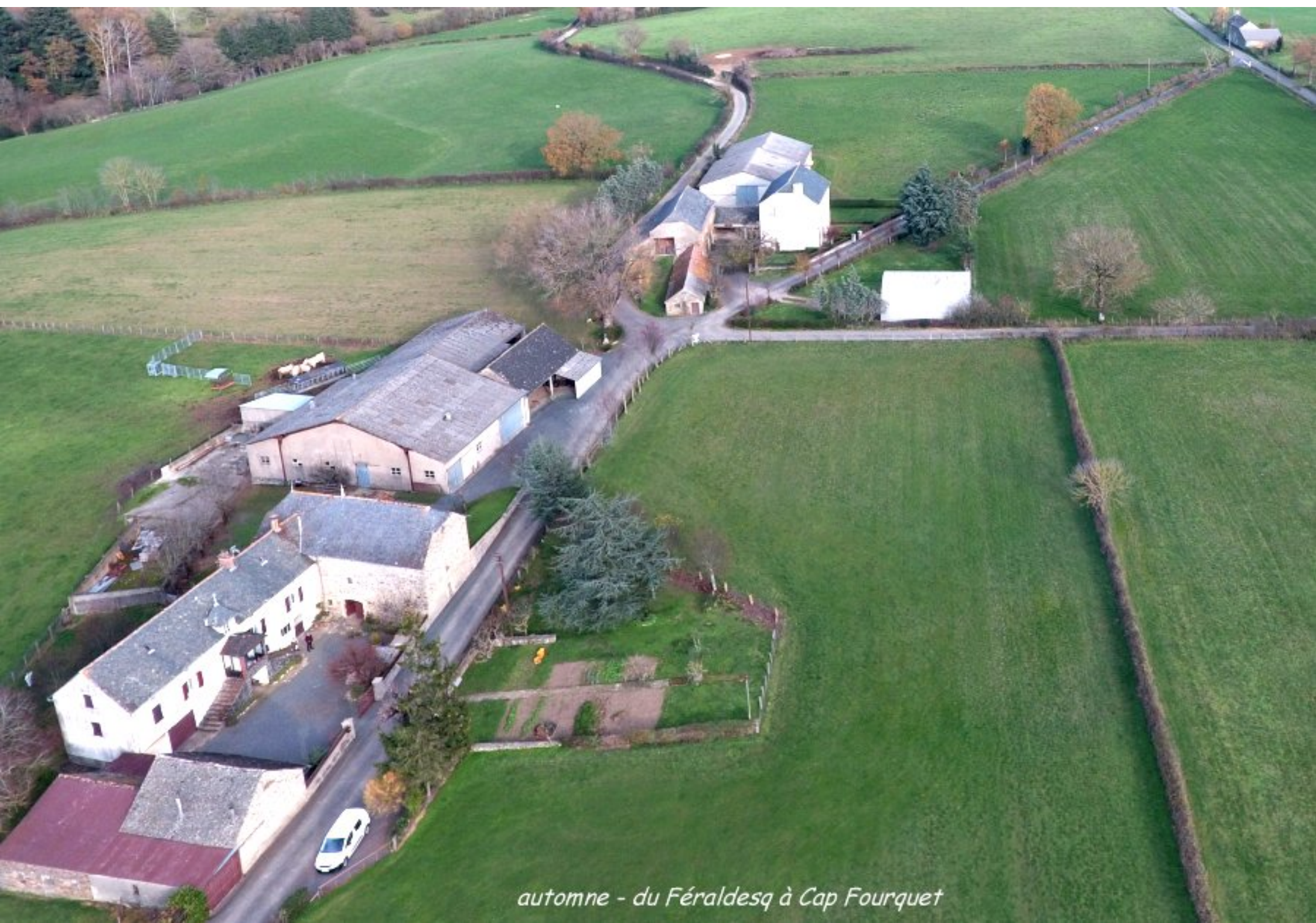
automne - du Féraldesq à Cap Fourquet