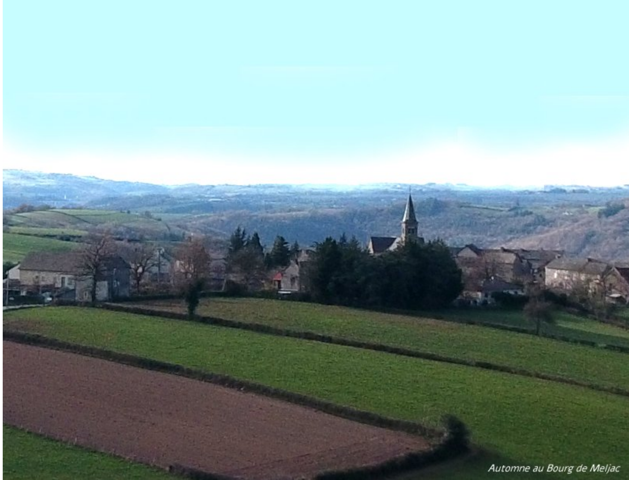
Automne au Bourg de Meljac