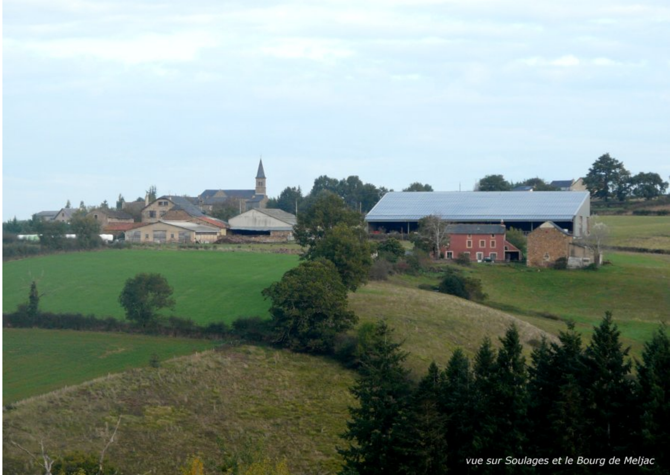
vue sur Soulages et le Bourg de Meljac