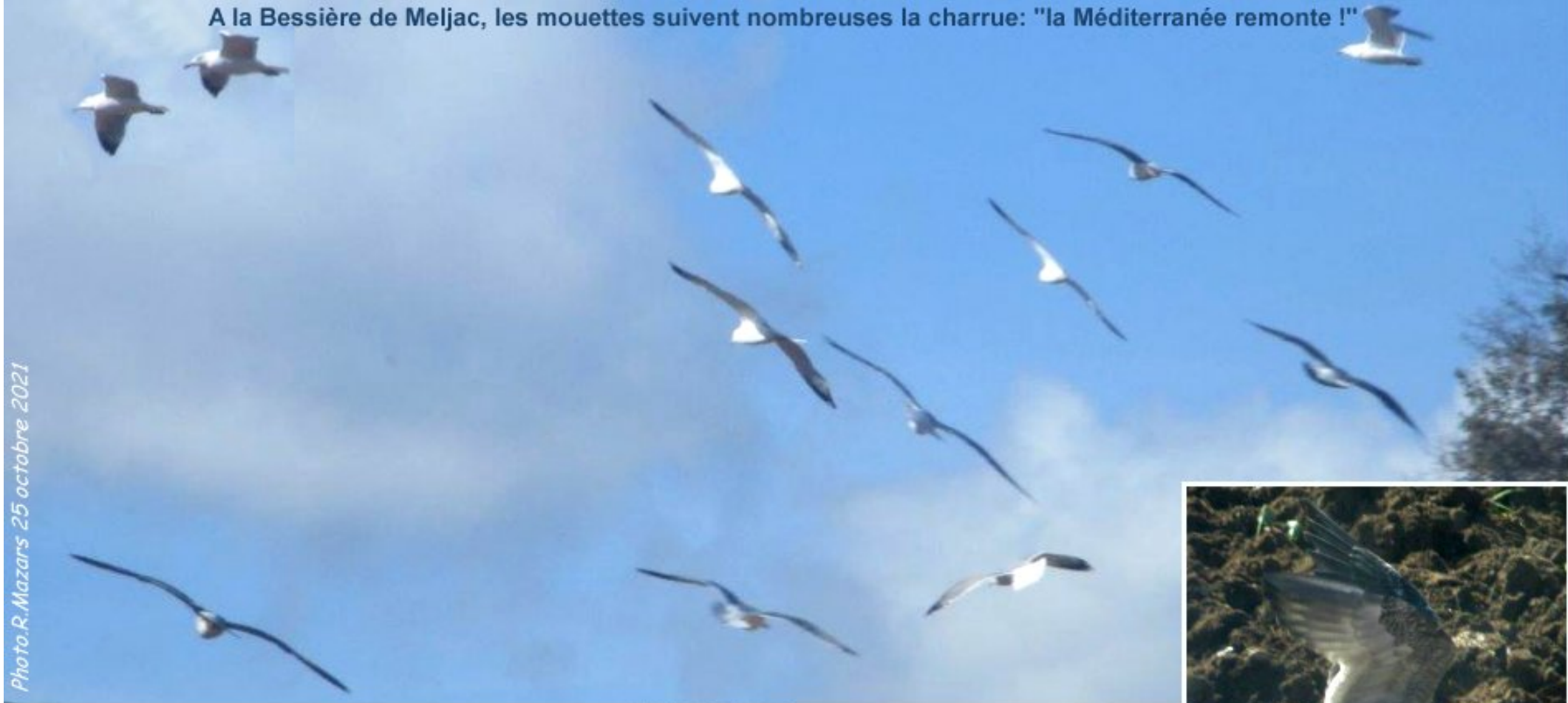
25 octobre 2021

A la Bessière de Meljac, les mouettes suivent nombreuses la charrue: "la Méditerranée remonte !"