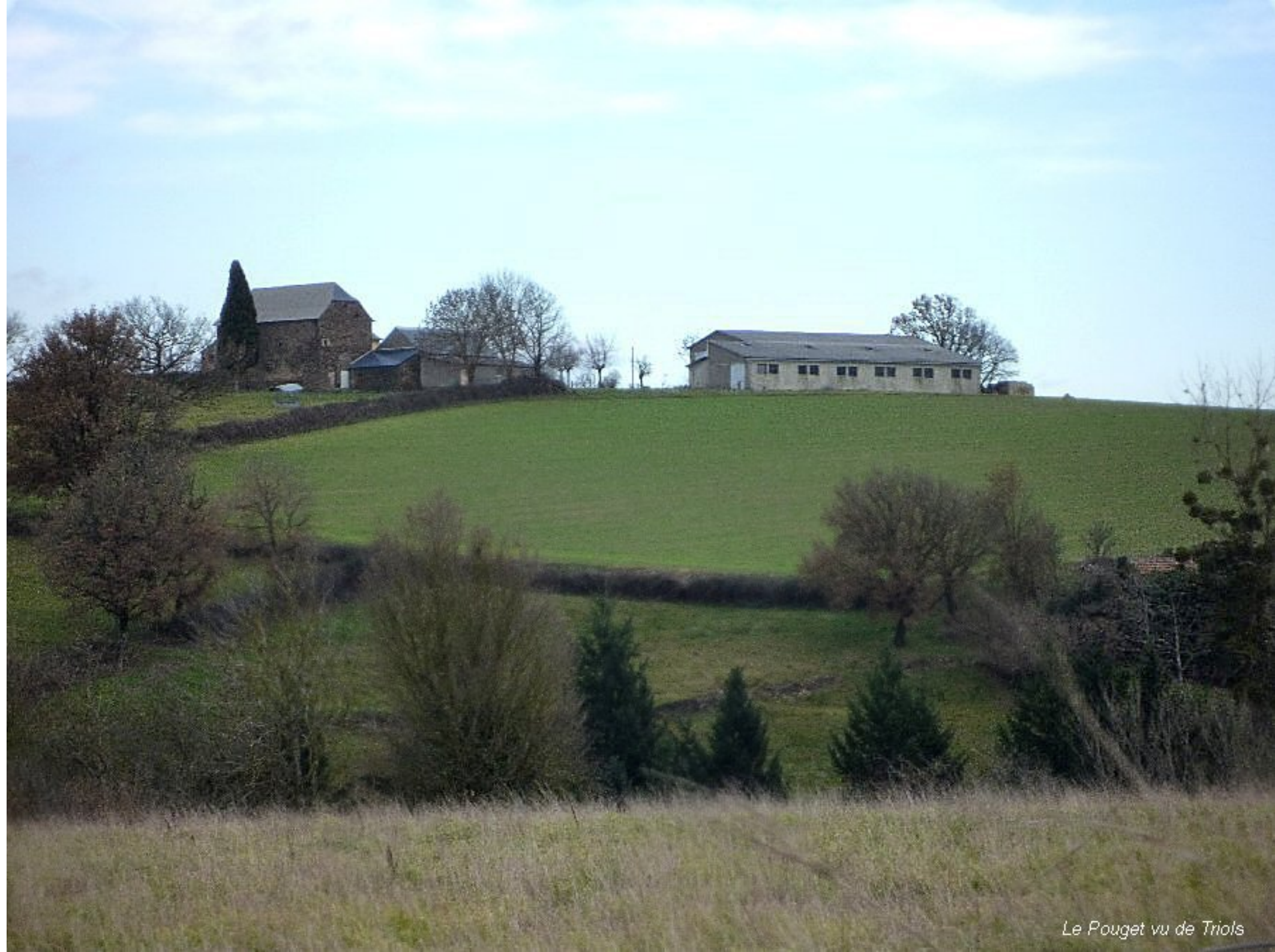
Le Pouget vu de Triols