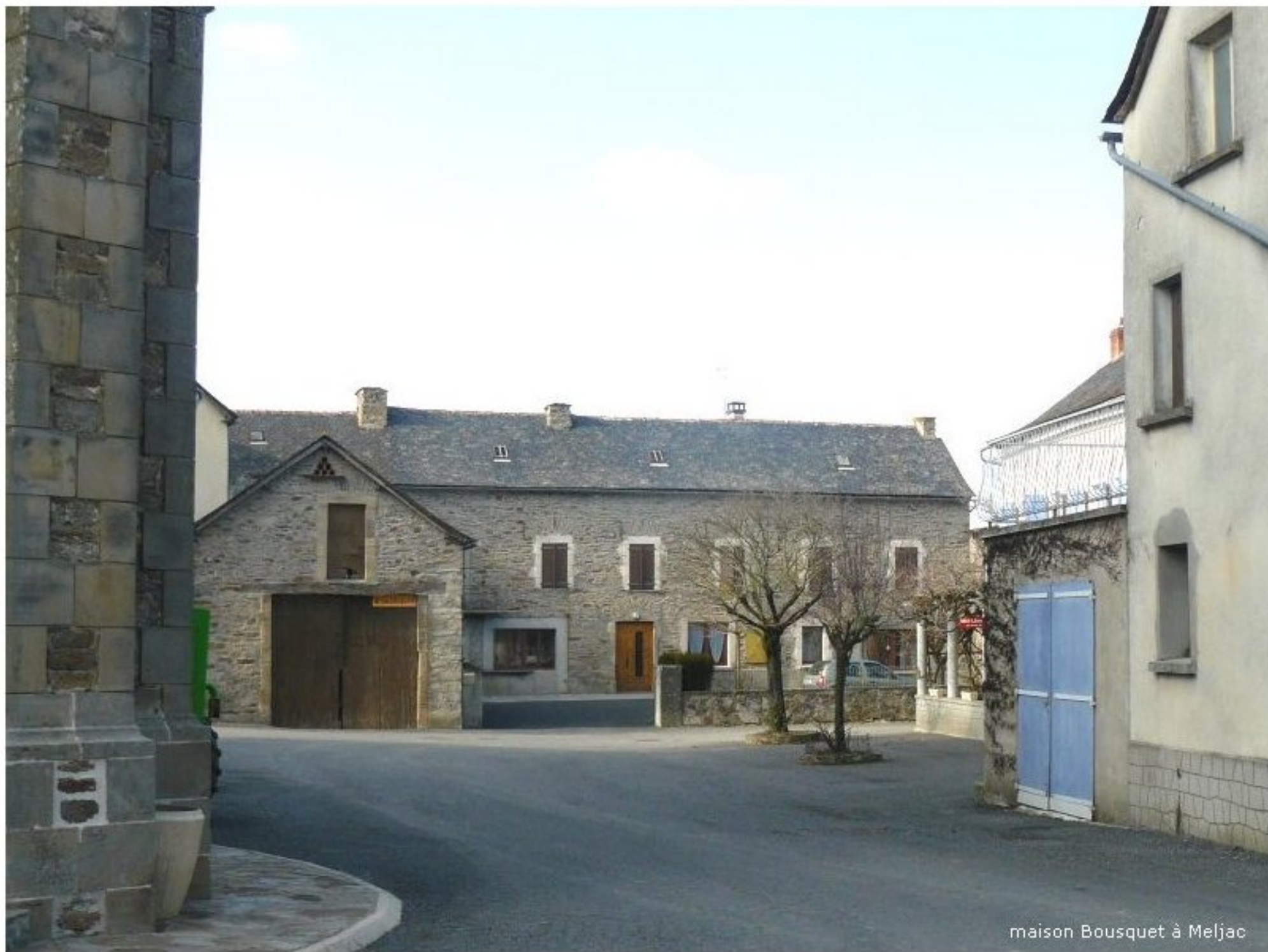
maison Bousquet à Meljac