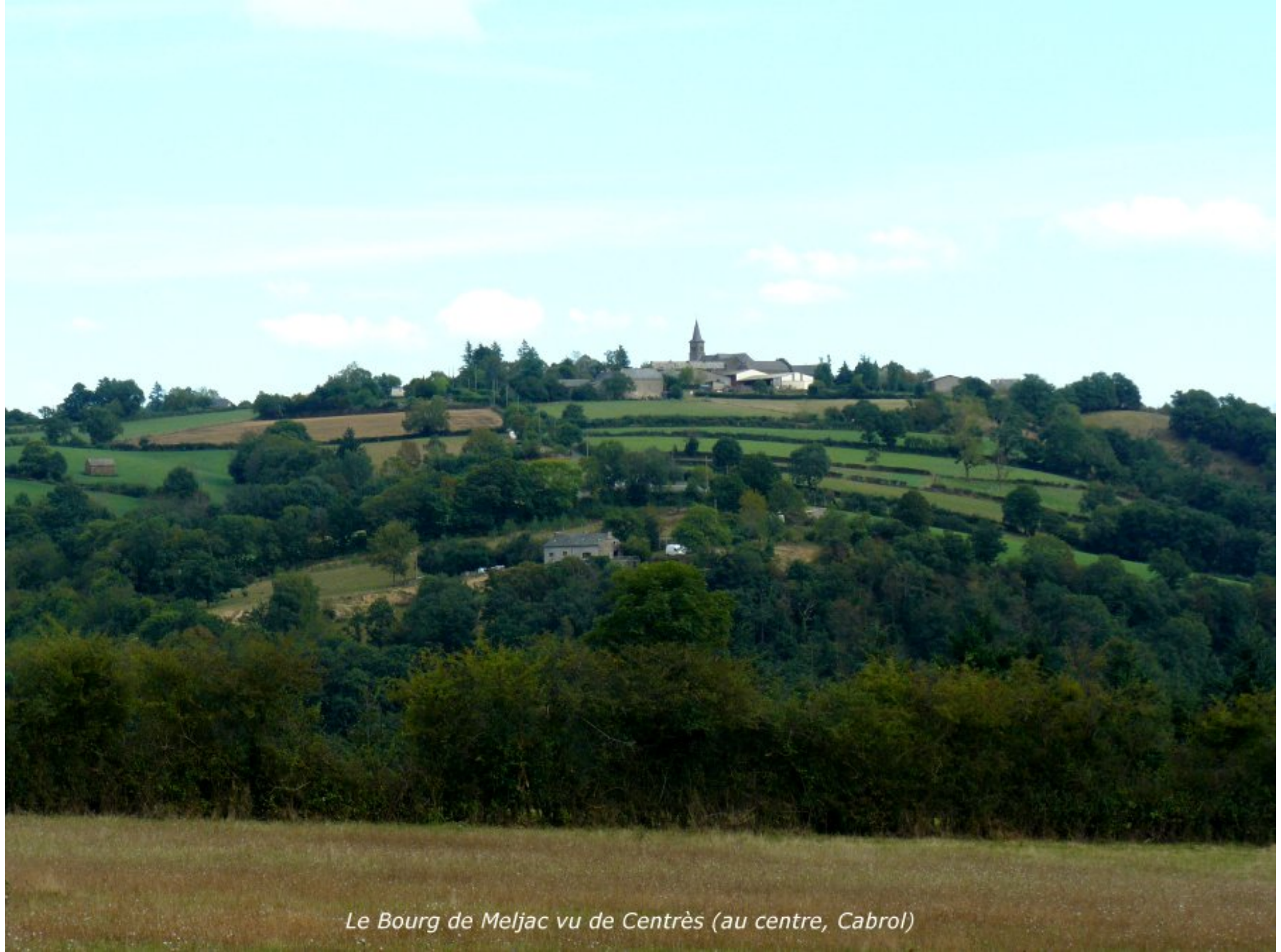
Le Bourg de Meljac vu de Centrès (au centre, Cabrol)