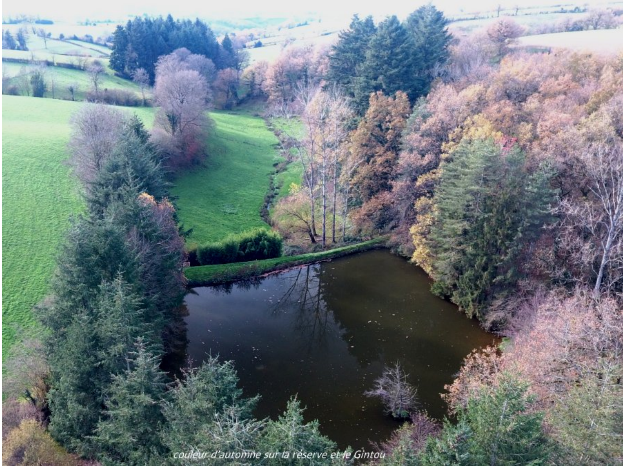
couleur d'automne sur la réserve et le Gintou