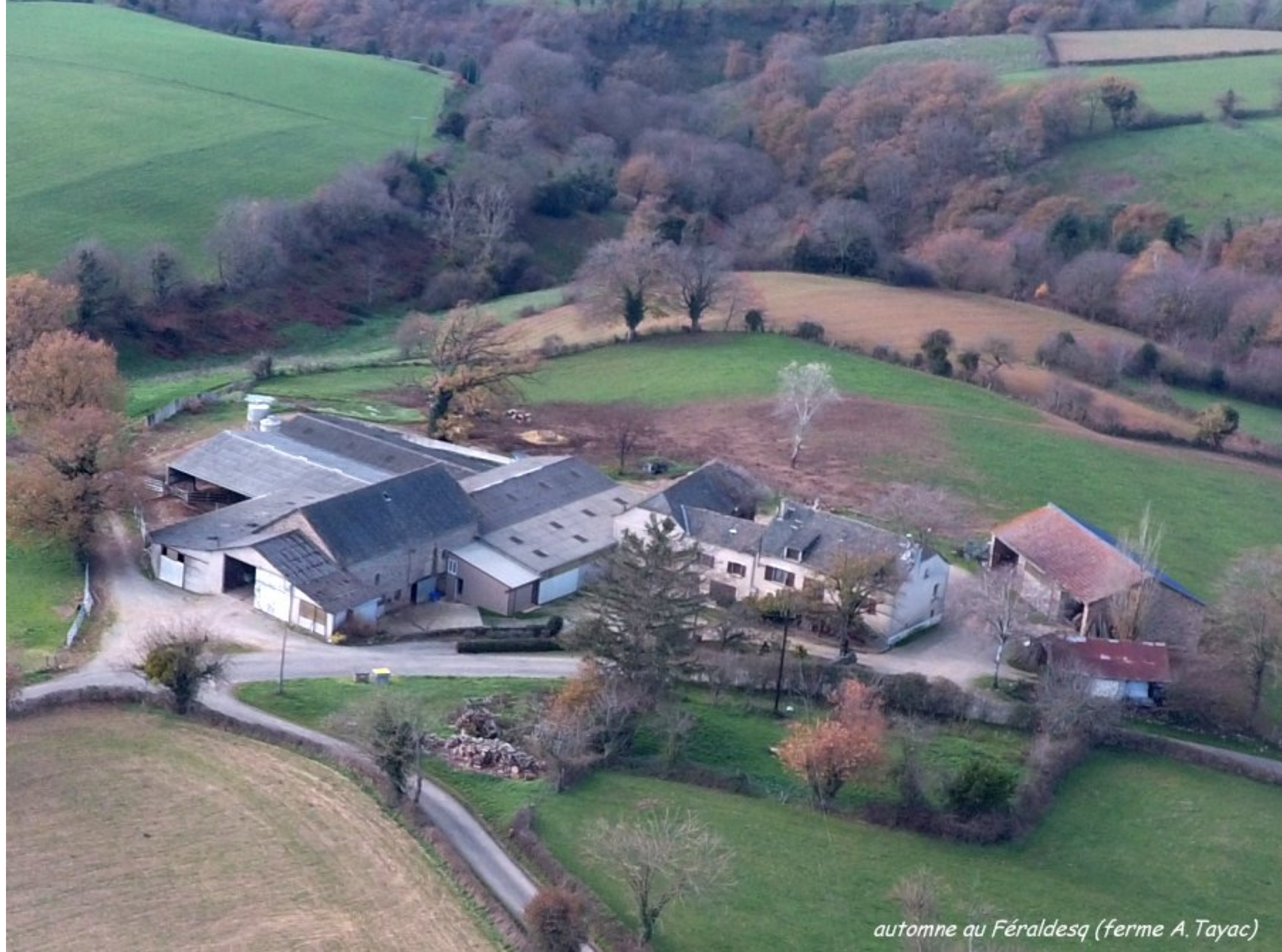
automne au Féraldesq (ferme A. Tayac)