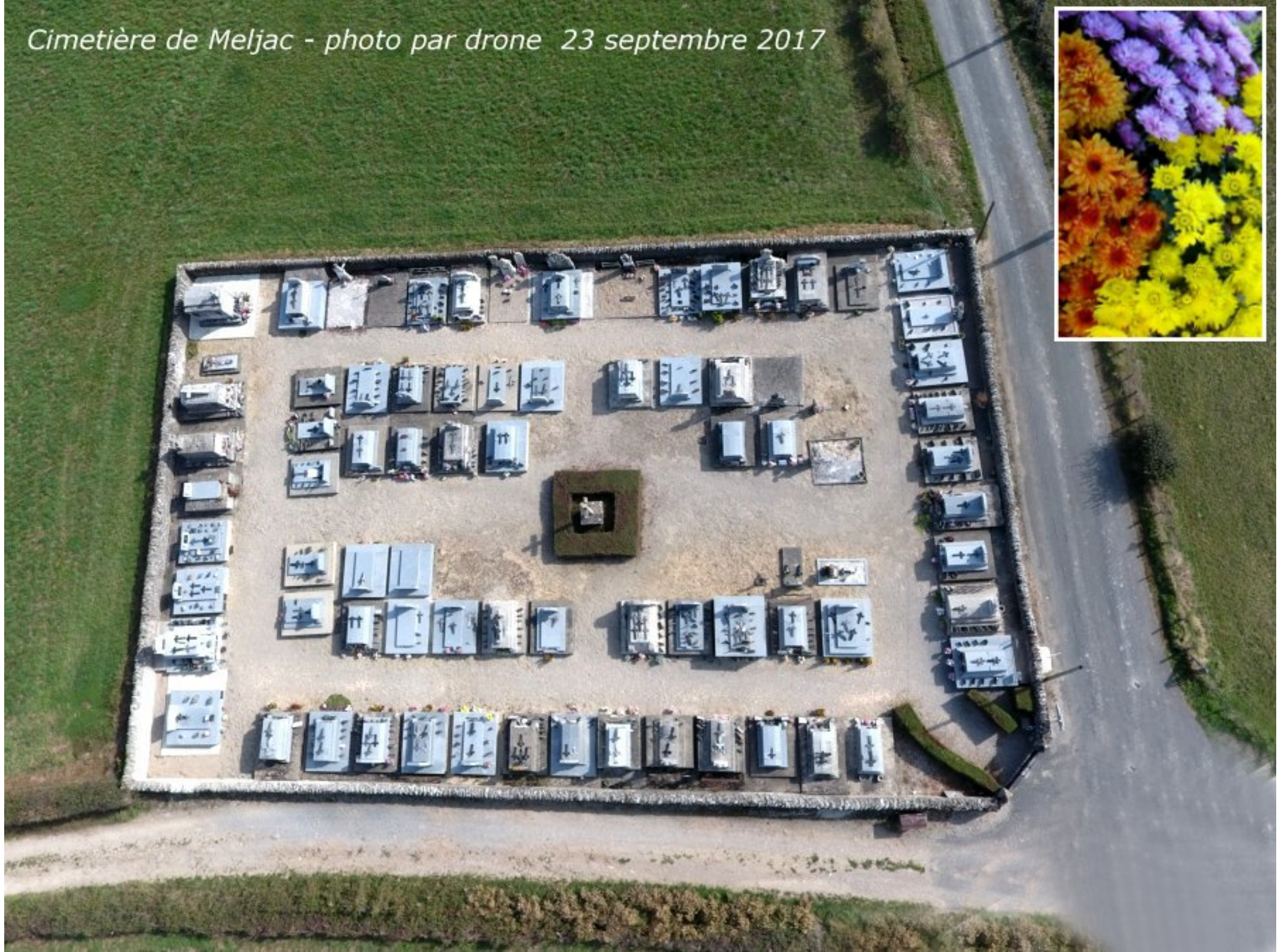
Cimetière de Meljac - photo par drone 23 septembre 2017