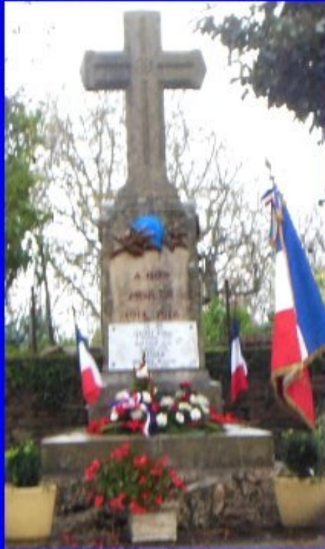
MELJAC 9h45 - dépôt d'une gerbe au monument aux morts par le maire Pierre BOUSQUET.