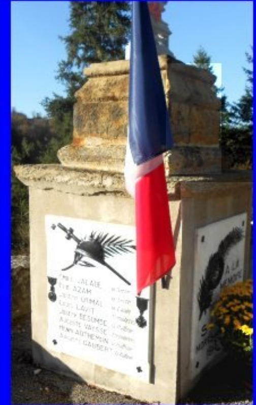
SAINT-CIRQ - honneur aux inscrits sur le monument et dépôt d'une composition florale par le maire Patrik ROBERT

C'est à Rullac, cette année 2021 que se rassembleront tous les participants à la célébration annuelle des anciens combattants