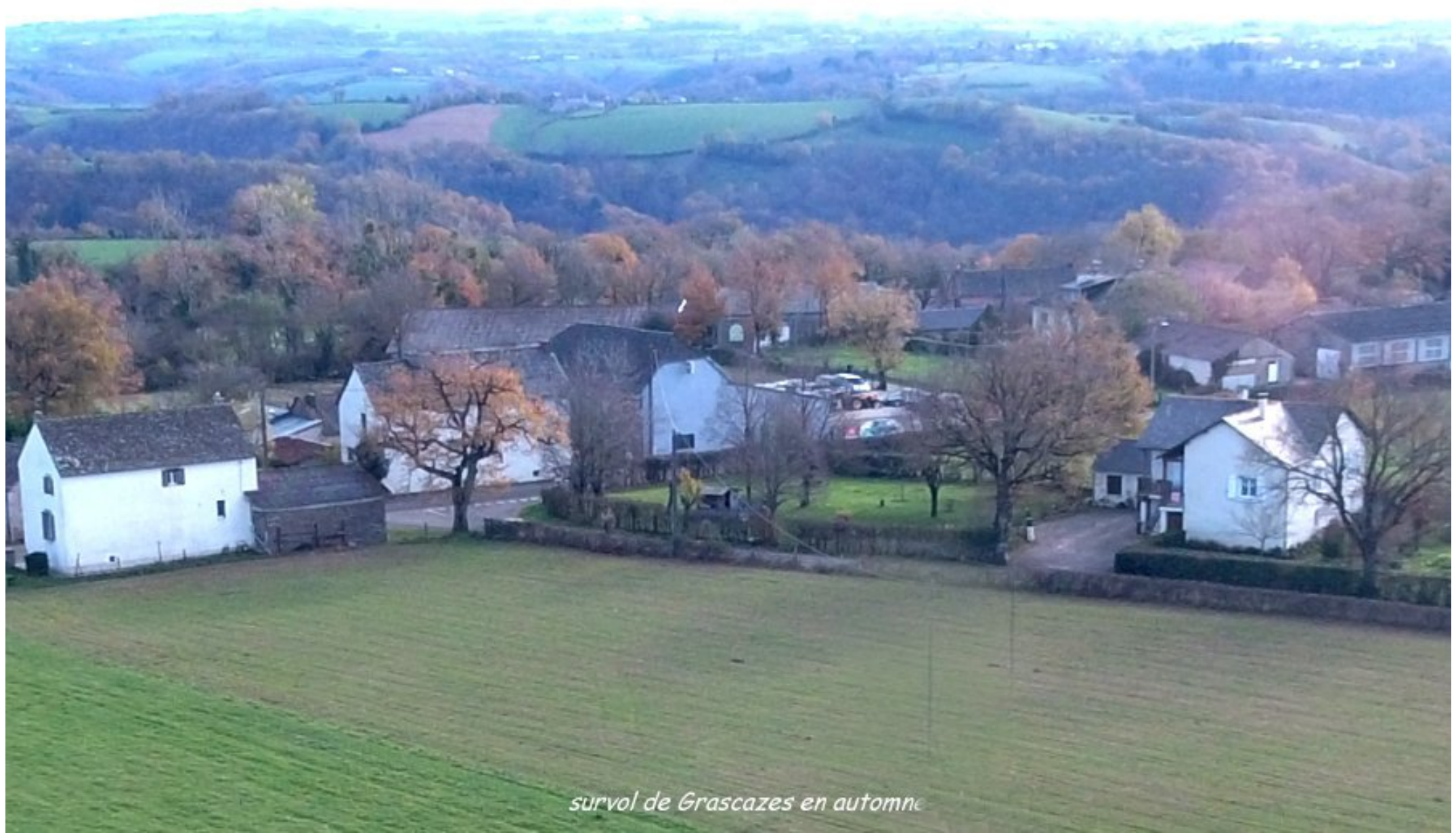
survol de Grascazes en automne