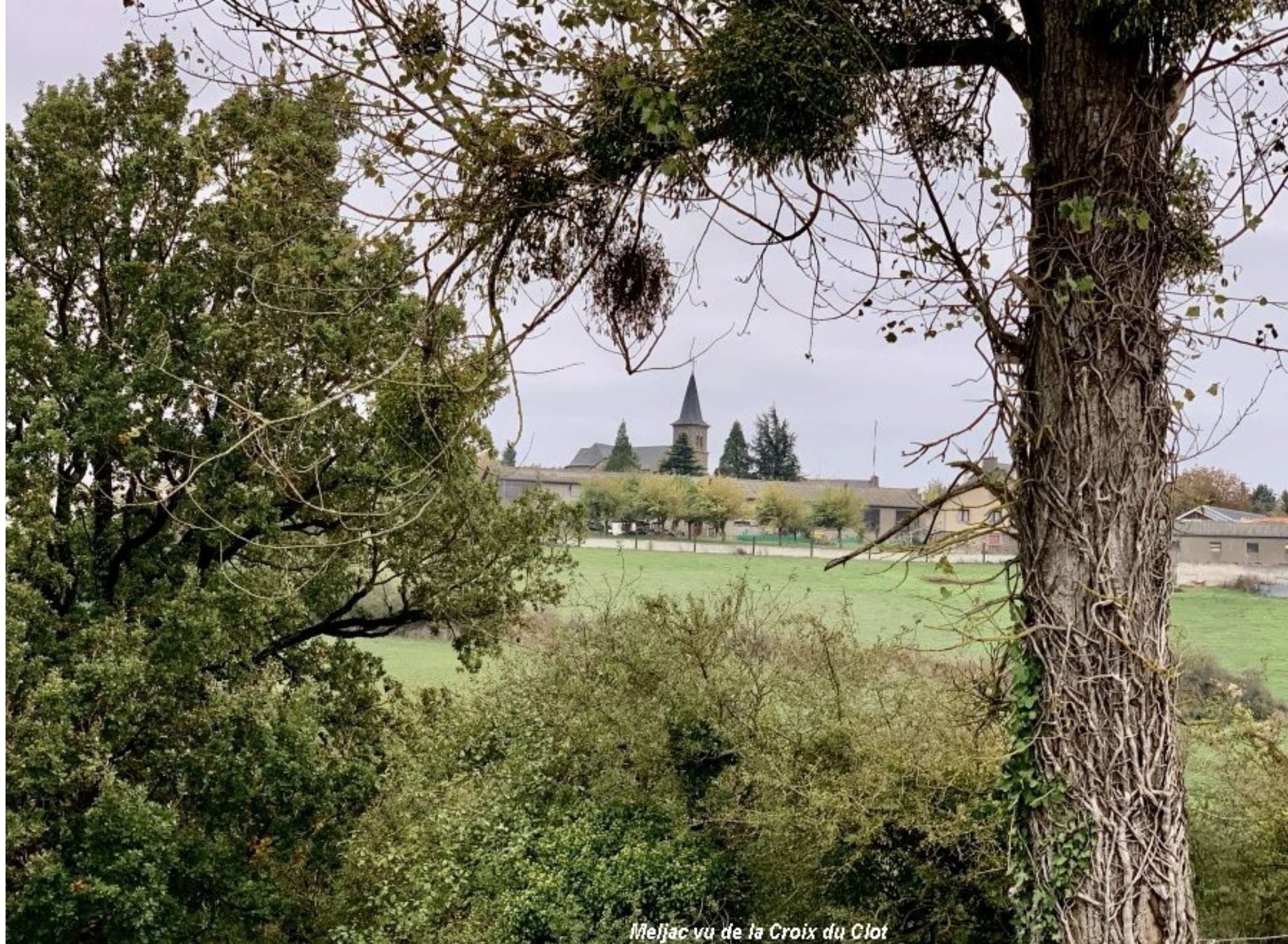
Meljac vu de la Croix du Clot

aujourd'hui 17 novembre 2024. date limite d'inscription au repas des aînés de Meliac du mardi 27 novembre