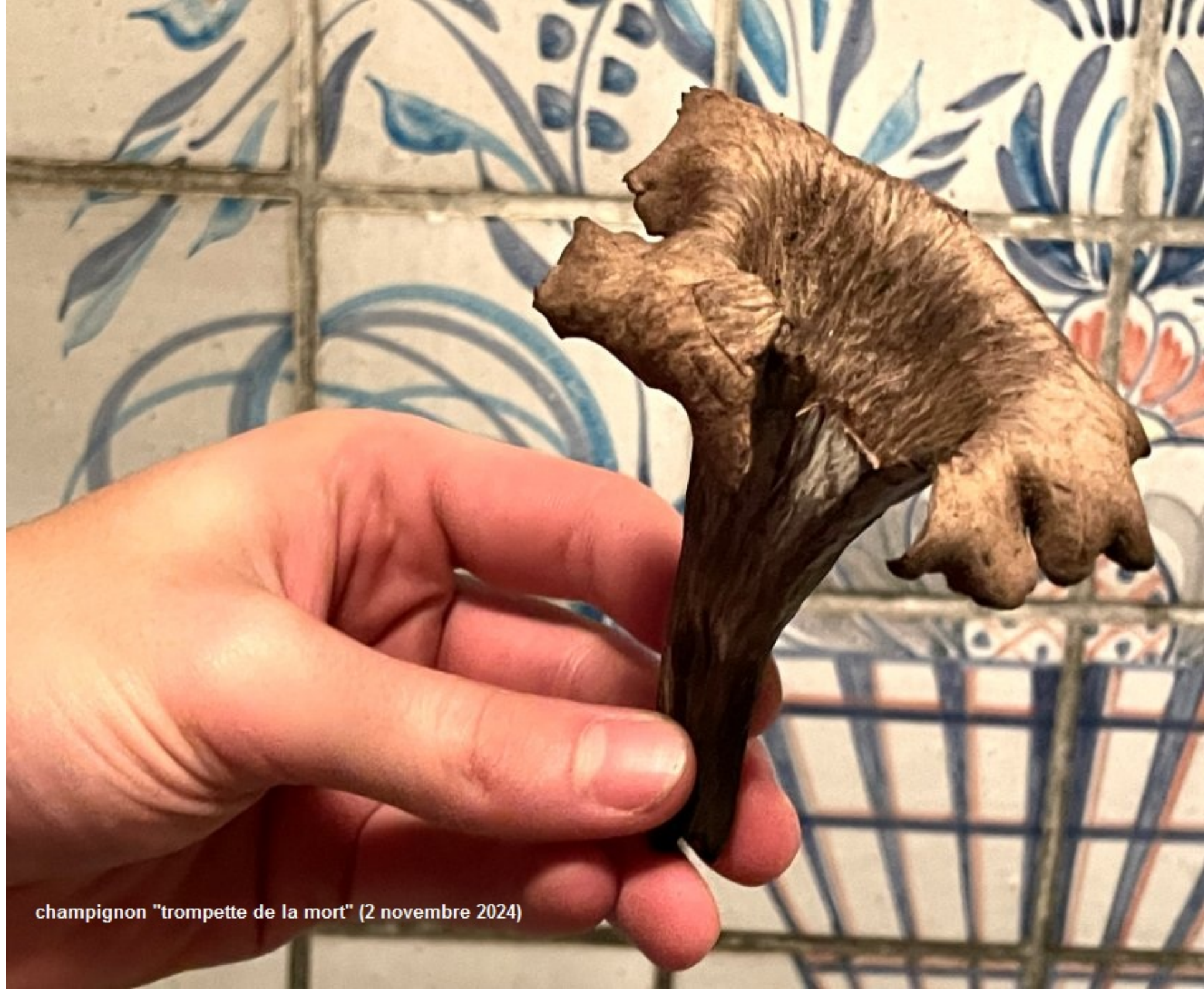
champignon "trompette de la mort" (2 novembre 2024)