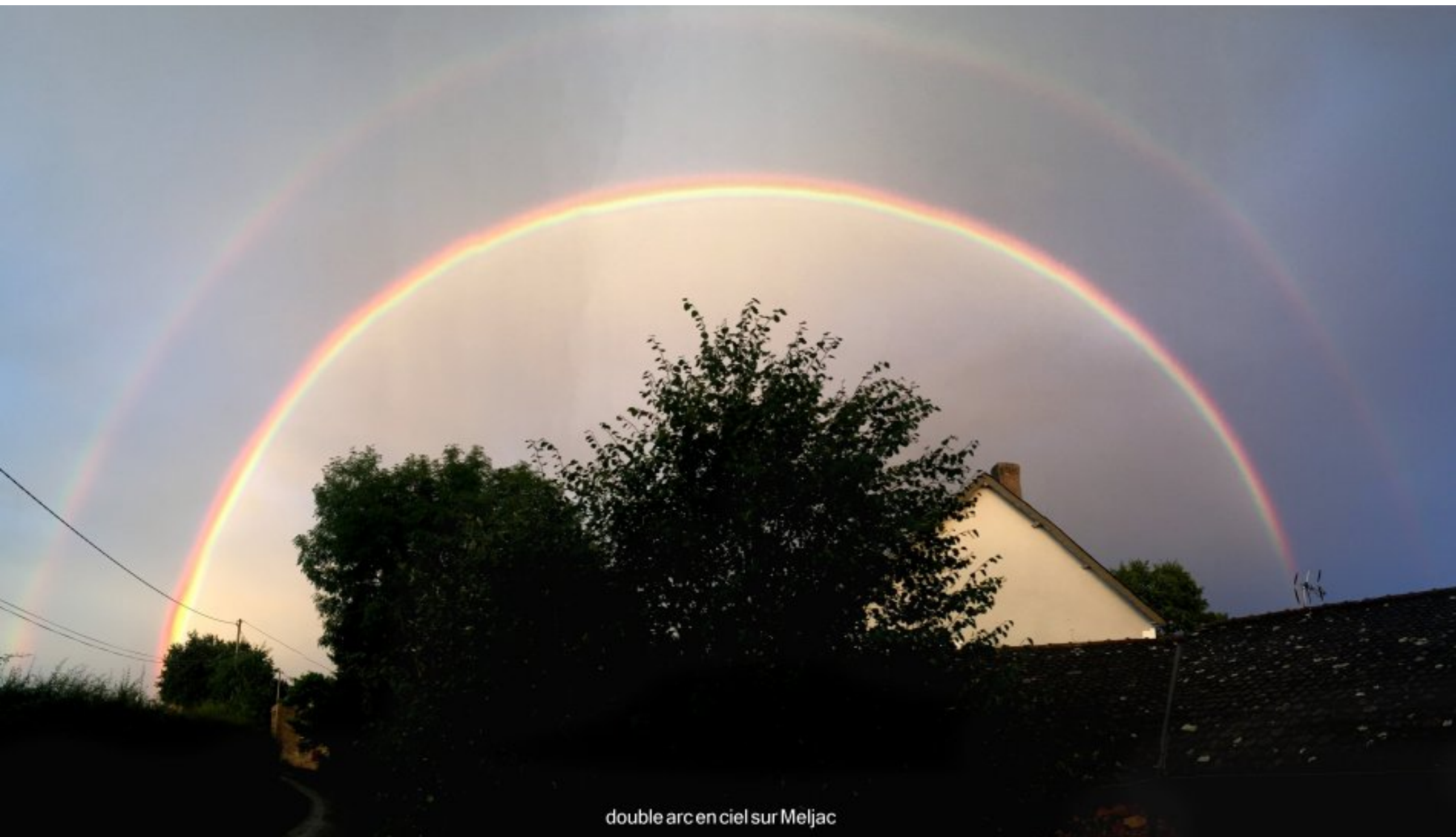
double arc en ciel sur Meljac