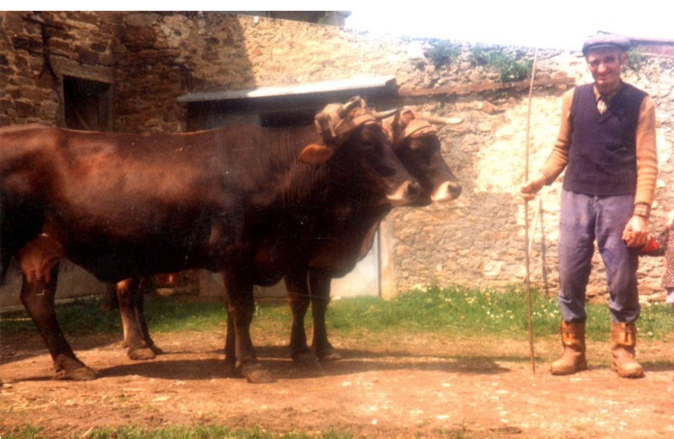
cette photo d'Eli Alary du Martinesq, "nous parle d'un temps que les moins de 20 ans ne peuvent pas connaître" (années 1970/80 ?)