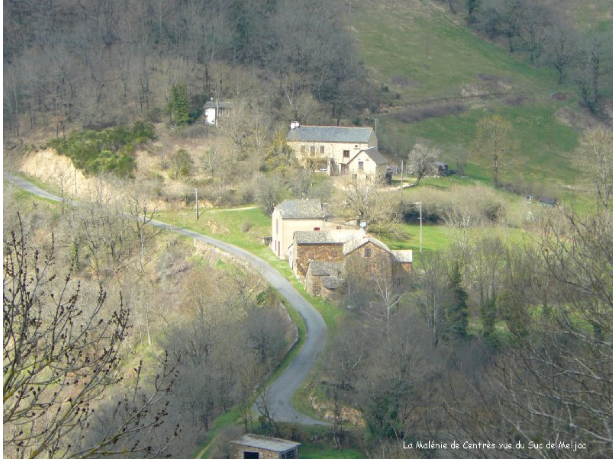
La Malénie de Centrès vue du Suc de Meljac