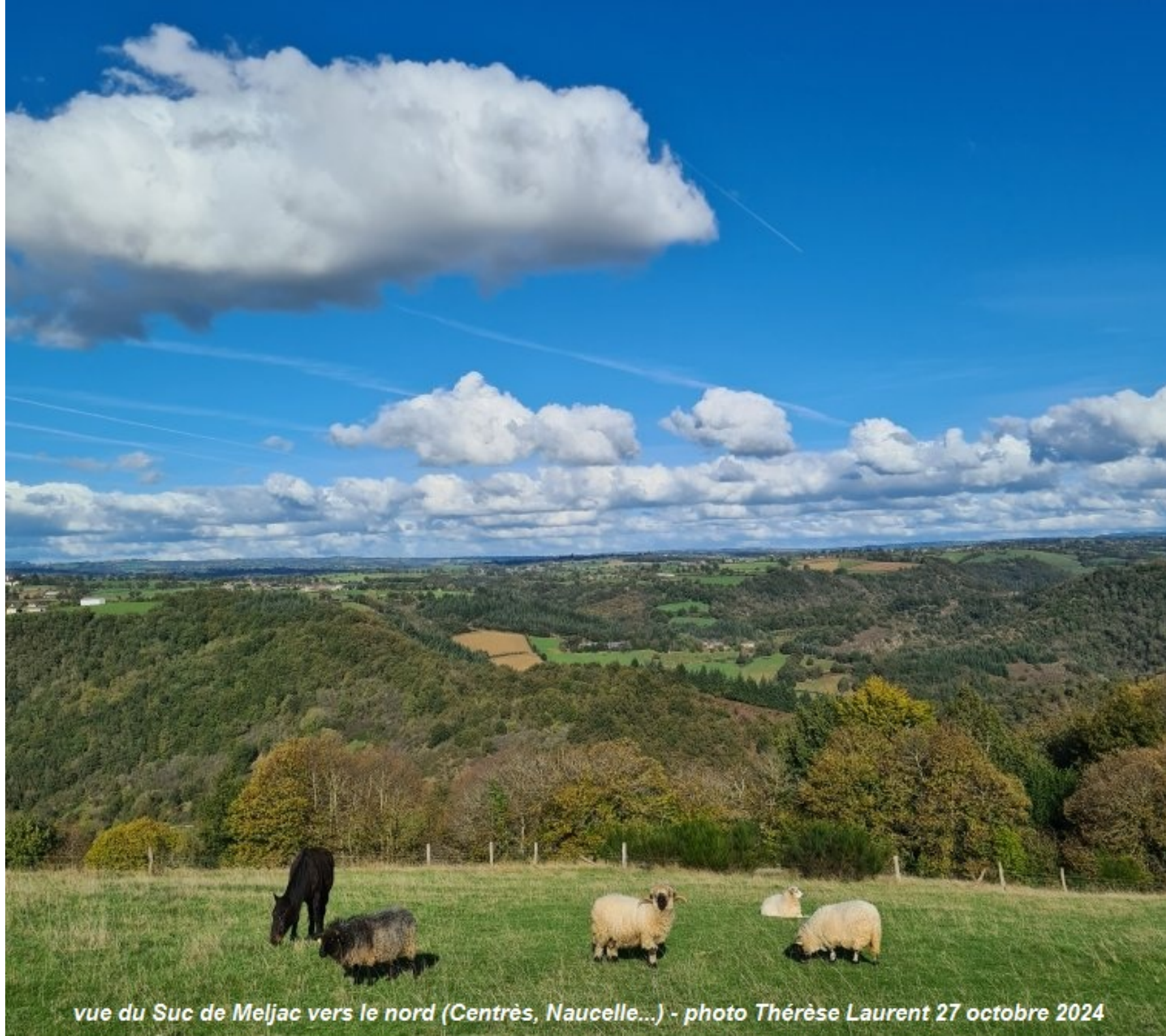
vue du Suc de Meljac vers le nord (Centrès, Naucelle...) - photo Thérèse Laurent 27 octobre 2024