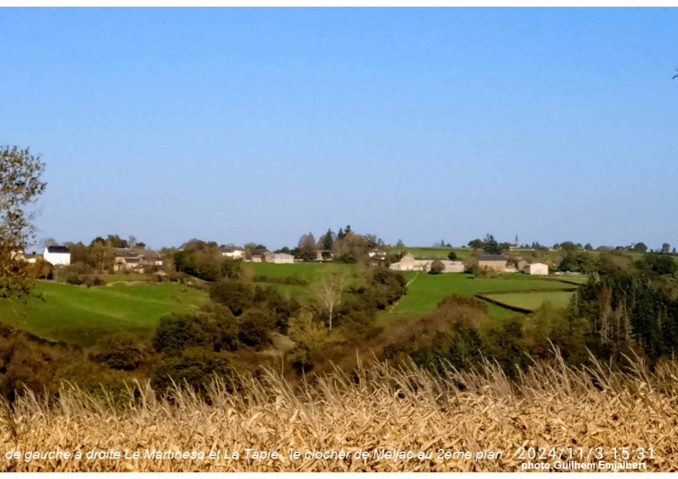
de gauche à droite Le Martinesq et La Tapie...le clocher de Meljac au 2ème plan 2024/11/3 15:31