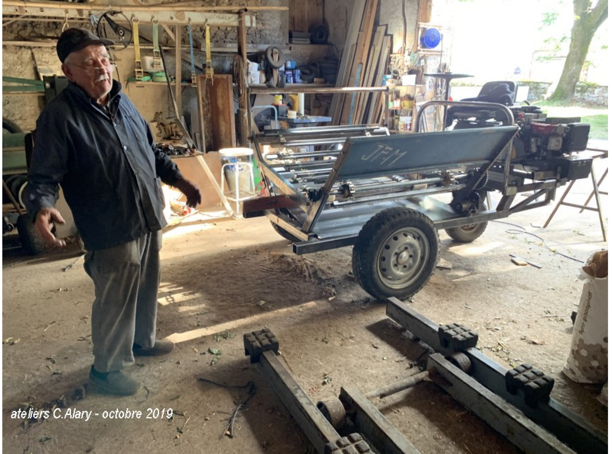
ateliers C.Alary - octobre 2019