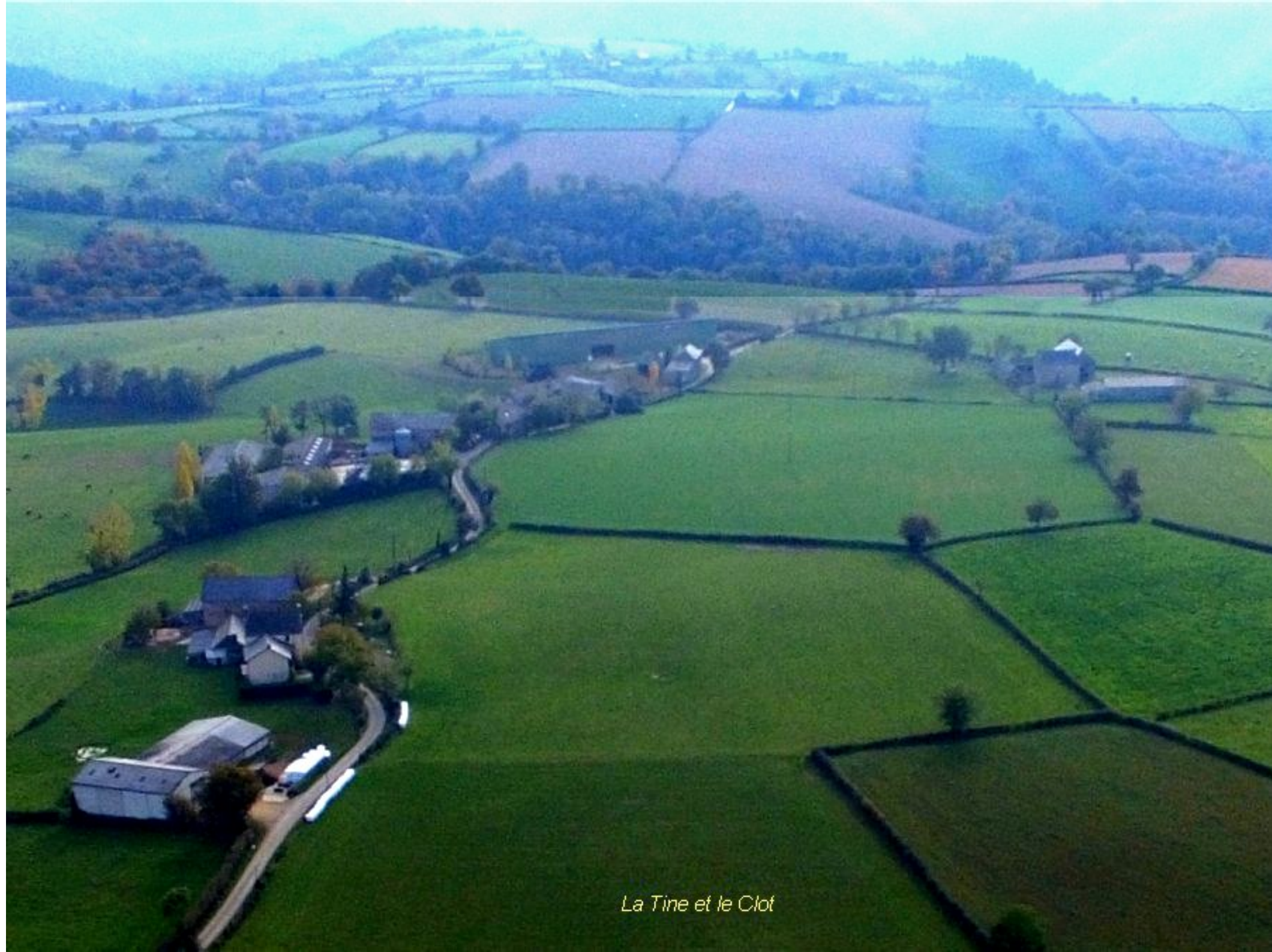
La Tine et le Clot