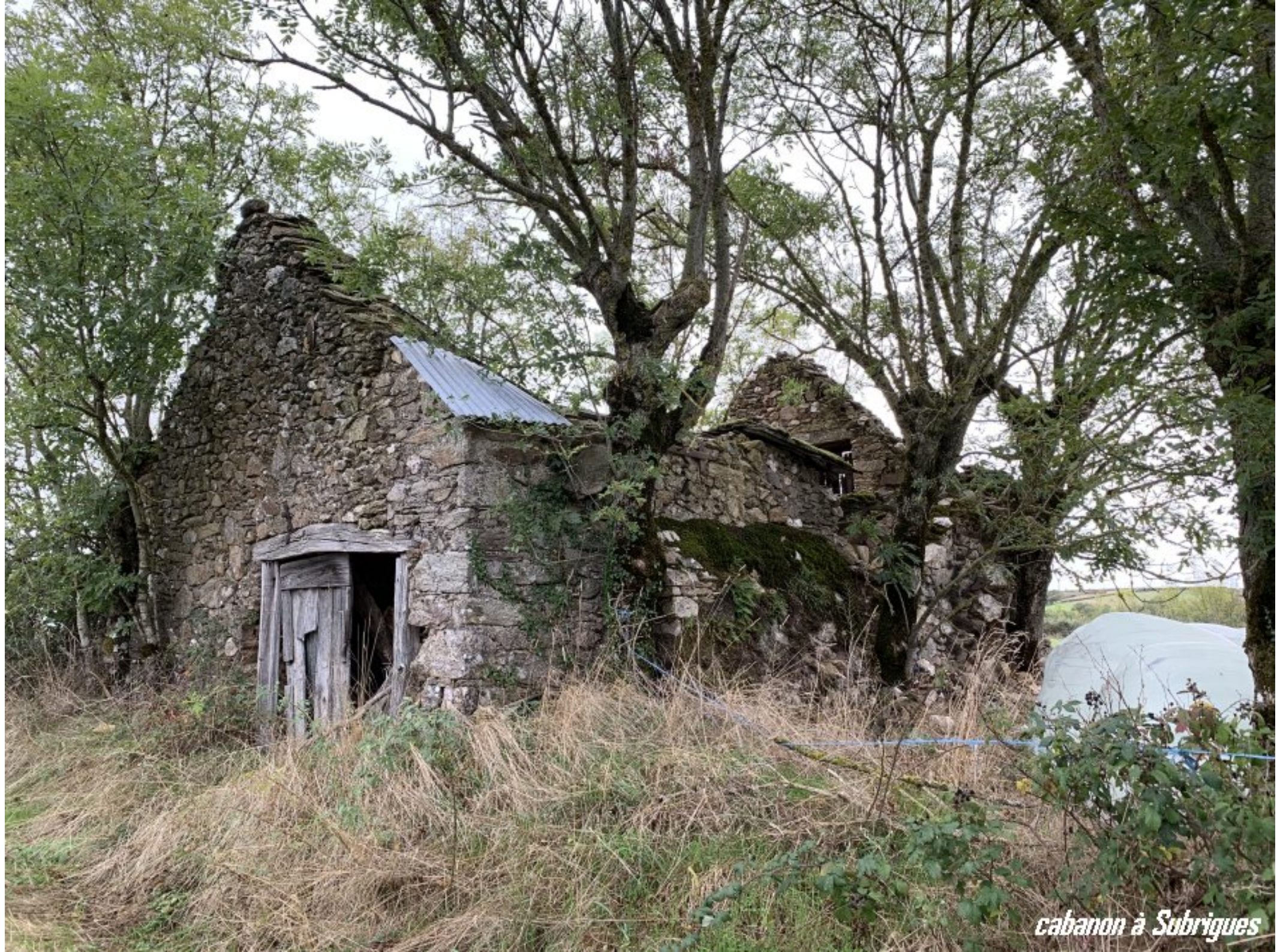
cabanon à Subrigues