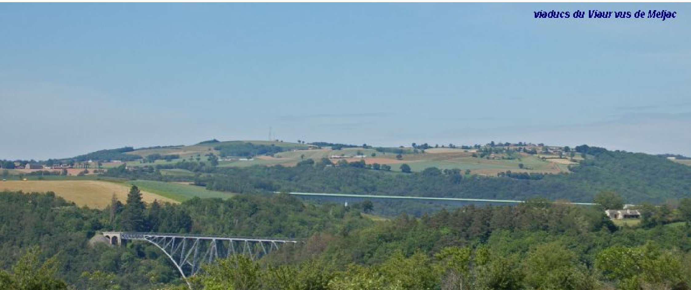
viaducs du Viaur vus de Meljac