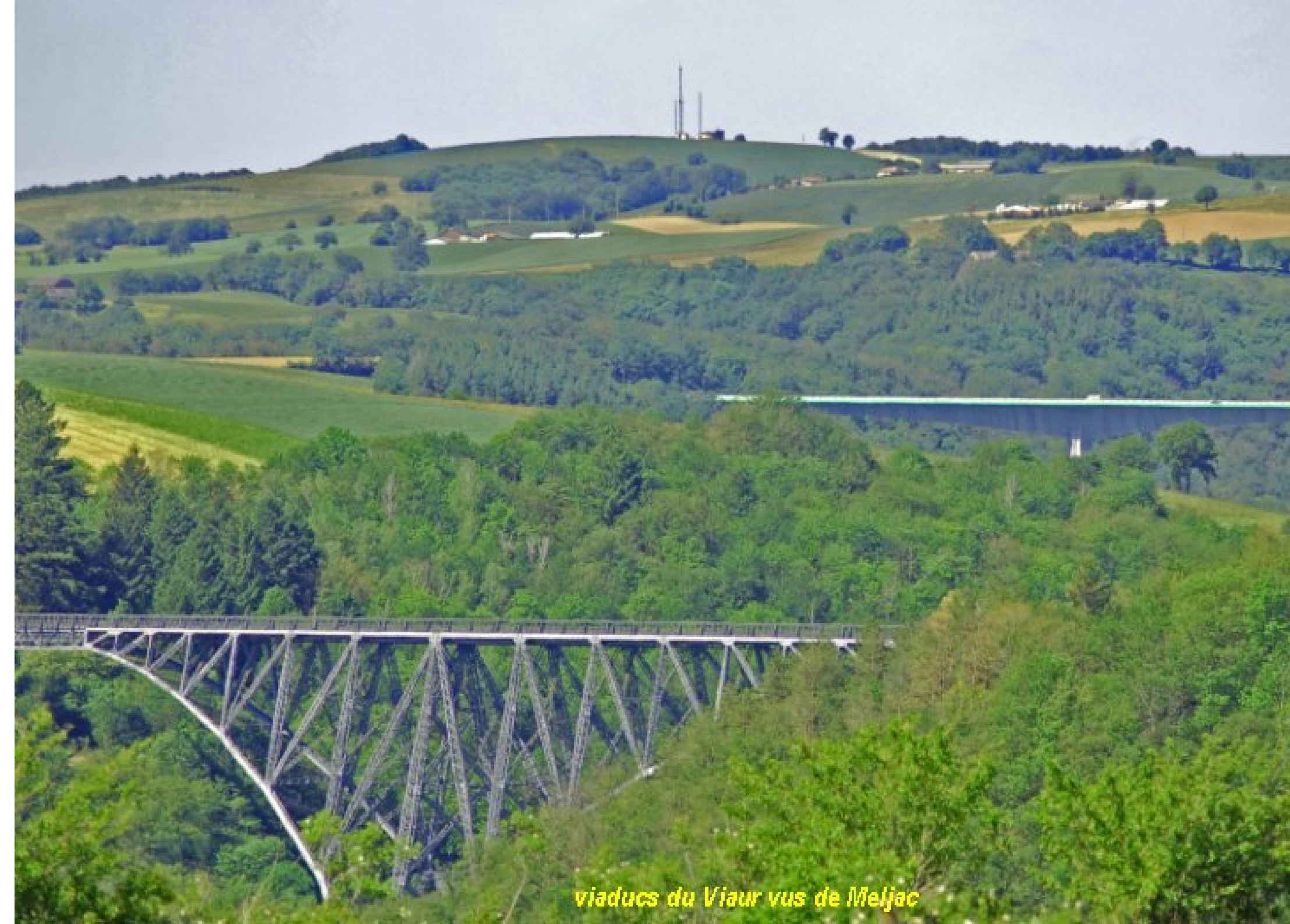
viaducs du Vaur vus de Meljac