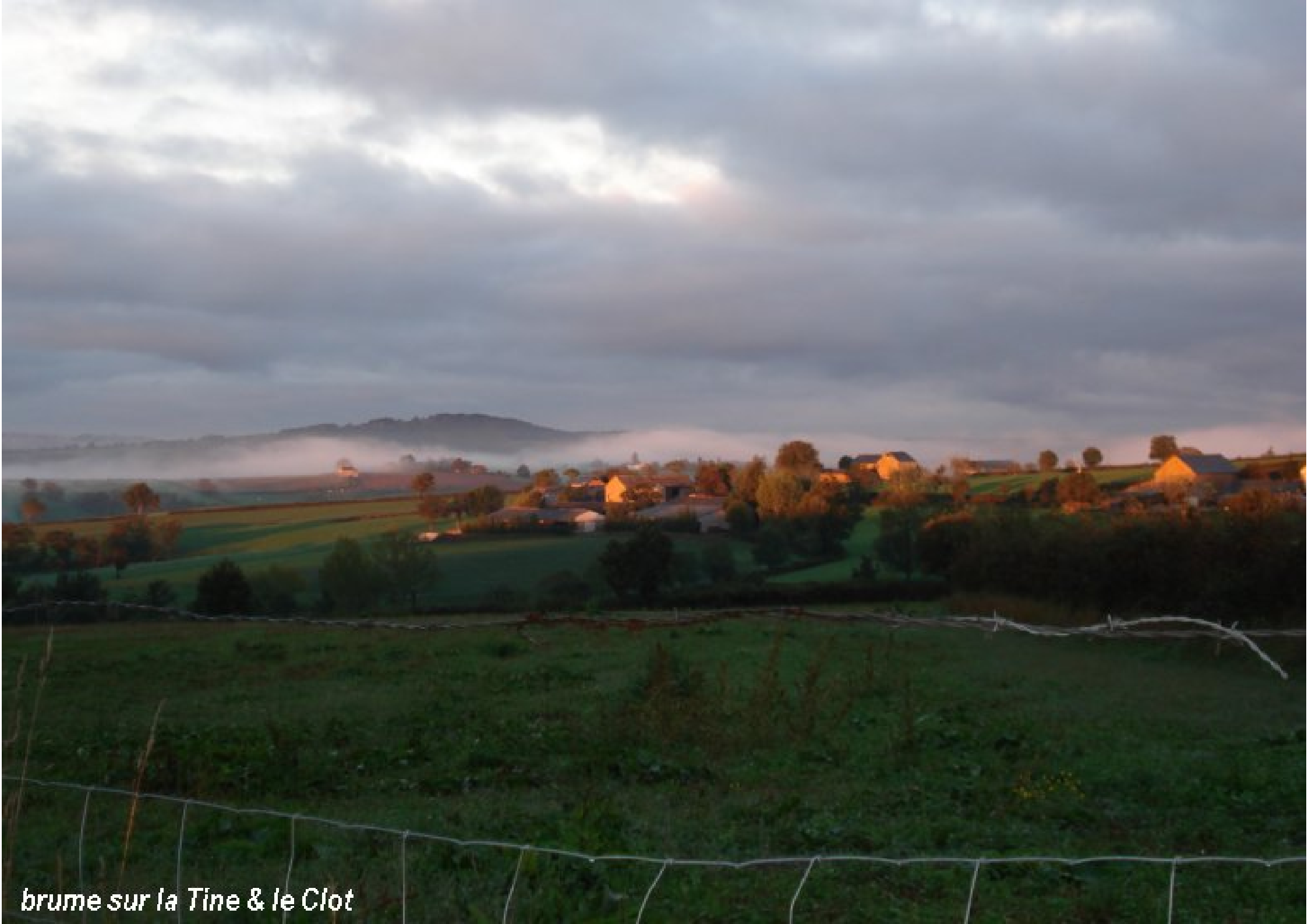
brume sur la Tine & le Clot