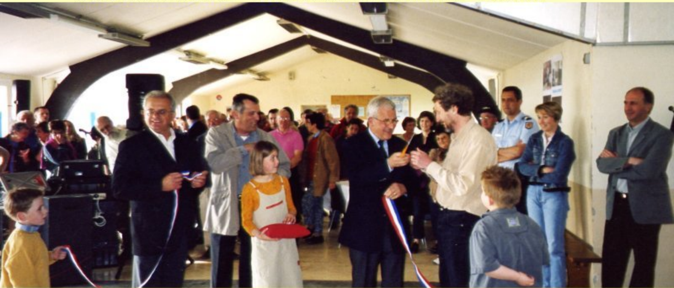
inauguration "Meljac.Net fête son site" - 25.04.2003

Assemblée Générale de l'Association MELJAC.NET ... la 10ème ! vendredi 9 décembre 2011 à 20H salle des associations de Meljac