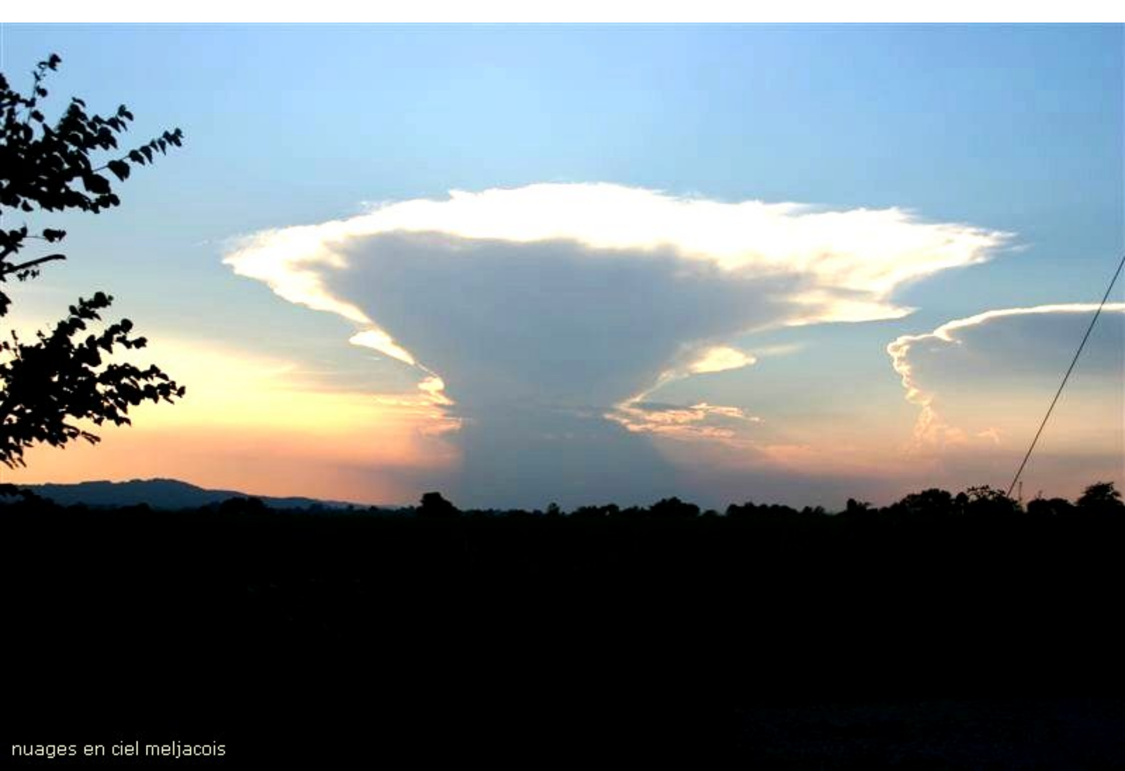
nuages en ciel meljacois