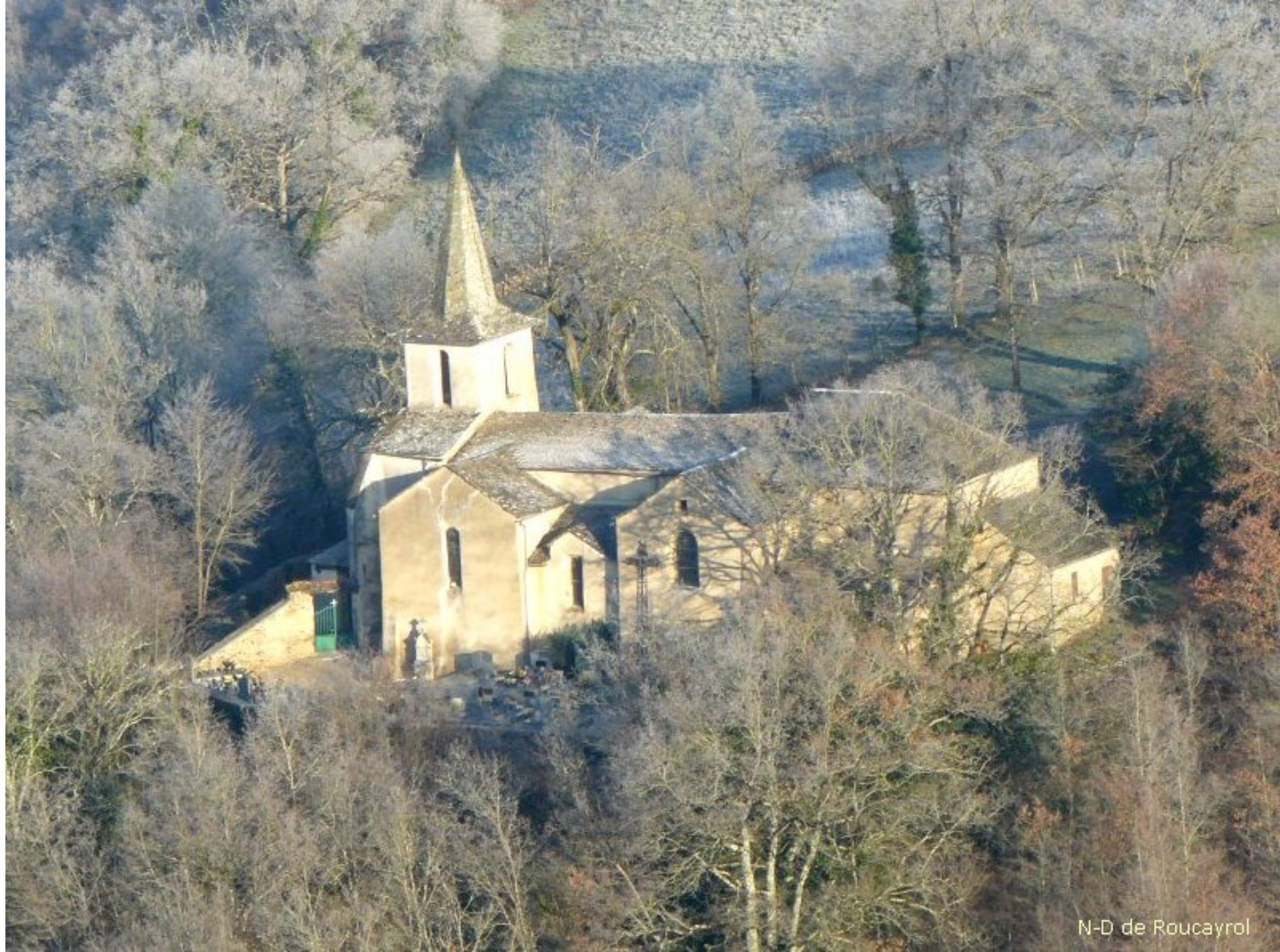
N-D de Roucayrol