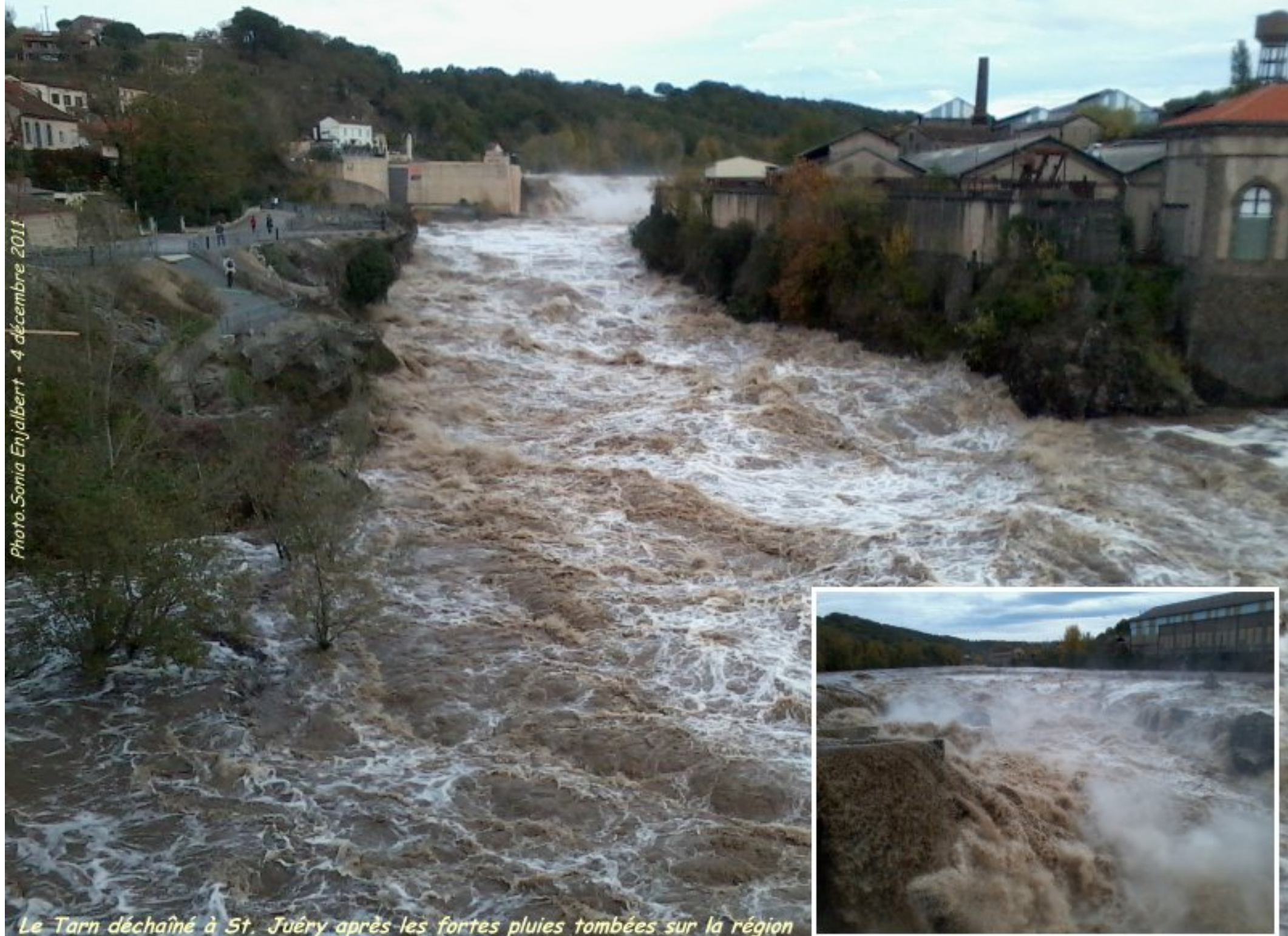
4 décembre 2011