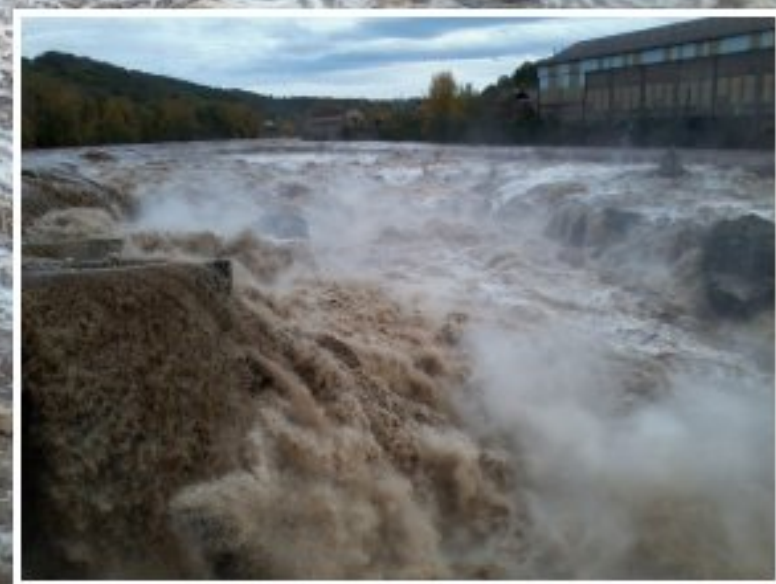
Le Tarn déchaîné à St. Juéry après les fortes pluies tombées sur la région