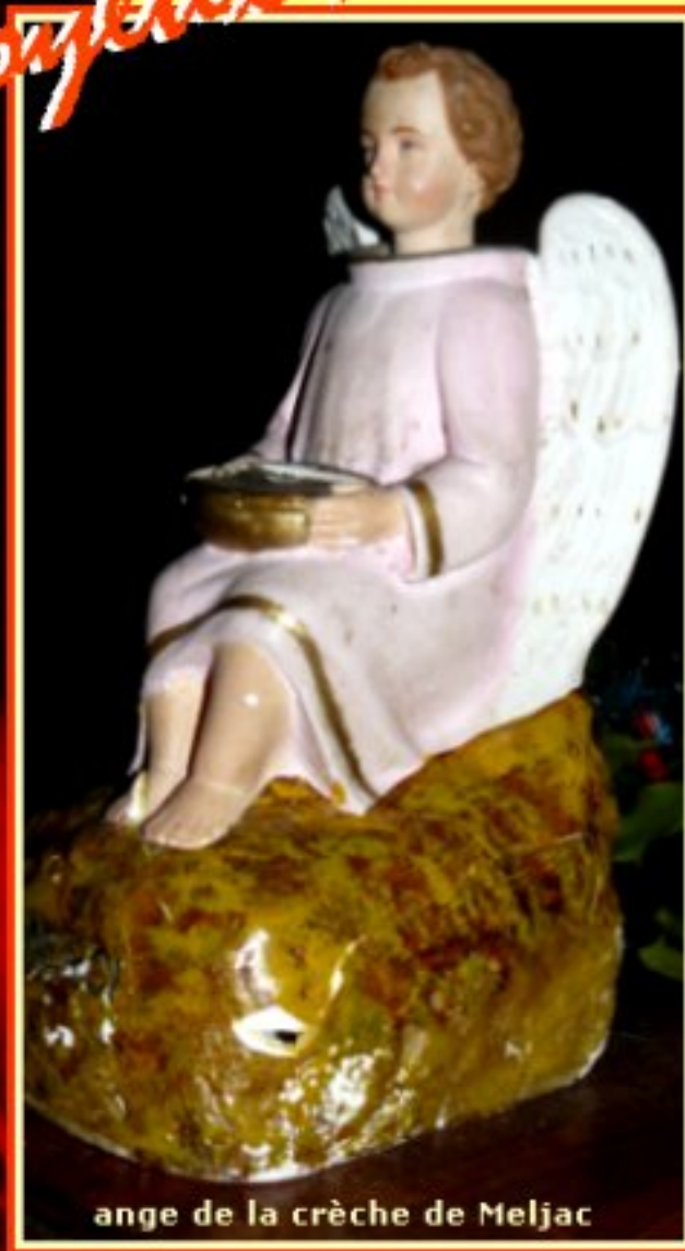
ange de la crèche de Meljac