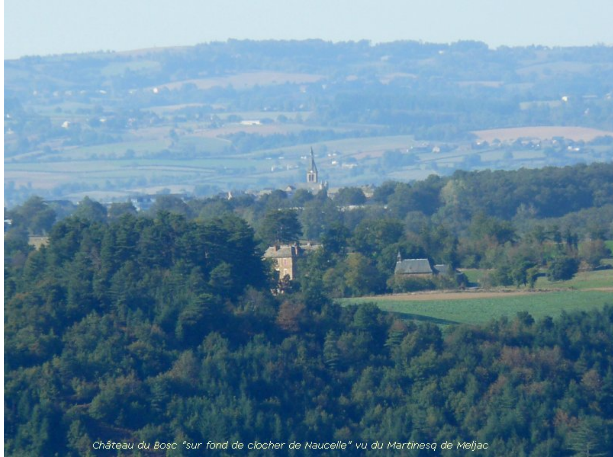
Château du Bosc "sur fond de clocher de Naucelle" vu du Martinesq de Meljac