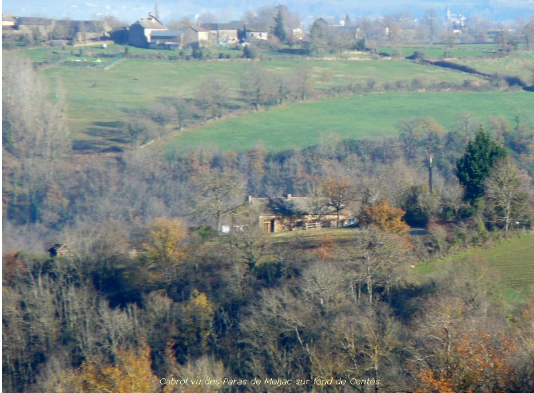
Cabrol vu des Paros de Meljac sur fond de Centès