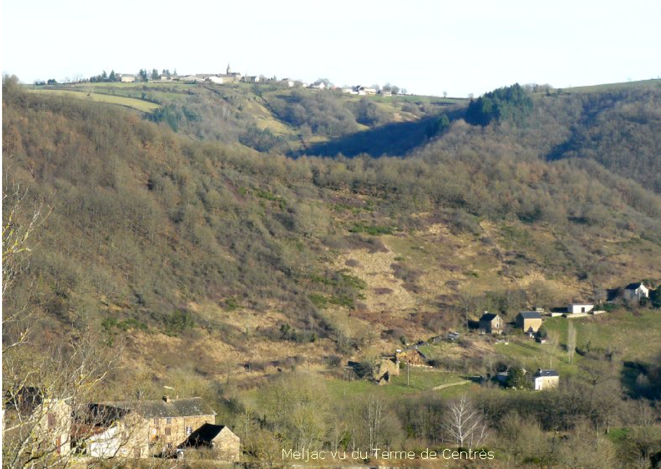
Meljac vu du Terme de Centrès