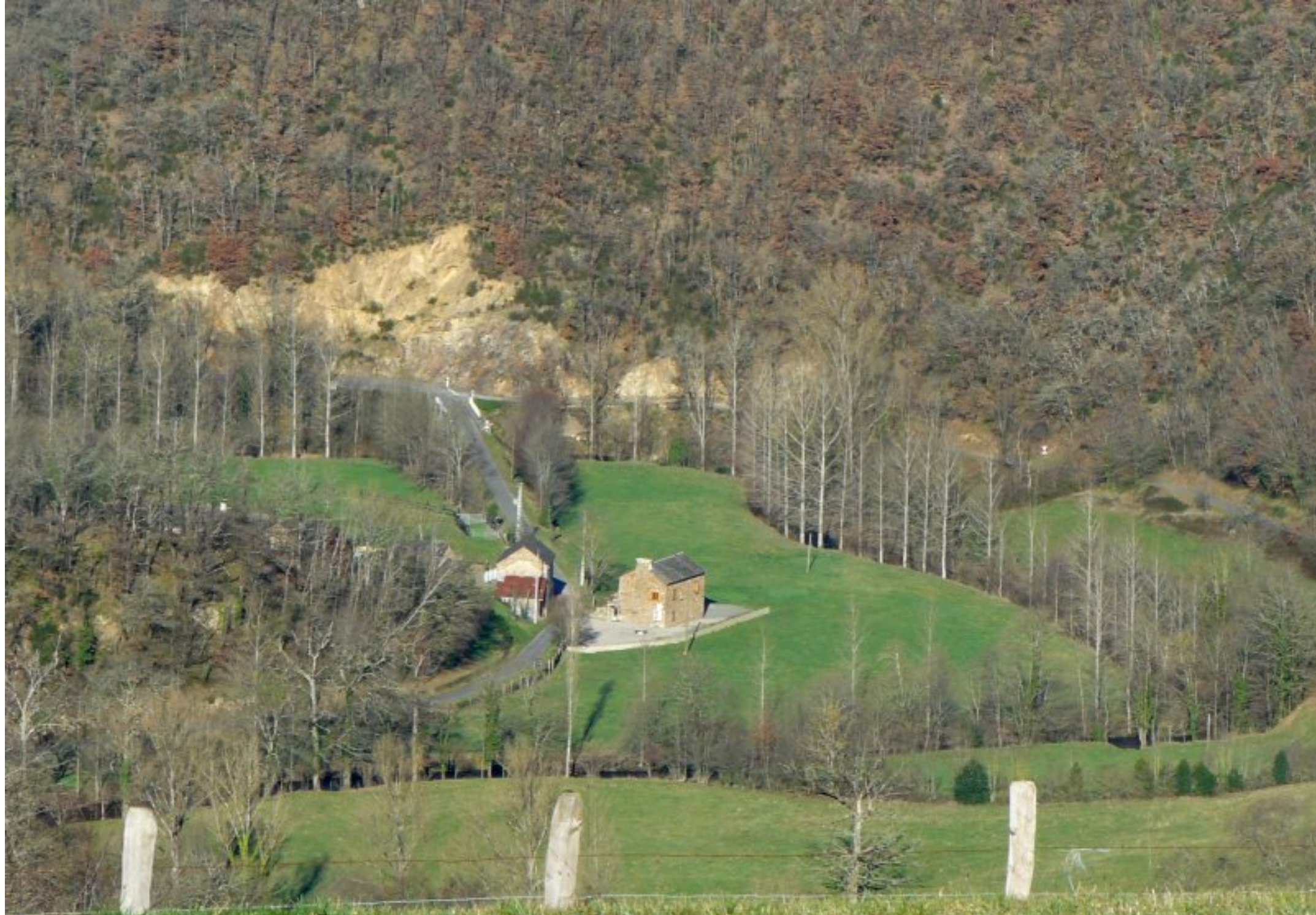
Lestrebaldie vu du Suc du Martinèsq