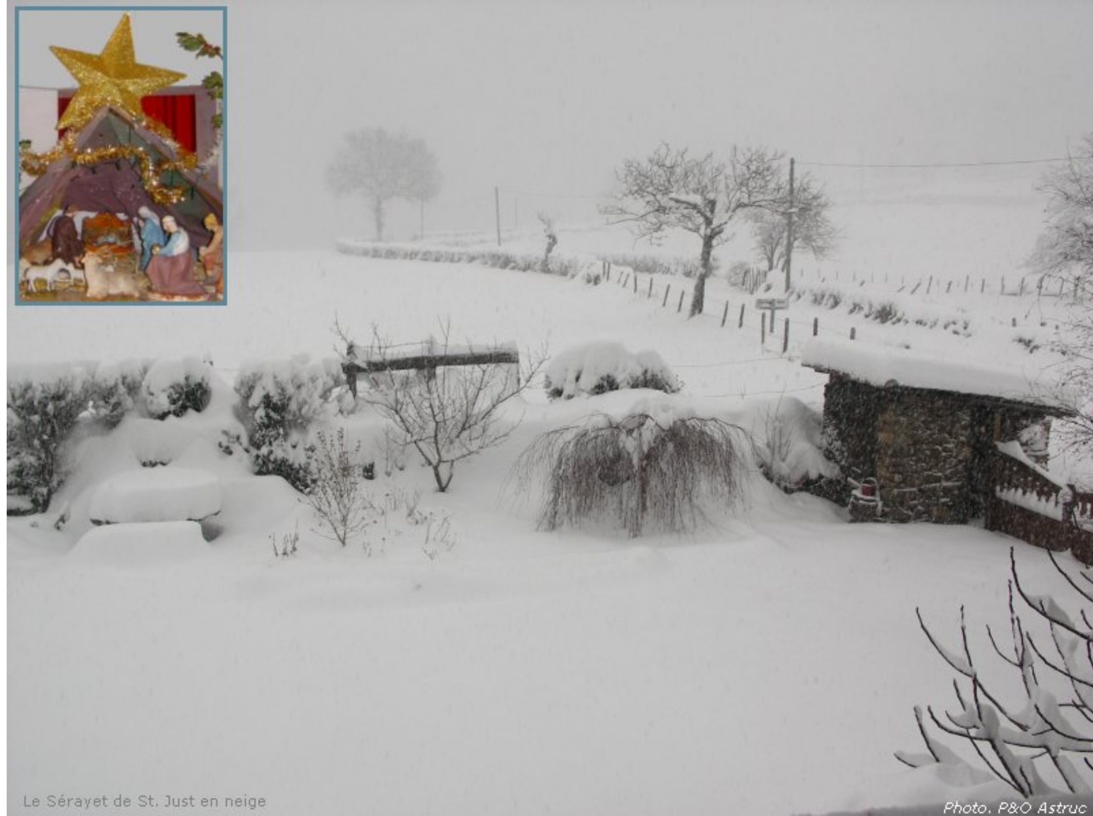
Le Sérayet de St. Just en neige