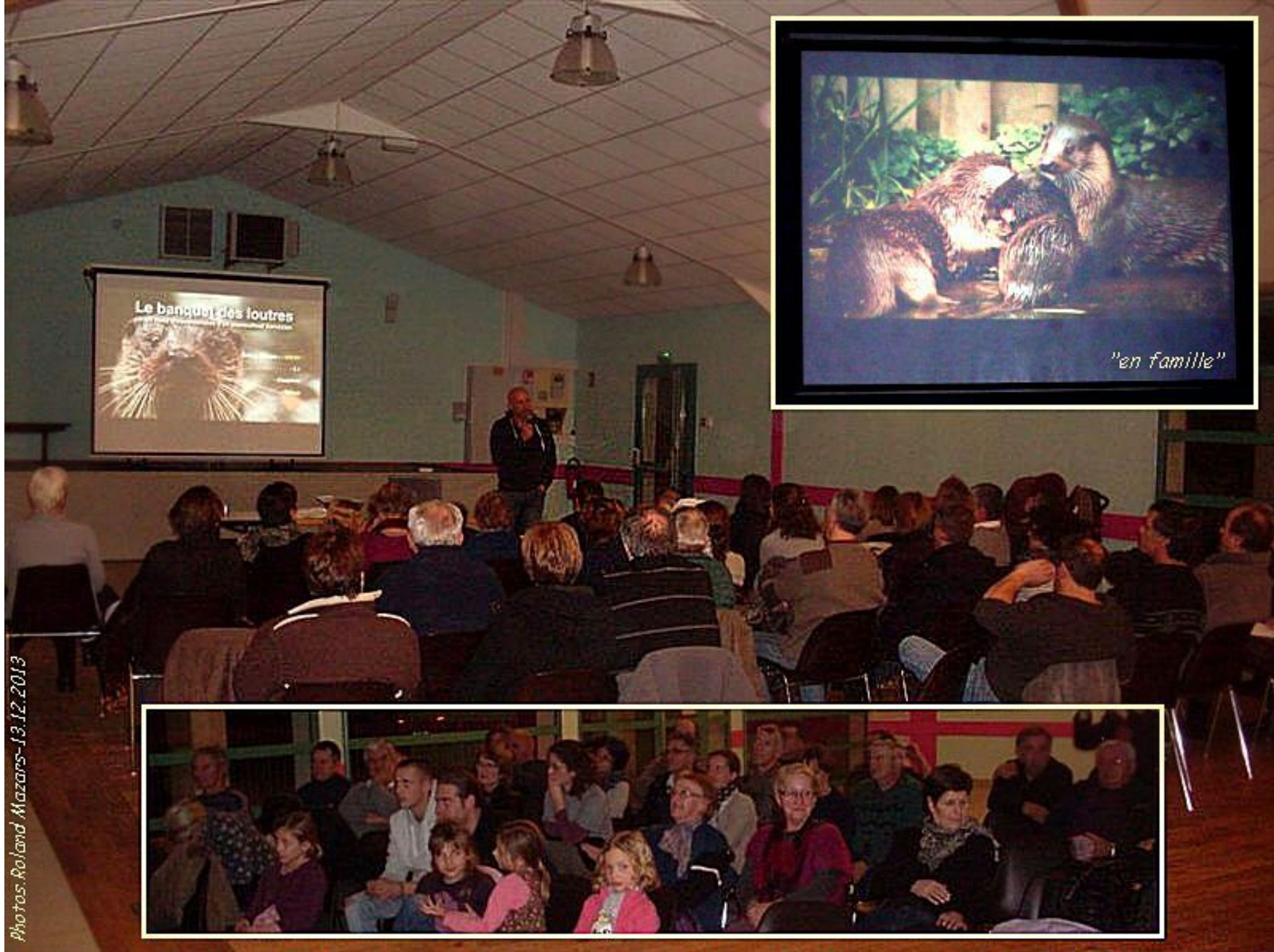
Projection-débat "le banquet des loutres" - salle des fêtes de Meljac - vendredi 13 décembre 2013