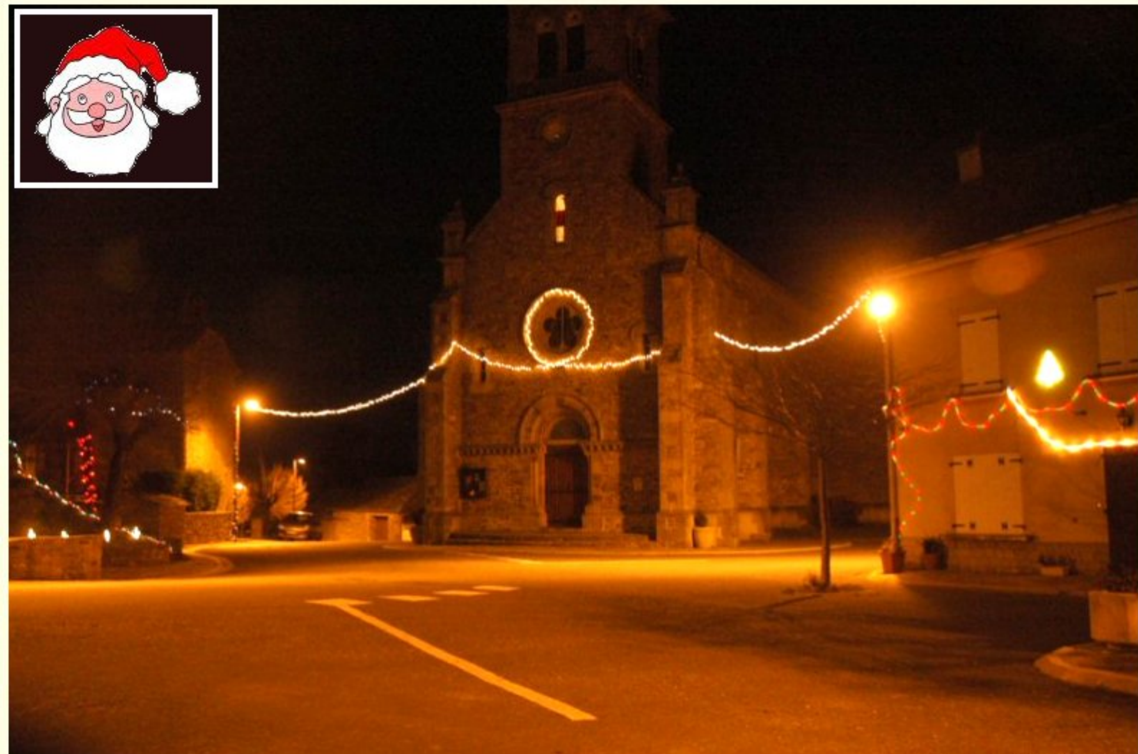
décor de Noël à Meljac