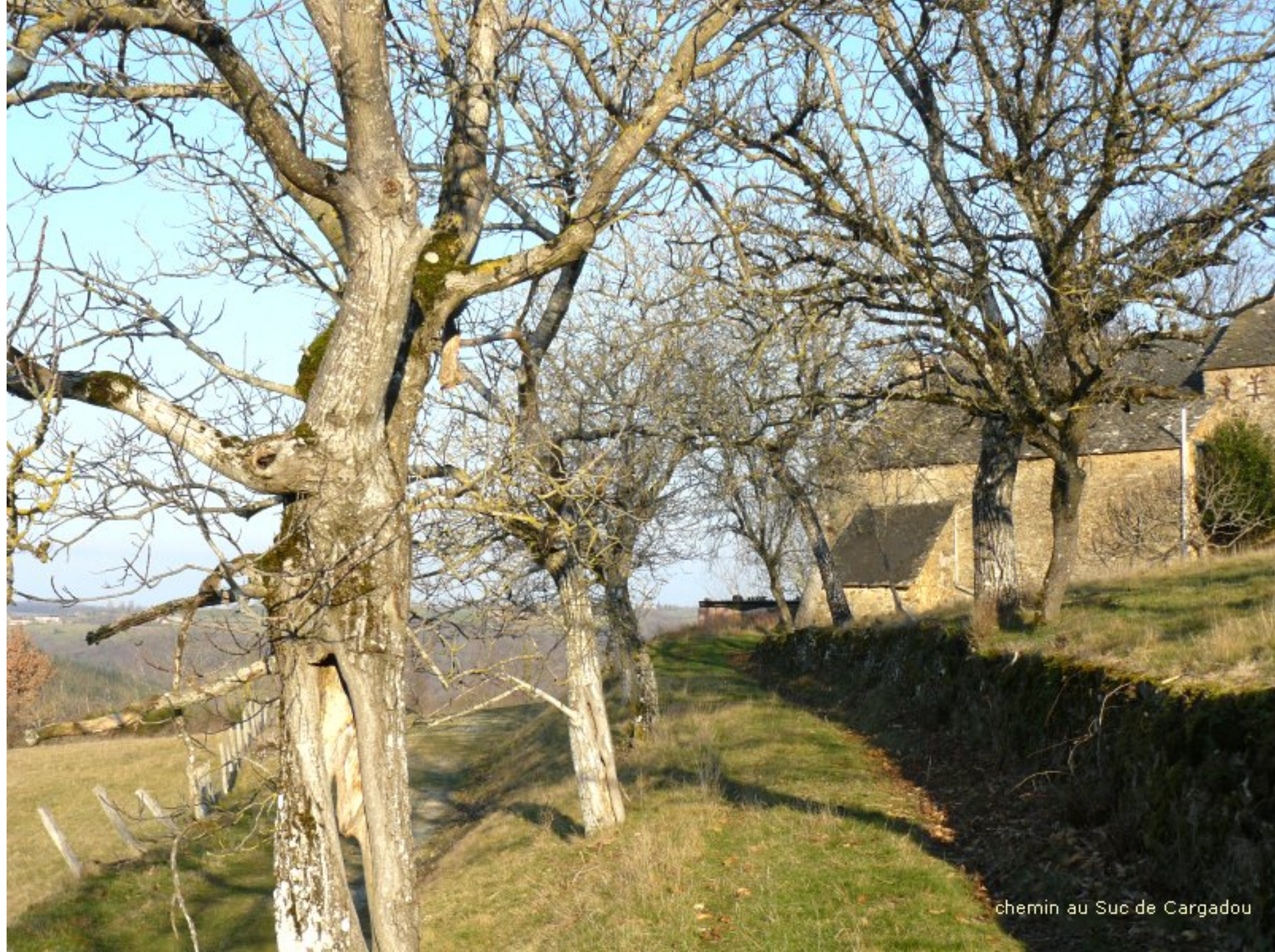
chemin au Suc de Cargadou