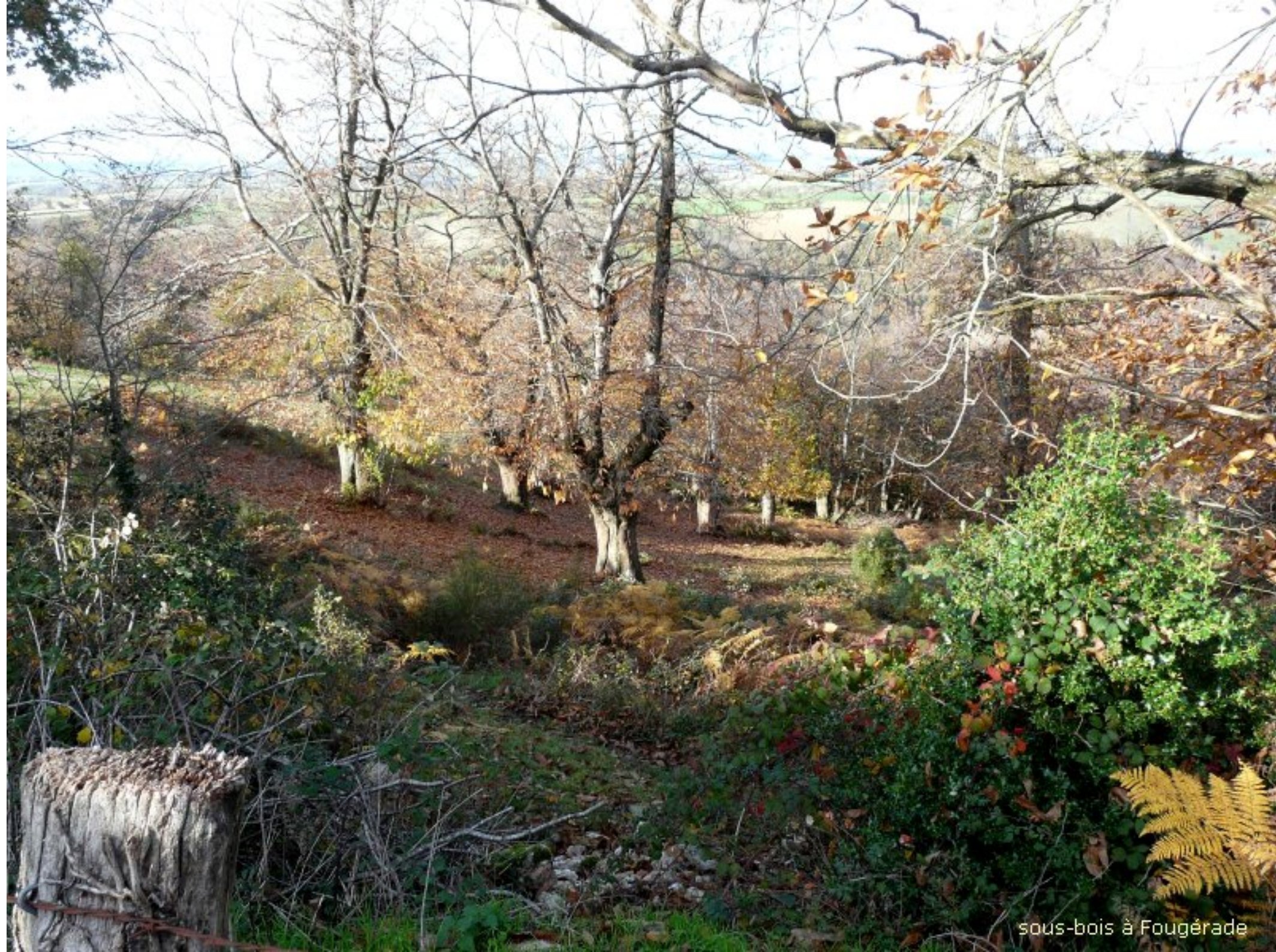
sous-bois à Fougérade