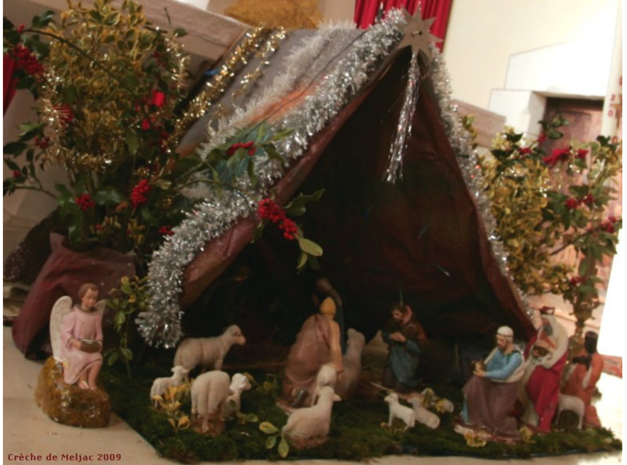
Crèche de Meljac 2009