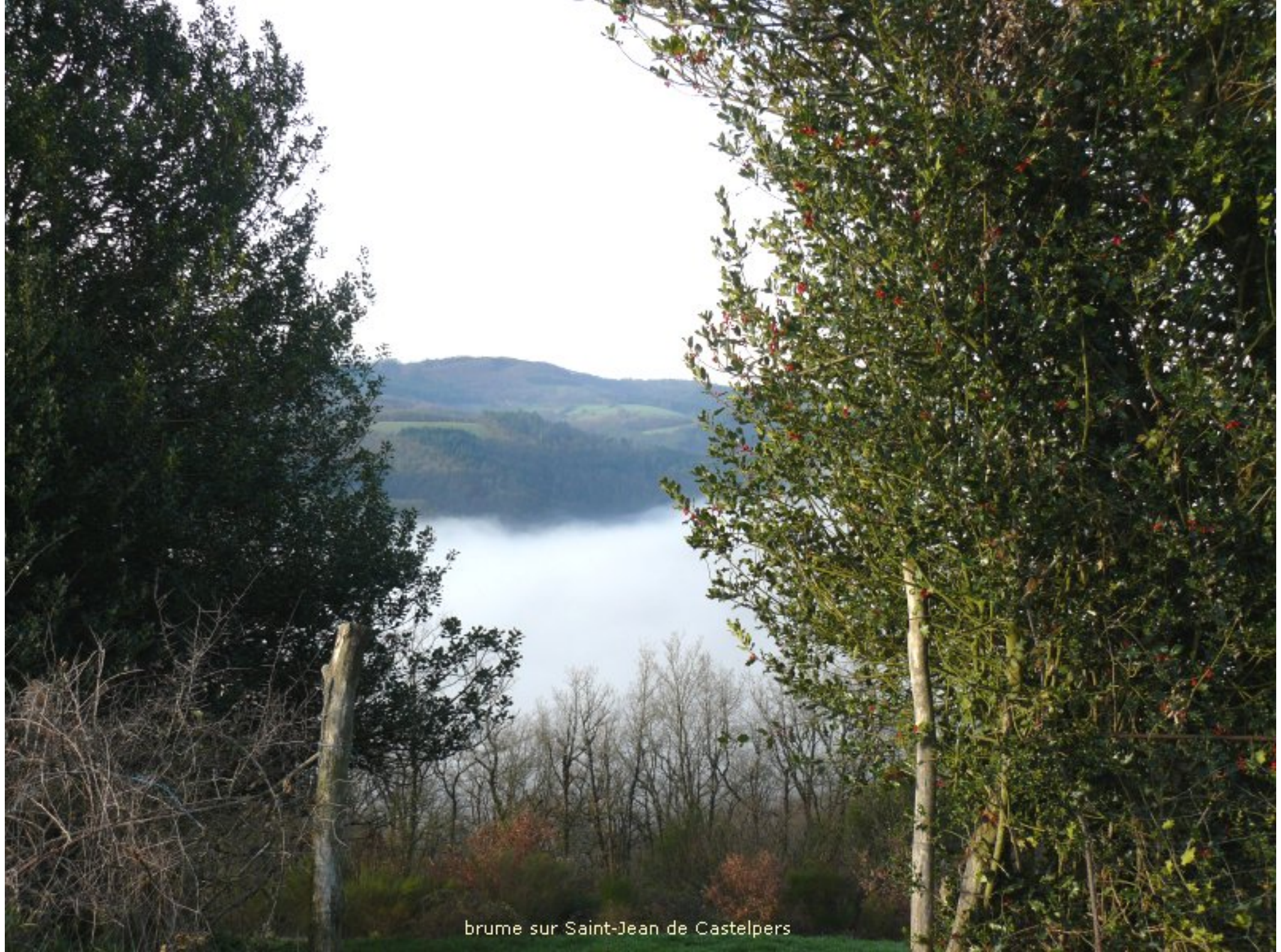
brume sur Saint-Jean de Castelpers