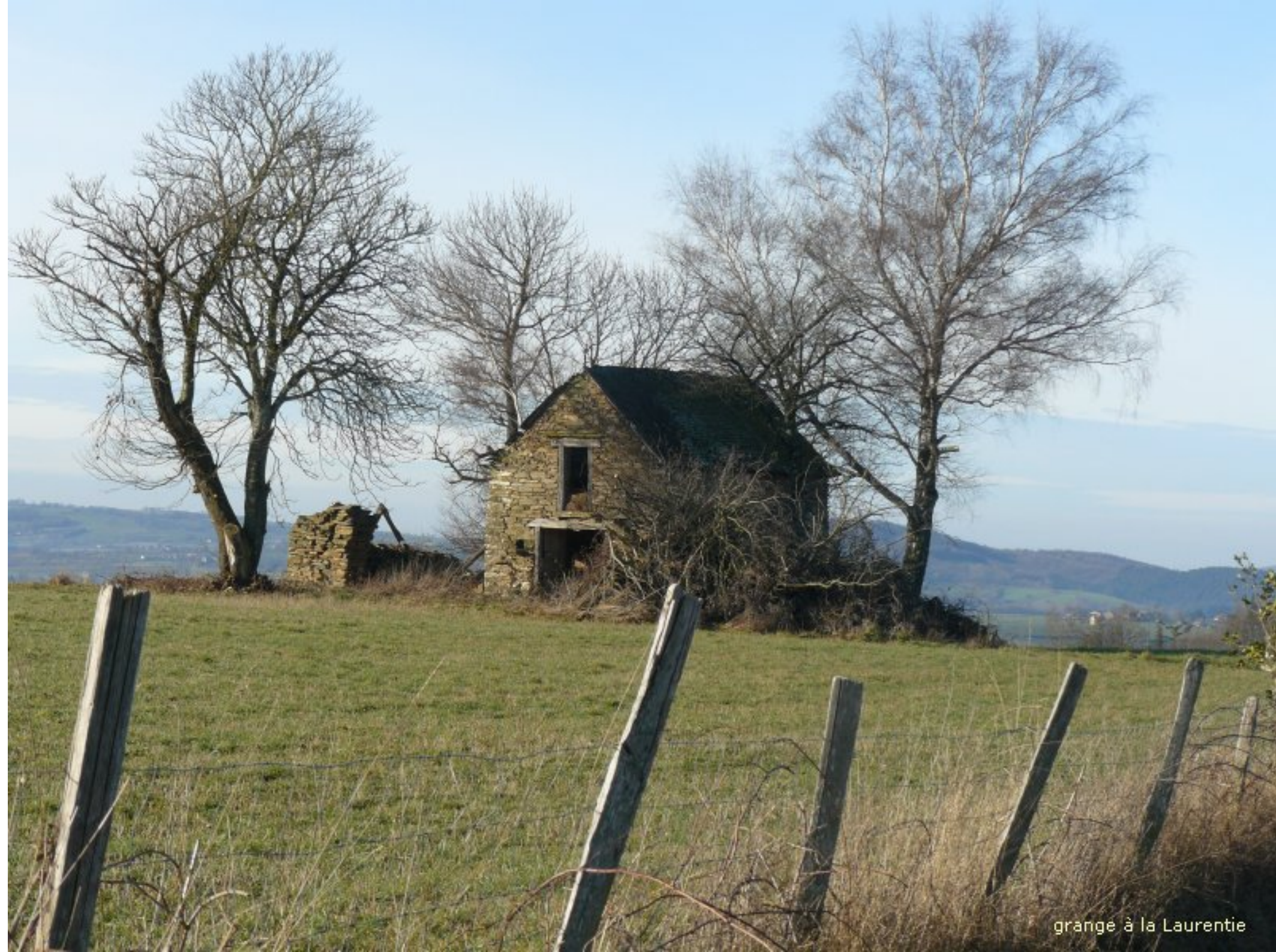
grange à la Laurentie