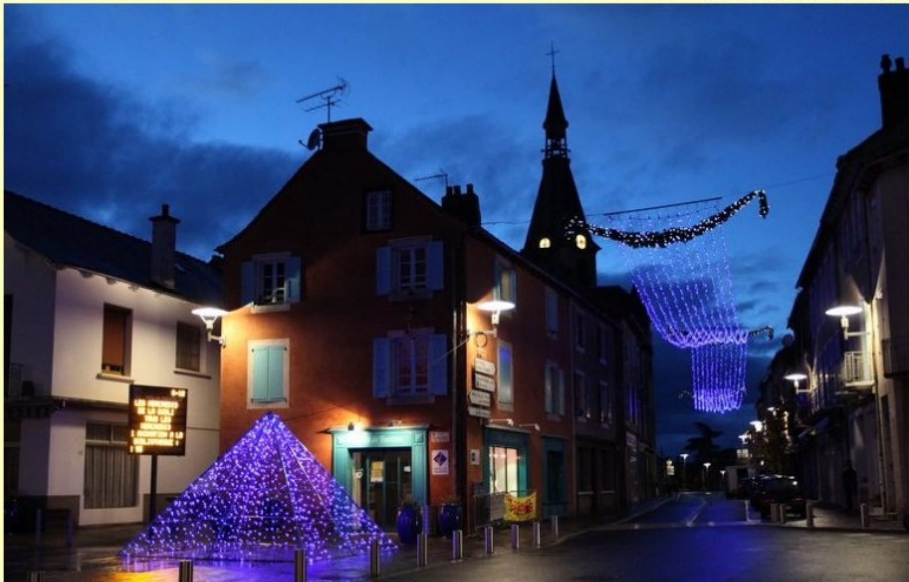
Ci-dessous décor de Noël 2013 à voir Place Jean Baudou à Naucelle au sur le site de la Communauté de Communes du Naucellais