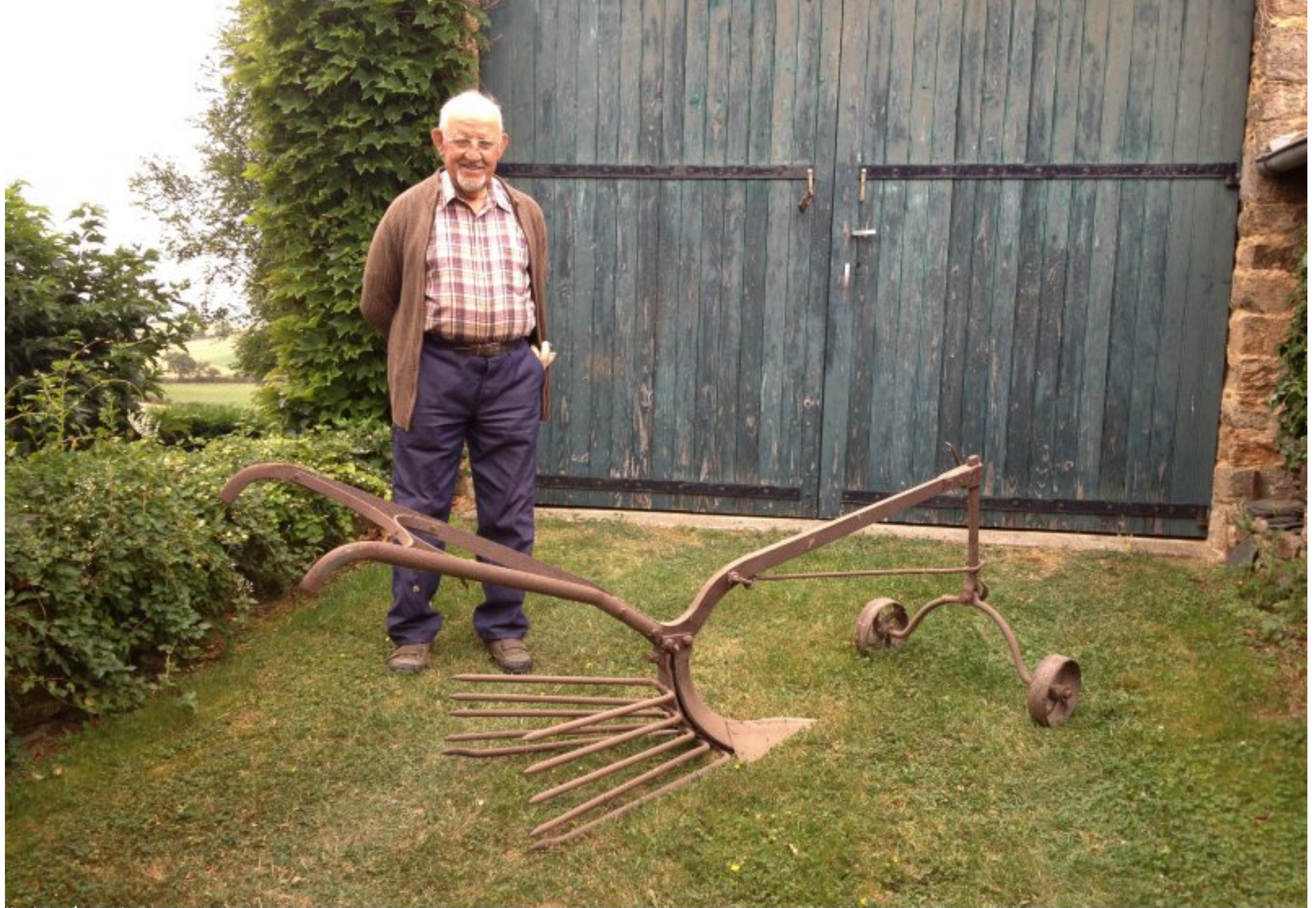
"arracheuse de pommes de terre" - fabrication Ernest Massol forgeron à Meljac