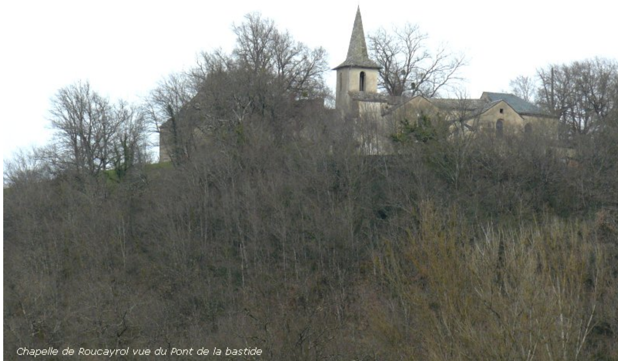
Chapelle de Roucayrol vue du Pont de la bastide