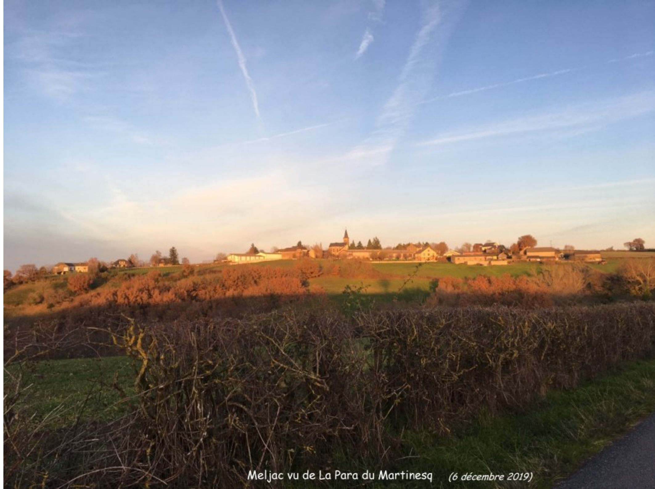
Meljac vu de La Para du Martinesq (6 décembre 2019)