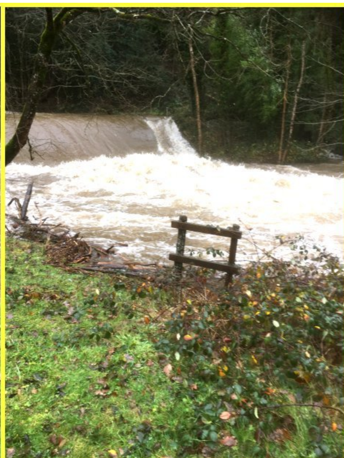
Le Céor au Moulin de Born...

(14 décembre 2019)