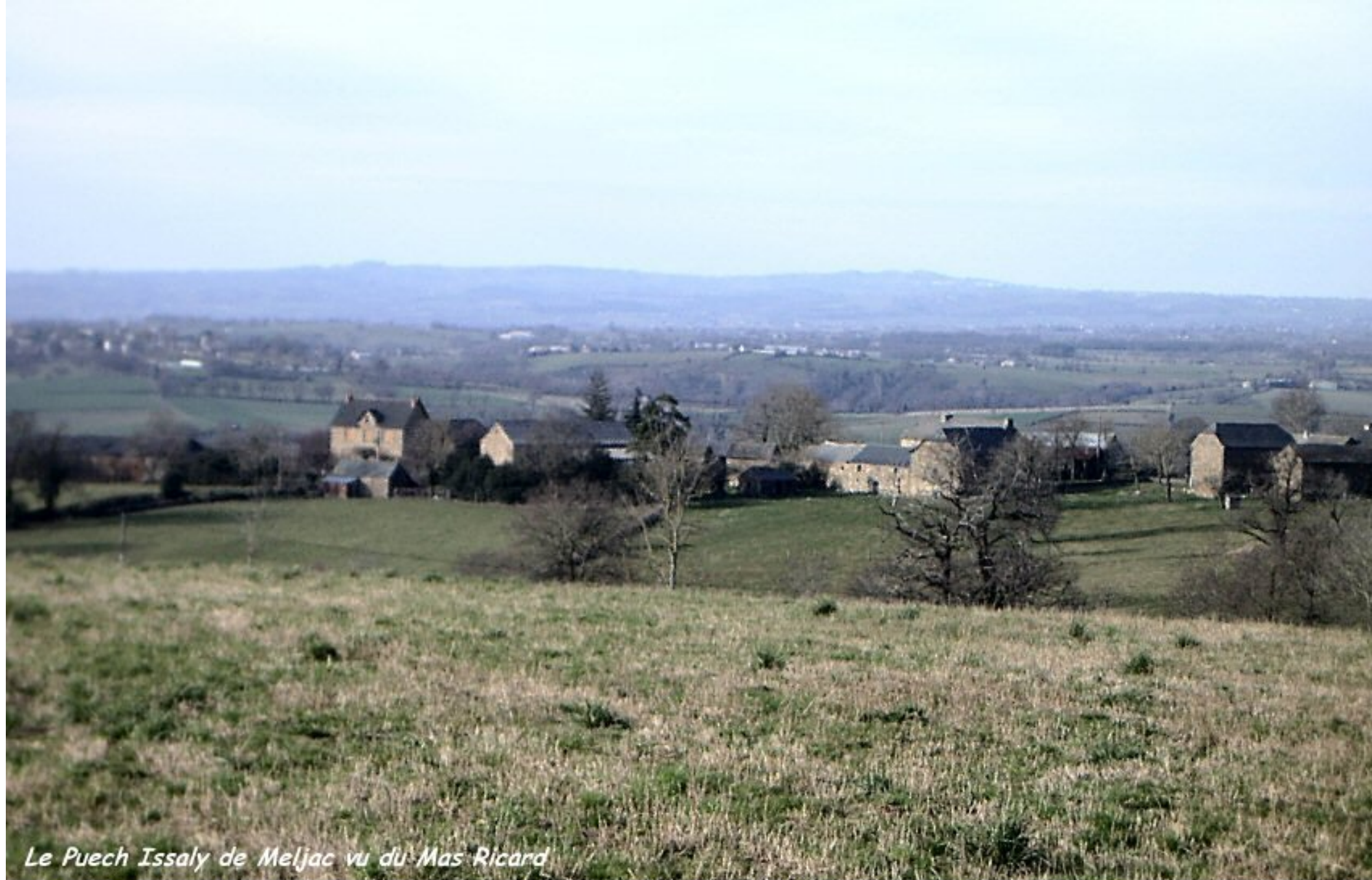
Le Puech Issaly de Meljac vu du Mas Ricard

Quine de l'école et du collège Ste.Marie de Cassagnes ce samedi 7 décembre à 20H30 et dimanche 8 à 14H30