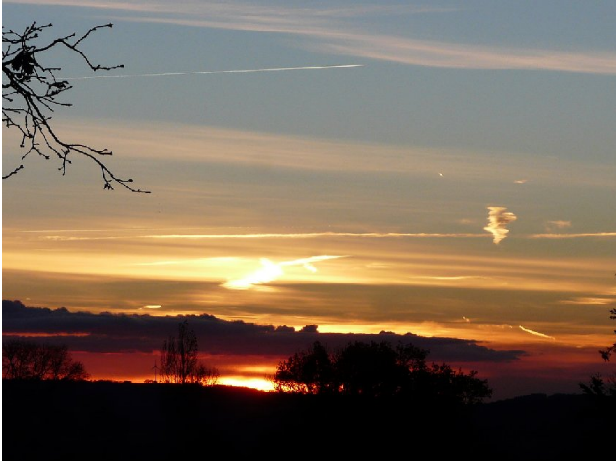
Coucher de soleil vu de La Borie - dimanche 4 décembre 2016