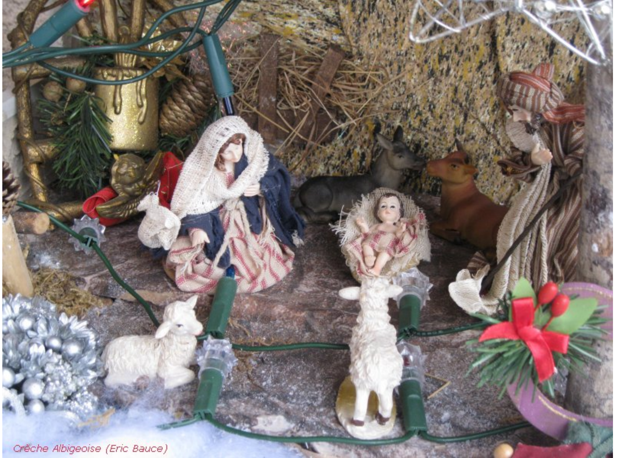
Crèche Albigeoise (Eric Bauce)