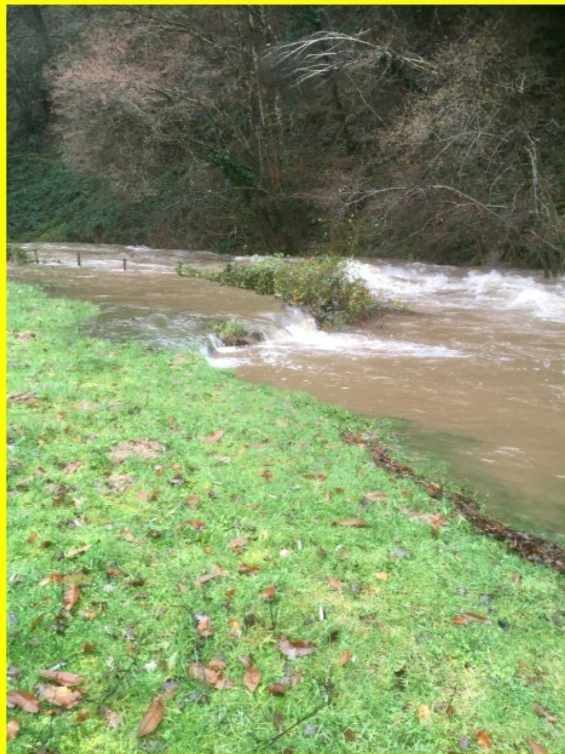
Le Céor au Moulin de Born...