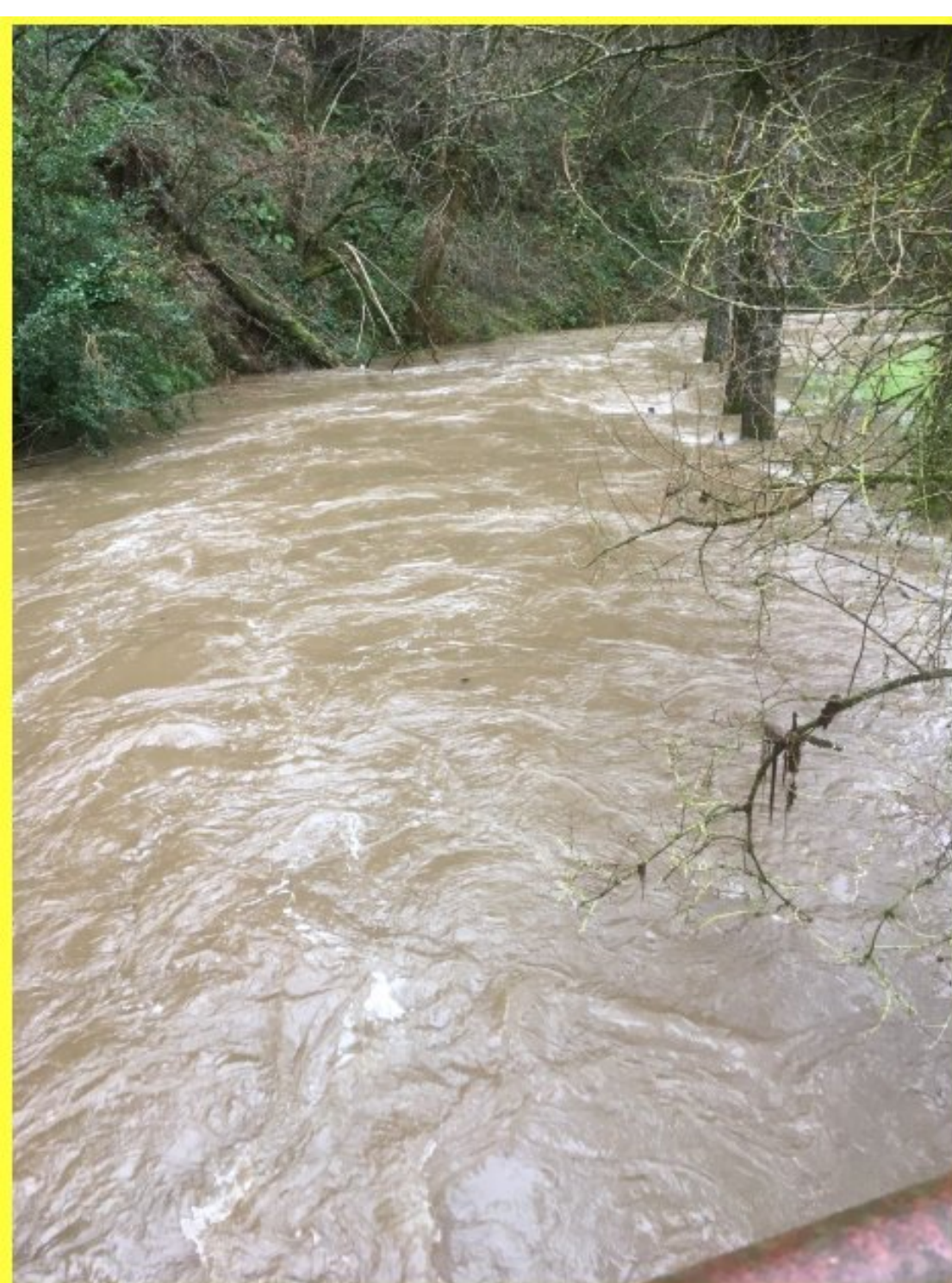
Le Céor au Moulin de Born...