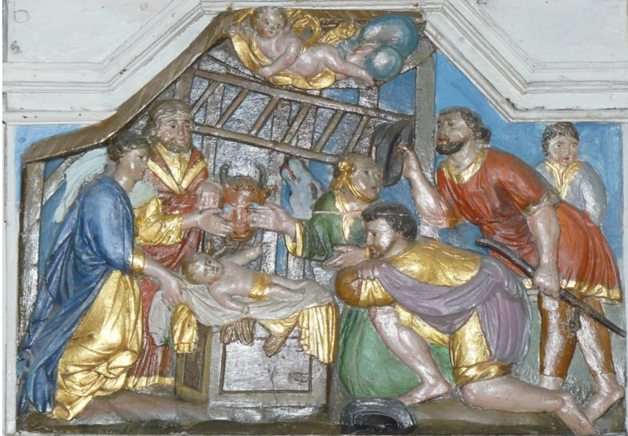
La Nativité - cathédrale de Saint-Pol-de-Léon en Bretagne