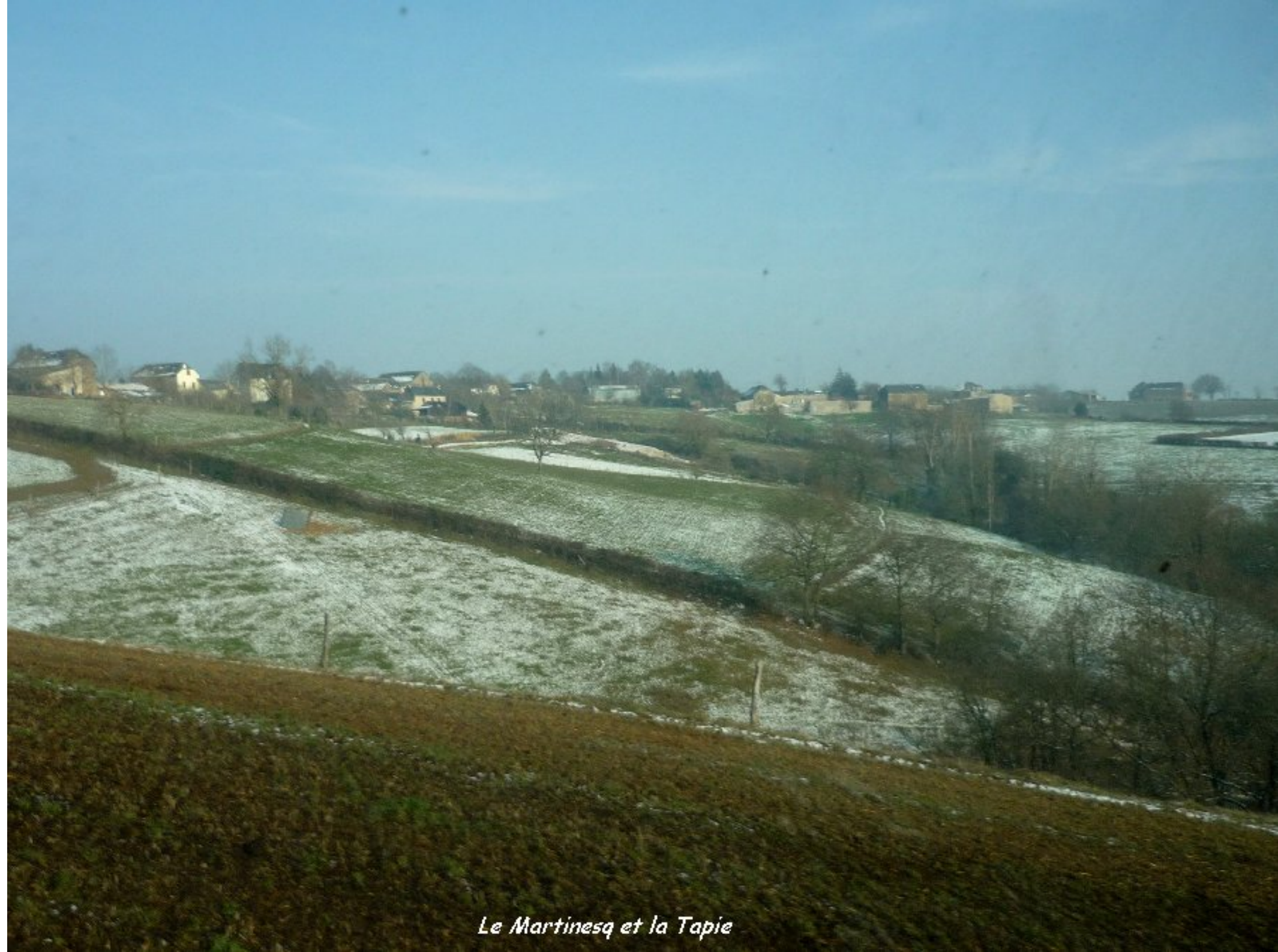
Le Martinesq et la Tapie