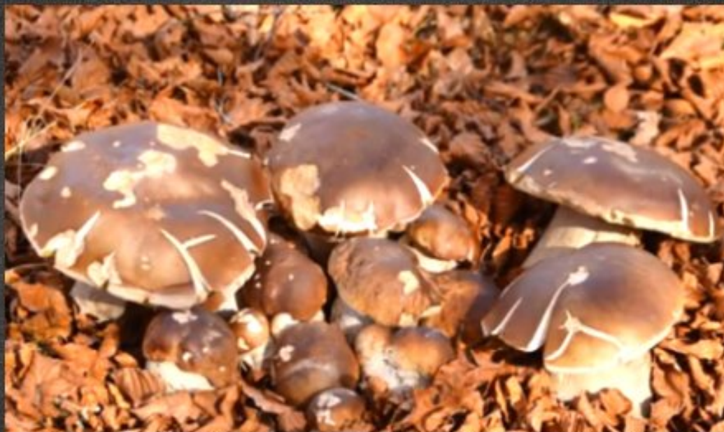
"PROMENADE EN COULEURS MELJACOISES"

SOIREE MELJAC.NET DE PROJECTION PHOTOS ET VIDEOS