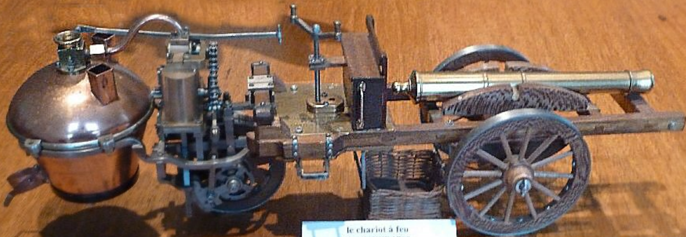
le chariot à feu CUGNOT 1769