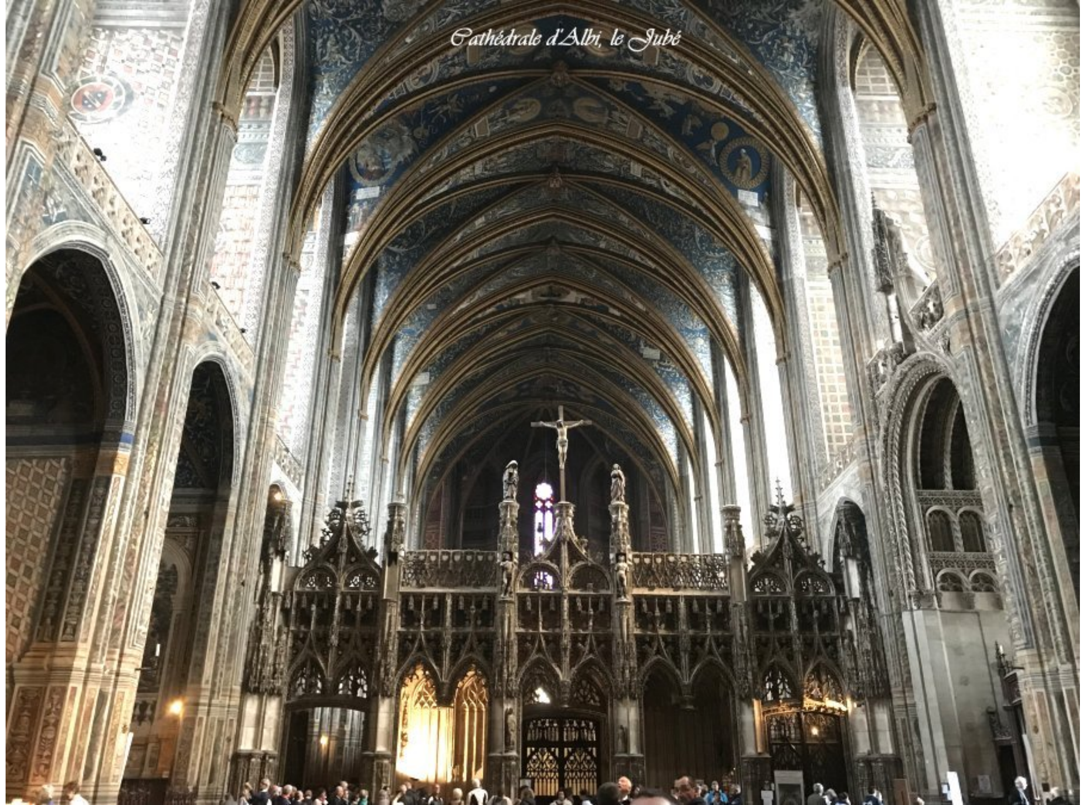
Cathédrale d'Albi, le Jube