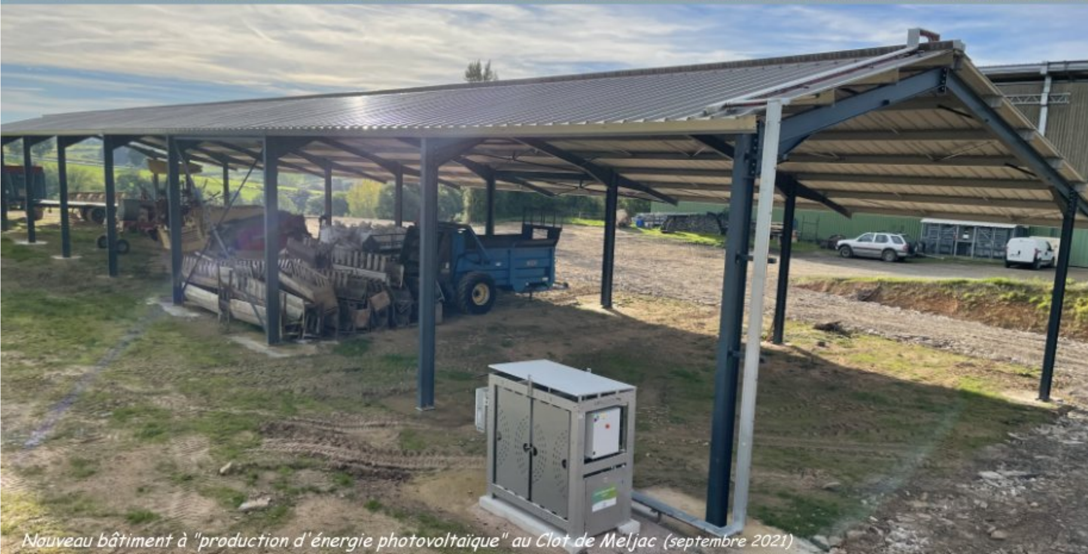
Nouveau bâtiment à "production d'énergie photovoltaïque" au Clot de Meljac (septembre 2021)