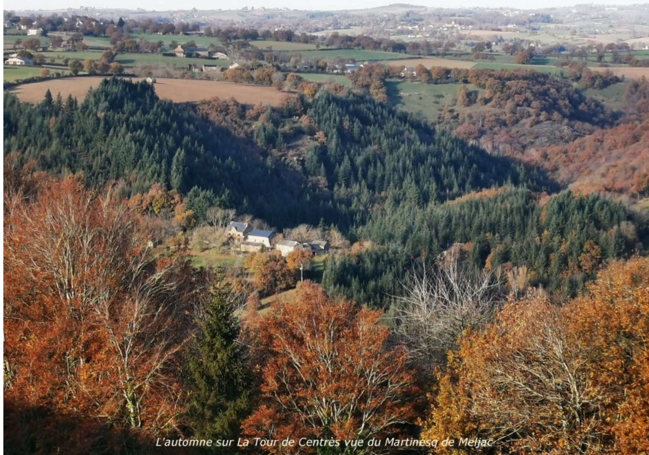
L'automne sur La Tour de Centres vue du Martinesq de Meljac