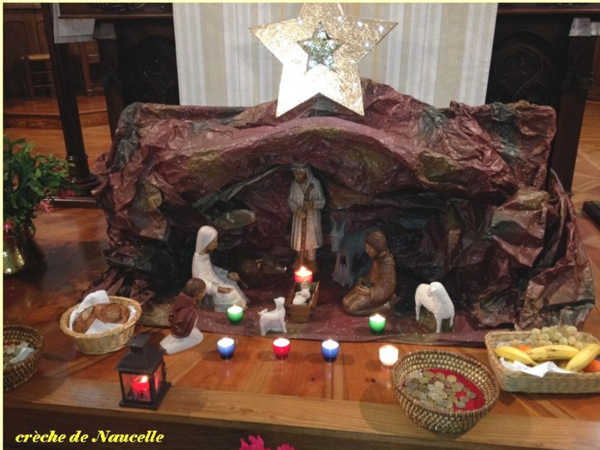
crèche de Naucelle