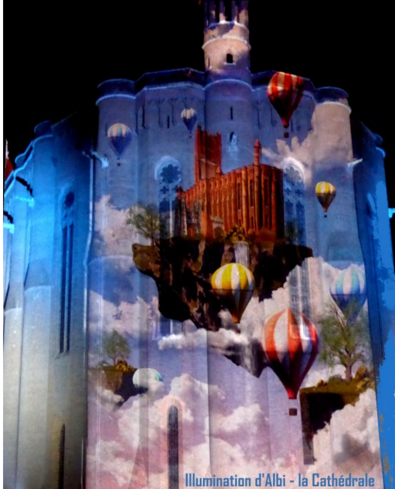
Illumination d'Albi - la Cathédrale