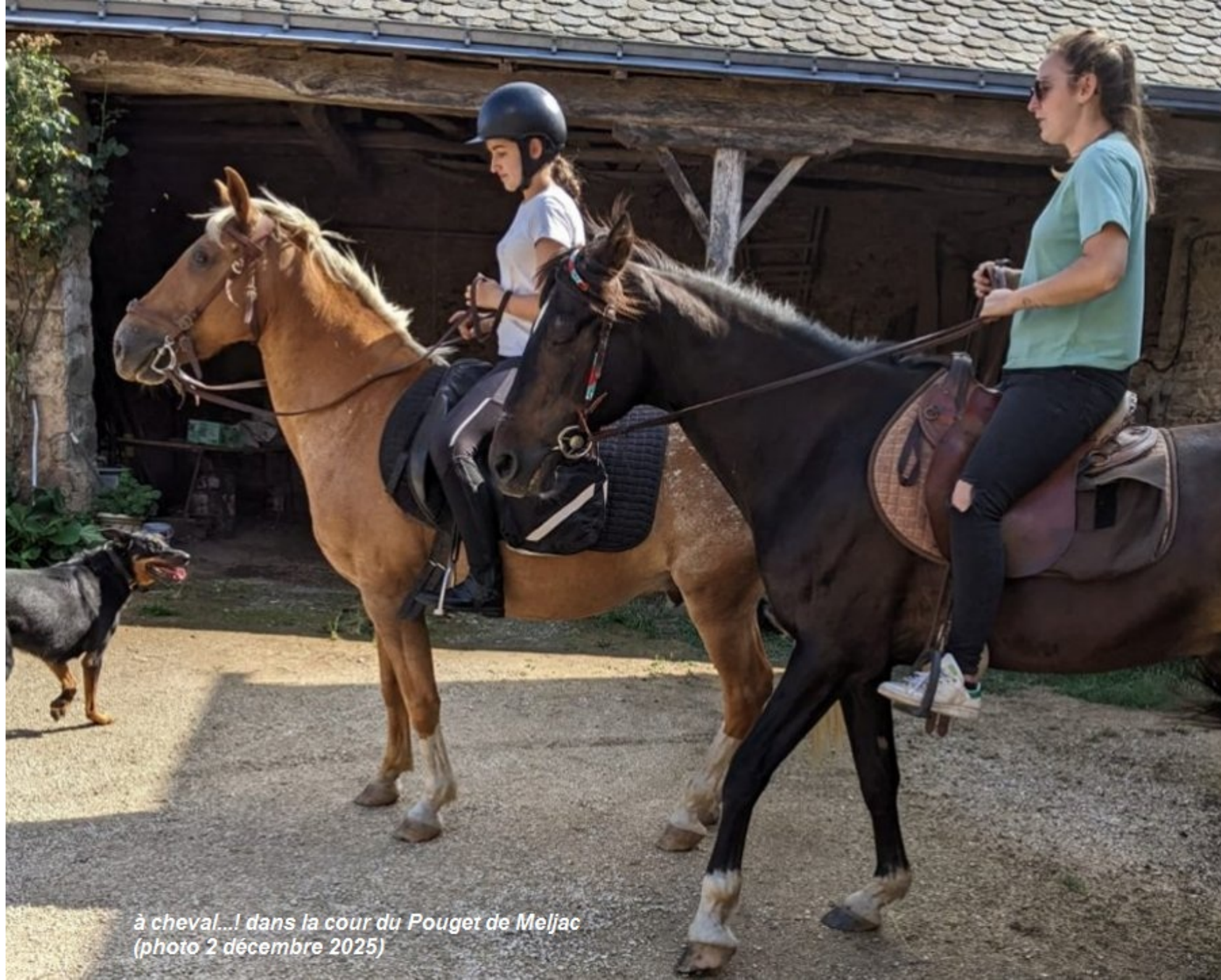
à cheval...! dans la cour du Pouget de Meljac (photo 2 décembre 2025)