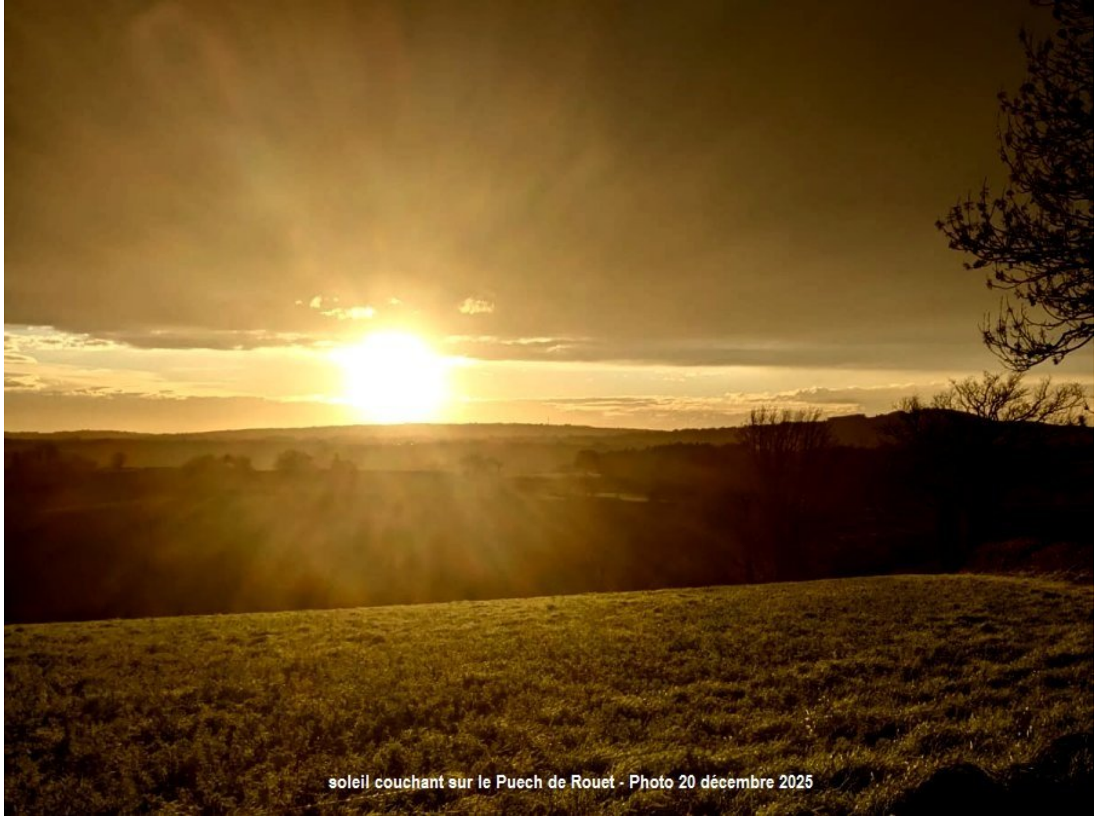
soleil couchant sur le Puech de Rouet - Photo 20 décembre 2025