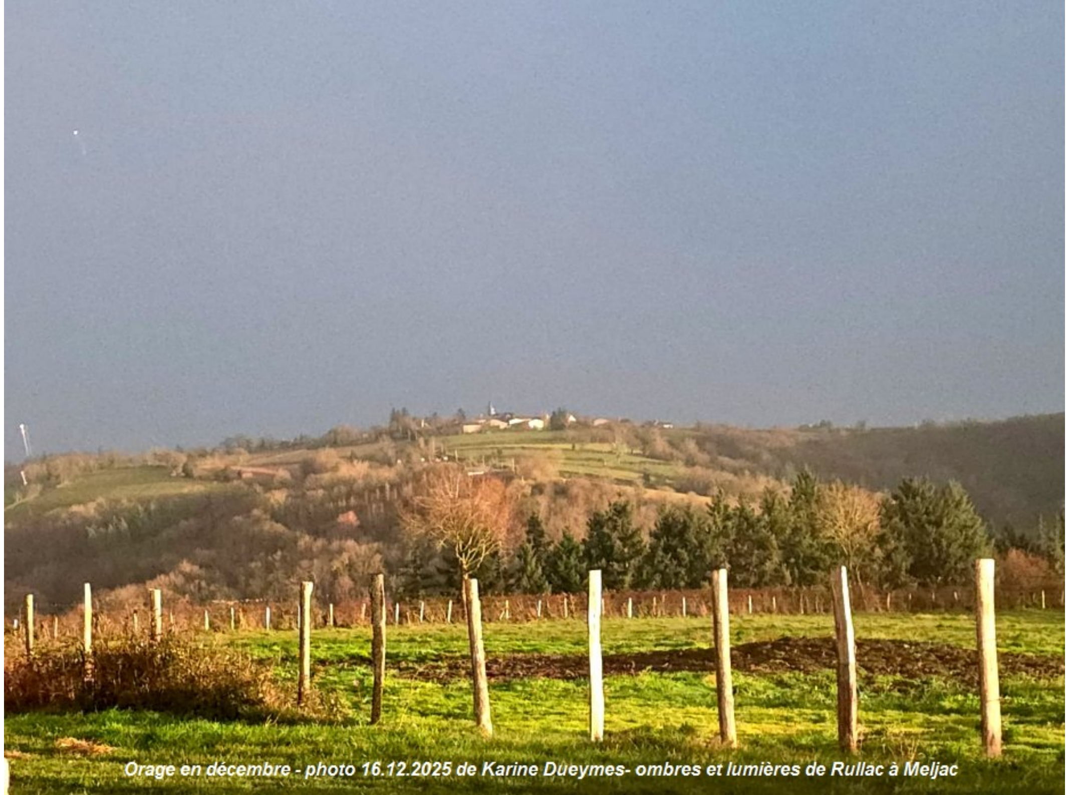
Orage en décembre - - ombres et lumières de Rullac à Meljac