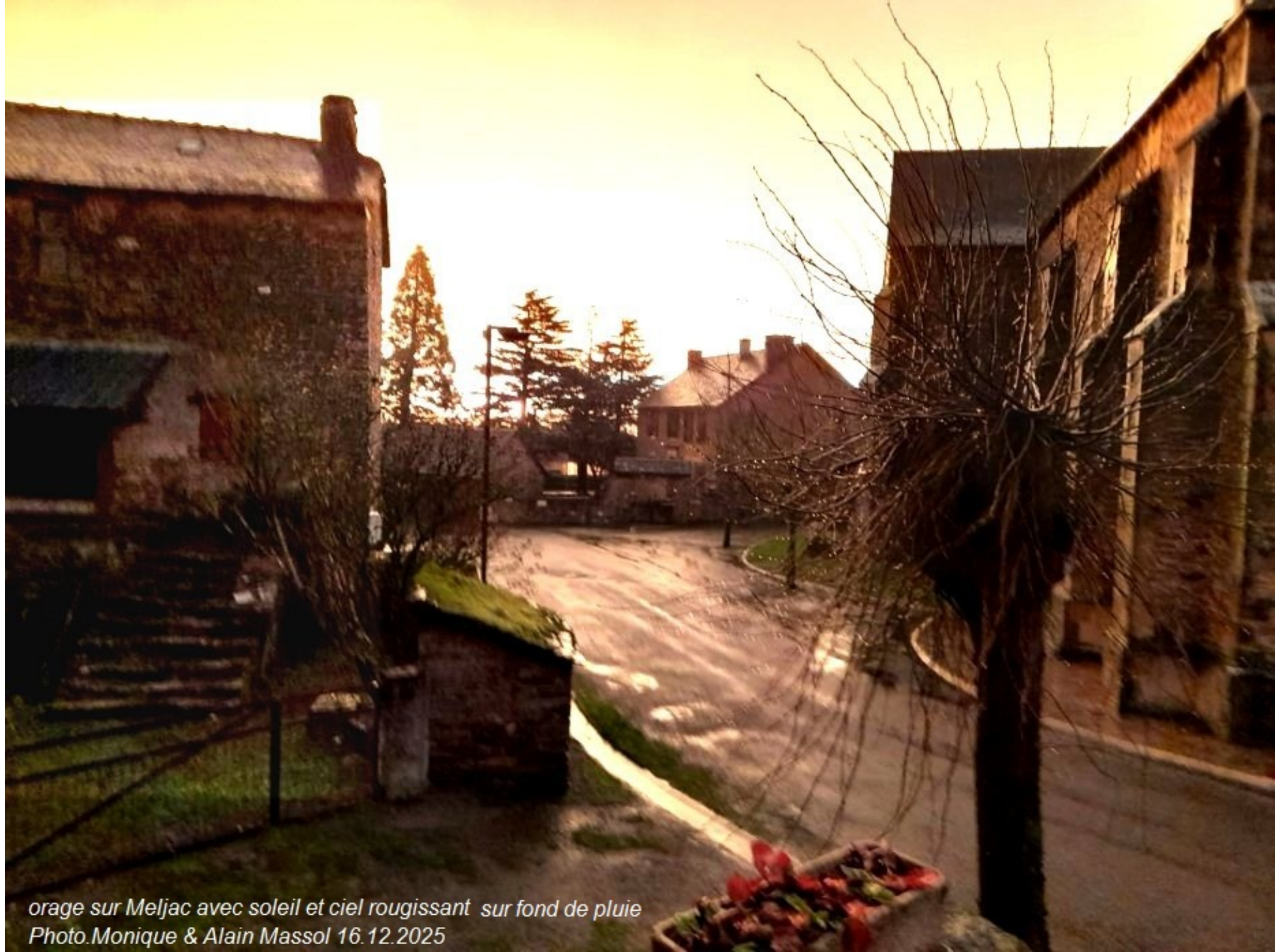
orage sur Meljac avec soleil et ciel rougissant sur fond de pluie 16.12.2025