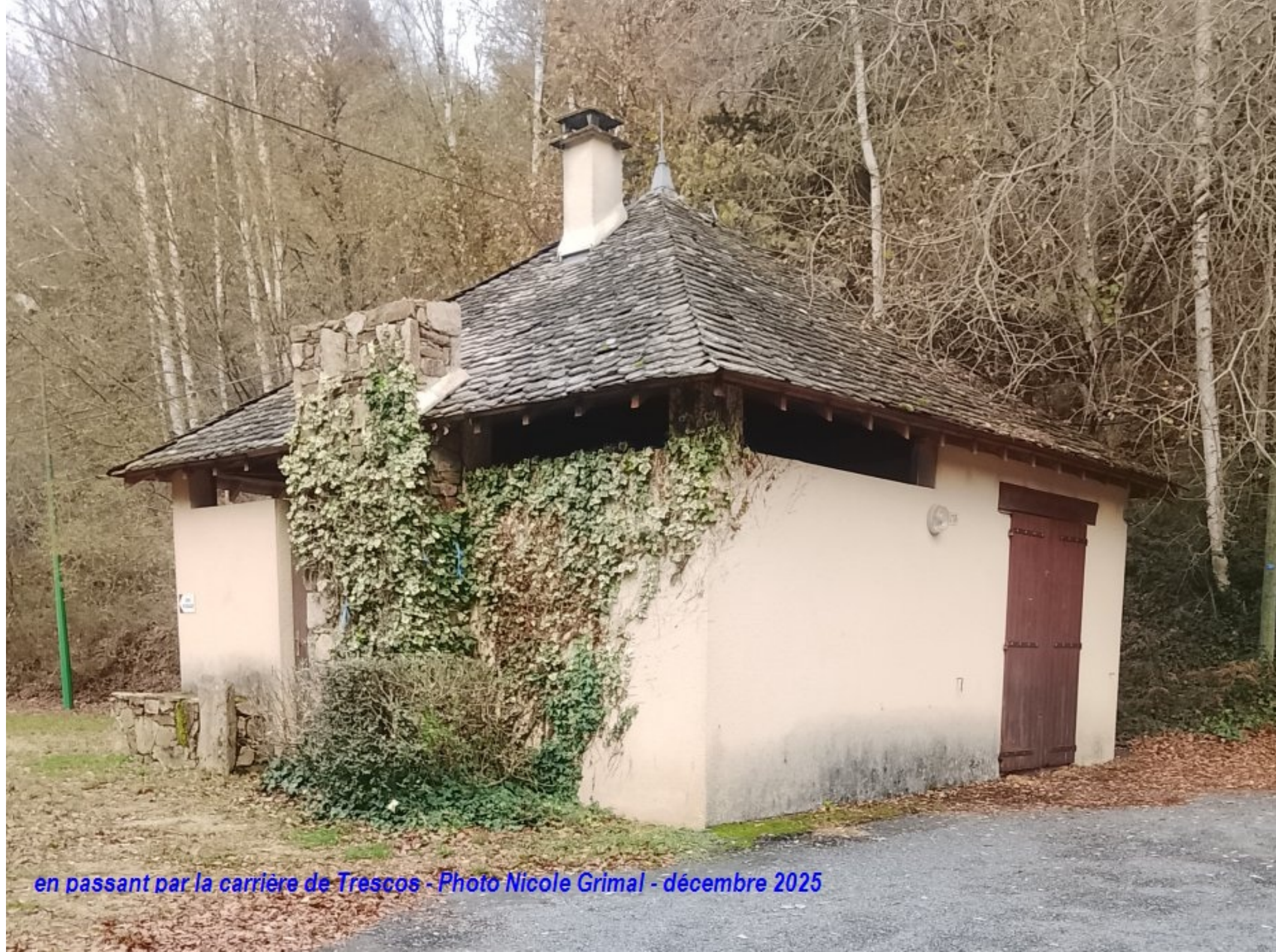
en passant par la carrière de Trescos - décembre 2025