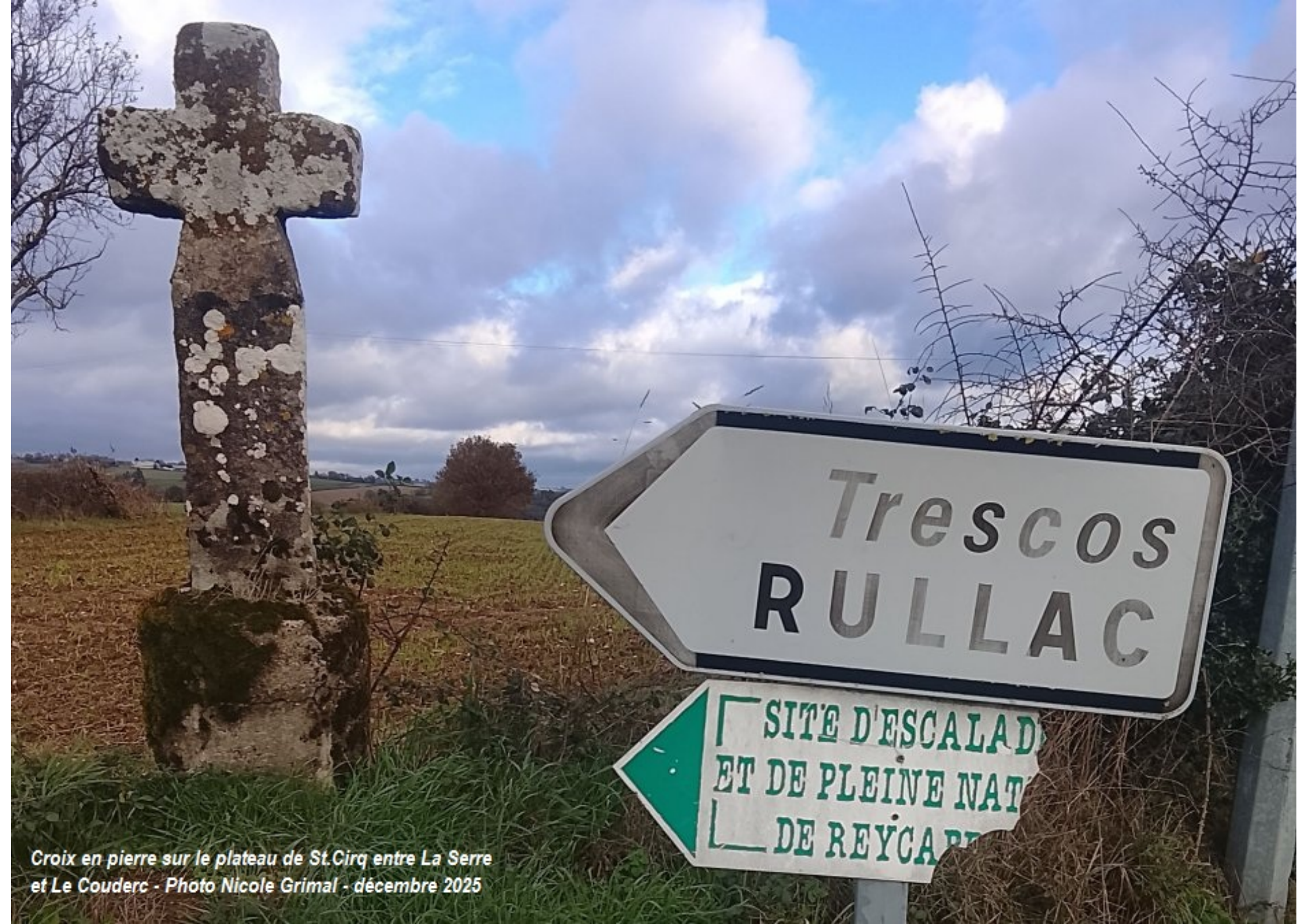
Croix en pierre sur le plateau de St.Cirq entre La Serre et Le Couderc - Photo Nicole Grimal - décembre 2025