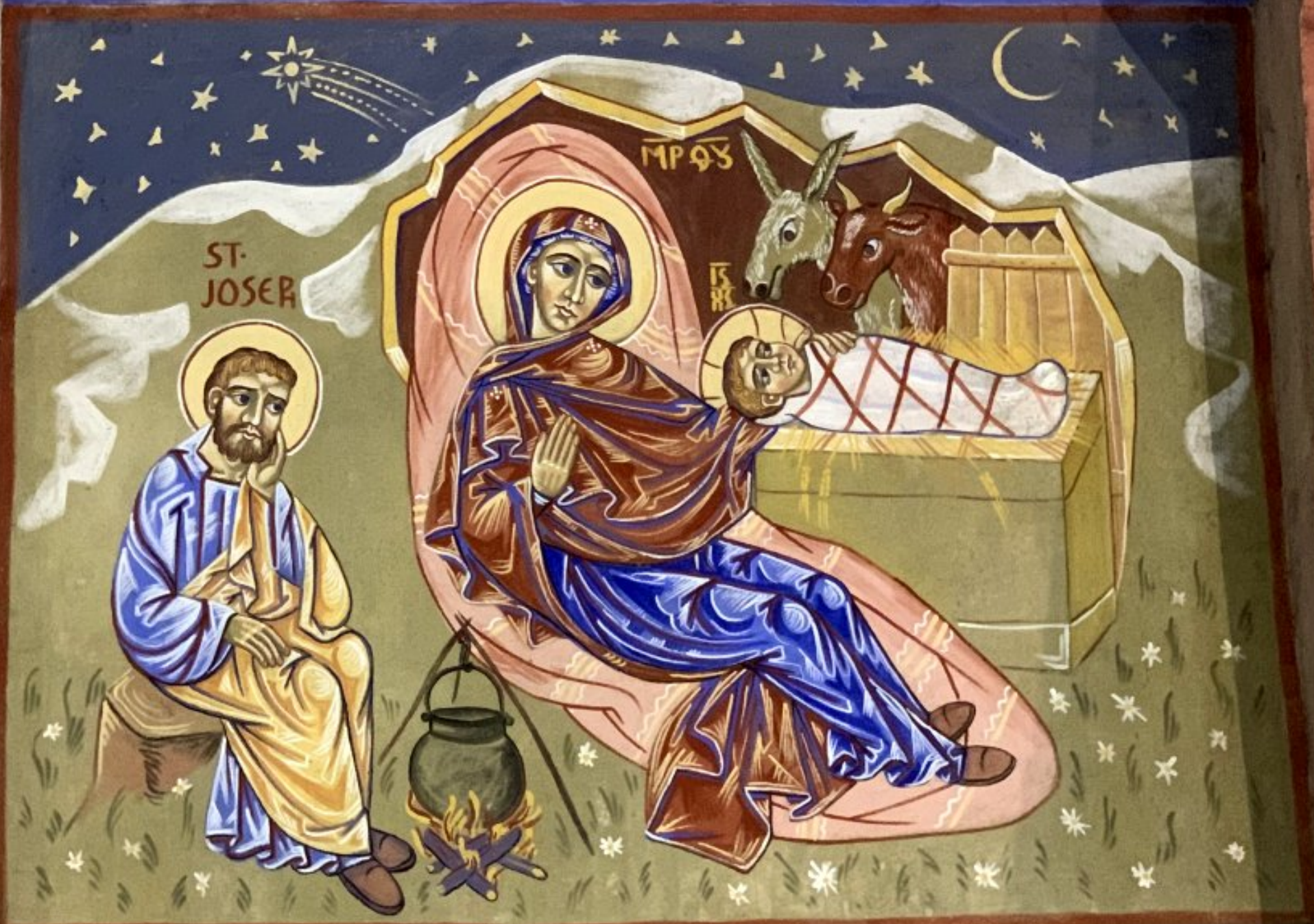
Eglise d'Alban (81) – fresques de Nicolas Greschny