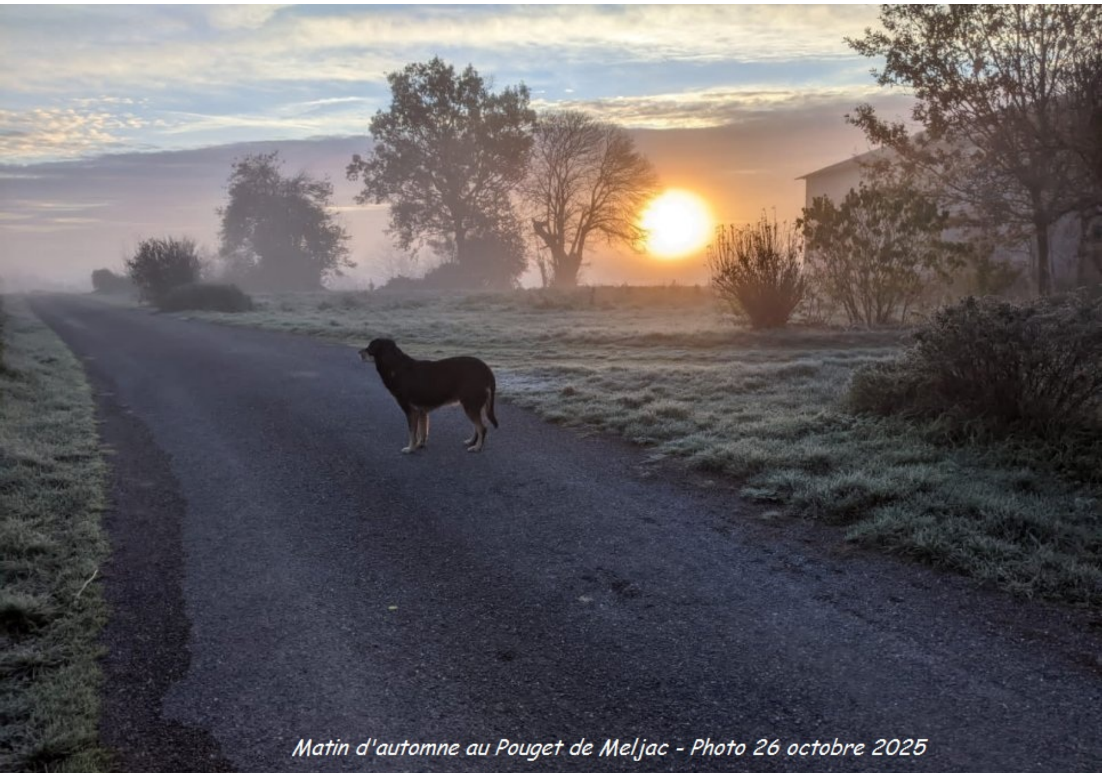
Matin d'automne au Pouget de Meljac - Photo 26 octobre 2025