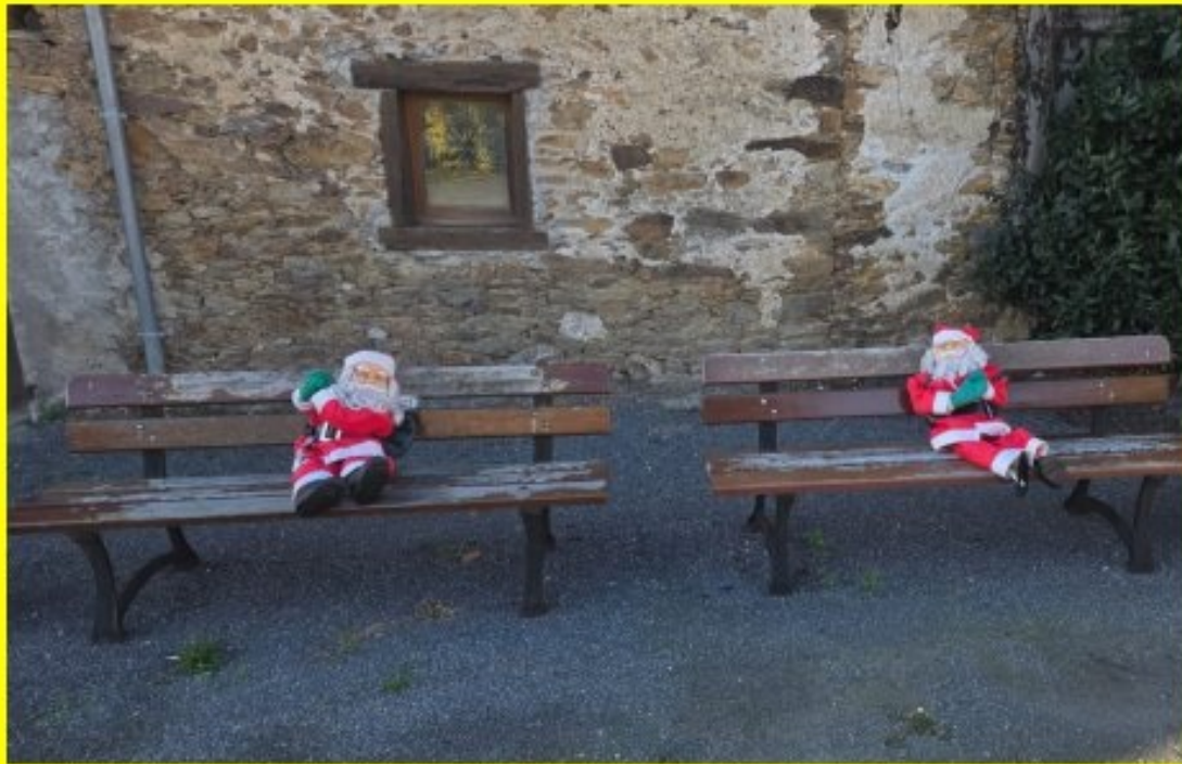
"à la Malric (Lédergue/St.Just), les Pères Noël sont de sortie" - Photo Karine Dueymes - 13 décembre 2025