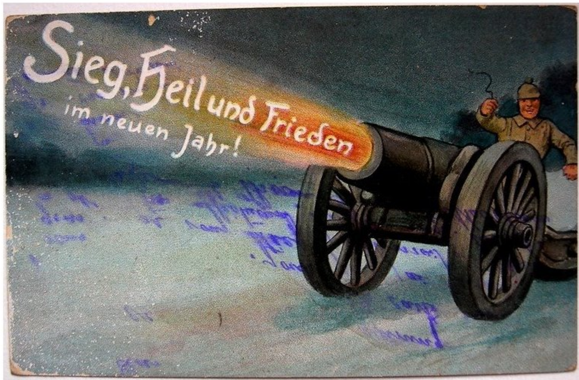
"Victoire et Paix pour la nouvelle année" - carte allemande de voeux 1917