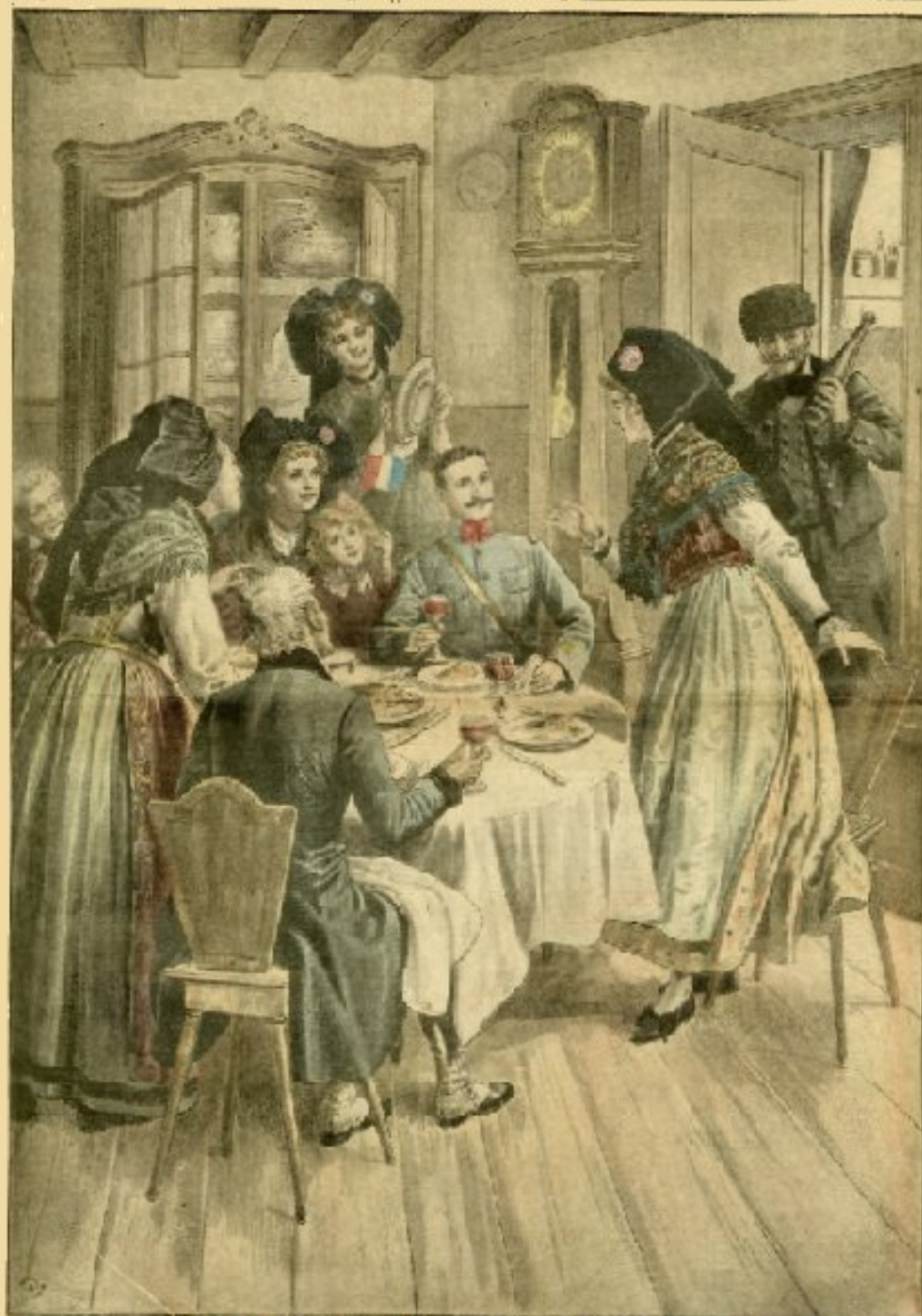
LA FÊTE DES ROIS EN ALSACE "A vous la fêve, mon capitaine"