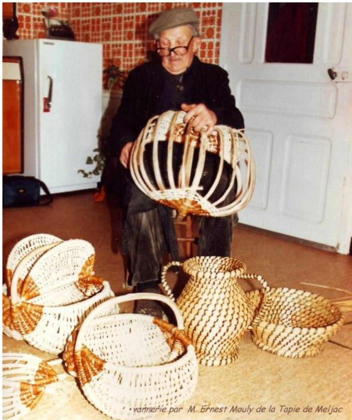
• vannerie par M. Ernest Mouly de la Tapie de Meljac