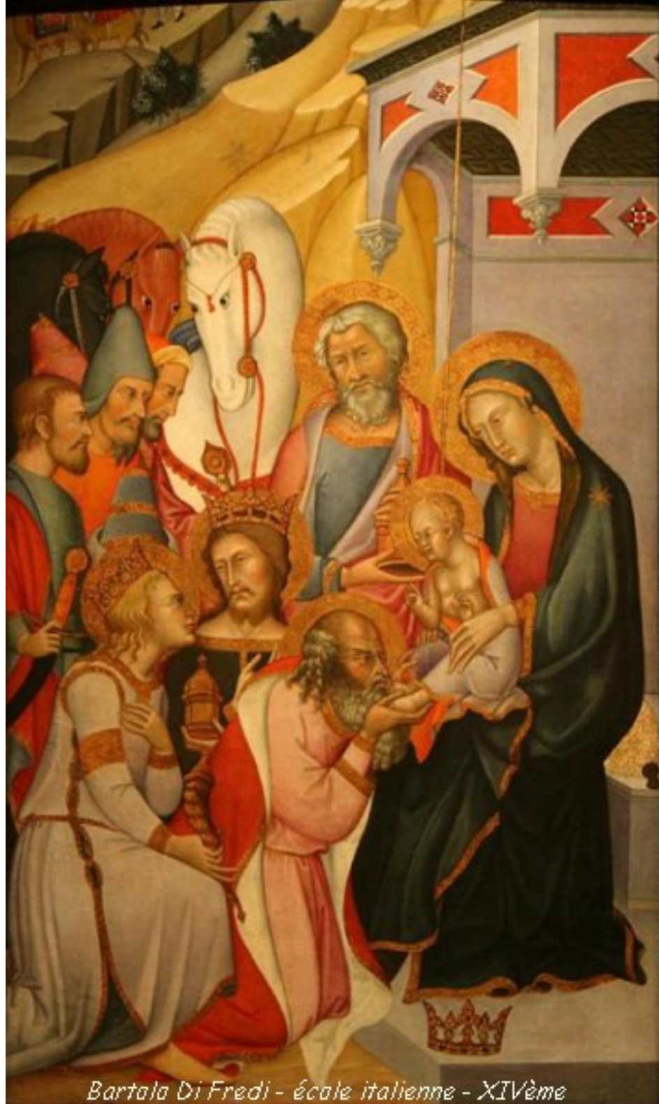
Bartolomeo di Fredi - école italienne - XIVème