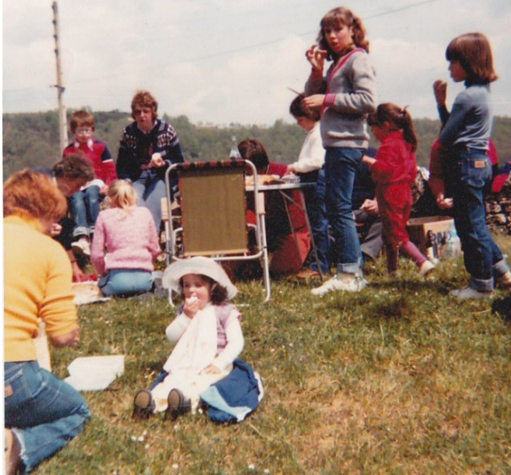
Pèlerinage à Roucayrol