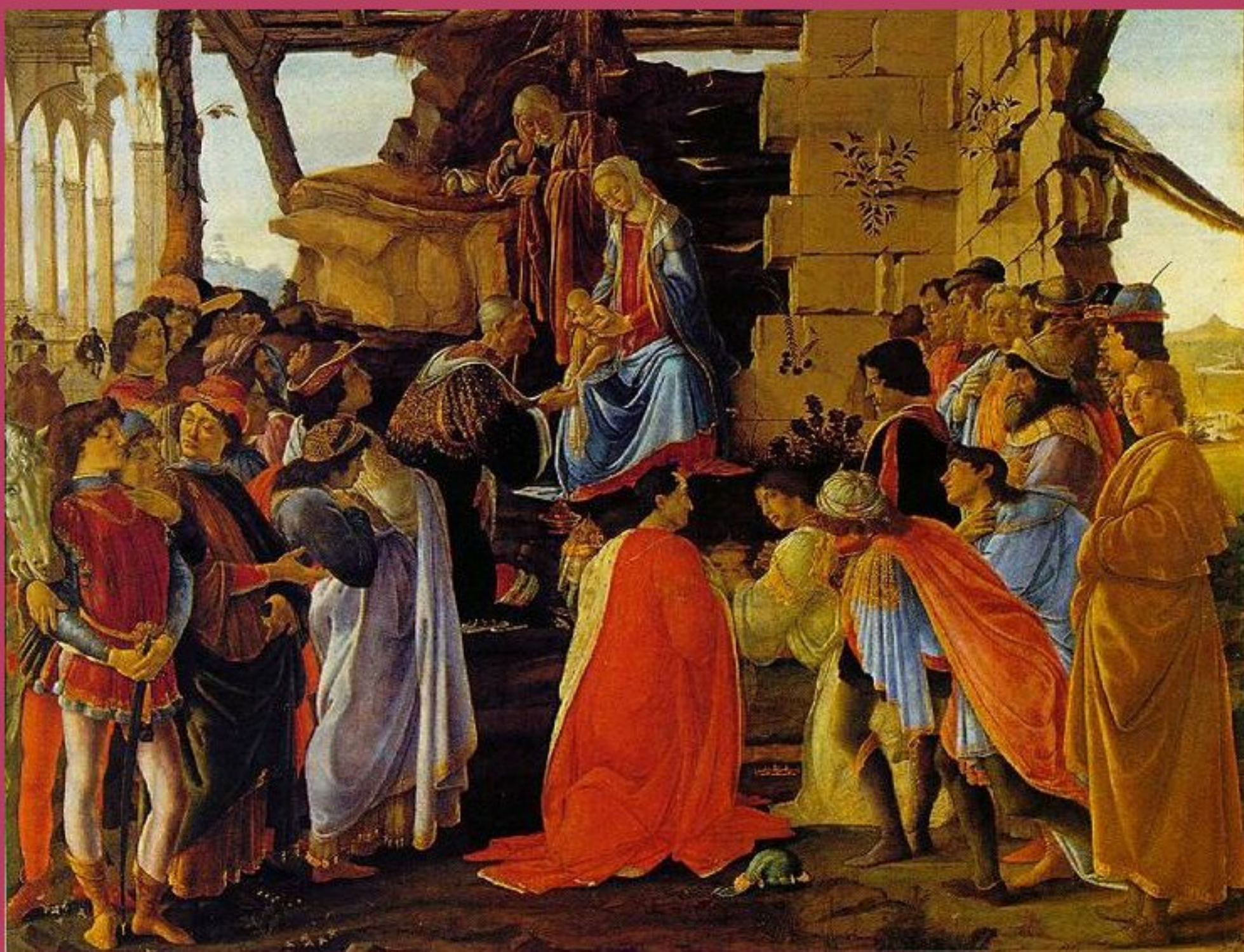
Boticelli - l'adoration des mages - peinture sur bois - Florence