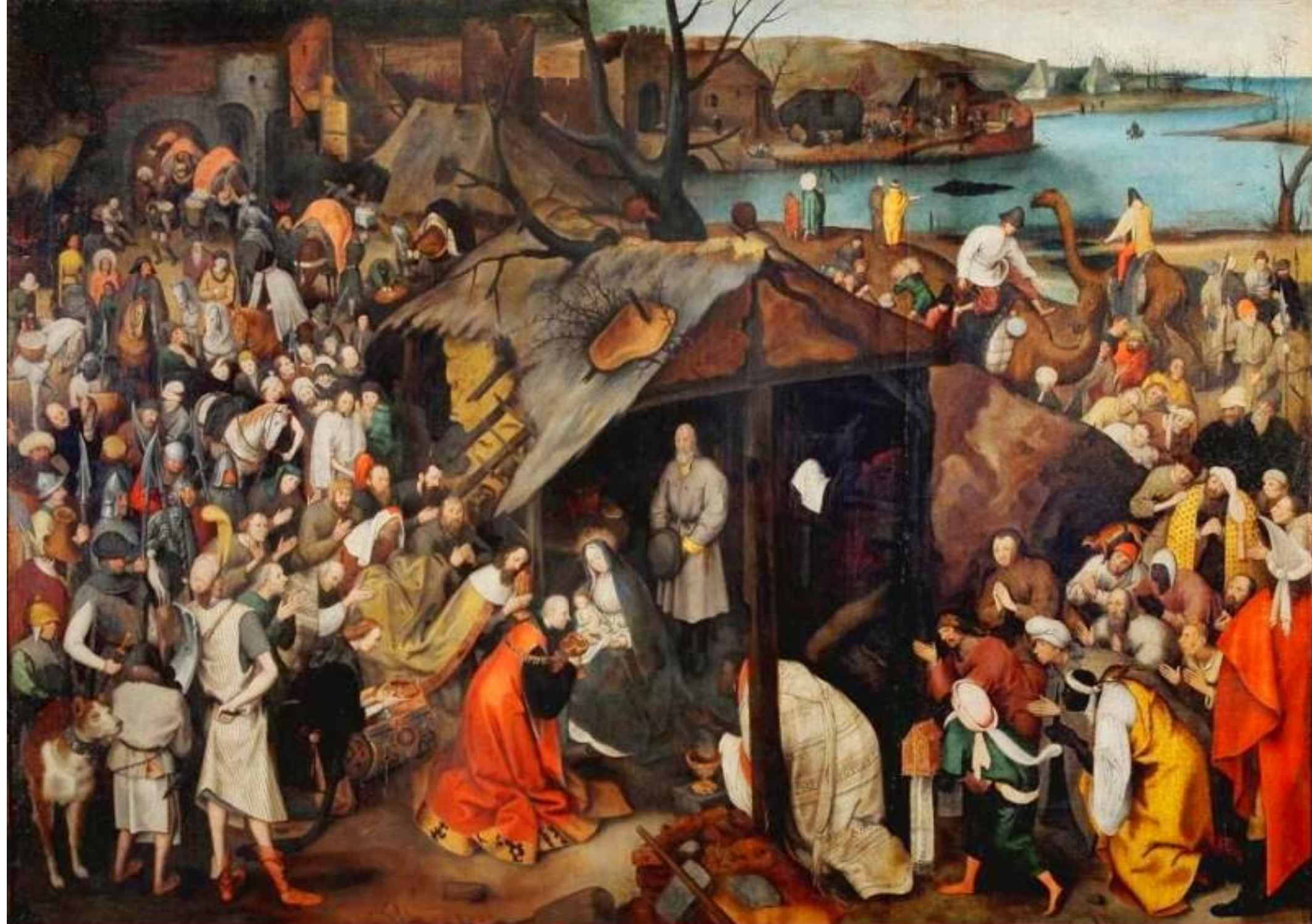
Brueghel - l'adoration des mages - peinture sur bois - Belgique