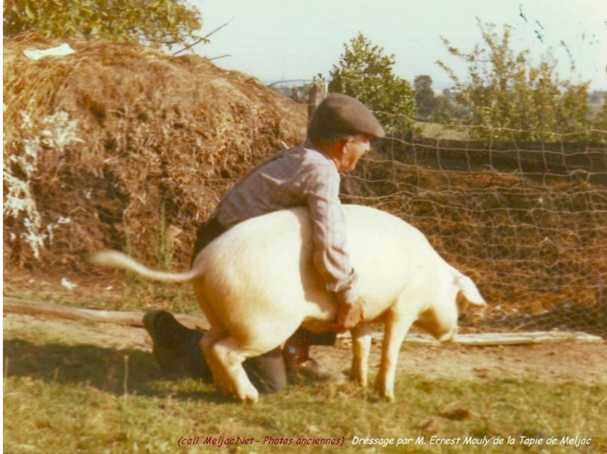
Dressage par M. Ernest Mouly de la Tapie de Meljac