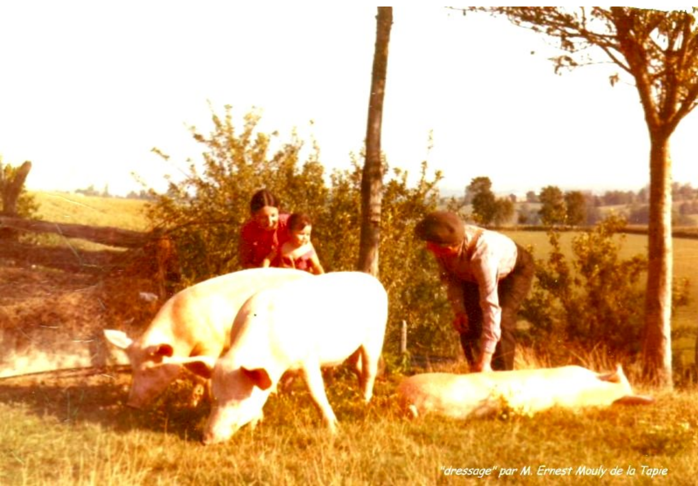
"dressage" par M. Ernest Mouly de la Tapie