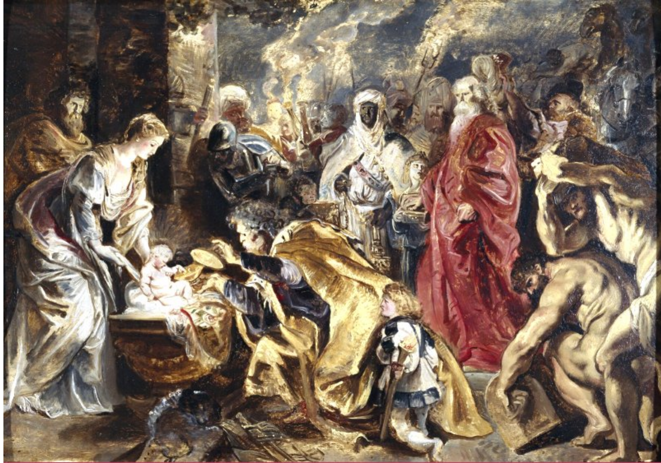
Ruben - l'adoration des mages - école Flamande