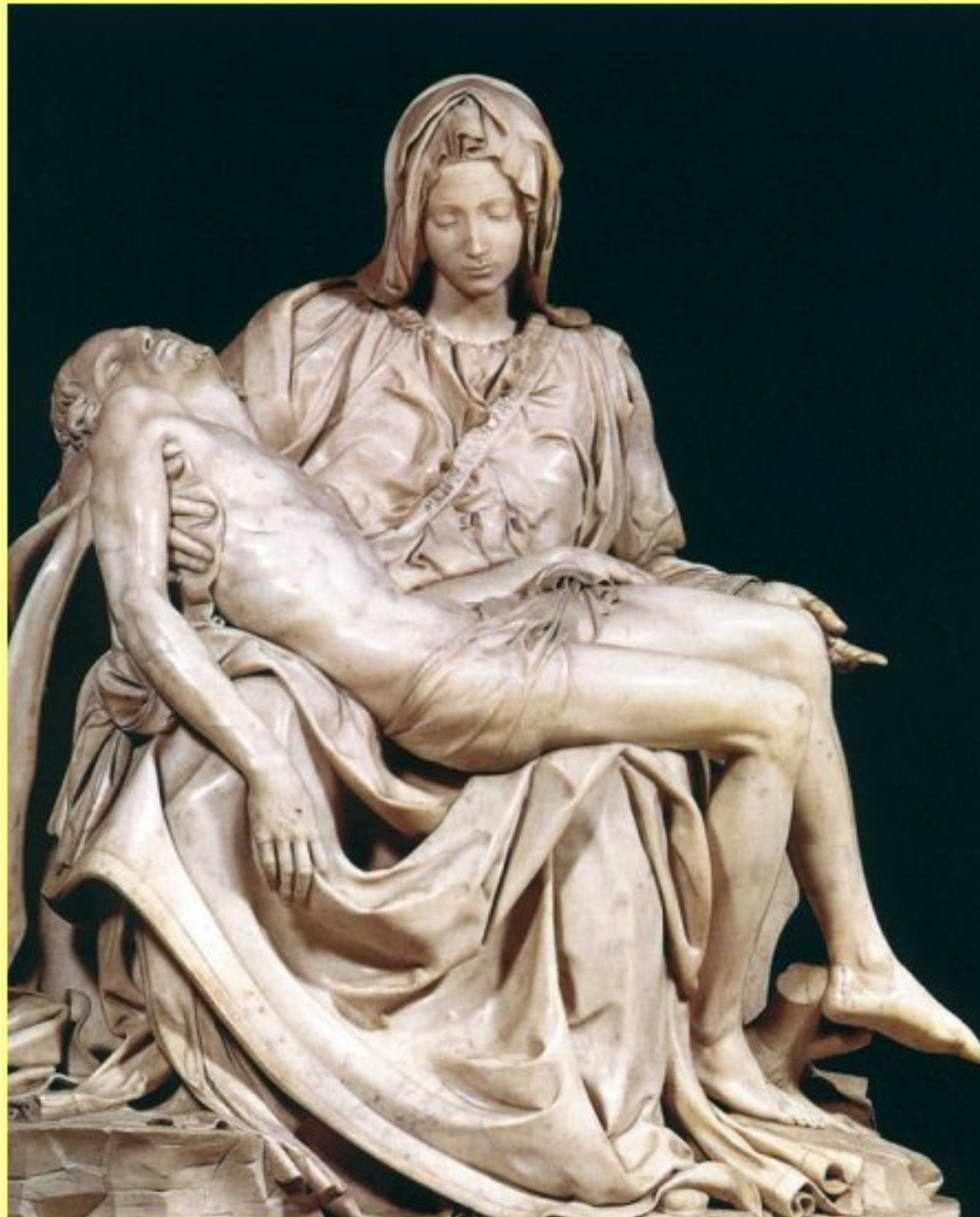
La Pietà de Michel Ange - Saint-Pierre de Rome