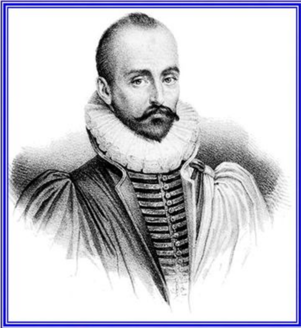
Michel de Montaigne

Si haut que l'on soit placé, on n'est jamais assis que sur son cul.