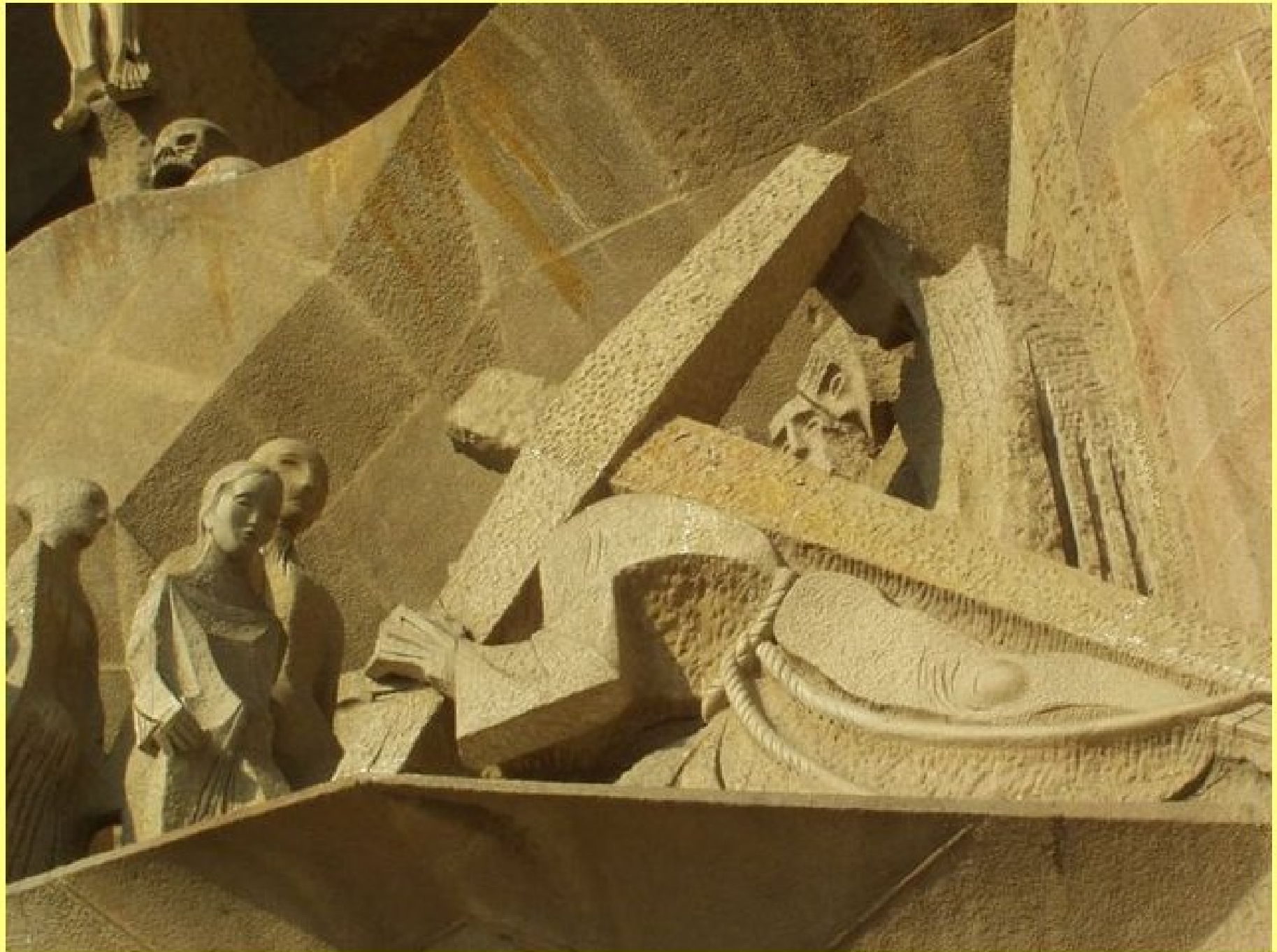
La Sagrada Família - Barcelone