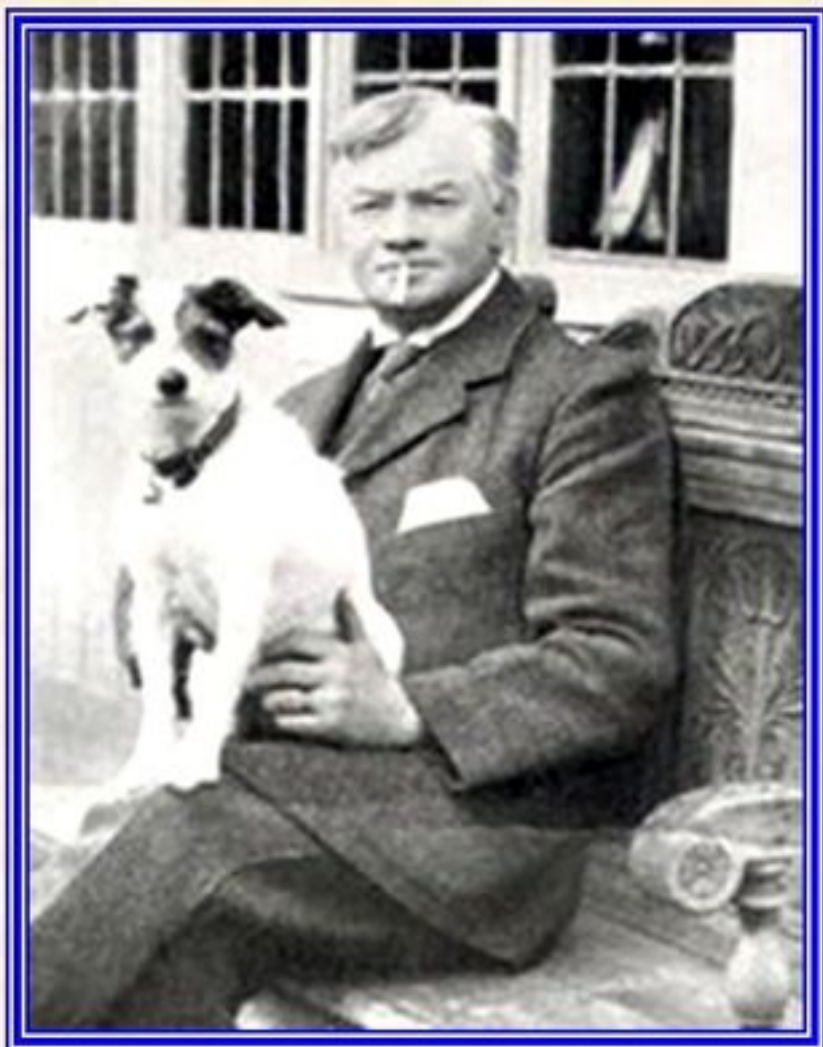
Jérôme K. Jérôme

J'aime le travail : il me fascine. Je peux rester des heures à le regarder.