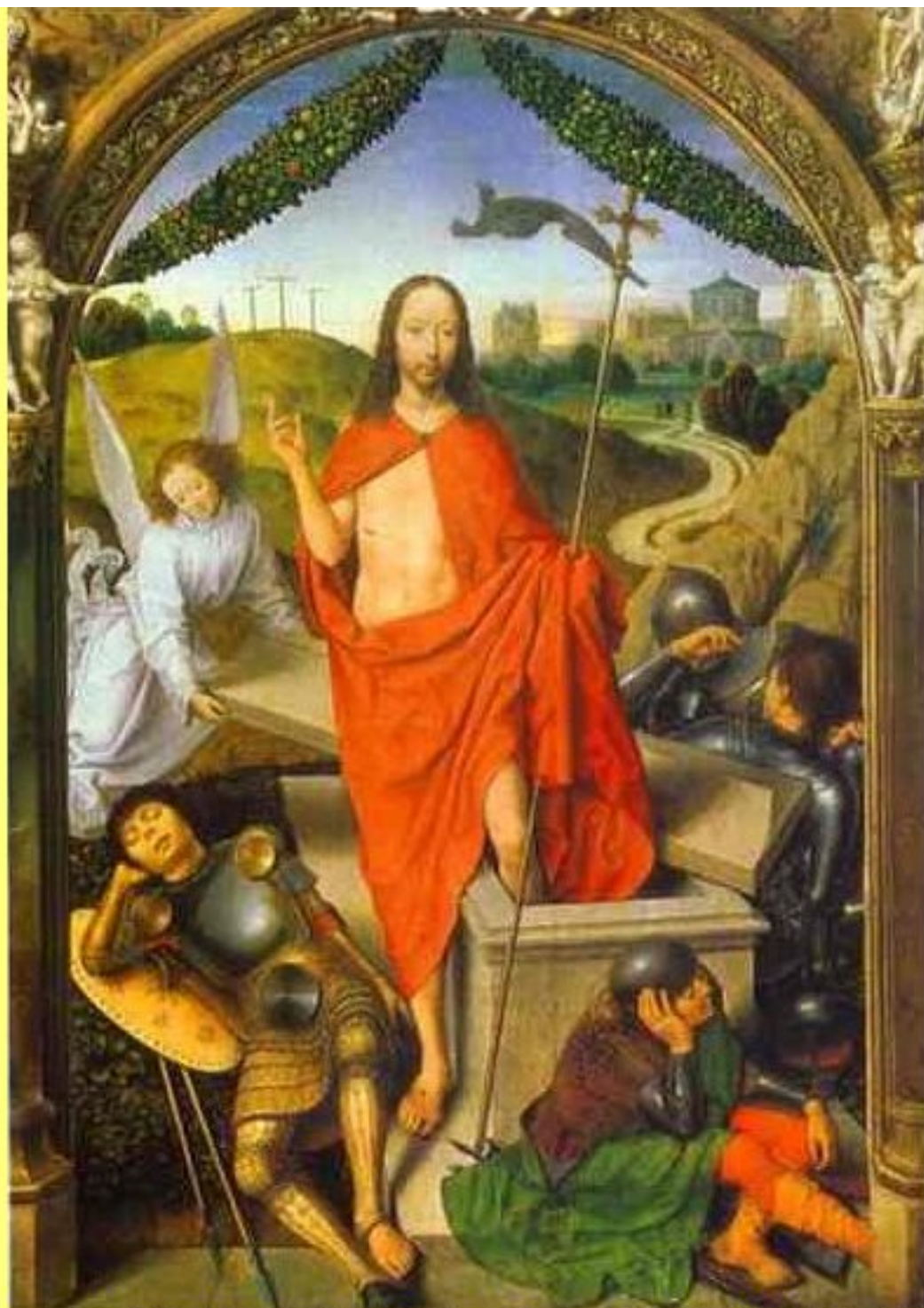
La Resurrection de Hans Memling - Le Louvre Paris (huile sur bois)