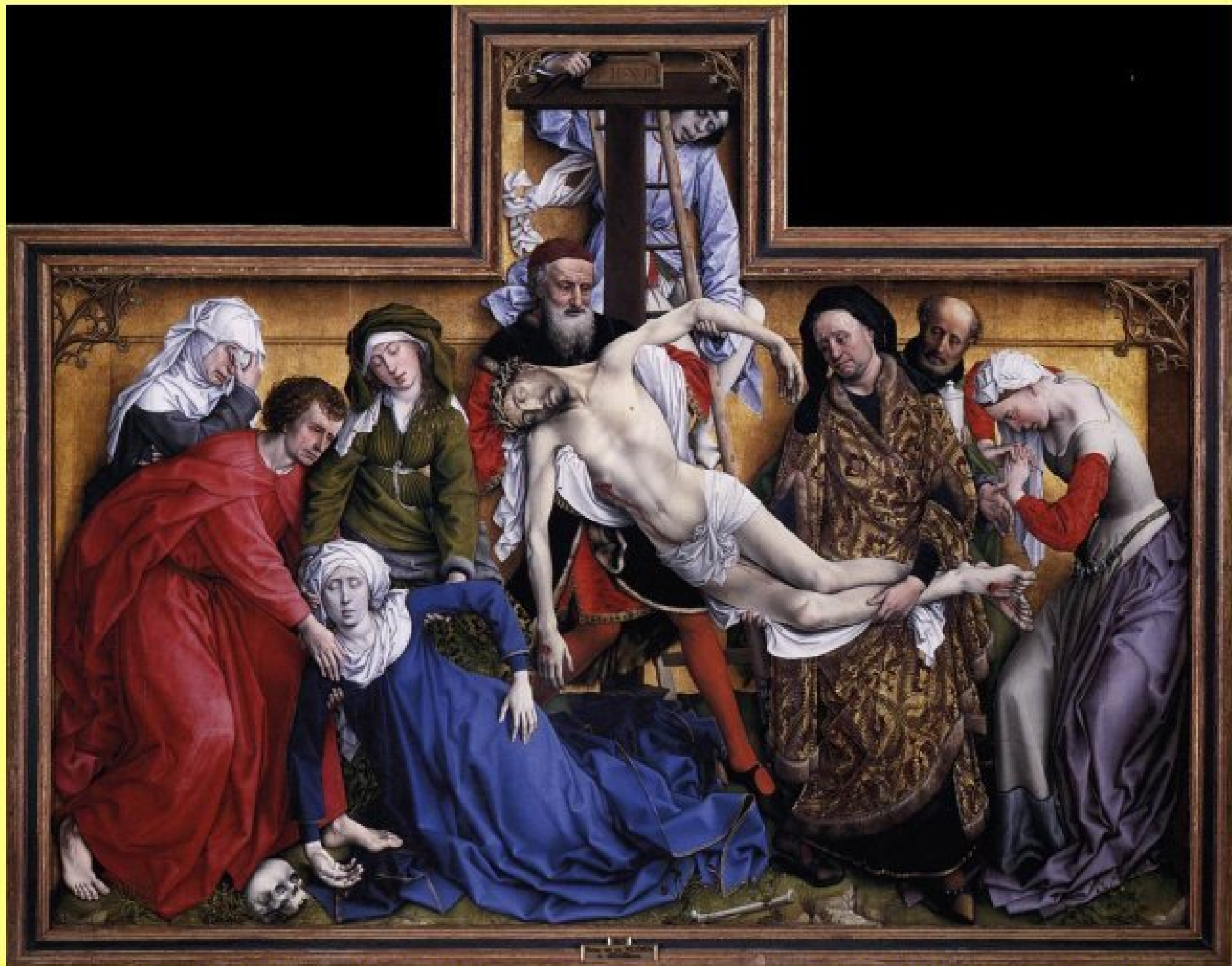
Descente de Croix de Van der Weyden - Musée du Prado à Madrid (huile sur bois)