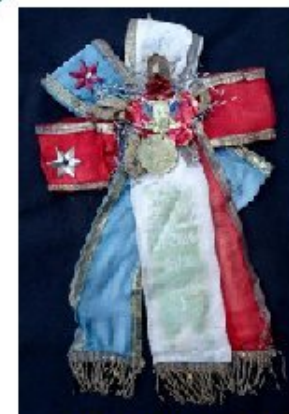
cocarde de conscrit