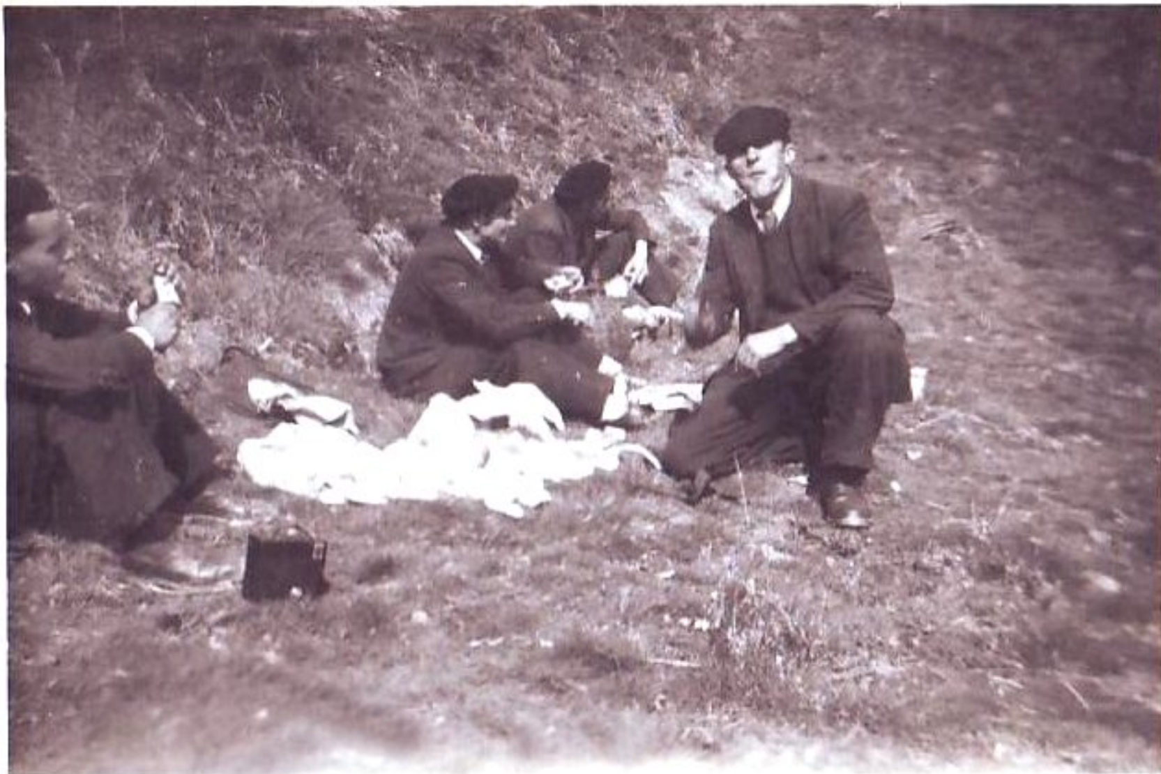
Pèlerinage à Roucayrol - le pique-nique