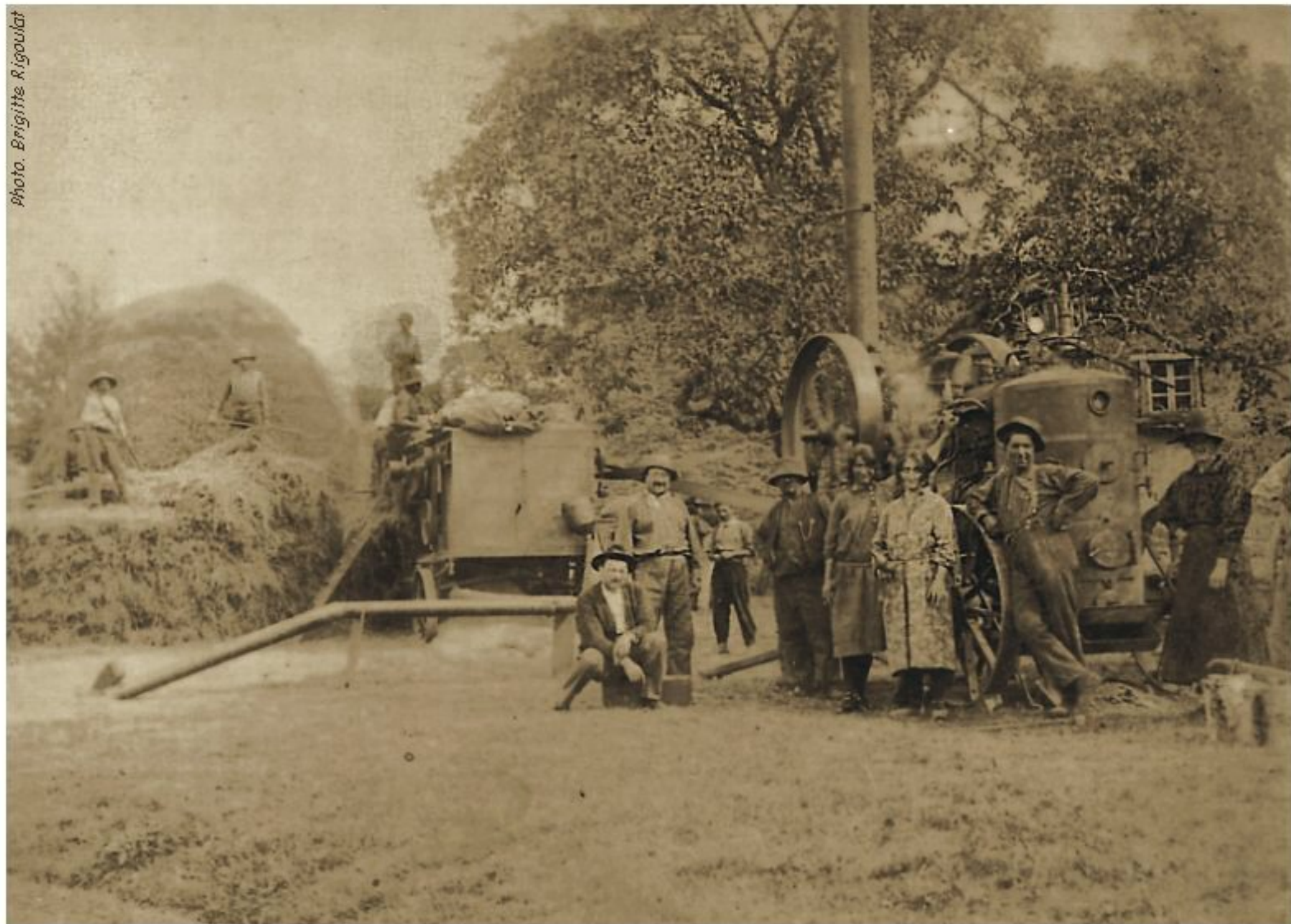
battage à la ferme Sigal du Martinesq