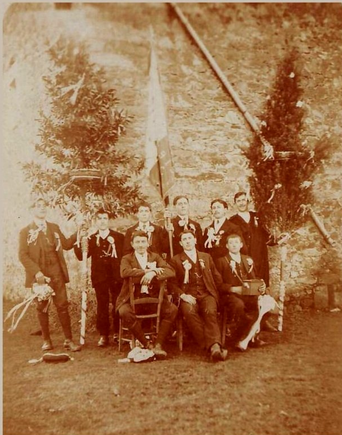
Conscrits meljacois à identifier