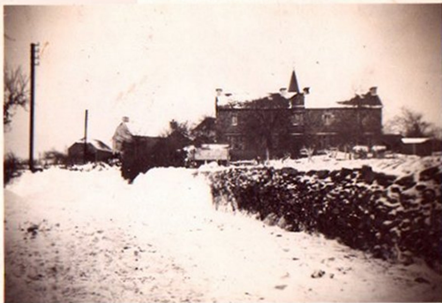
Entrée dans Meljac en venant du cimetière avec au fond à droite, l'école et le clocher de l'église par dessus le toit de l'école