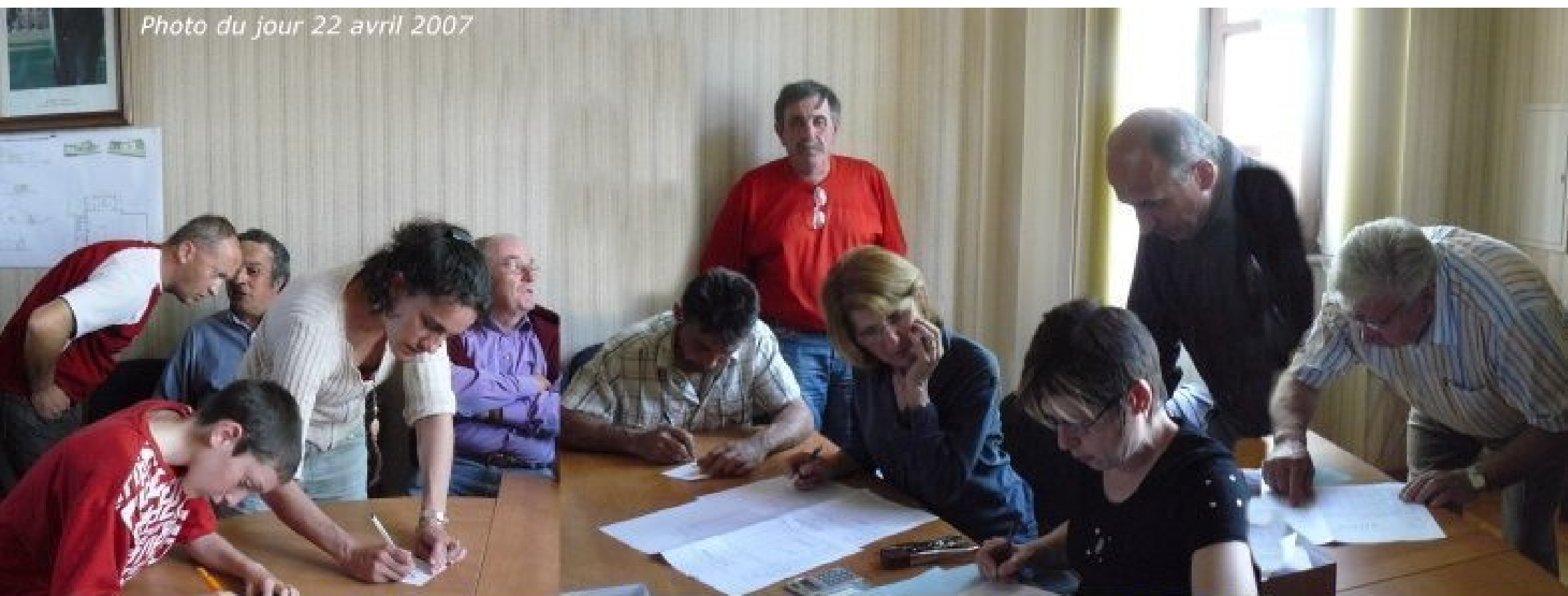
Photo du jour 22 avril 2007

(Inscrits: 169 Votants: 142 Suffrages exprimés: 141 Nul: 1)