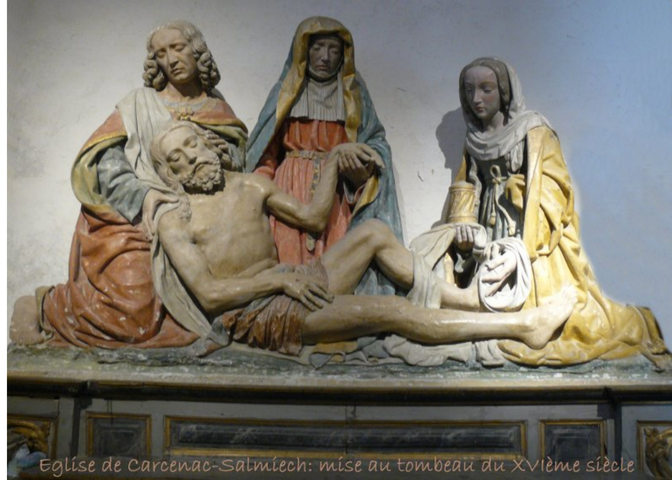
Eglise de Carcenac-Salmiech: mise au tombeau du XVIème siècle