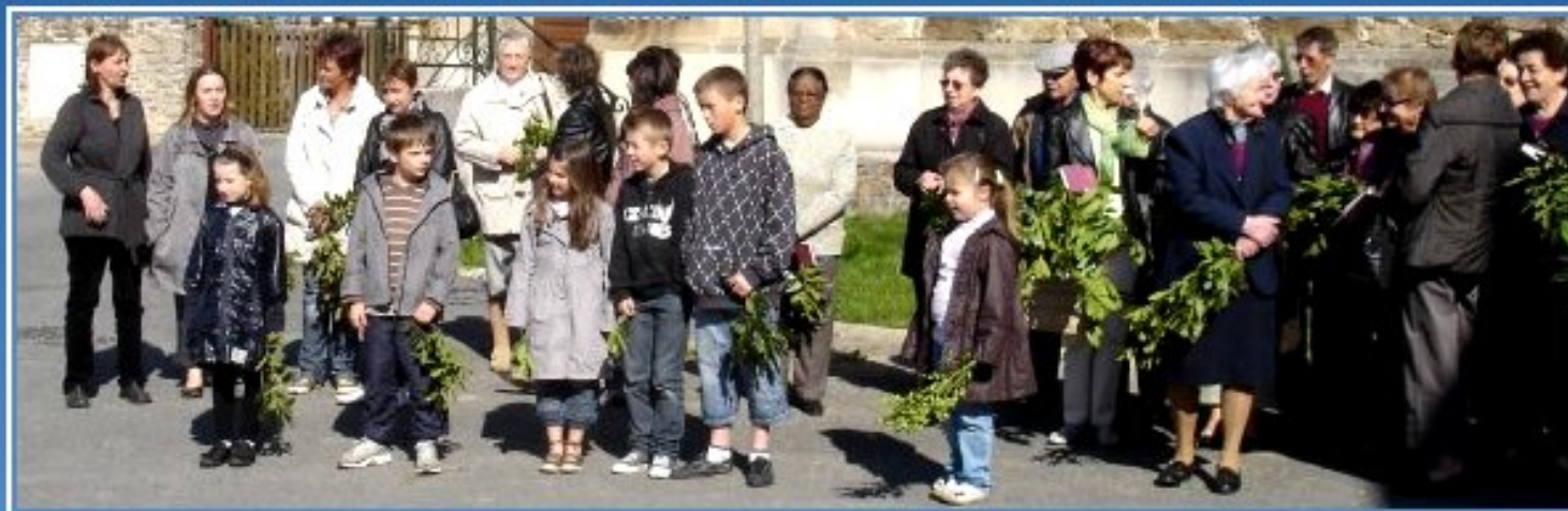
Meljac - 17 avril 2011: bénédiction des Rameaux et de la Croix du Jubilé rénovée fin 2010