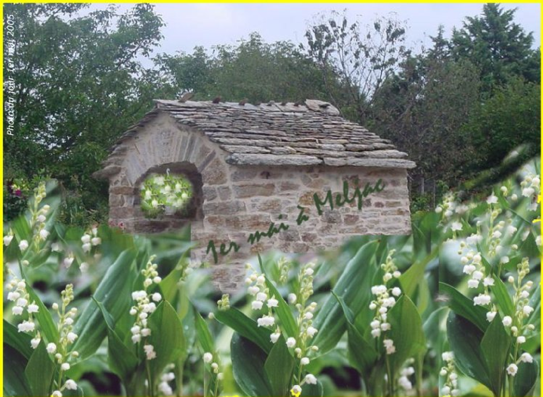
Photo du jour 1er mai 2005