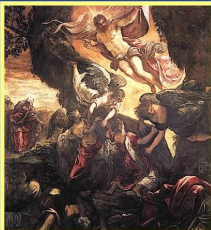
La résurrection du Christ- Le Tintoret - Venise