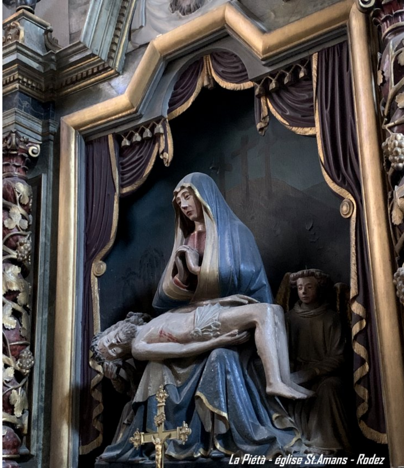
La Piétà - église St. Amans - Rodez