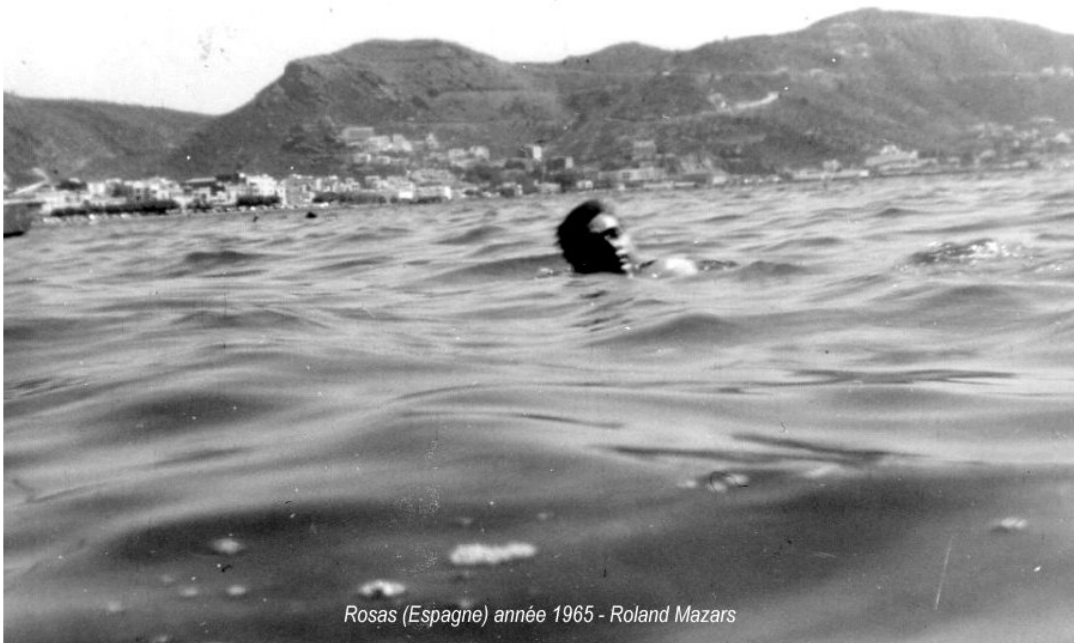
Rosas (Espagne) année 1965 - Roland Mazars