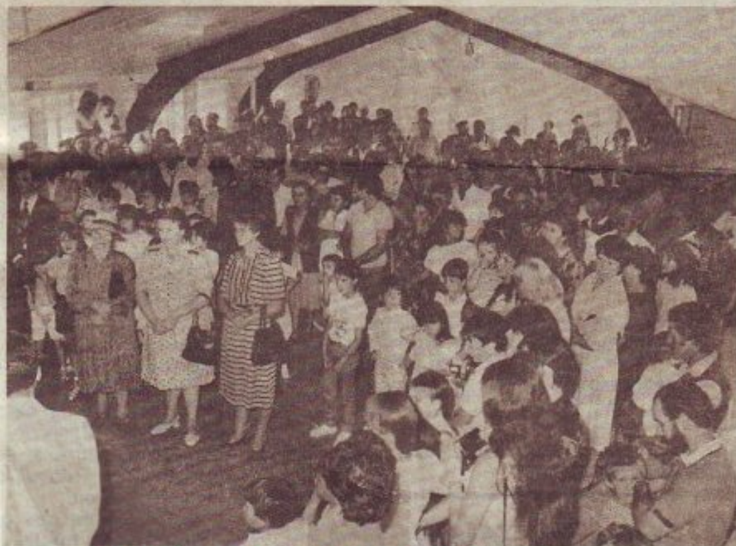
à l'occasion de la Fête des mères.