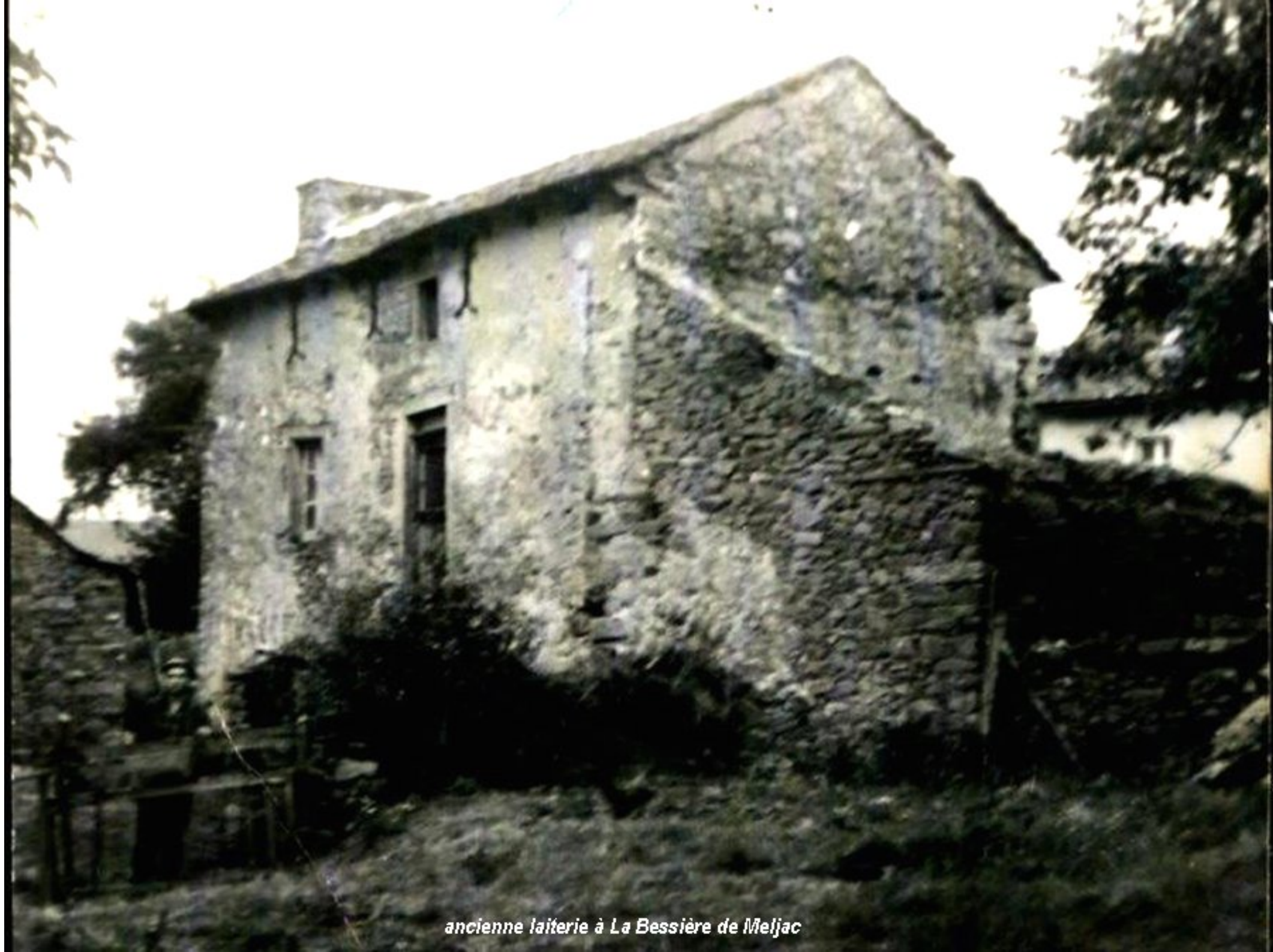
ancienne laiterie à La Bessière de Meljac