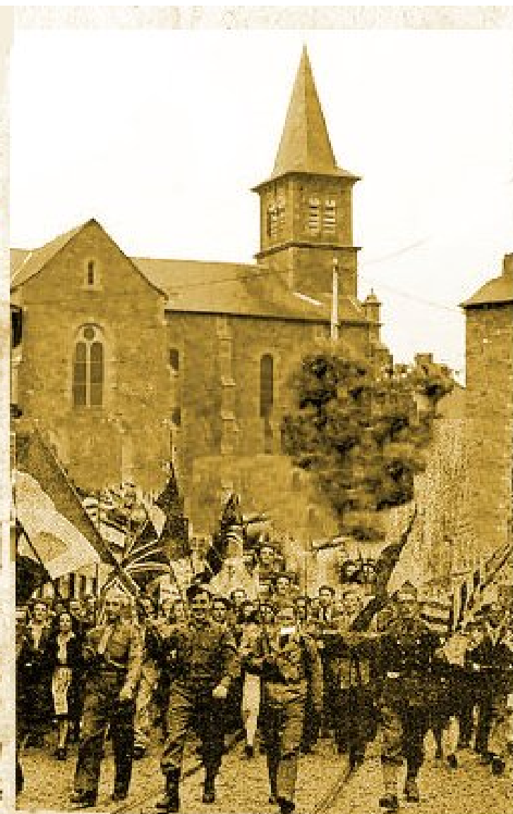
A Meljac, la victoire est fêtée... p.3