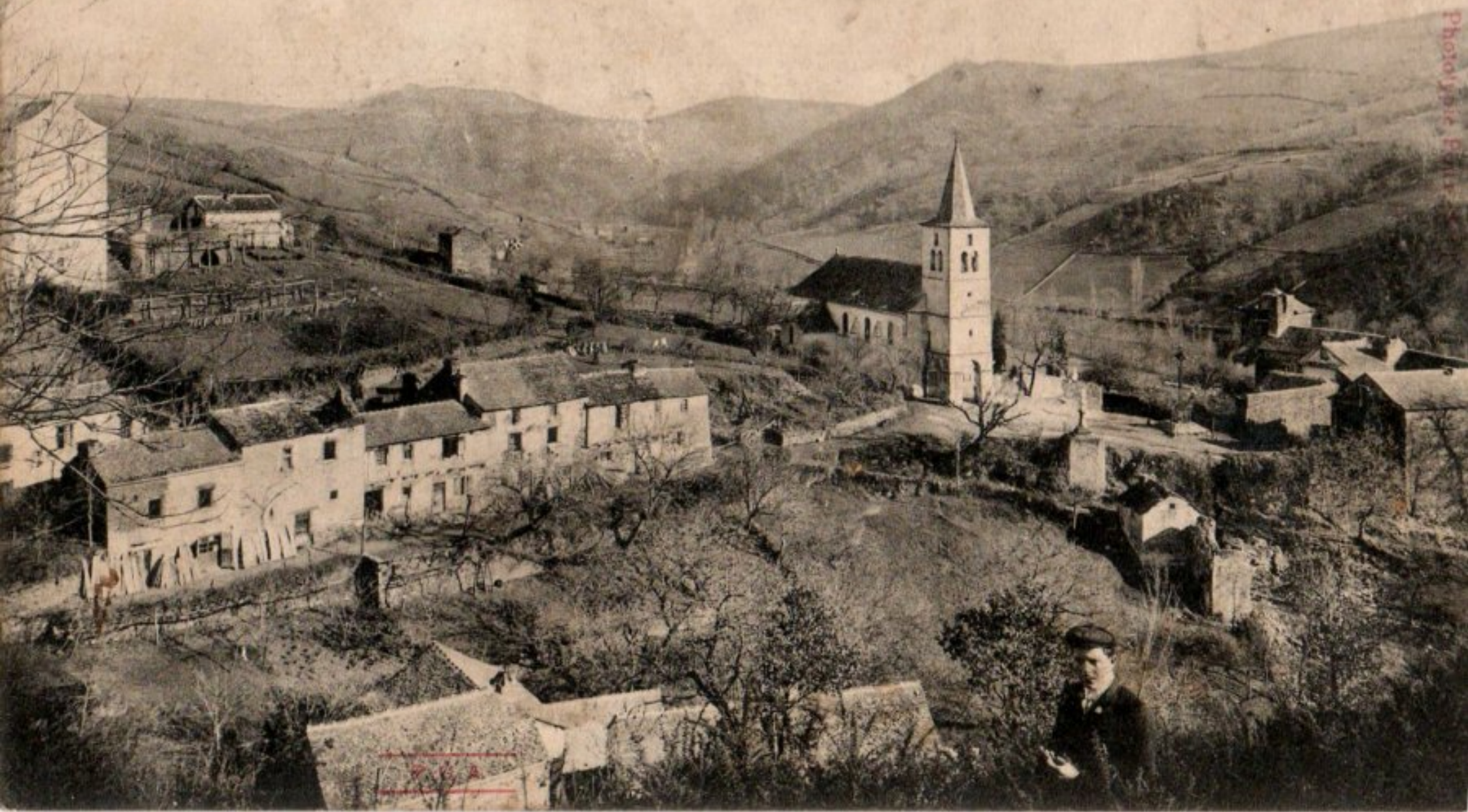
163. — SAINT-JUST (Aveyron). — Château-Fort, Ableye, 2 k. du viaduc au viaduc