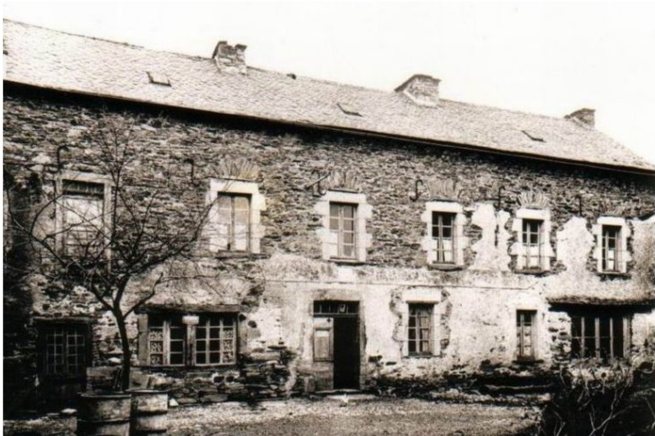
Maison Famille Clément Bousquet - Le Bourg de Meljac