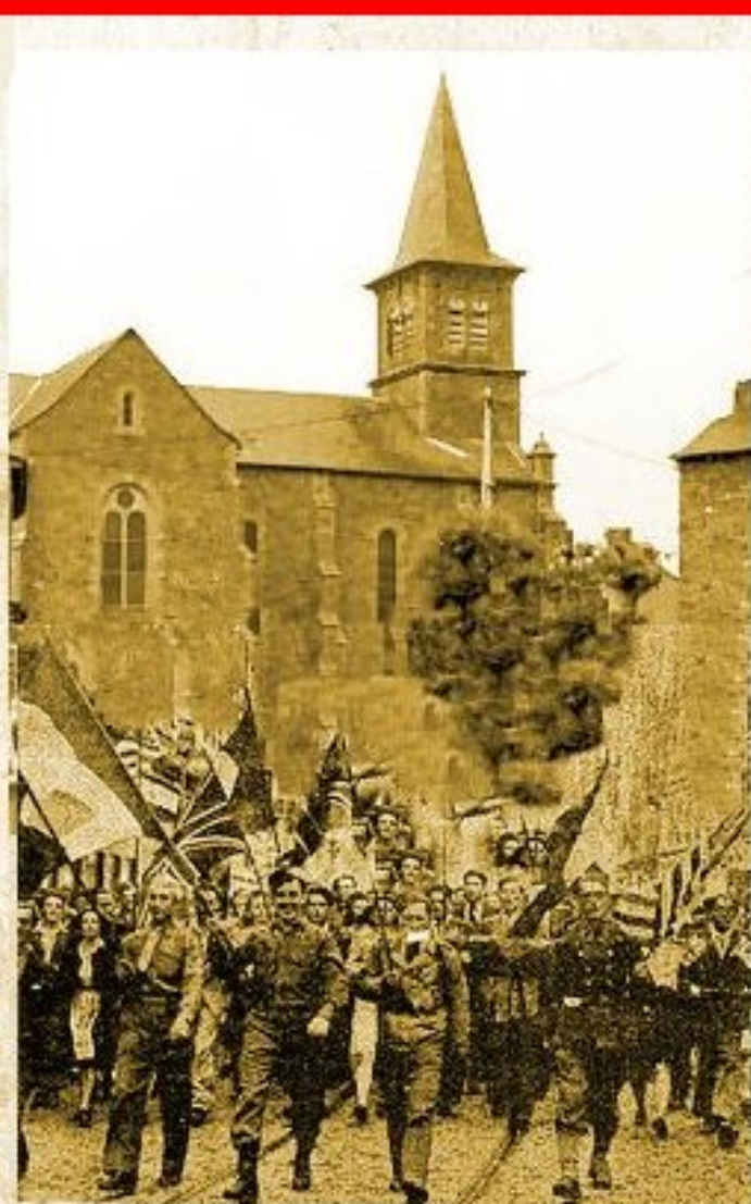
A Meljac, la victoire est fêtée... p.3