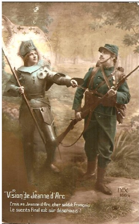
"Jeanne d'Arc dans la Grande Guerre"