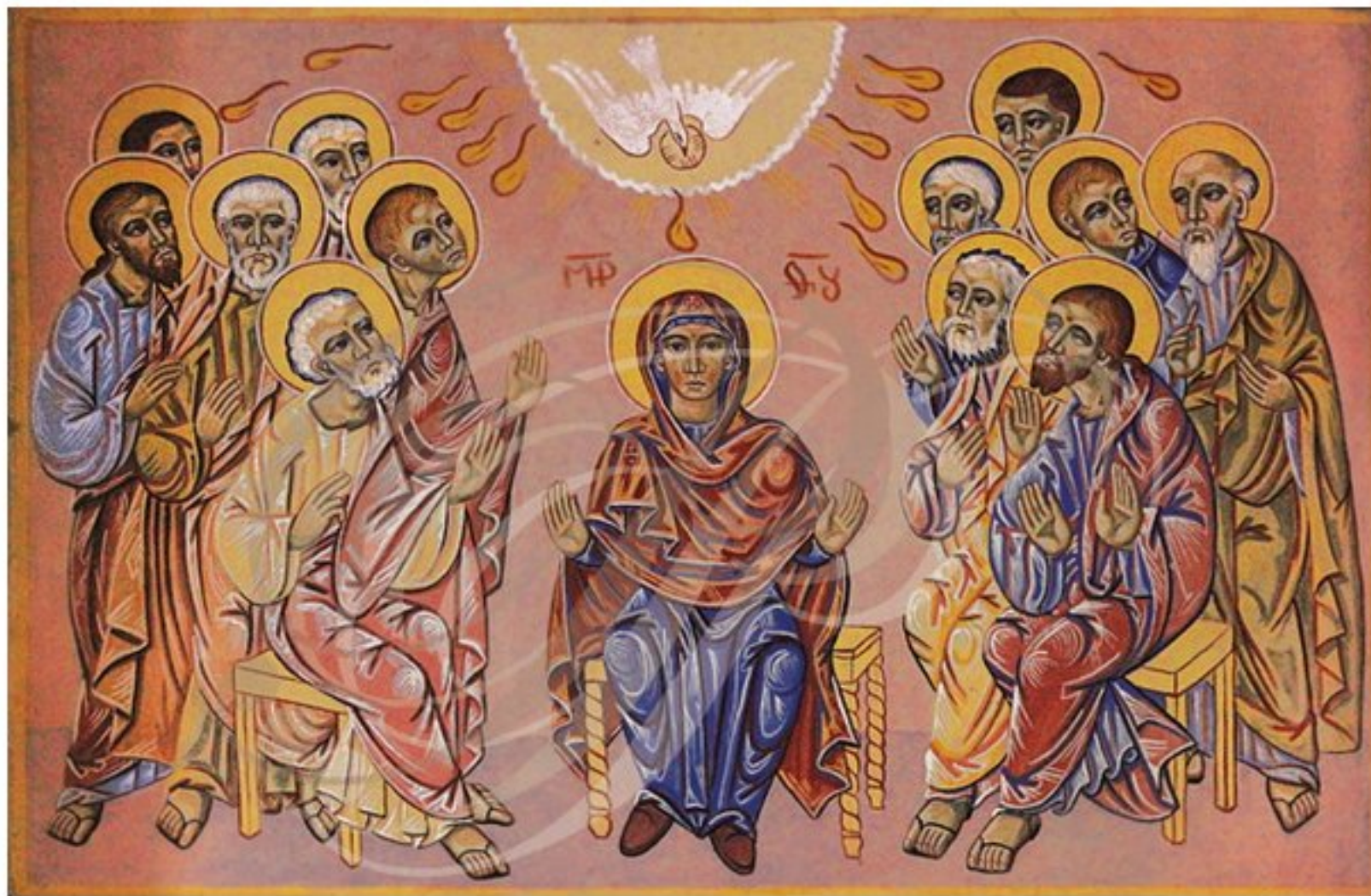
Pentecôte - fresque de Nicolas Greschny - église d'Alban (Tarn)