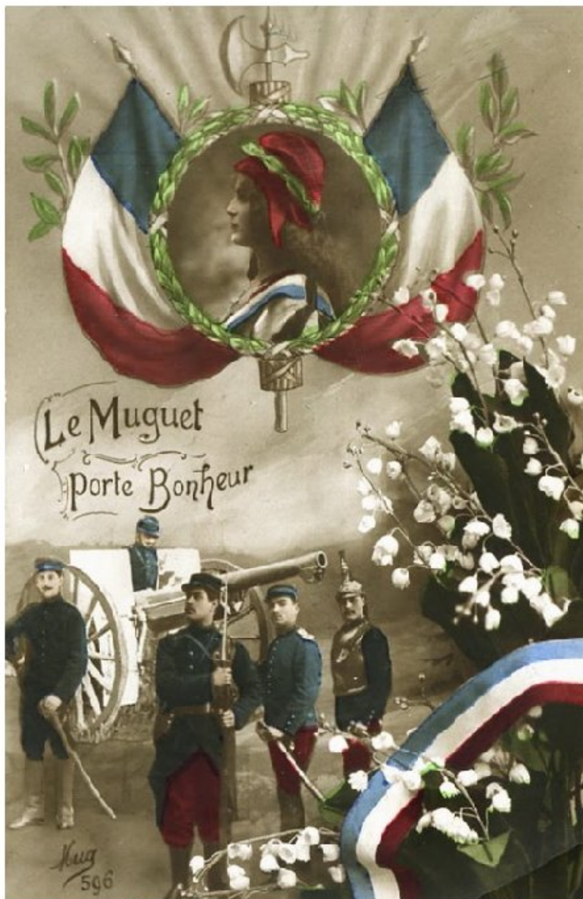
Carte de vœux 1er mai - Grande Guerre