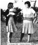
La Sonata 1967 - Collezione di Milano