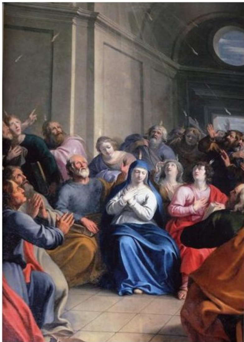
Pentecôte - tableau du 17ème siècle église de Saint-Flour (15)