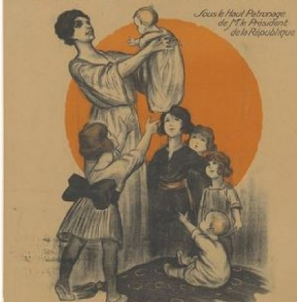
carte de vœux 1914-1918 - Fête des Mères