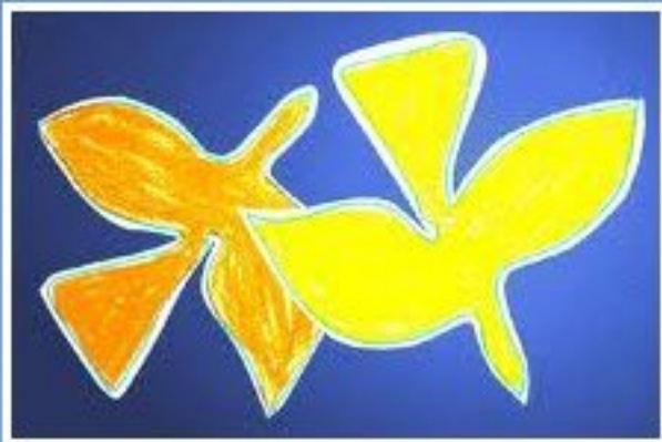
les oiseaux de Braque