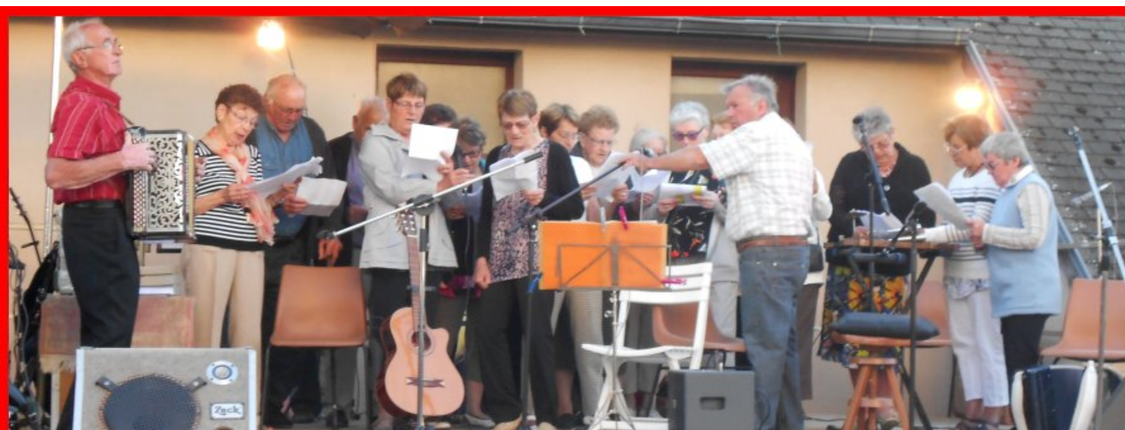
Fête de la Musique à Rullac - 20 juin 2015