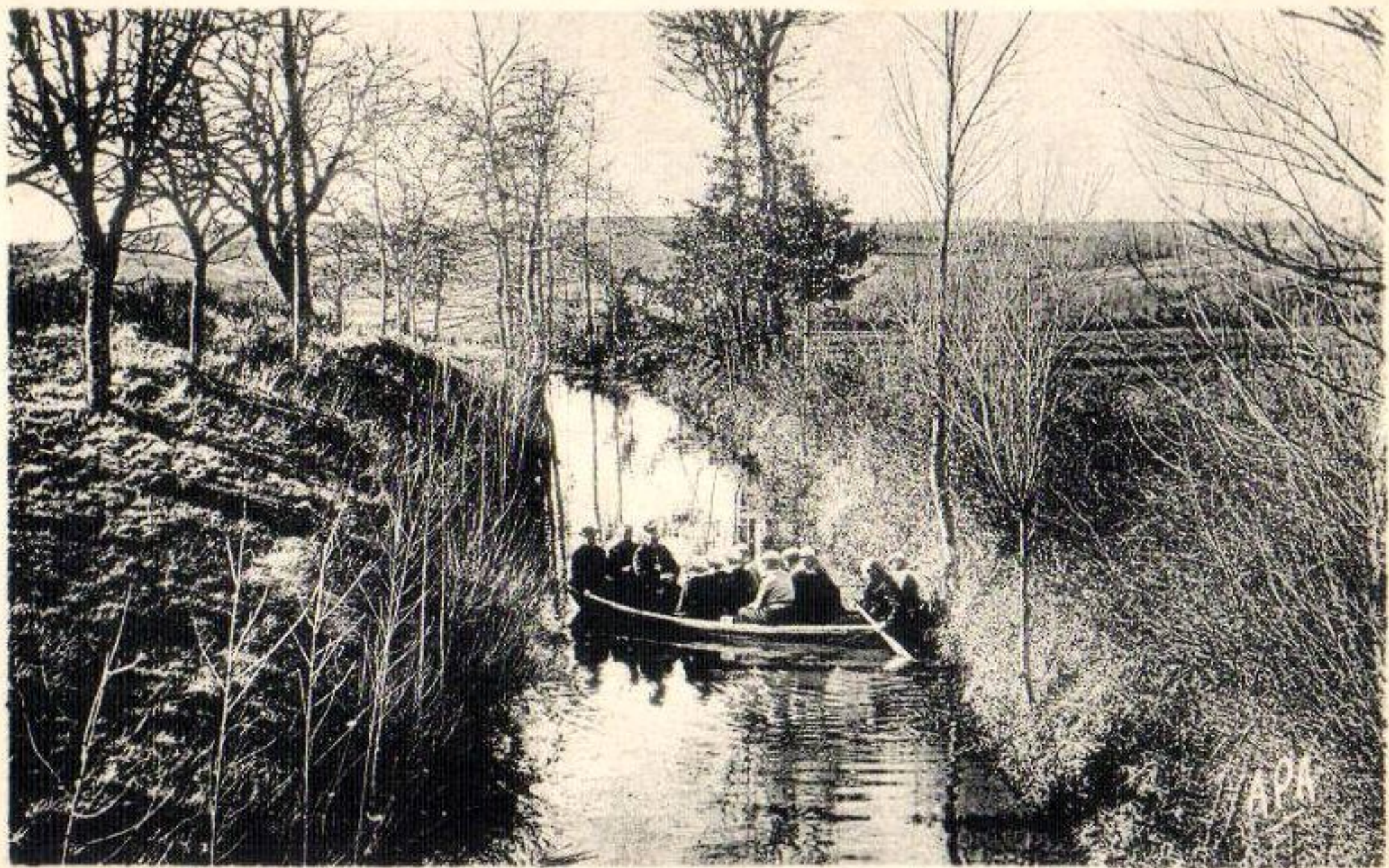
6. Enclos de la CLAUSE par Rêquista (Aveyron) - Canal entourant la Maison de Repos