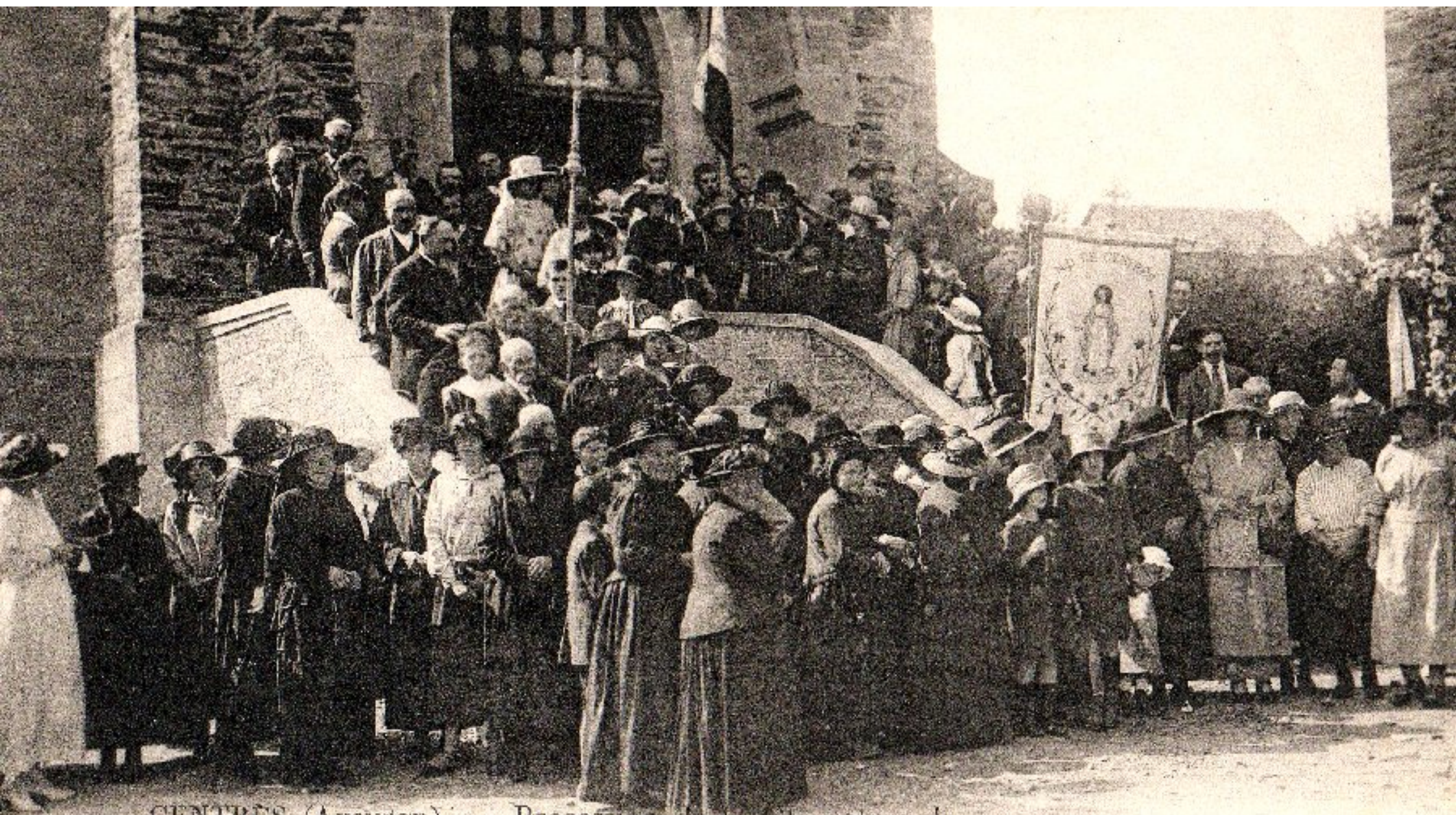
CENTRÈS (Aveyron). — Procession de la fête patronale (N.-D. de l'Assomption)