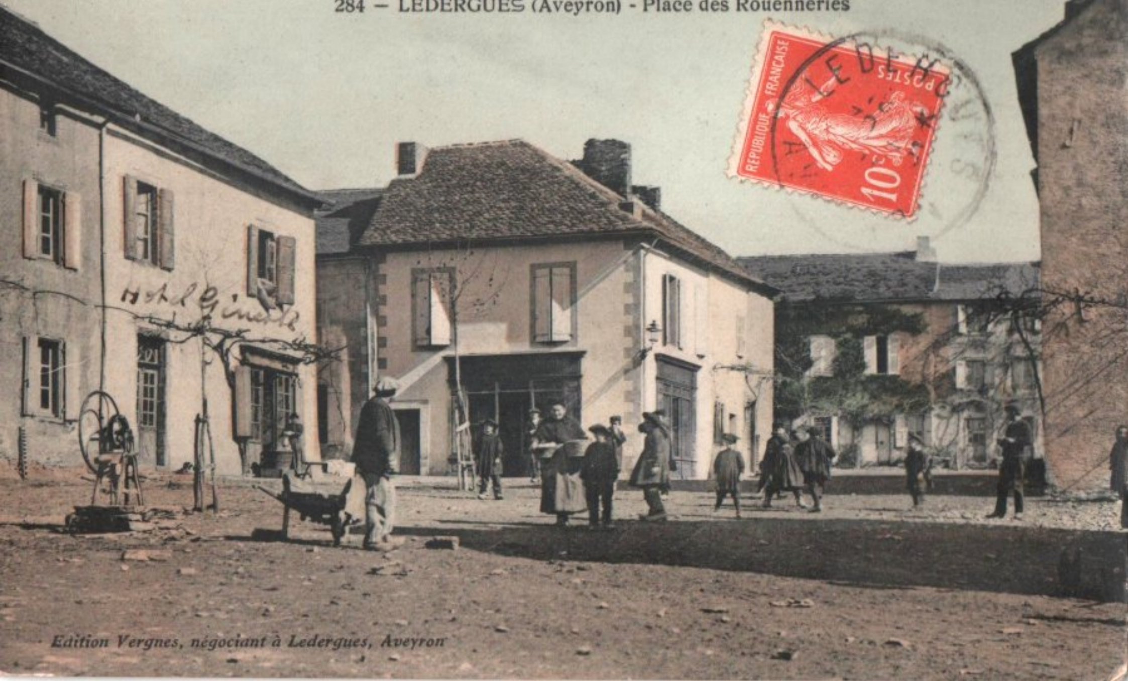
284 — LEDERGUES (Aveyron) - Place des Rouenneries