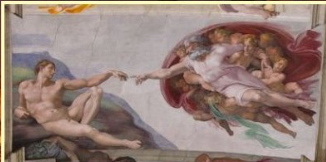
"La création de l'Homme" par Michel Ange (chapelle Sixtine au Vatican)