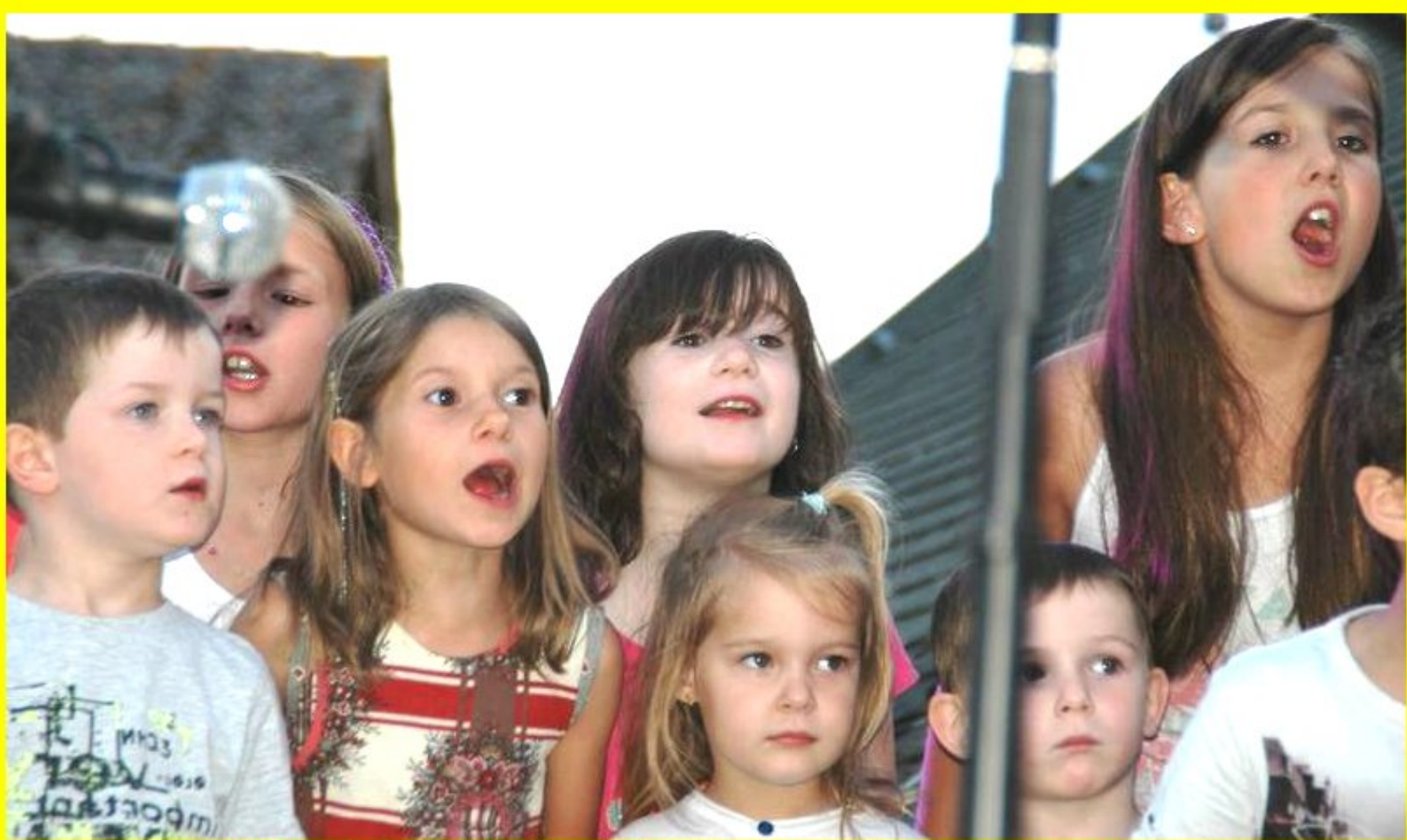
Fête de la musique à Rullac - 21 juin 2014