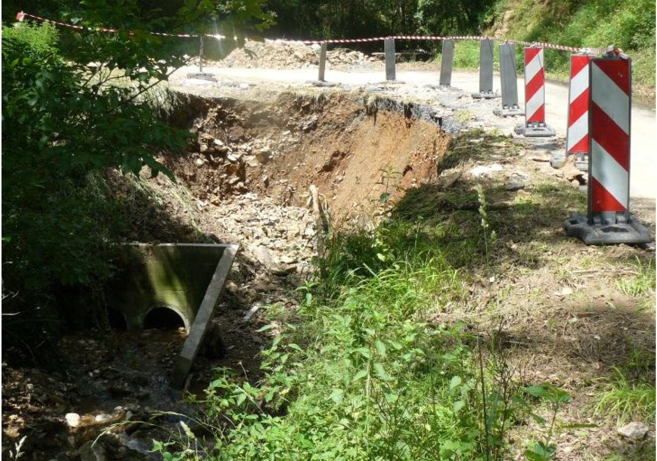
La route de Meljac à Naucelle (Départementale 592) est également effondrée après l'Estrébaldi au niveau du rûc sous la Malénie