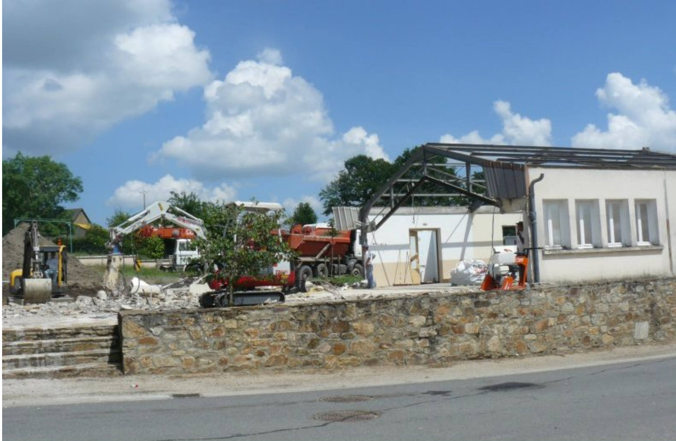
8 juin 2007: vue de la rue: la partie droite (côté cimetière) de la salle des fêtes est conservée tandis que l'extension sera construite sur la partie centrale