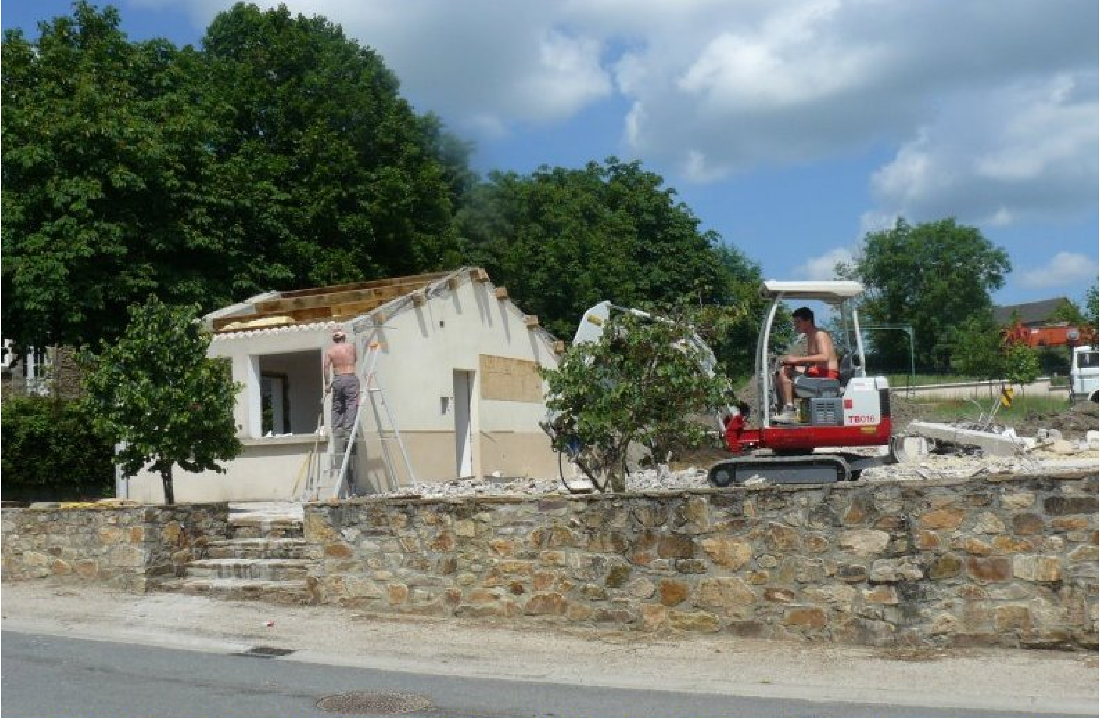
8 juin 2007: vue de la rue: la partie gauche (côté mairie) de la salle des fêtes - ancienne cuisine - est conservée et sera aménagée en toilettes.