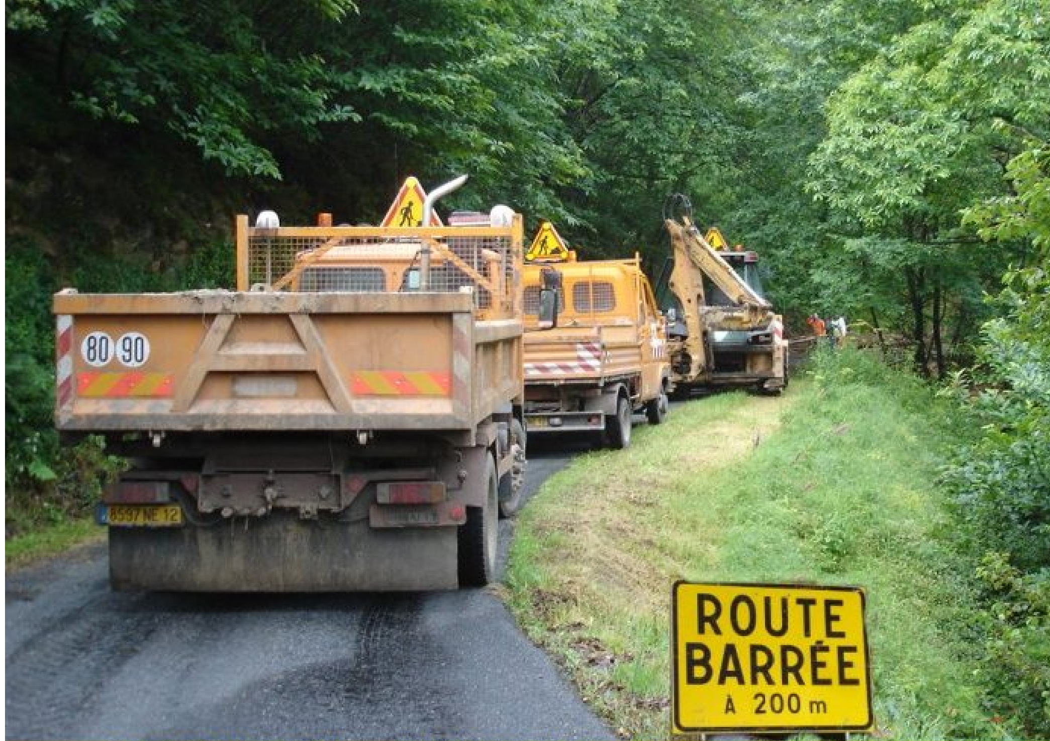
Arrivée des "engins de l'Équipement", lundi 11 juin 2007, sur la départementale 592 - Meljac à Naucelle - au niveau de l'effondrement de la route du rûc "canto ploro".