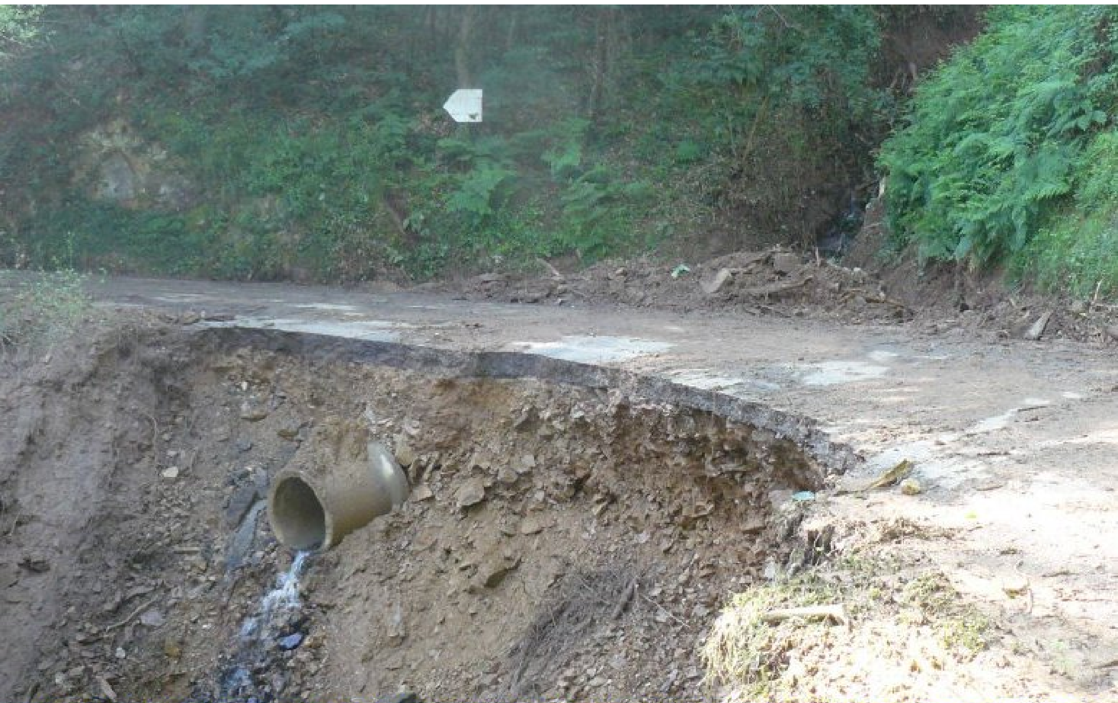
La route de Meljac à Naucelle par l'Estrébaldi (Départementale 592) est coupée en plusieurs endroits et notamment au niveau du rûc « canto ploro » qui vient du Martinesq de Meljac. Des arbres ont été déracinés et sont descendus jusqu'à la route qui s'est en partie effondrée.