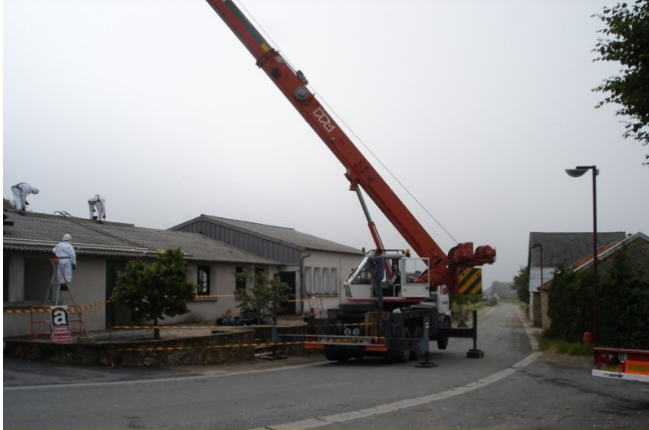
6 & 7 juin 2007: enlèvement du toit de la salle des fêtes avec les précautions liées à la présence d'amiante. Etranges images d'hommes masqués tout de blanc vêtus: des cosmonautes à Meljac !...