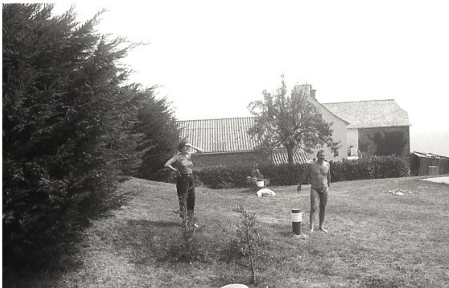
1985 - Le Bourg de Meljac