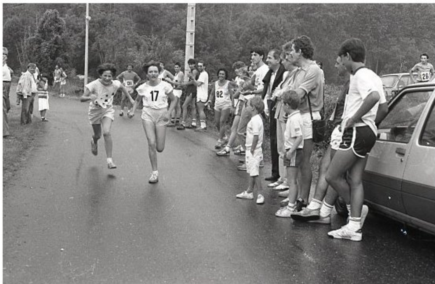
1985 - Le Bourg de Meljac