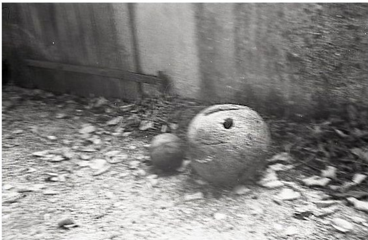
1985 - Le Bourg de Meljac