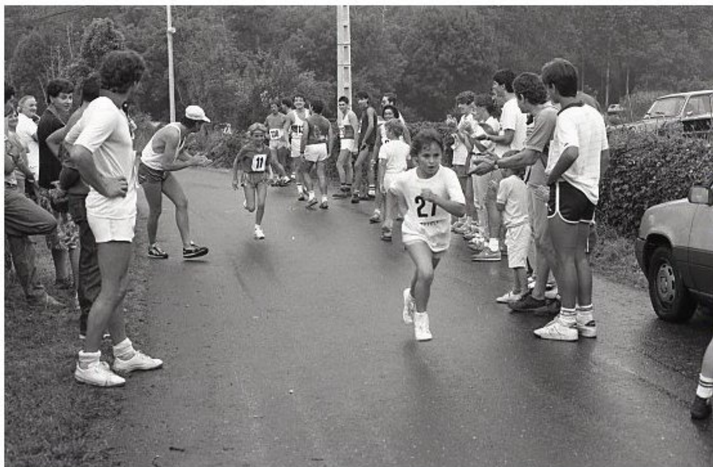
1985 - Le Bourg de Meljac