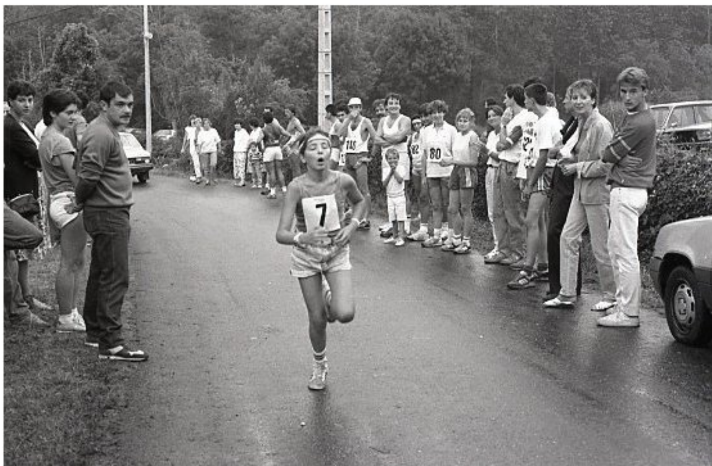
1985 - Le Bourg de Meljac