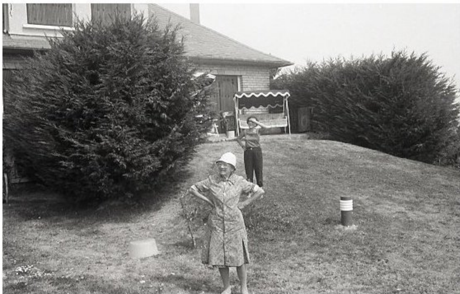
1985 - Le Bourg de Meljac