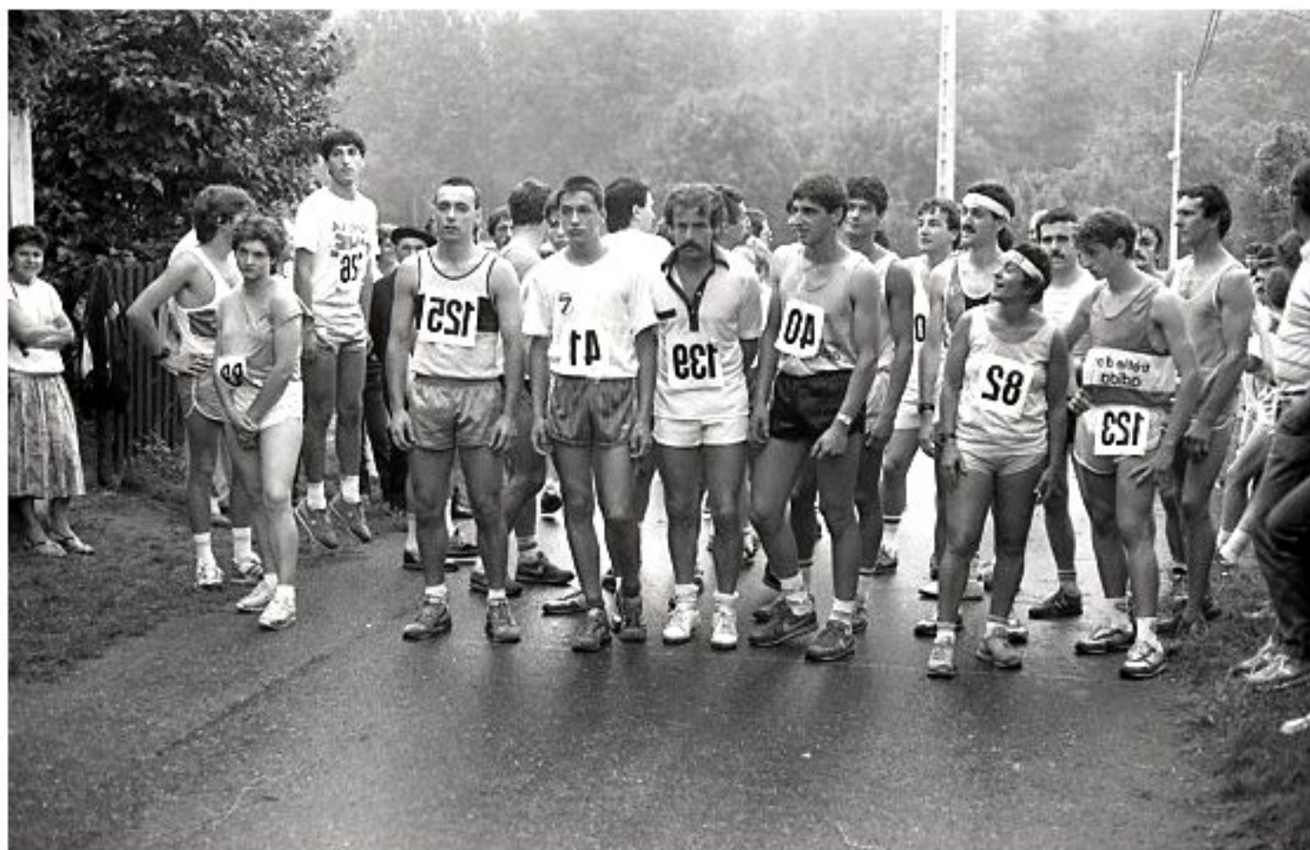
1985 - Le Bourg de Meljac