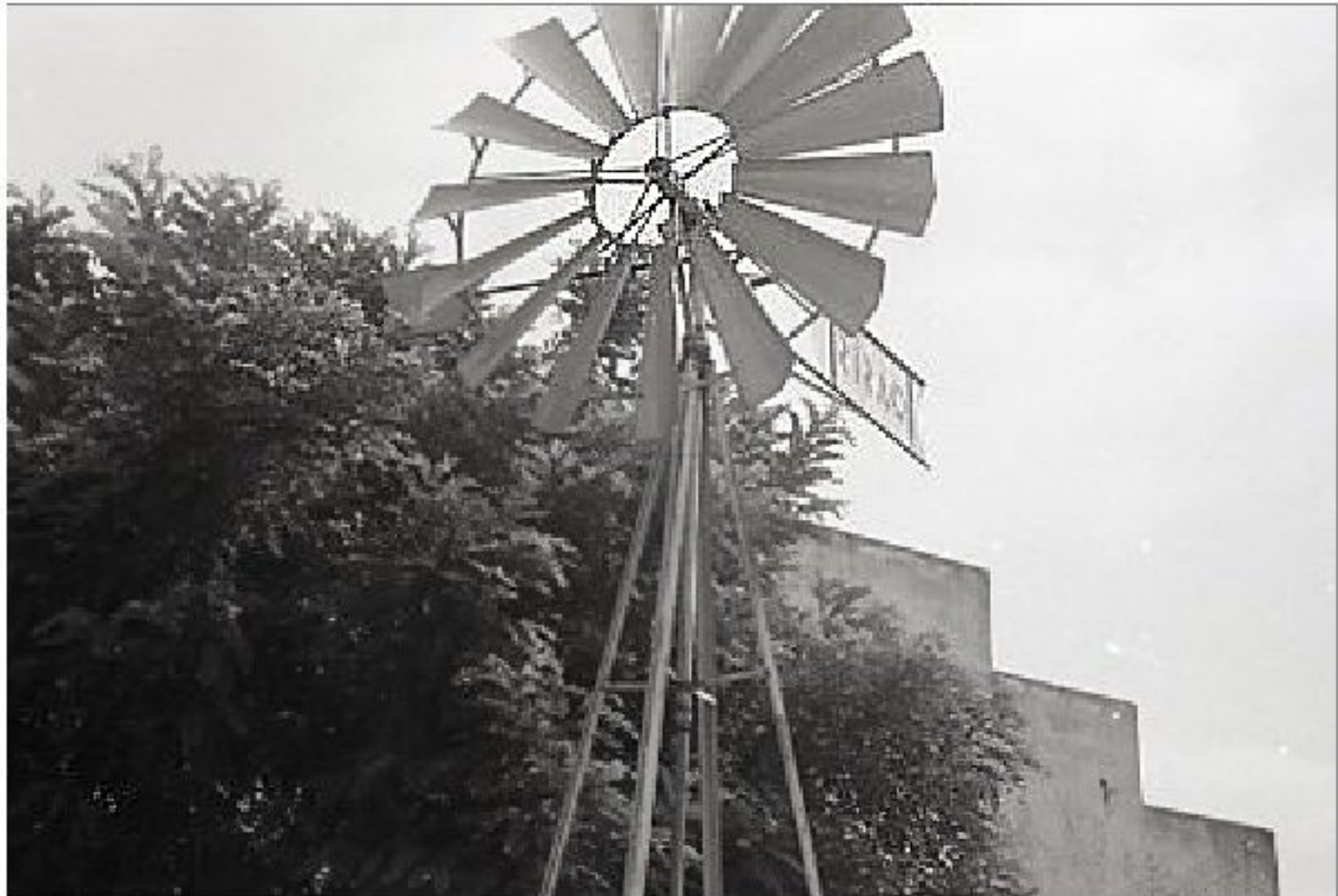
1985 - Le Bourg de Meljac