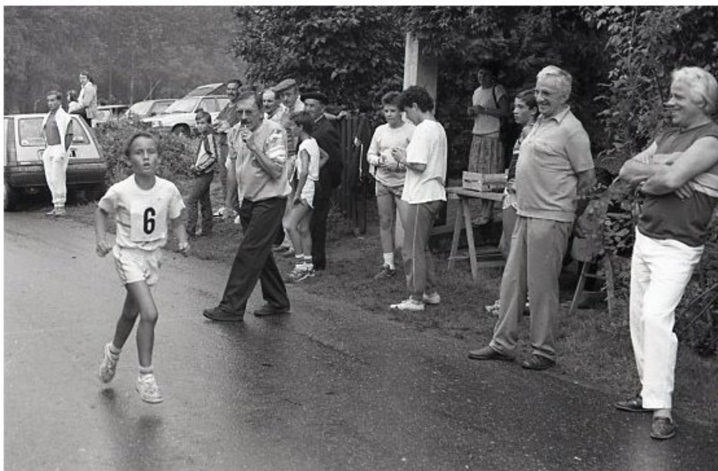
1985 - Le Bourg de Meljac