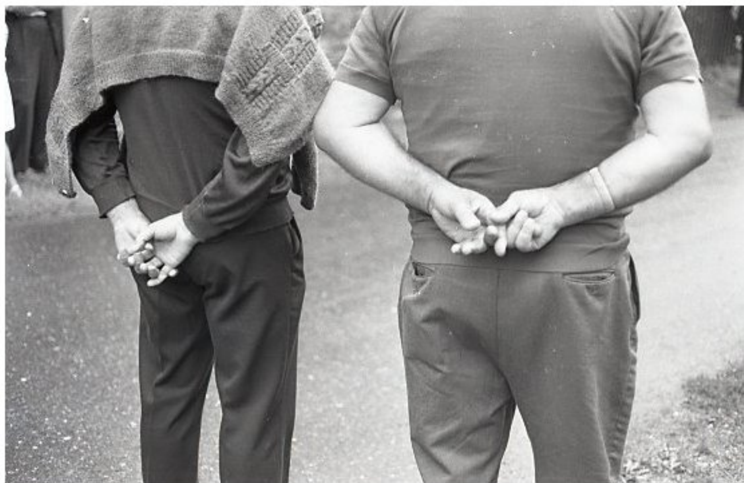
1985 - Le Bourg de Meljac