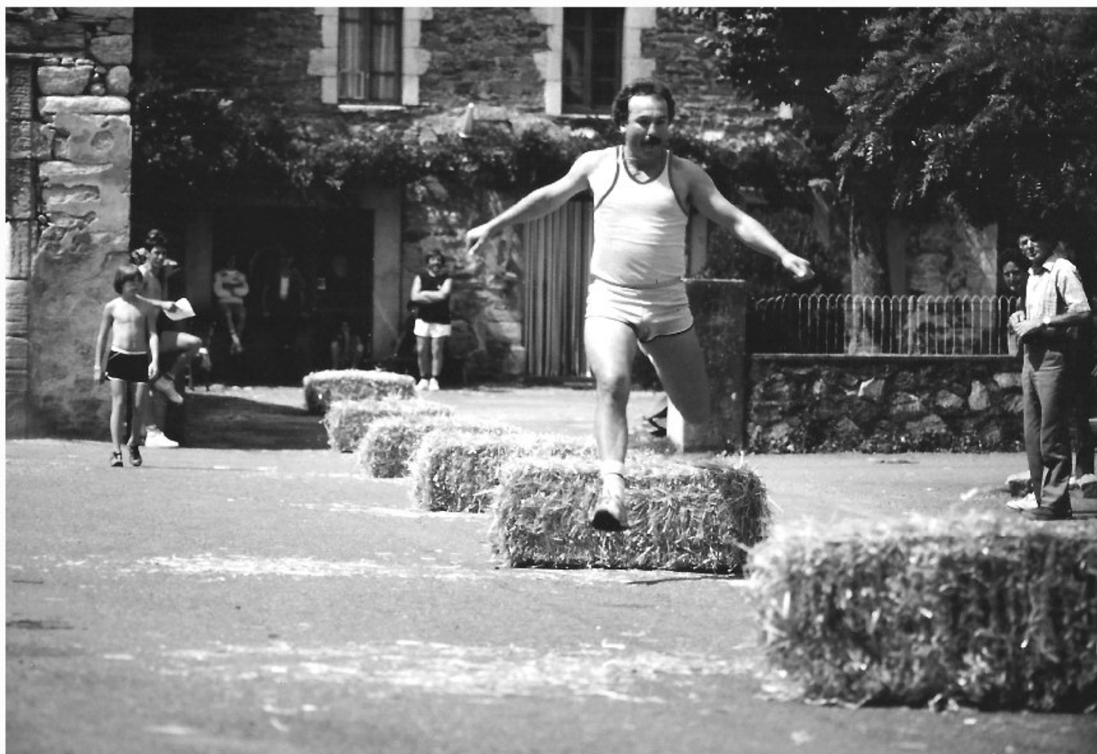
Meljac - les Olympiades