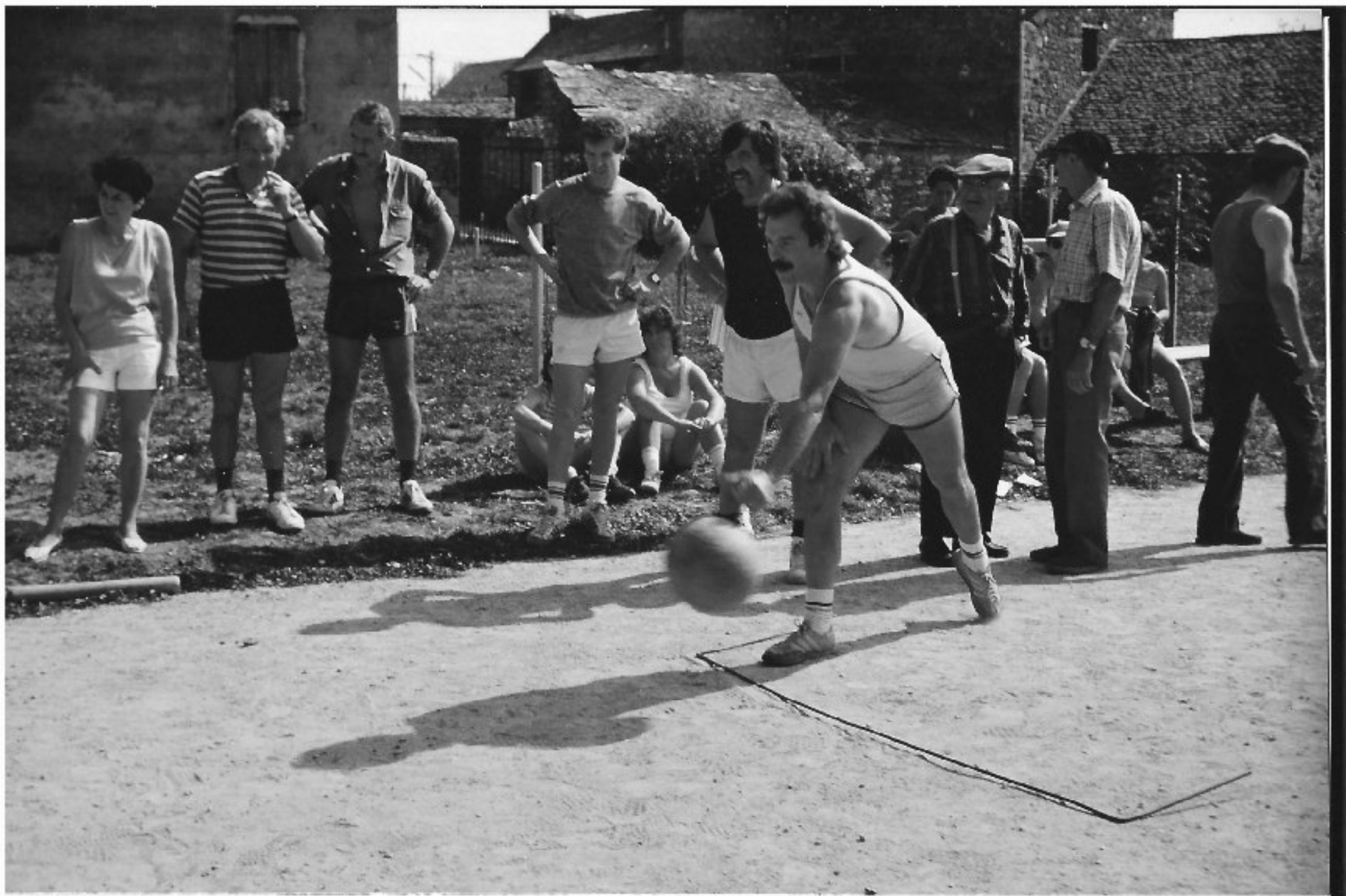
Meljac - les Olympiades