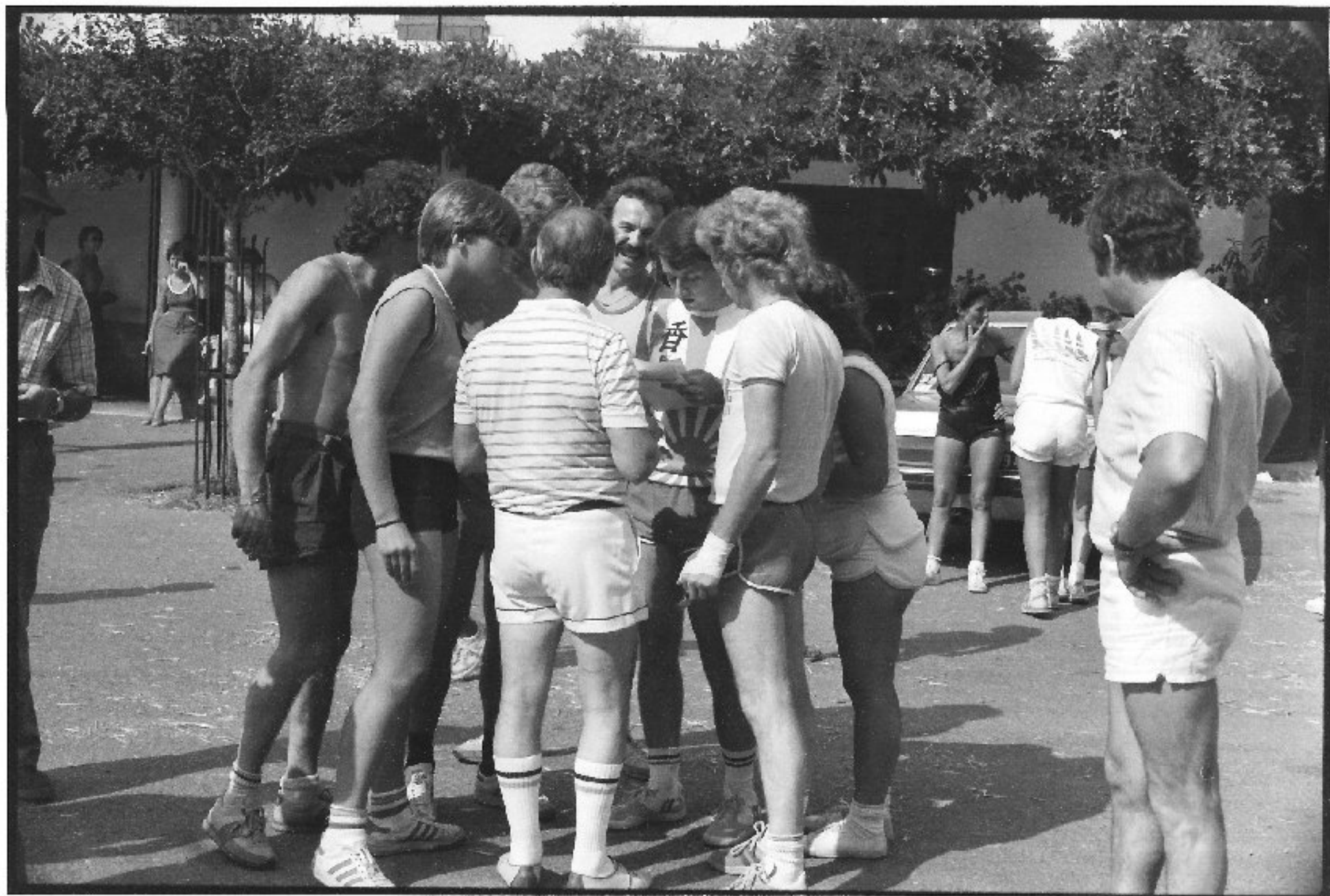
Meljac - les Olympiades