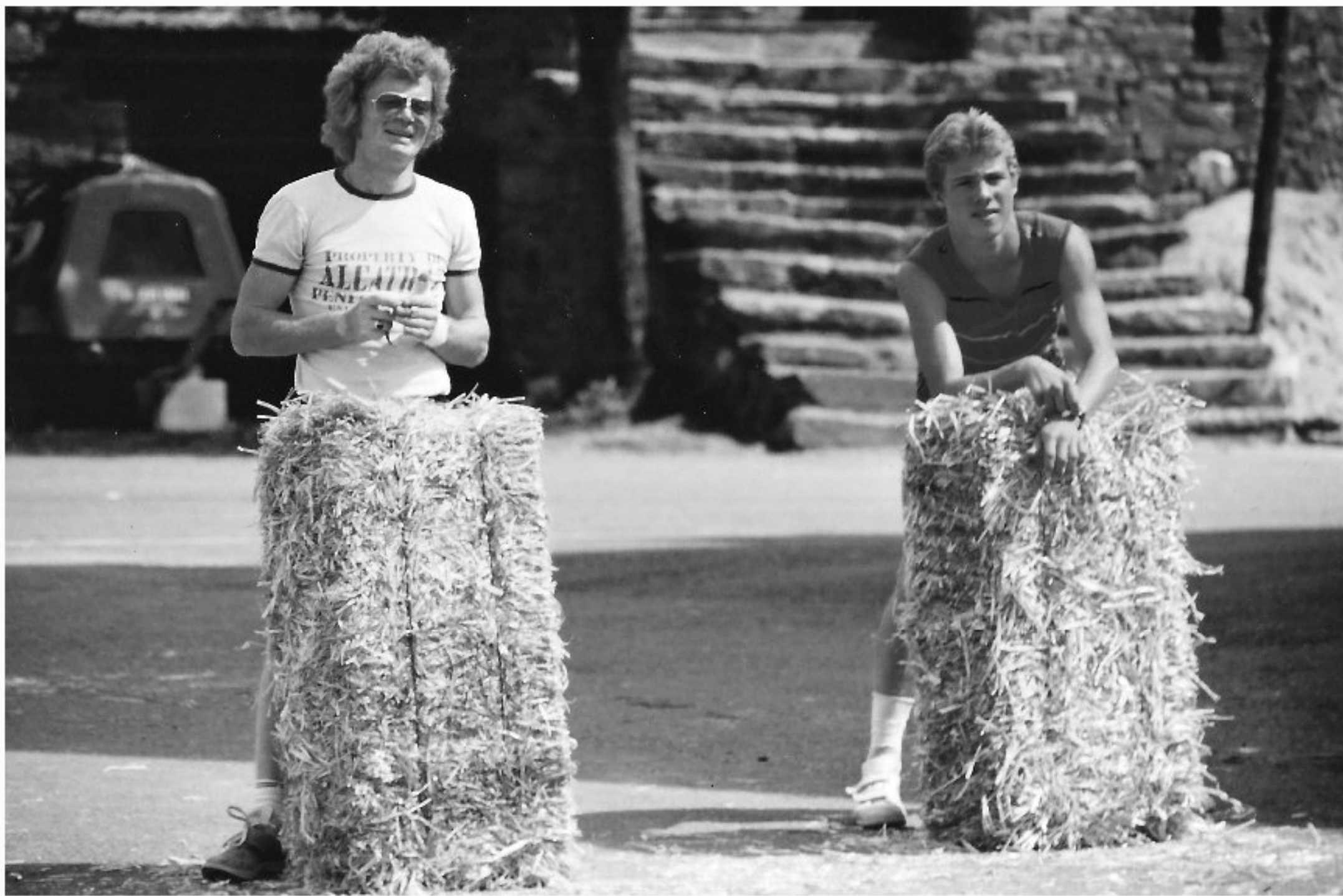
Meljac - les Olympiades