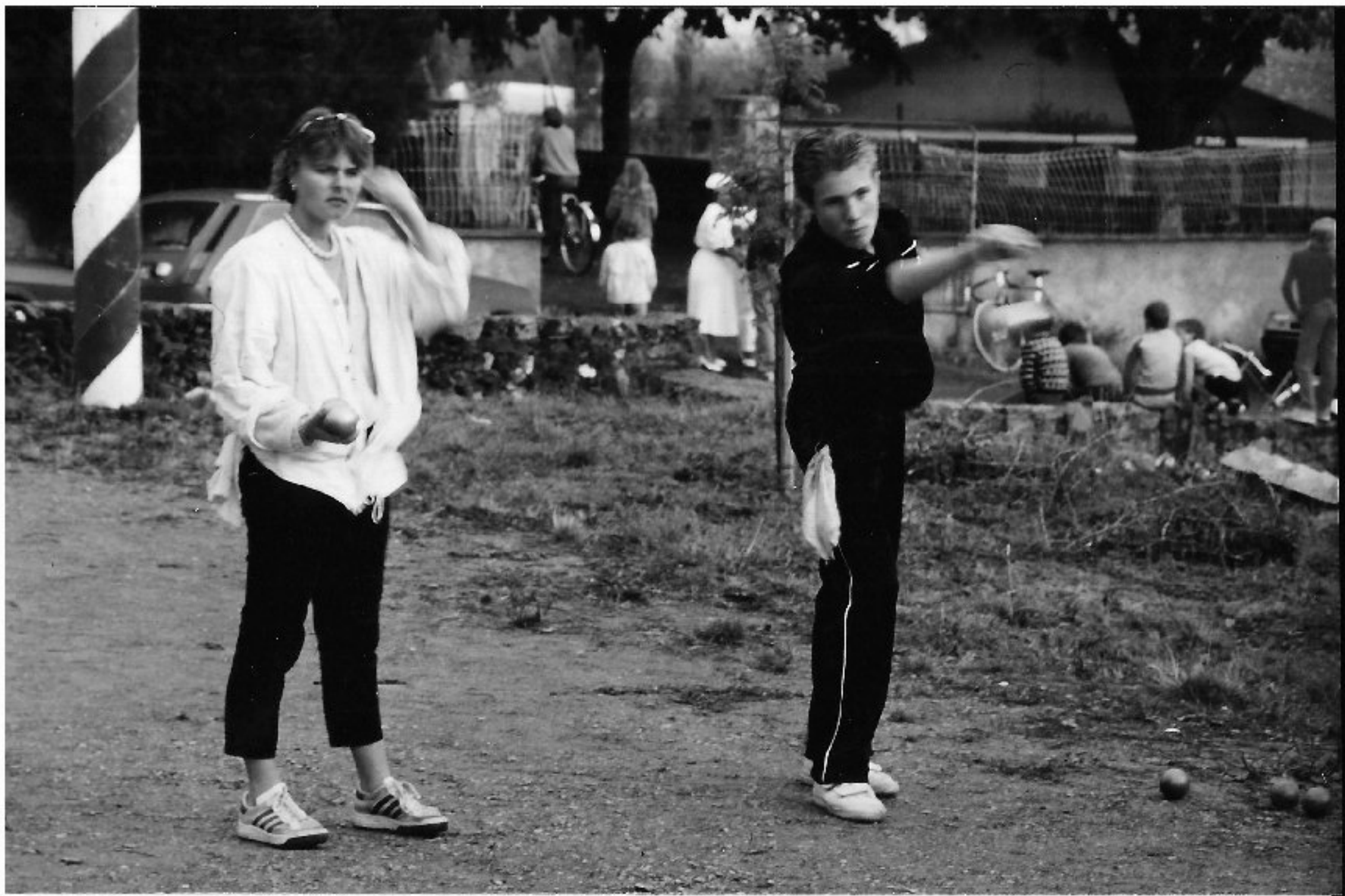
Meljac - les Olympiades