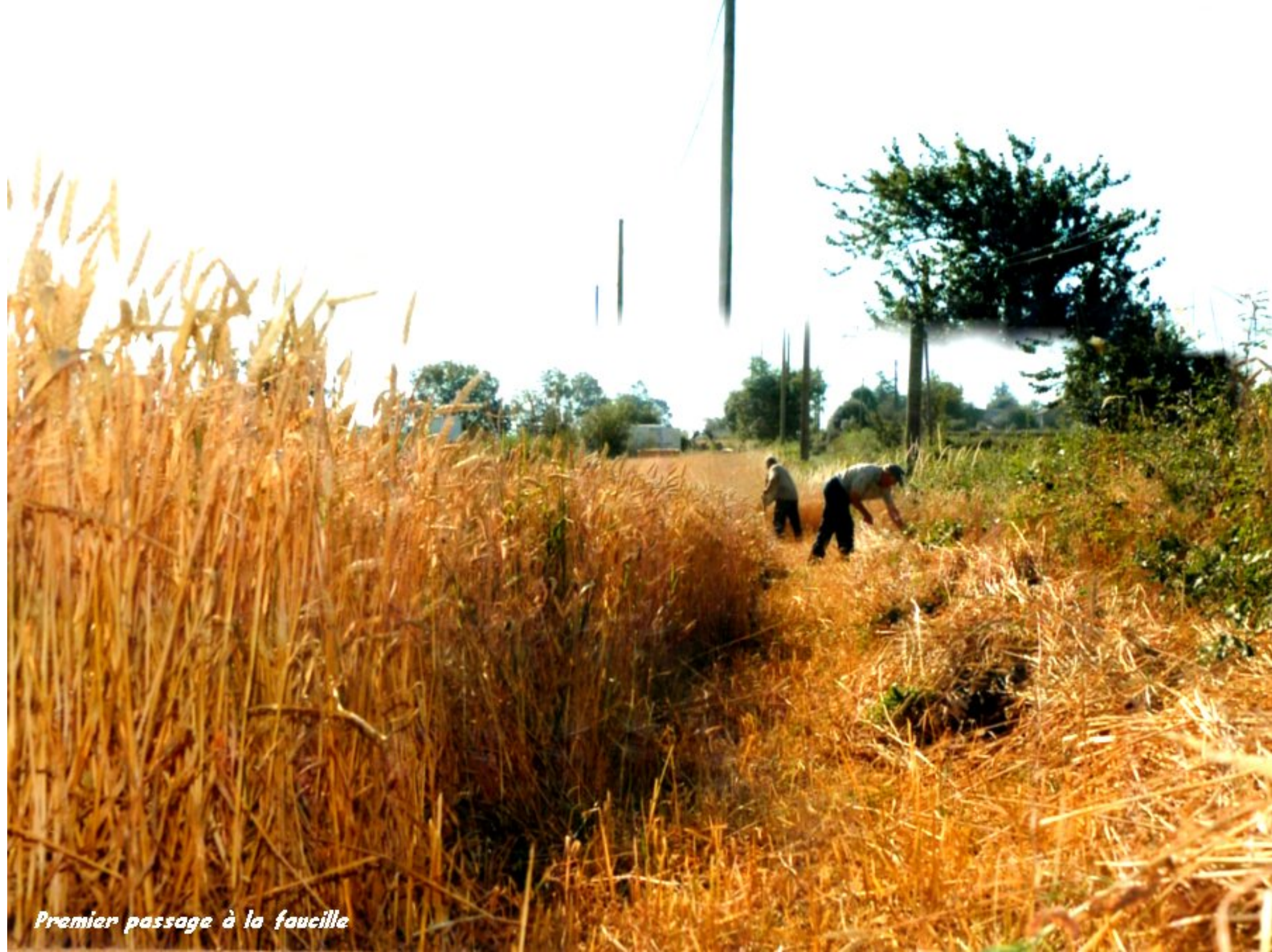
Premier passage à la faucille