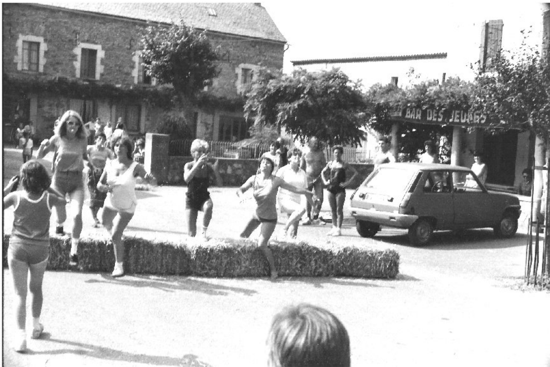
Meljac - les Olympiades