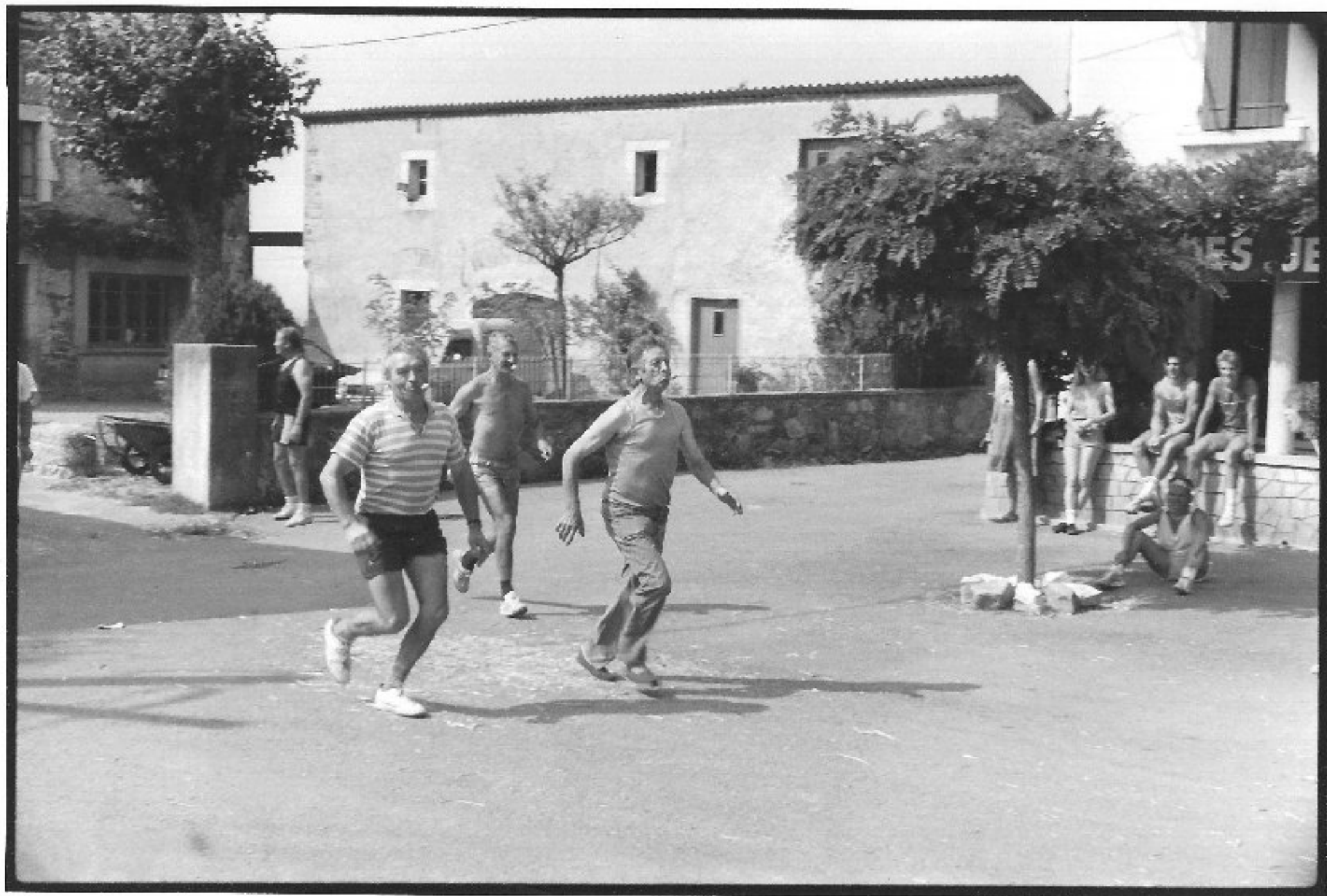
Meljac - les Olympiades