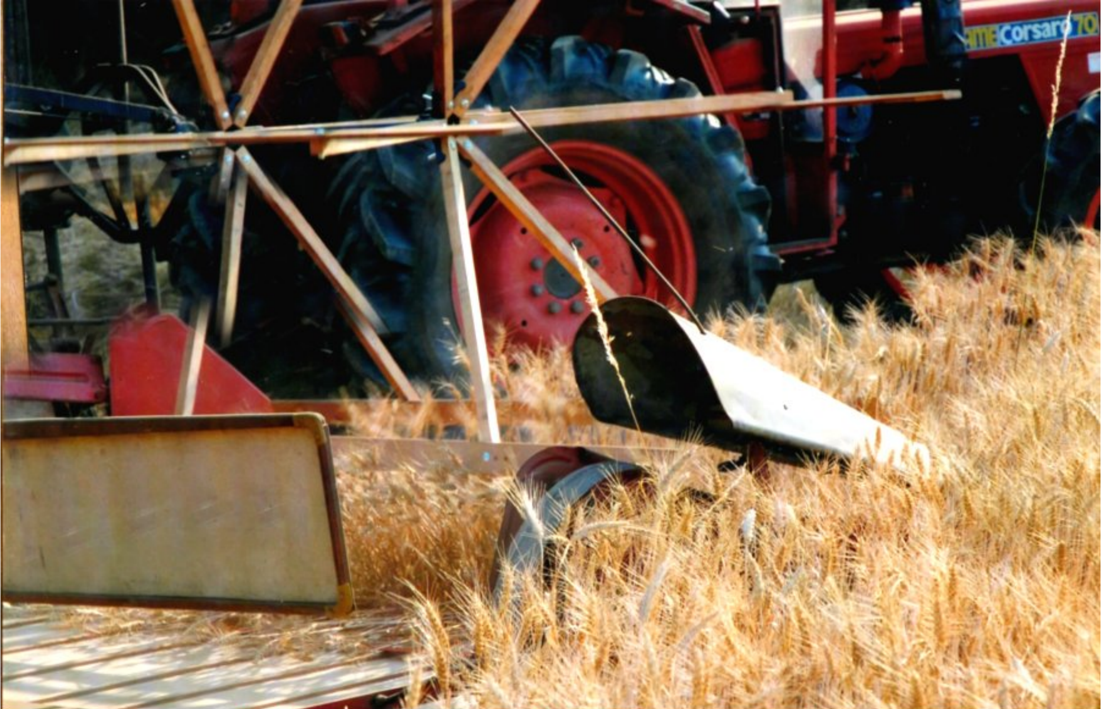
Ces grands rabatteurs en bois tournant lentement pour ne pas égrainer les épis, accompagnent la paille sur le tapis qui la convoie jusqu'au lieu