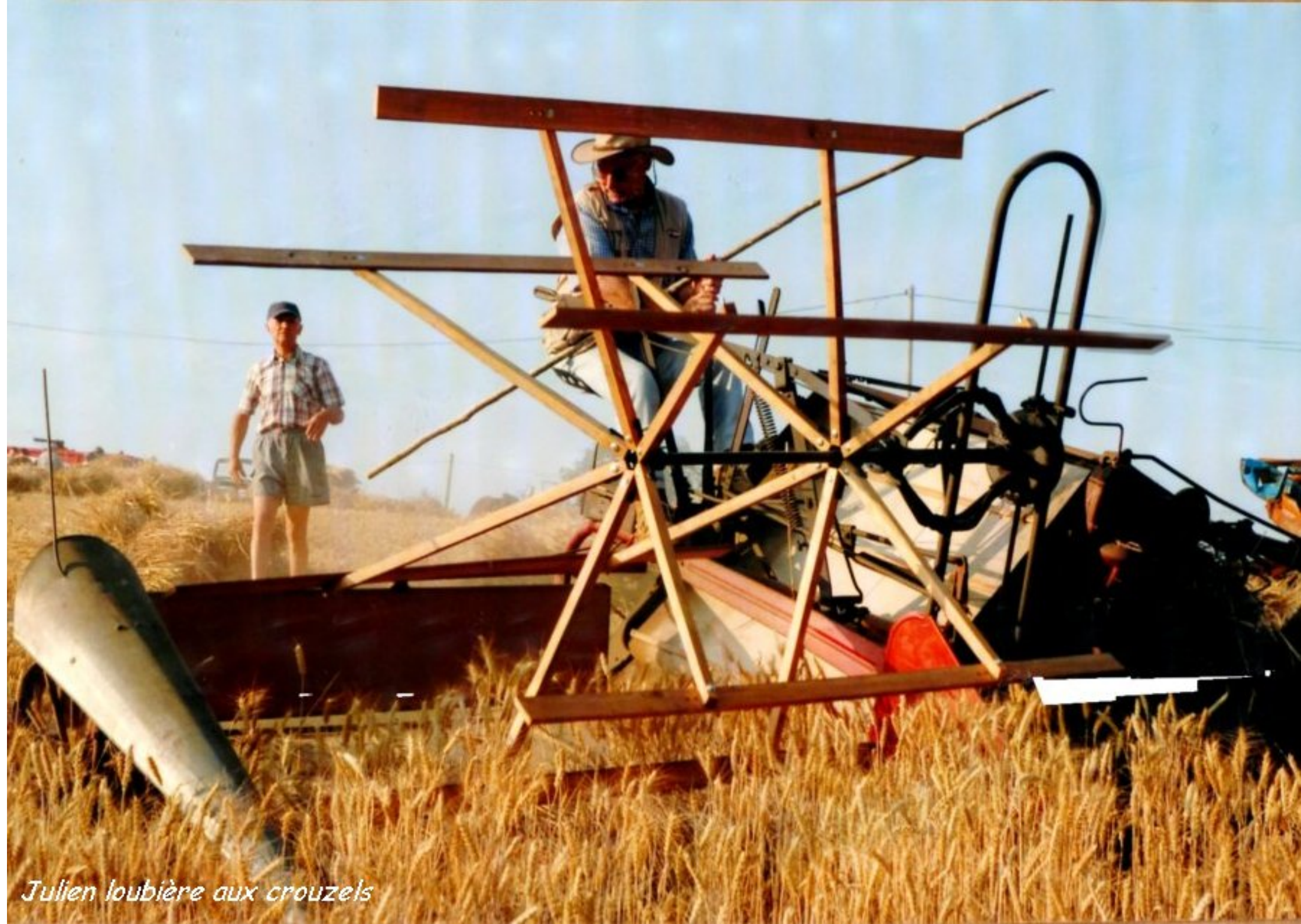
Julien loubière aux crouzels