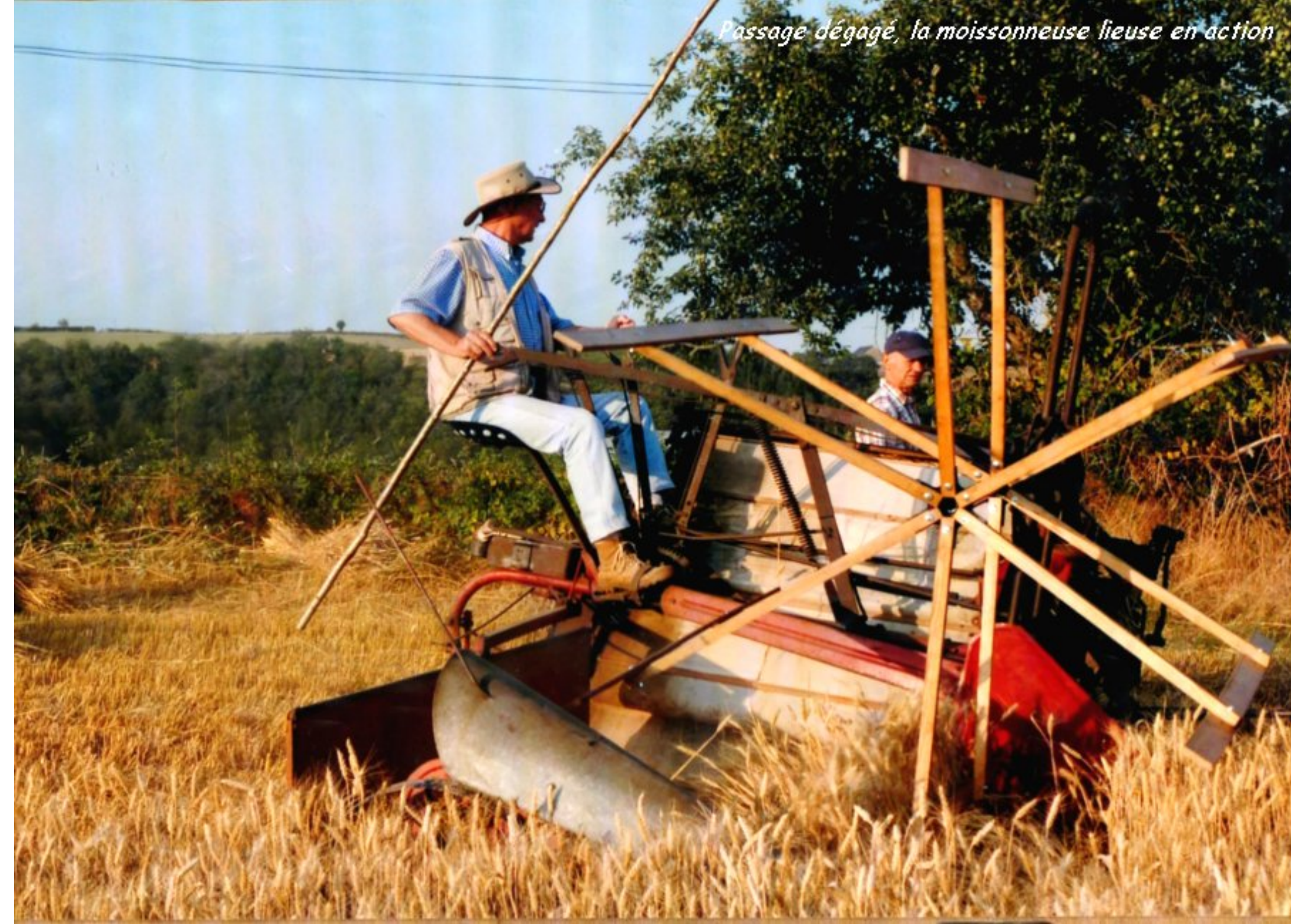
Passage dégagé, la moissonneuse lieuse en action