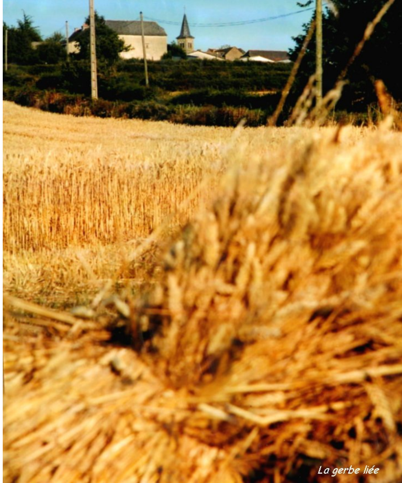
La gerbe liée