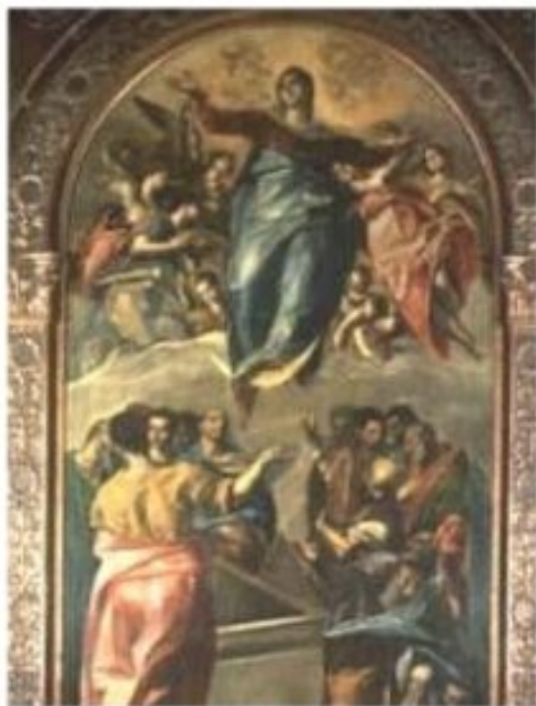
L'Assomption - Le Greco