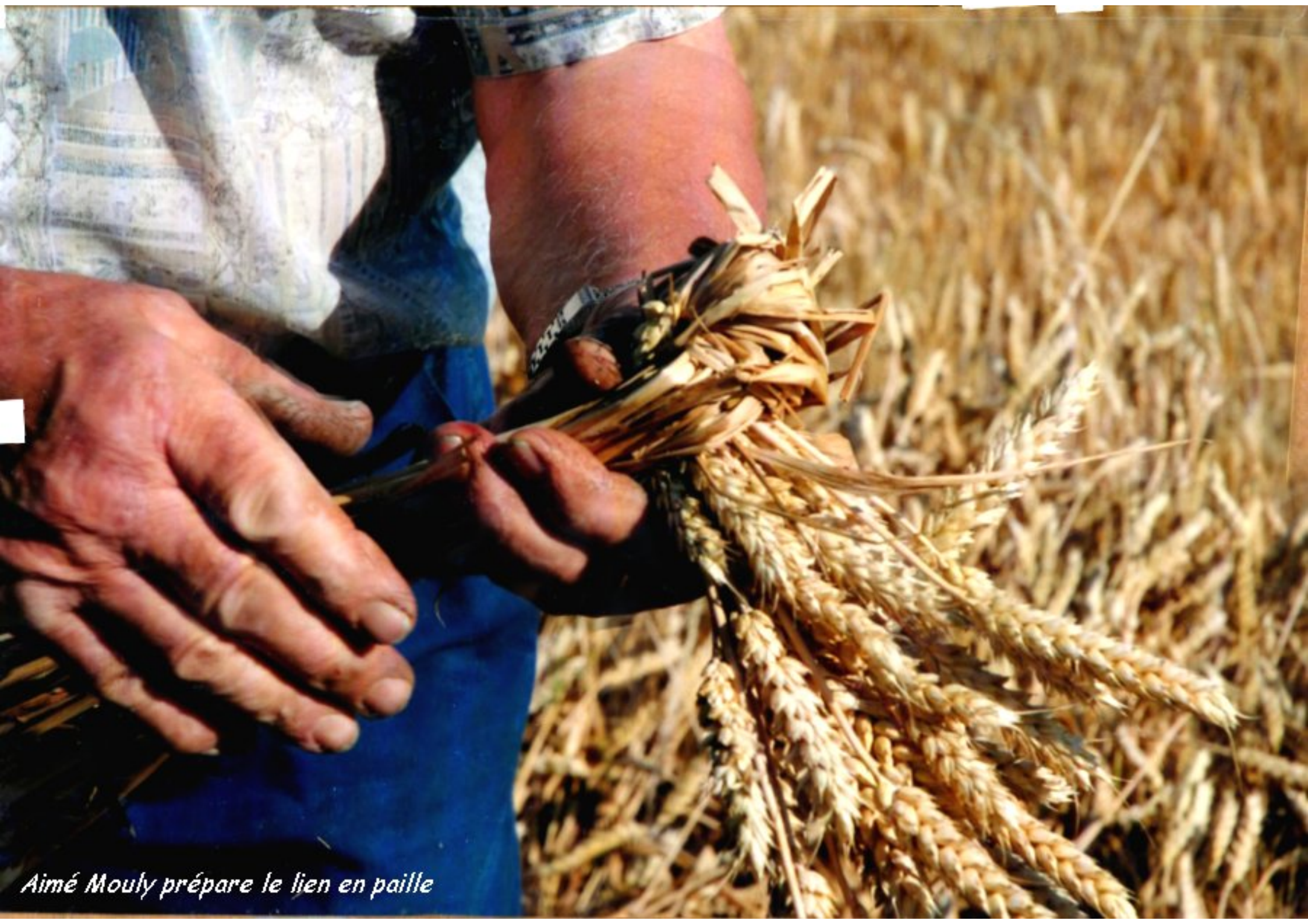
Aimé Mouly prépare le lien en paille