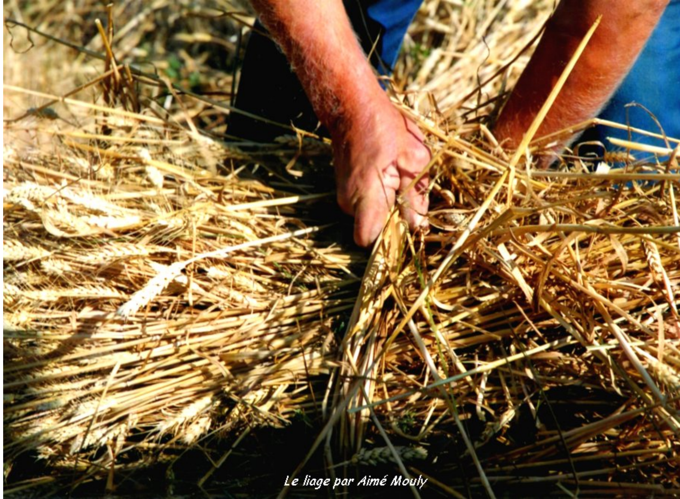
Le liage par Aimé Mouly