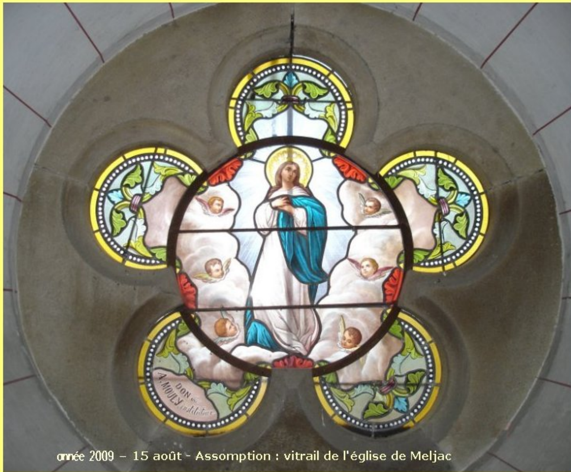
année 2009 – 15 août - Assomption : vitrail de l'église de Meljac