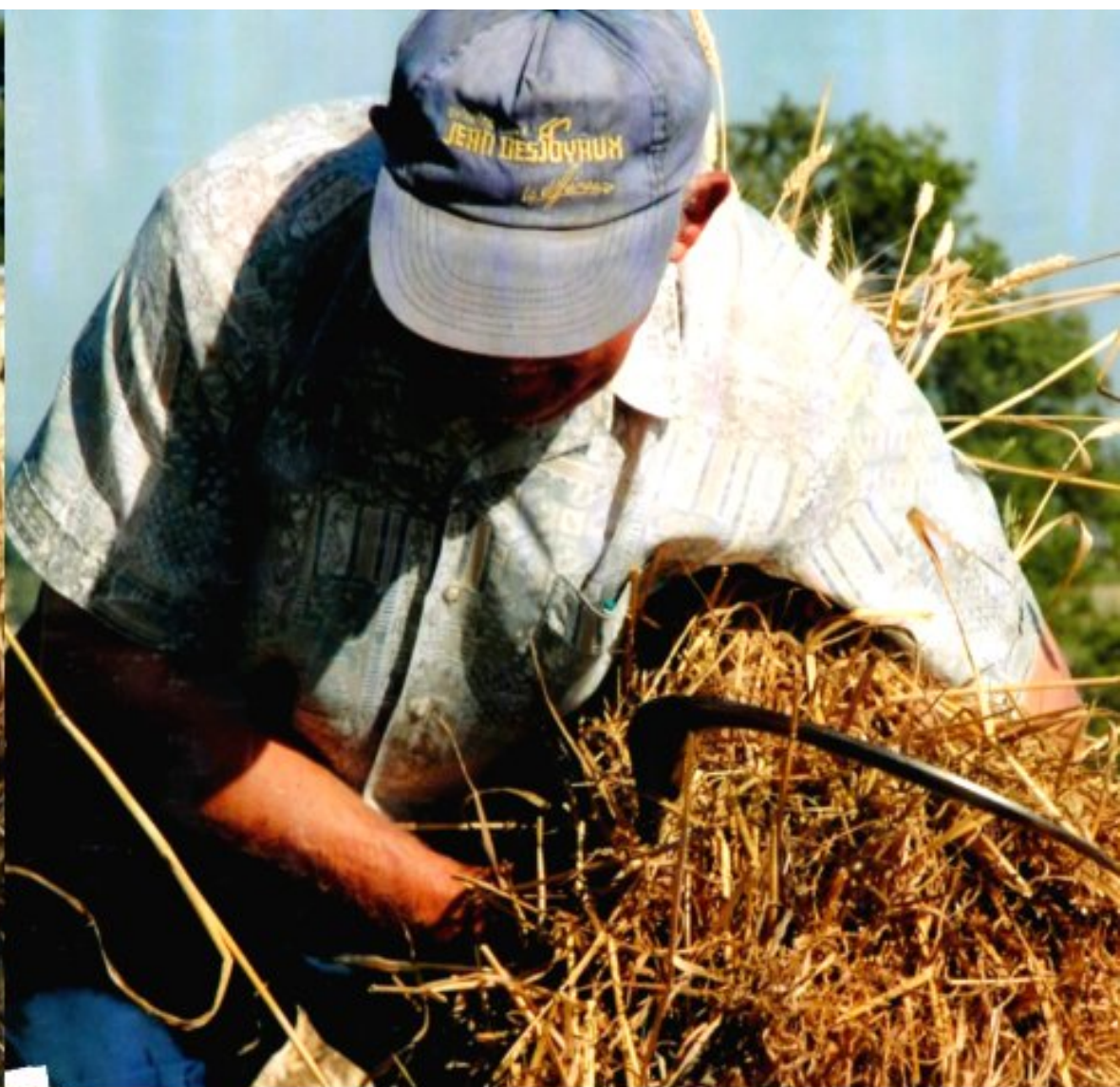
Un véritable savoir faire avec la faucille