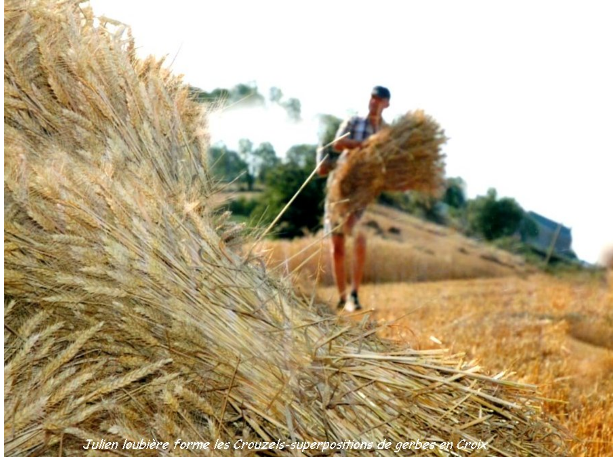
Julien loubière forme les Crouzels-superpositions de gerbes en Croix