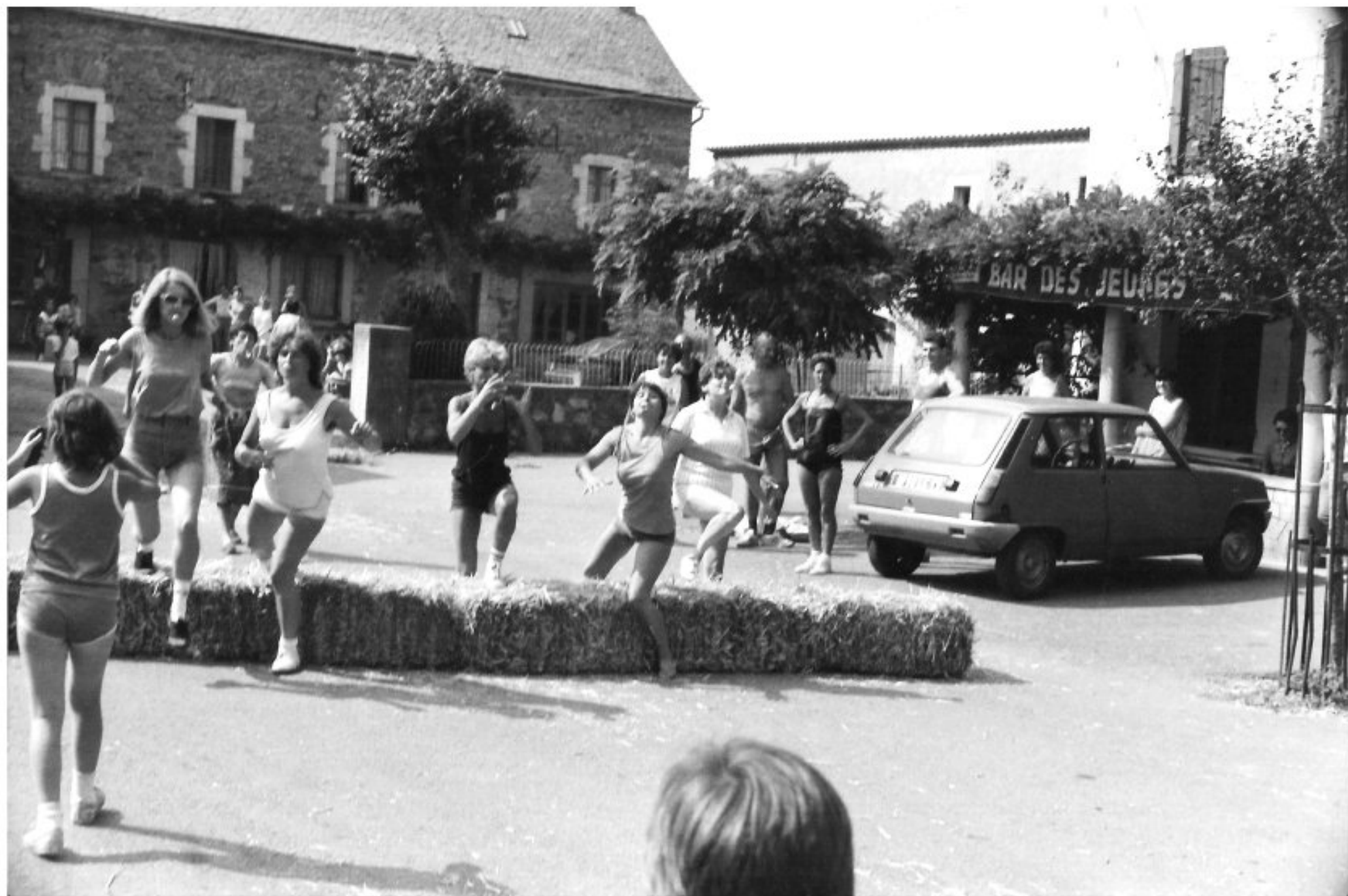
MELJAC - Les Olympiades 1984