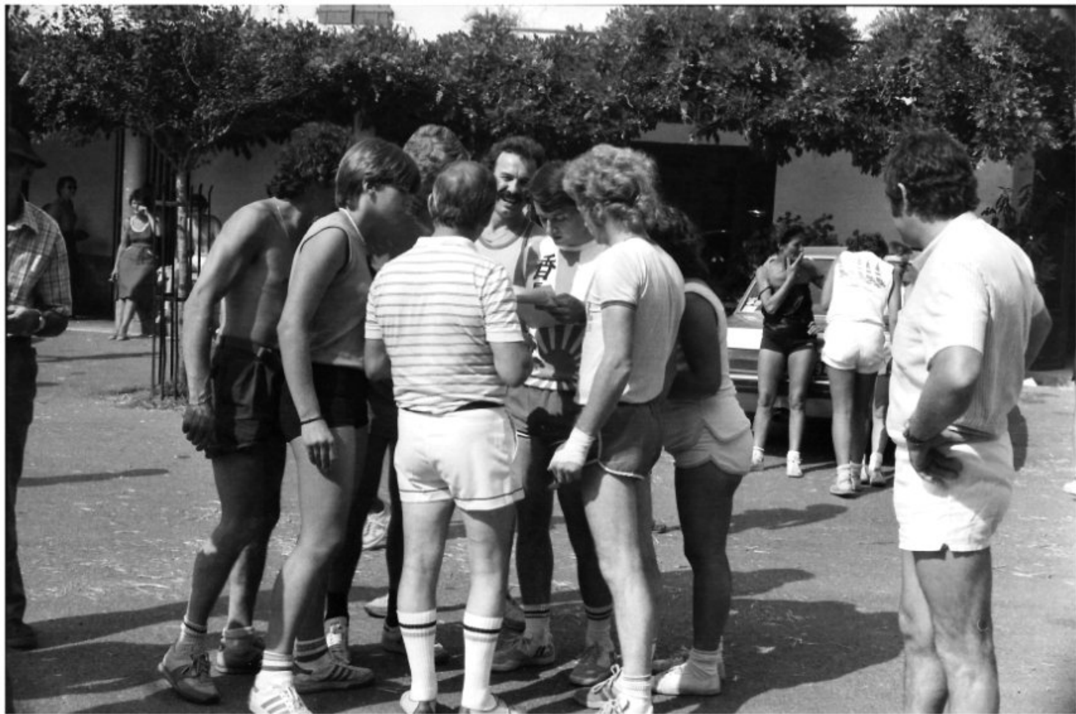
MELJAC - Les Olympiades 1984