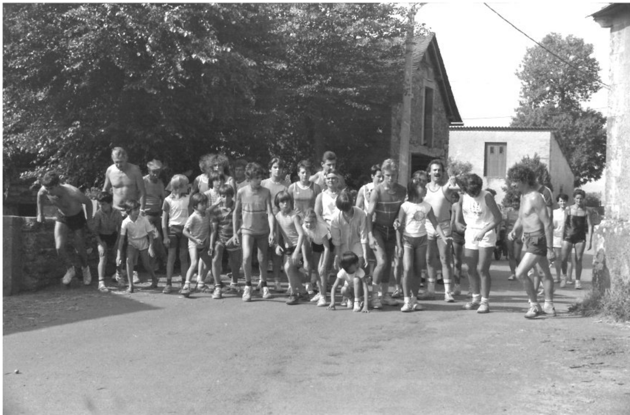
MELJAC - Les Olympiades 1984