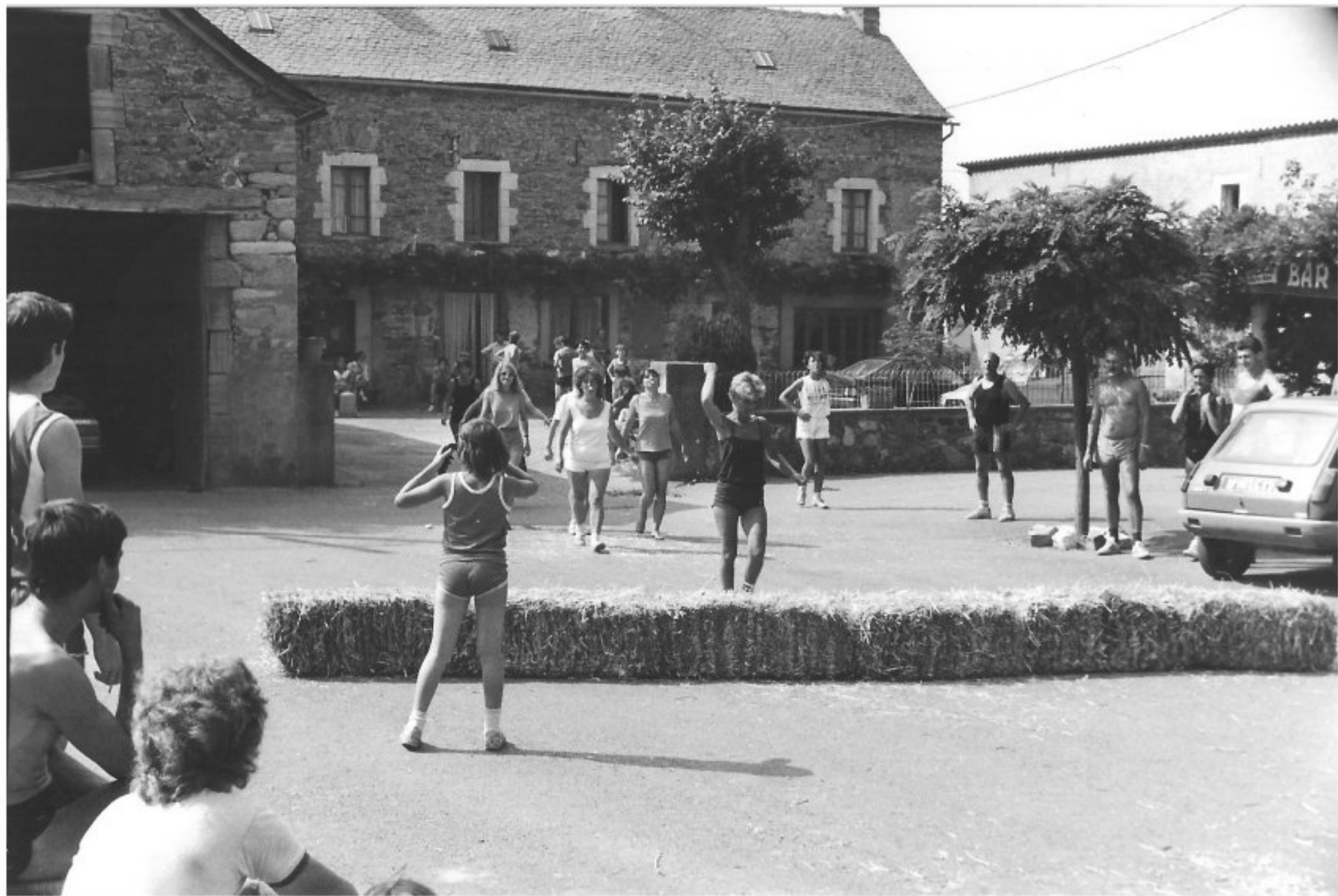
MELJAC - Les Olympiades 1984