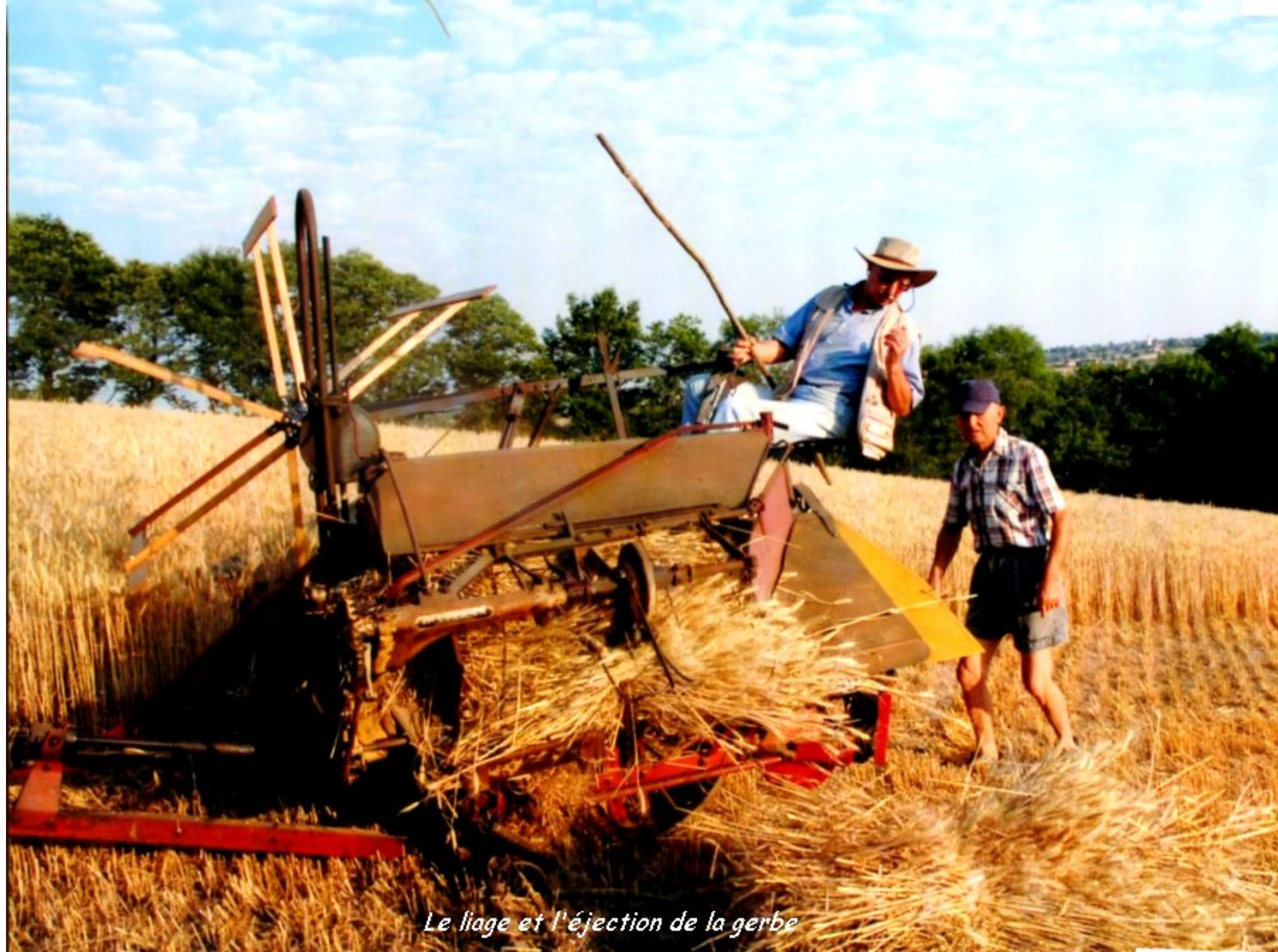
Le liage et l'éjection de la gerbe