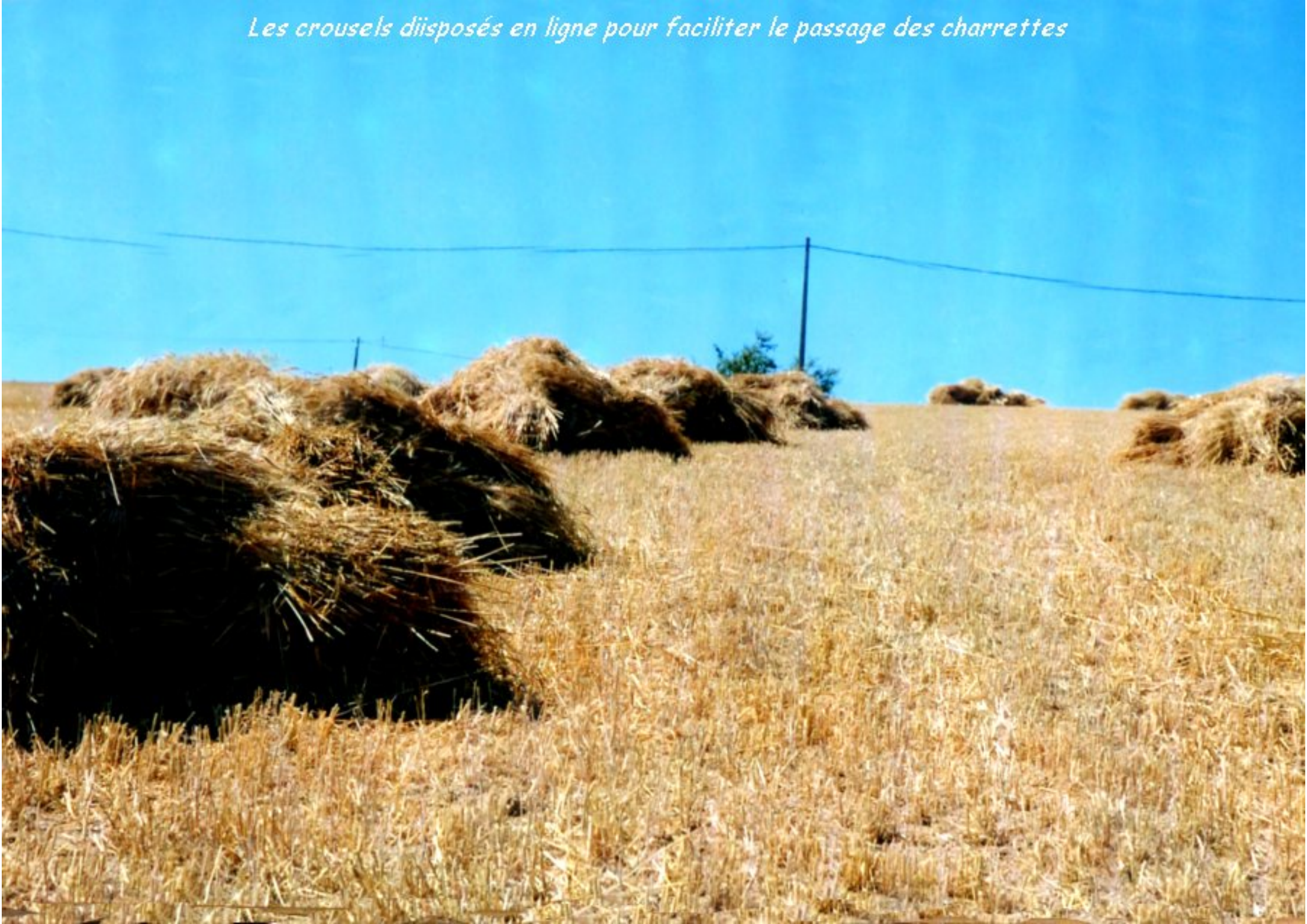
Les crousels diisposés en ligne pour faciliter le passage des charrettes