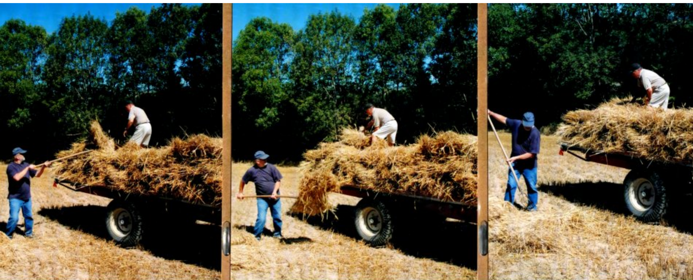
Les gerbes bien sèches, chargement des remorques avec Robert Bousquet