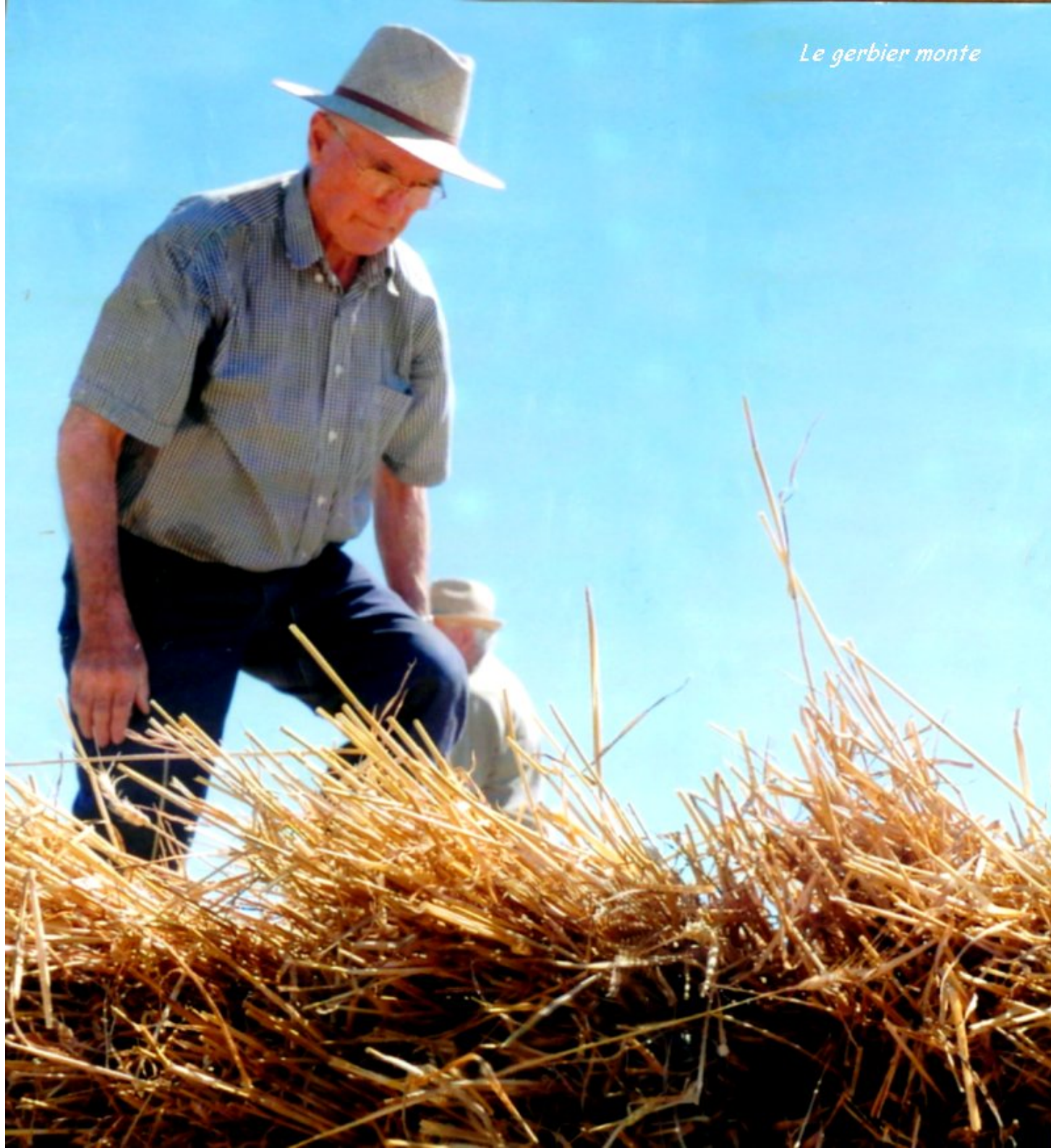
Le gerbier monte