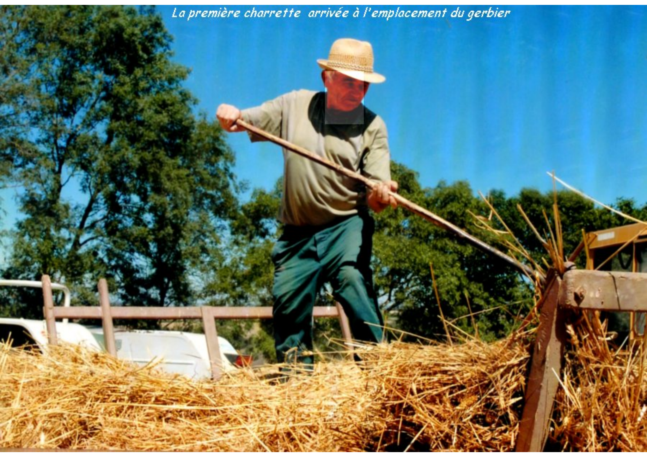
La première charrette arrivée à l'emplacement du gerbier