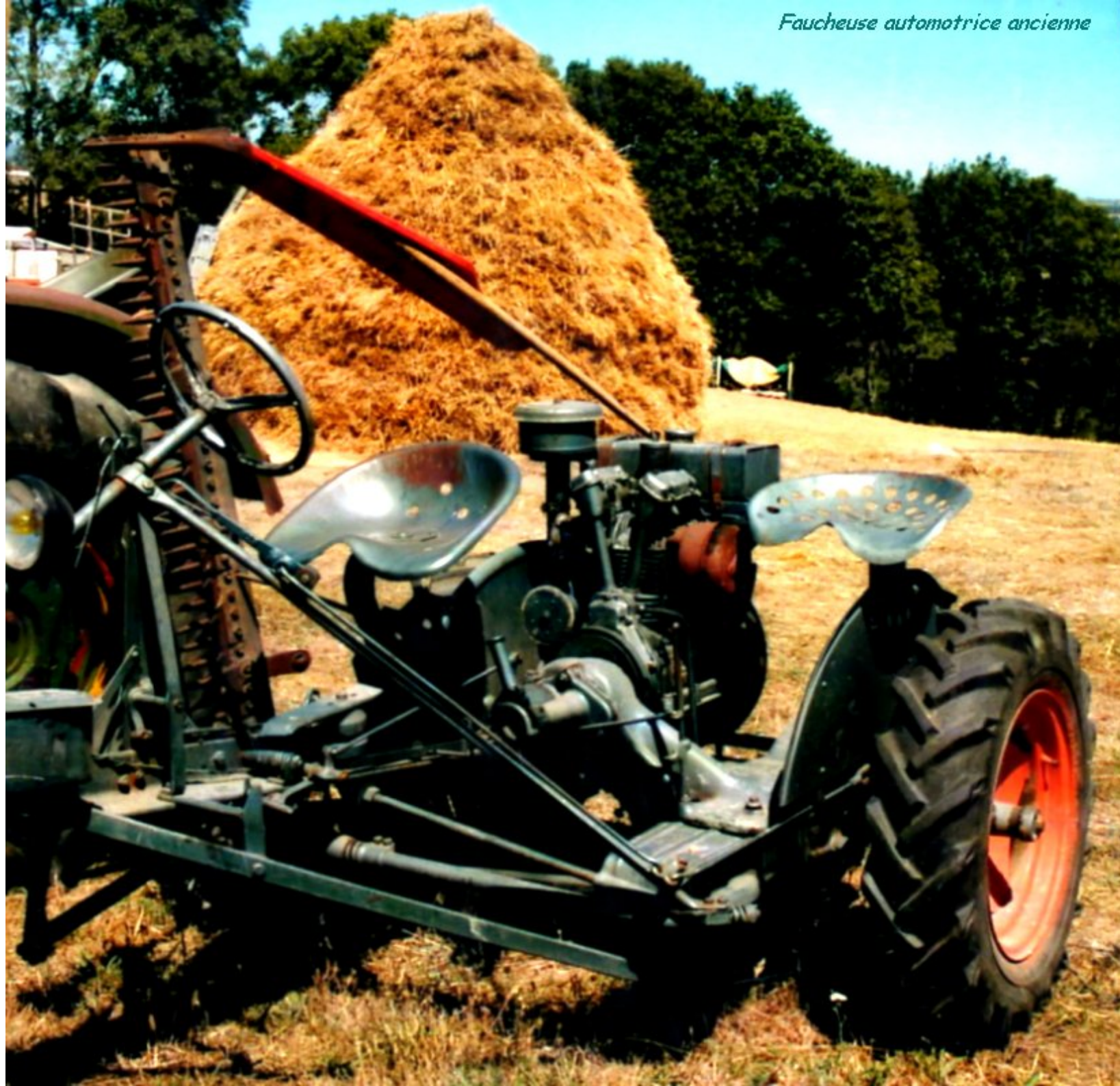
Faucheuse automotrice ancienne