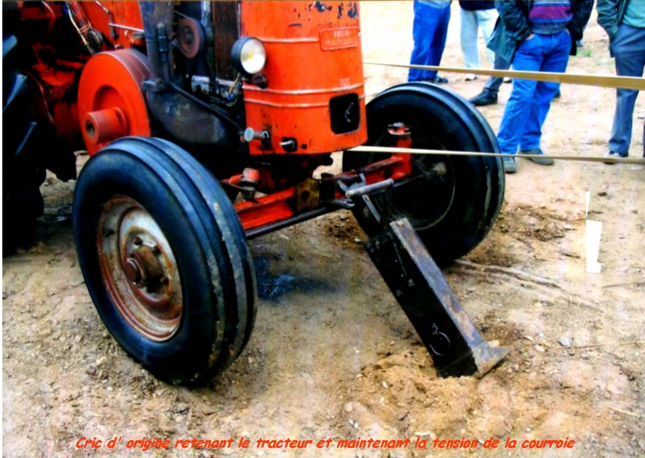
Cric d'origine retenant le tracteur et maintenant la tension de la courroie