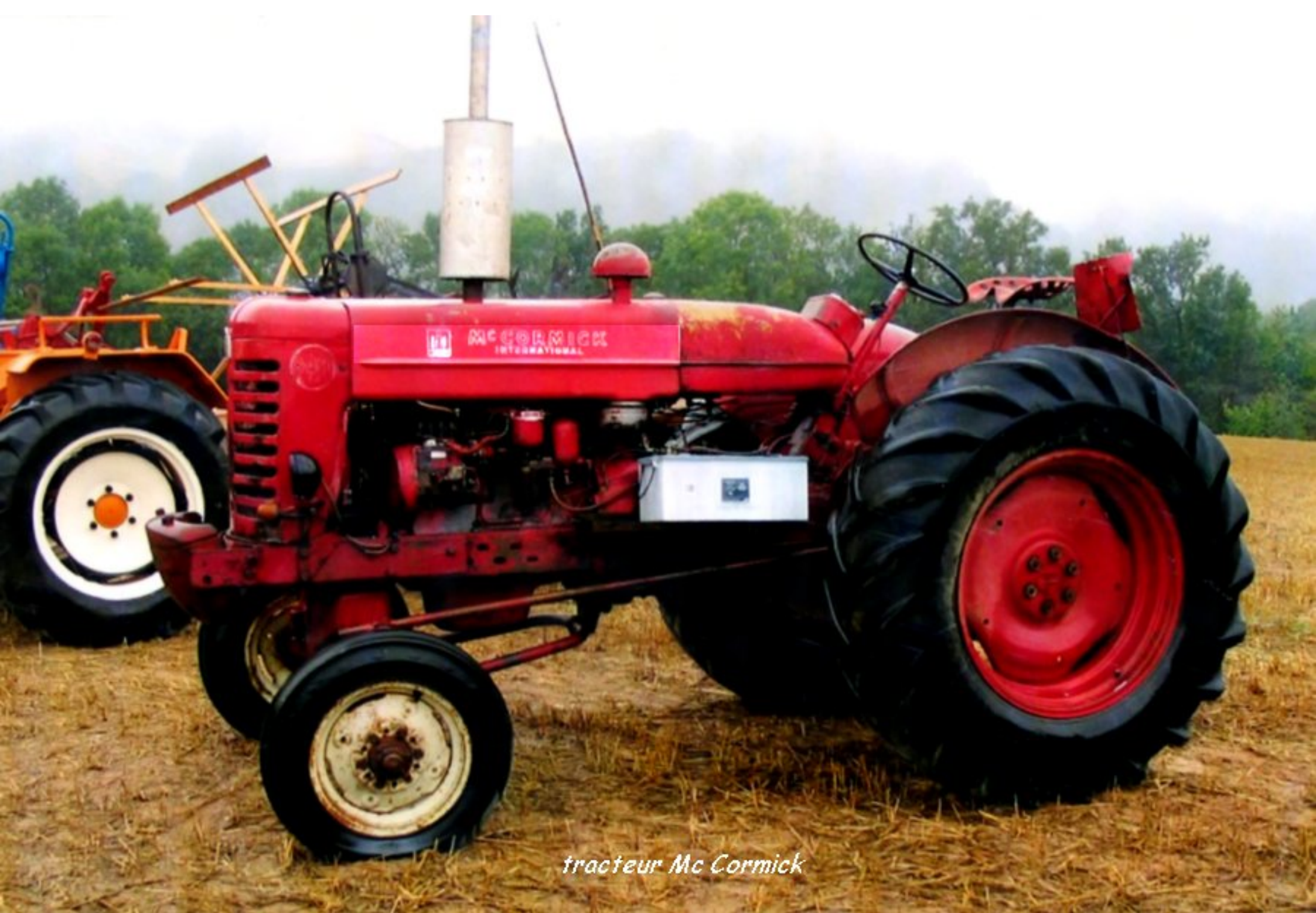
tracteur Mc Cormick