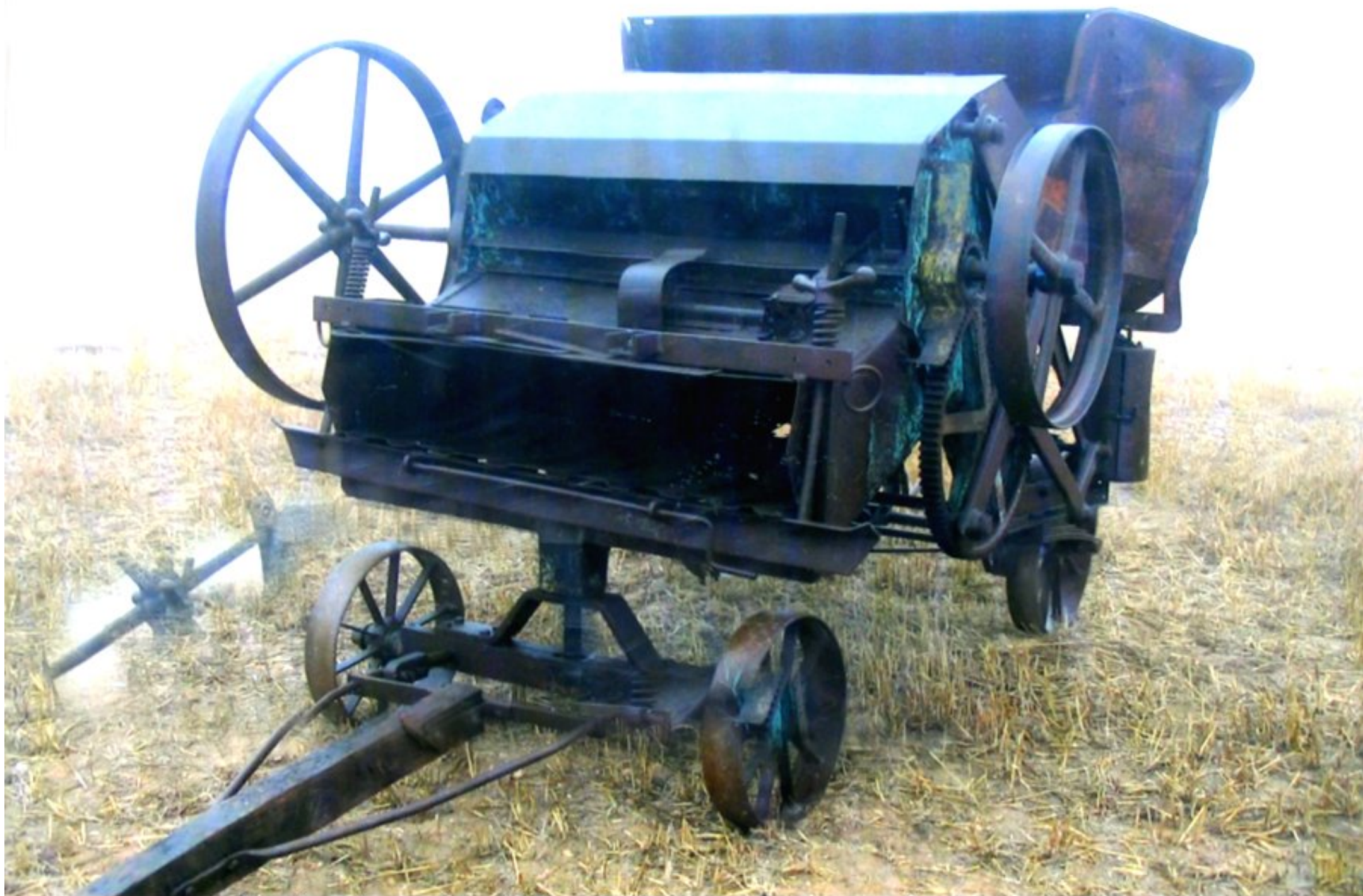
Ancienne botteleuse basse densité à liage ficelle automatique ou manuel; en temps de pénurie avec des ficelles récupérées l'année précédente par le coupeur de liens sur la batteuse