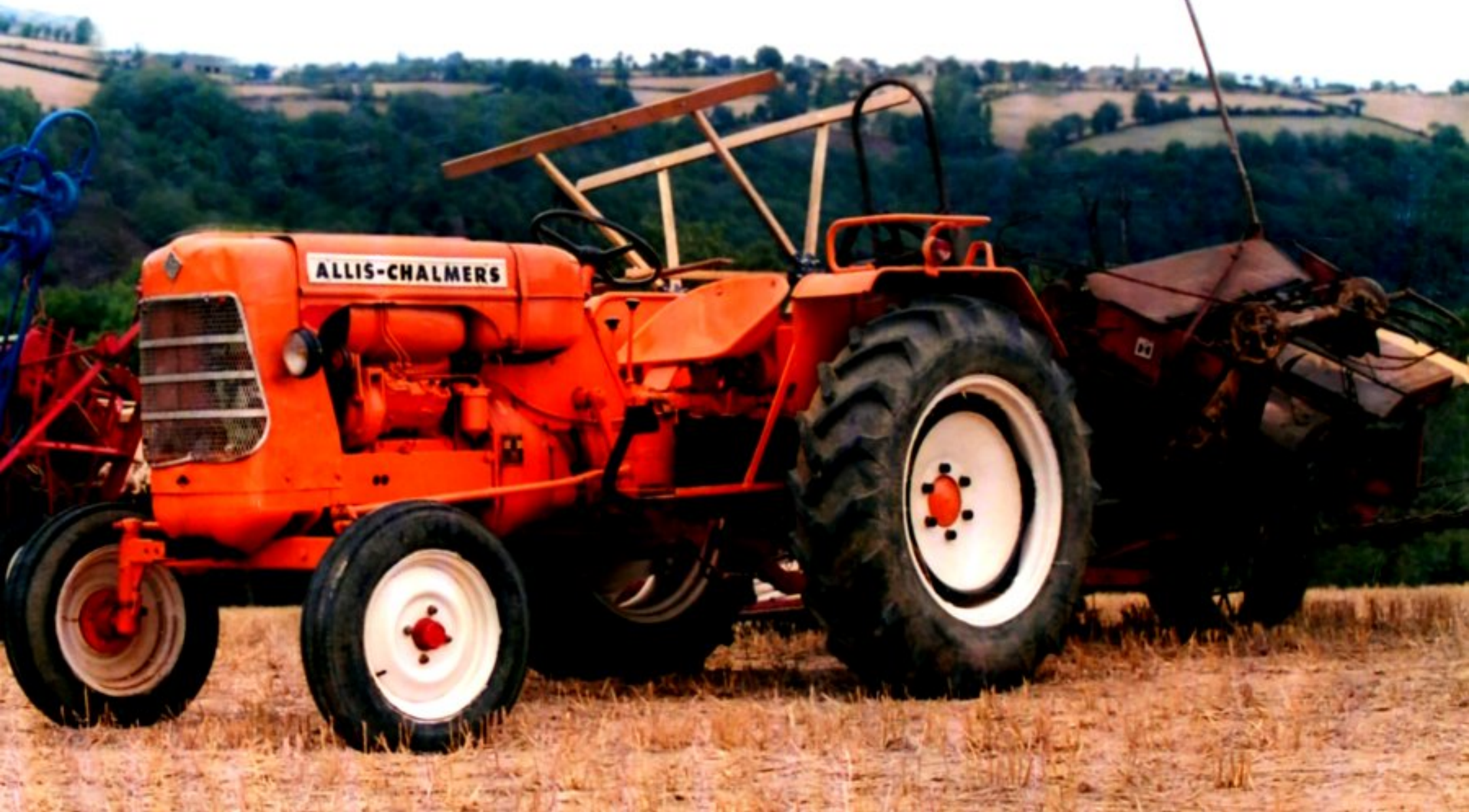
Tracteur Allis-Chalmers et moissonneuse lieuse sur sa roue motrice de travail