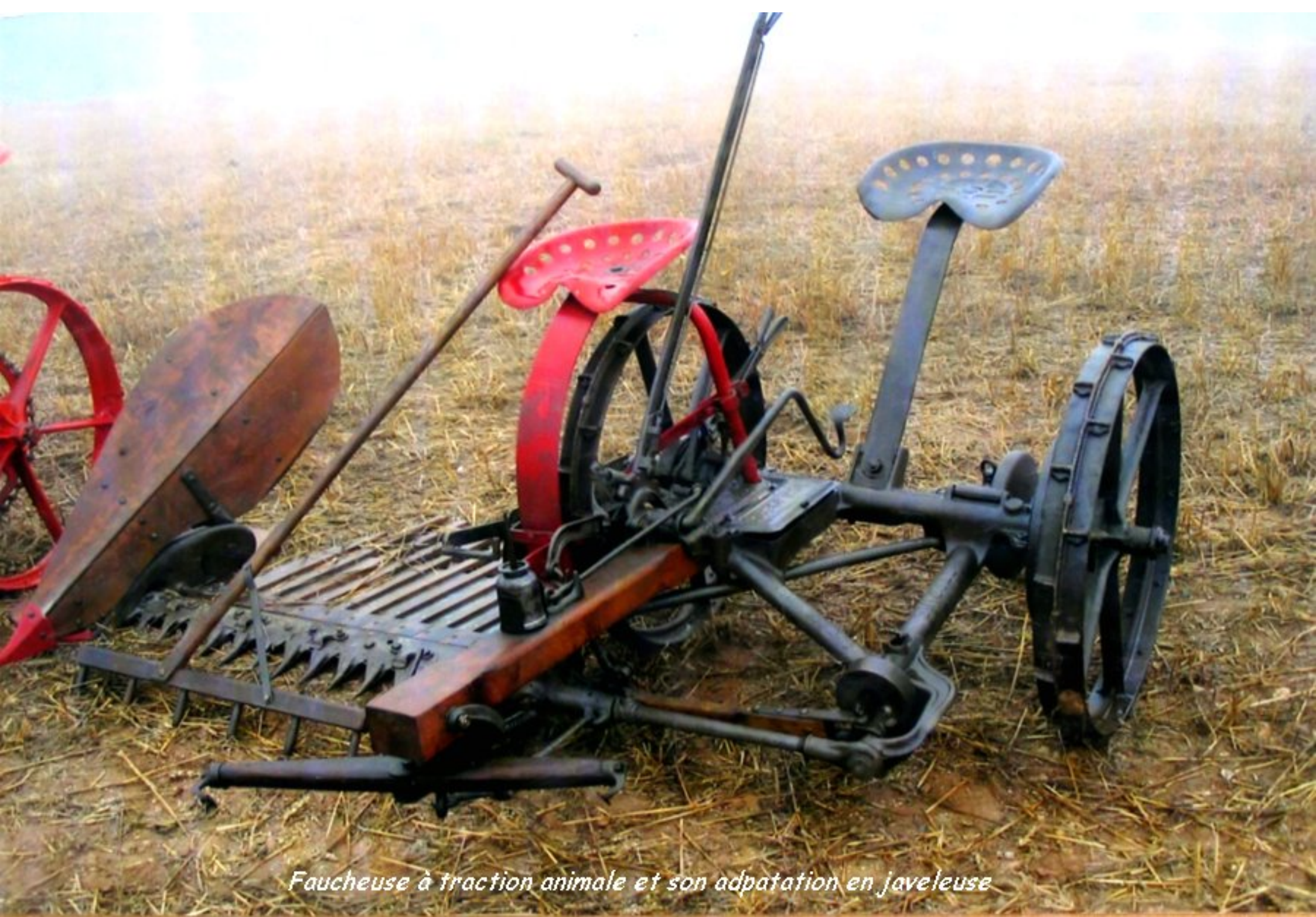
Faucheuse à traction animale et son adaptation en javelleuse