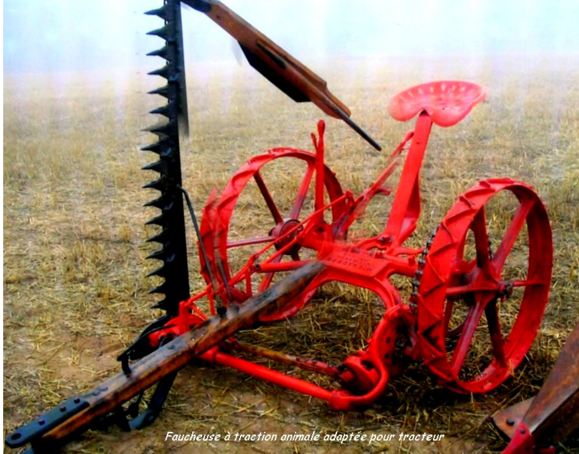
Faucheuse à traction animale adaptée pour tracteur