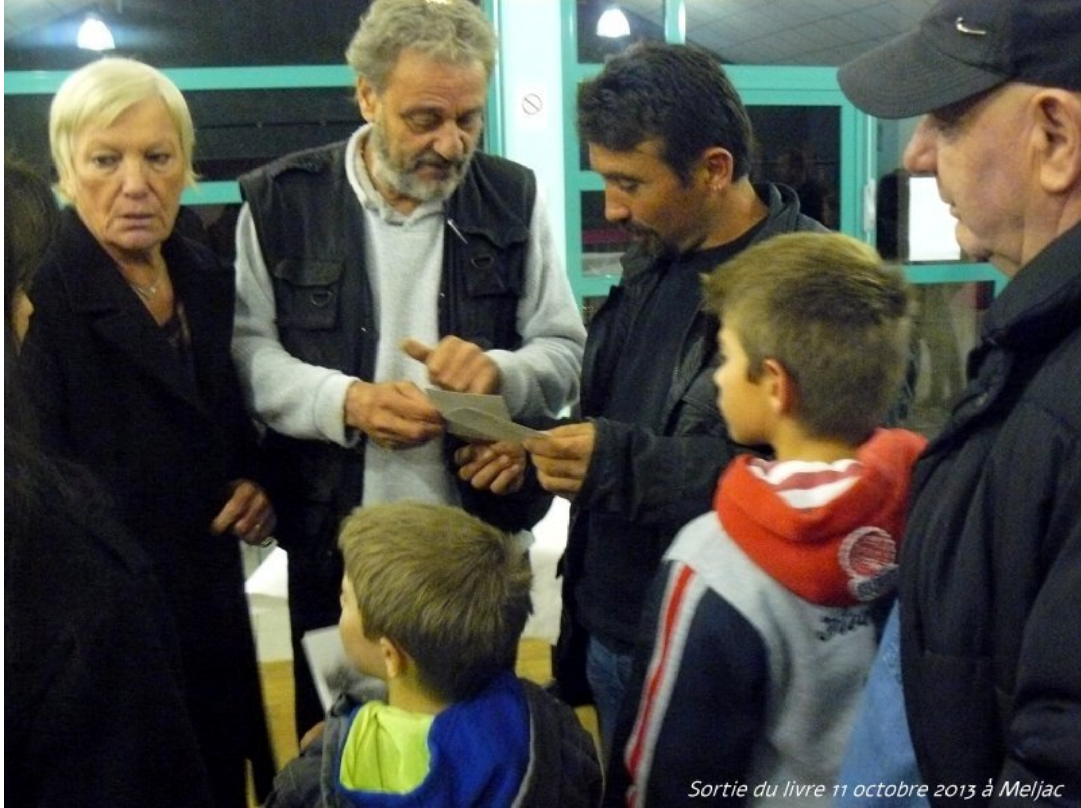
Sortie du livre 11 octobre 2013 à Meljac