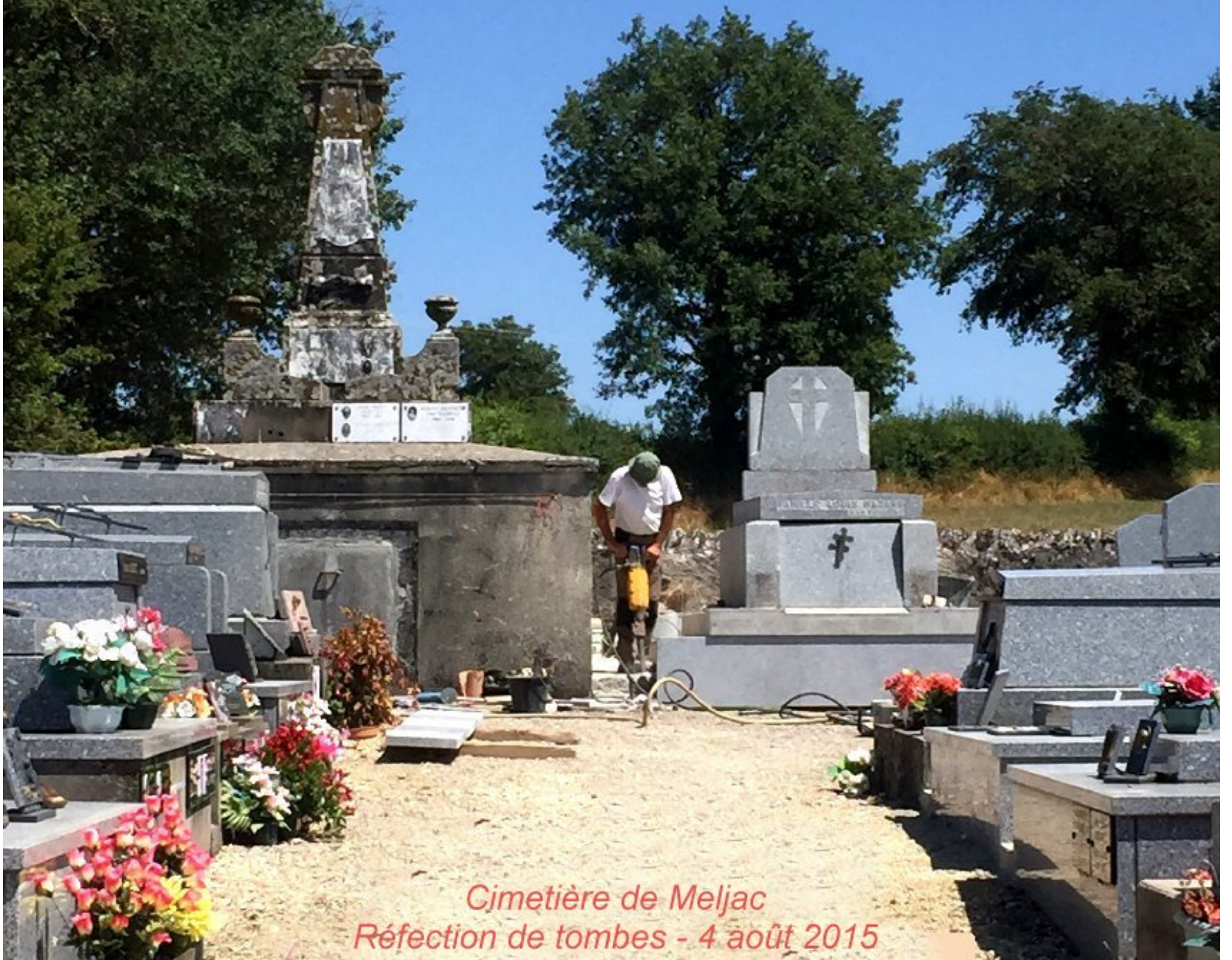
Cimetière de Meljac Réfection de tombes - 4 août 2015