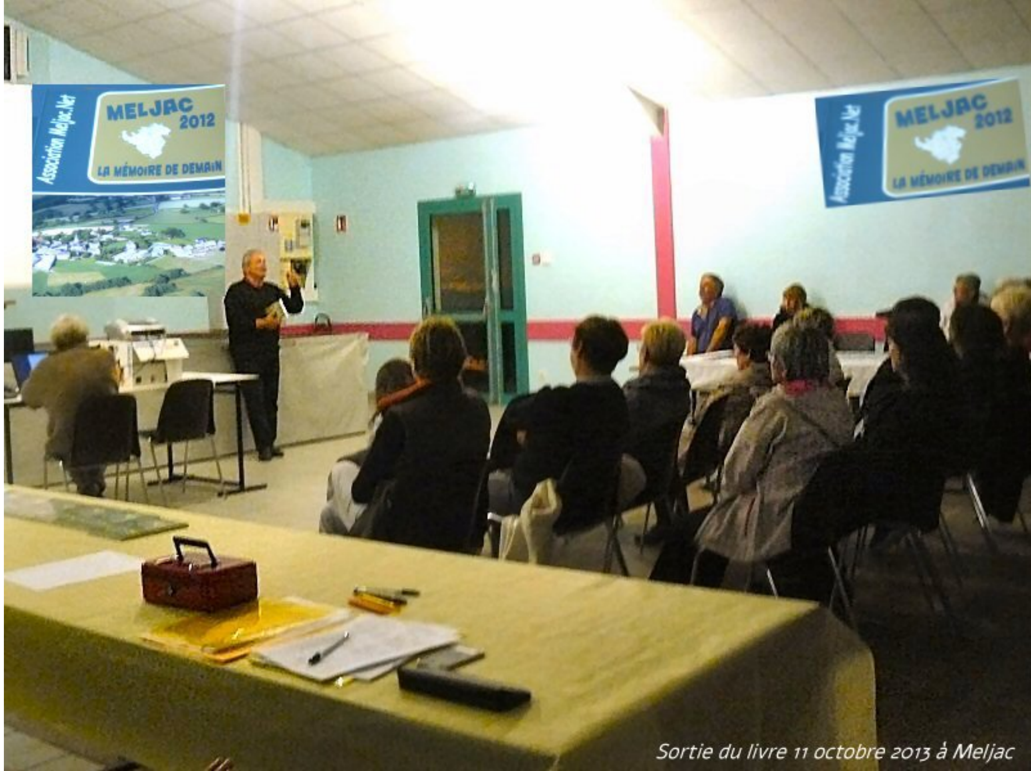
Sortie du livre 11 octobre 2013 à Meljac