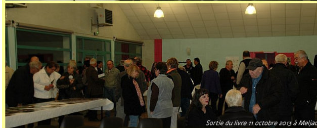
Sortie du livre 11 octobre 2013 à Meljac