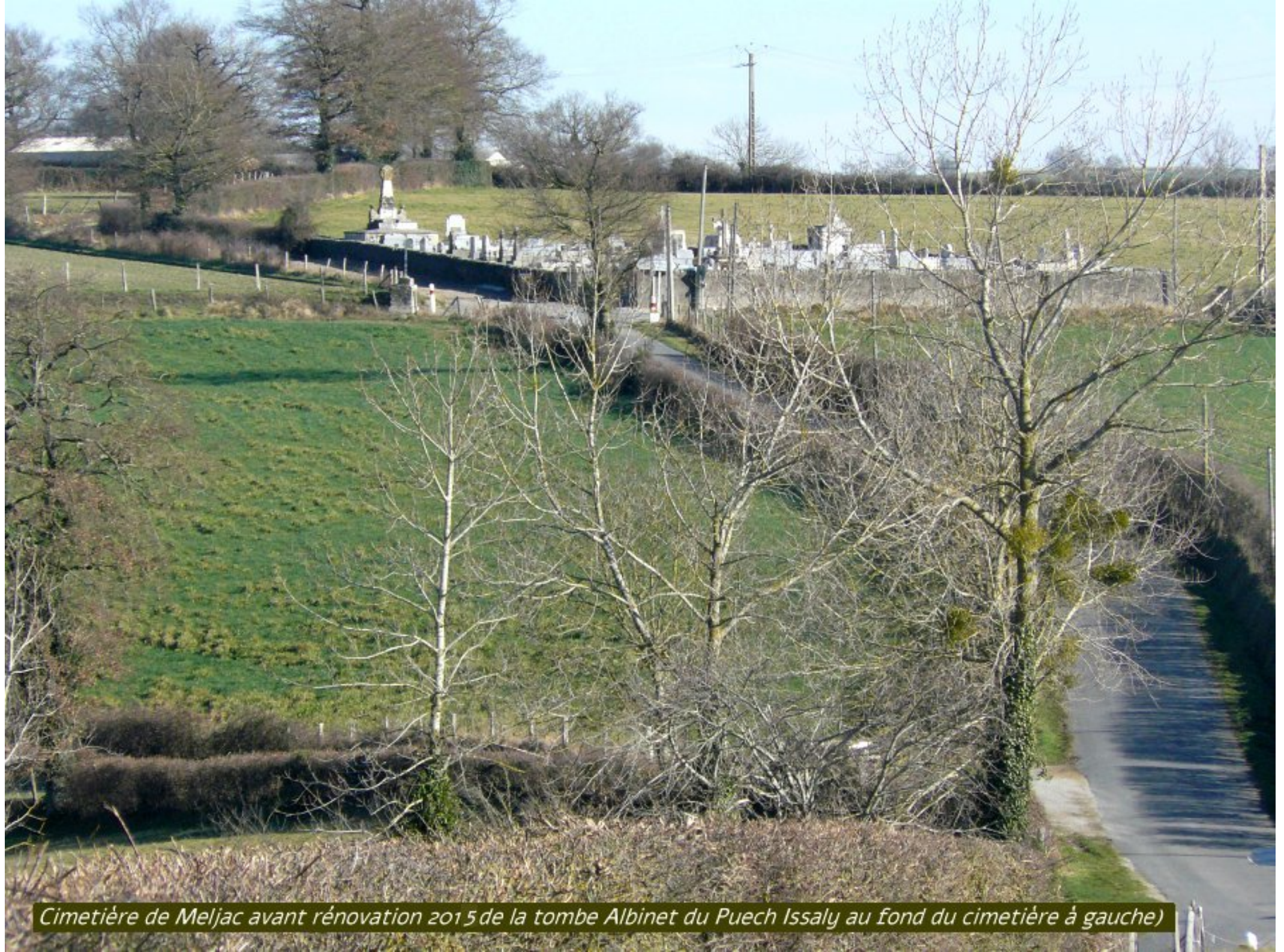
Cimetière de Meljac avant rénovation 2015 de la tombe Albinet du Puech Issaly au fond du cimetière à gauche)