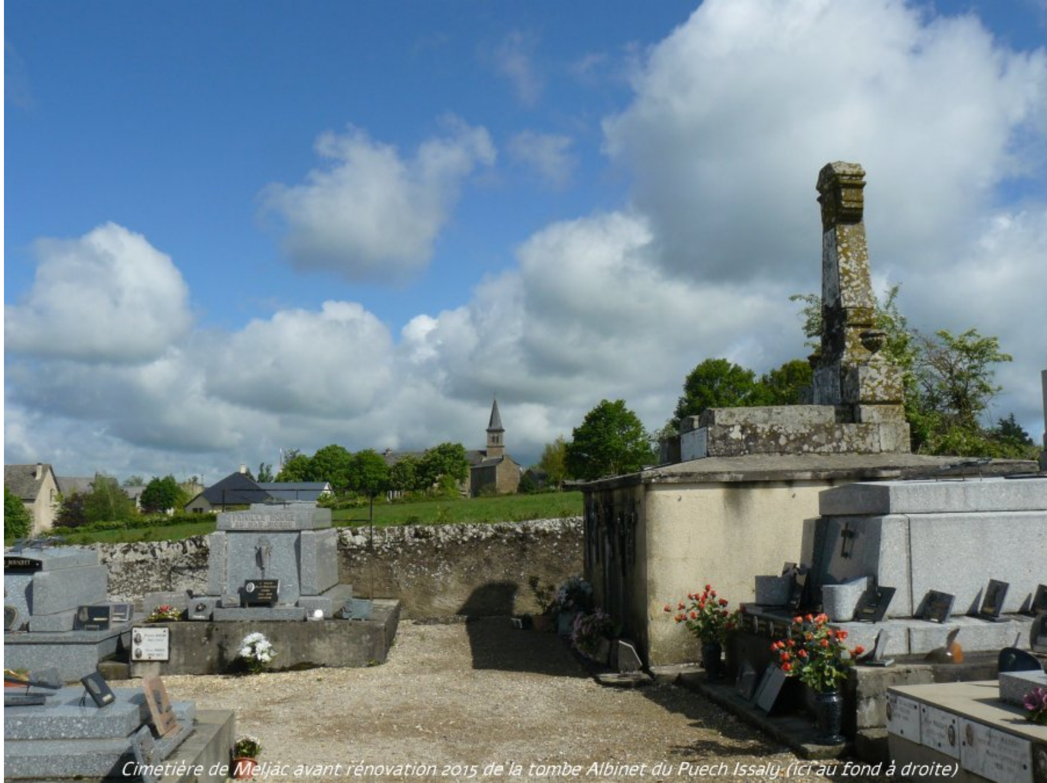
Cimetière de Meljac avant rénovation 2015 de la tombe Albinet du Puech Issaly (ici au fond à droite)