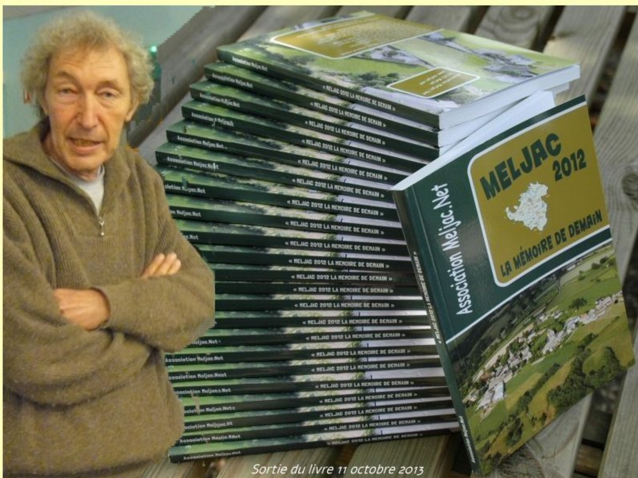
Sortie du livre 11 octobre 2013