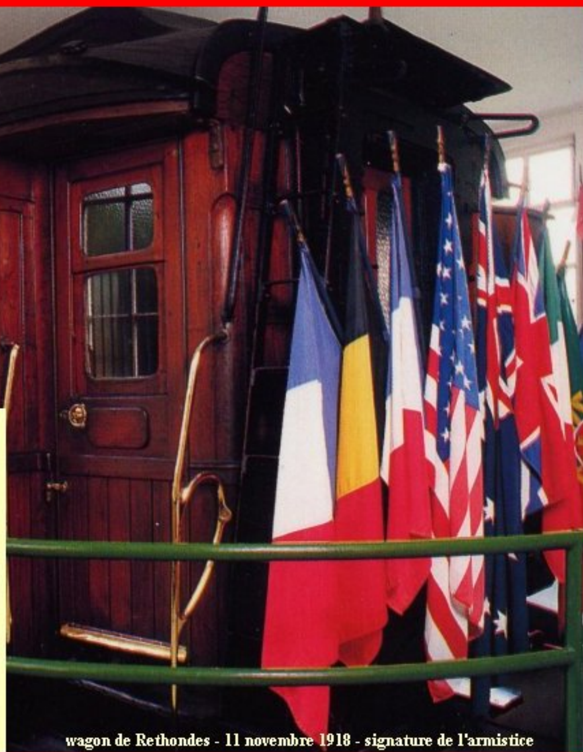
wagon de Rethondes - 11 novembre 1918 - signature de l'armistice