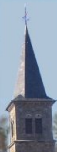
cathédrale Sainte Cécile - Albi