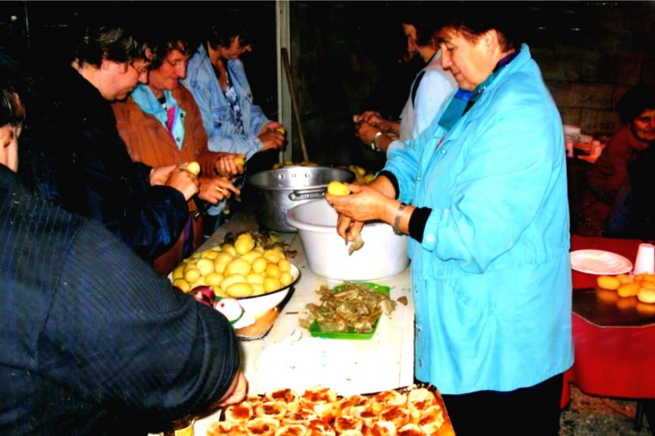
tandis que "les dames" voisines ou amies s'affairent en cuisine...