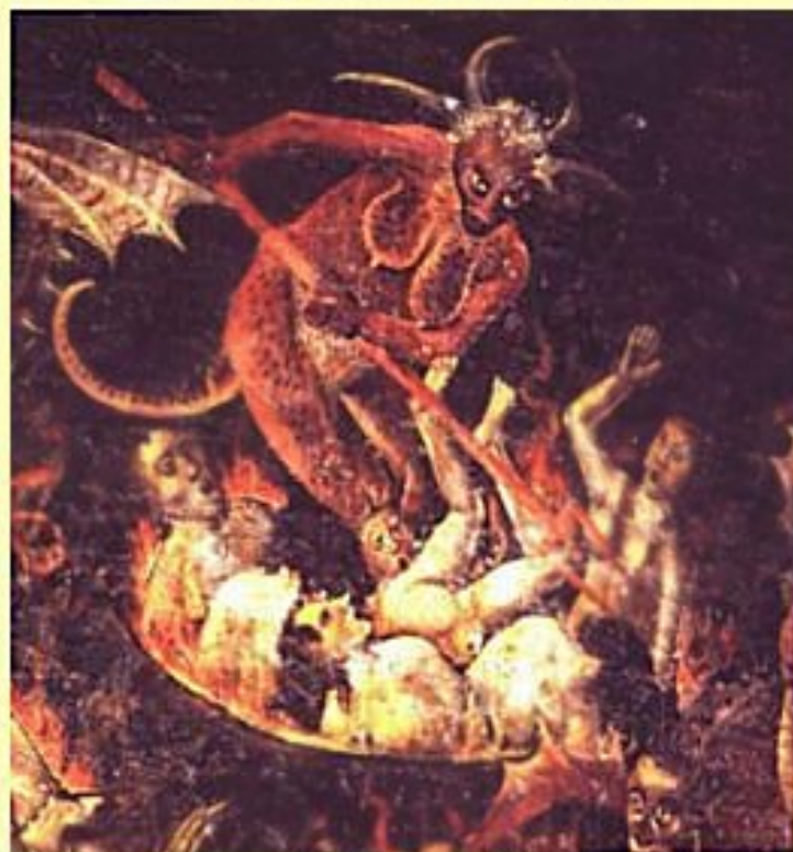
fresque du jugement dernier