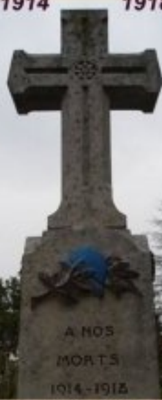
monument aux morts de Meljac