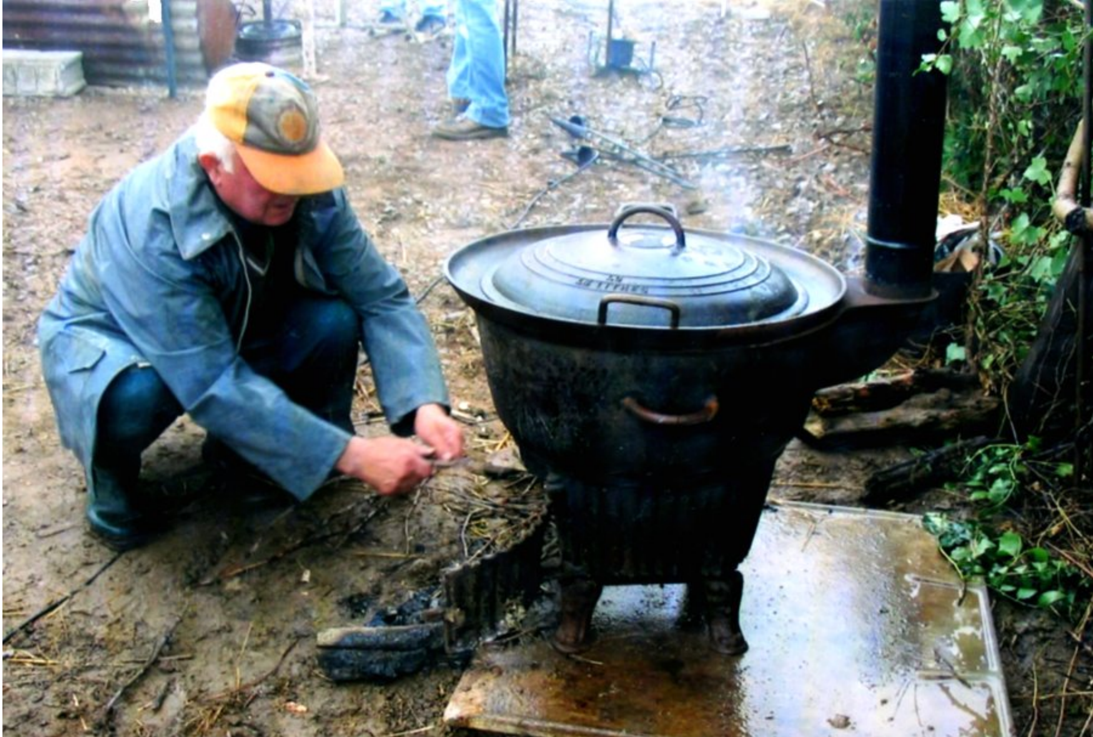
On fait bouillir l'eau pour cuire les pommes de terre dans le fornass; tout est fait dans les conditions d'antan