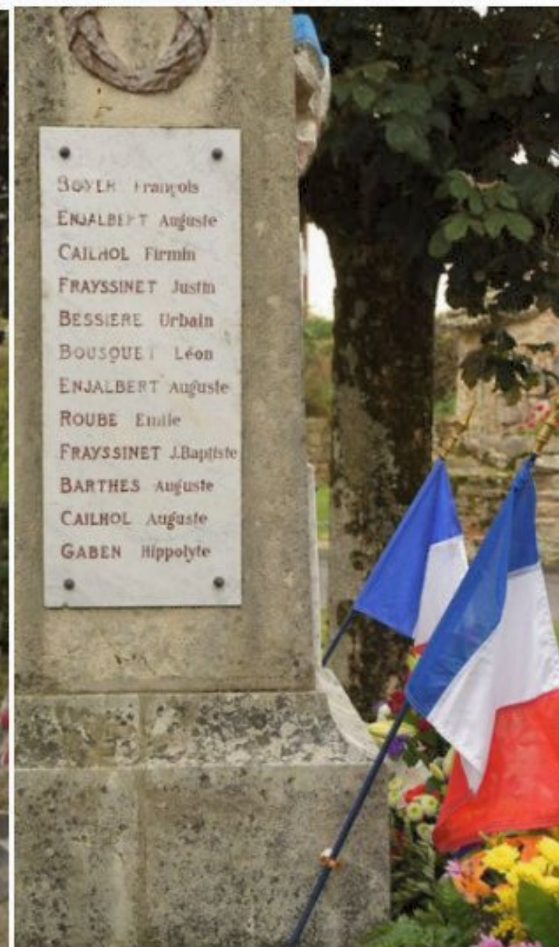
Commemoration de l'armistice du 11 novembre 1918 - Meljac dimanche 9 novembre 2014 avec les Anciens Combattants de Meljac - Rullac-St.Cirq.