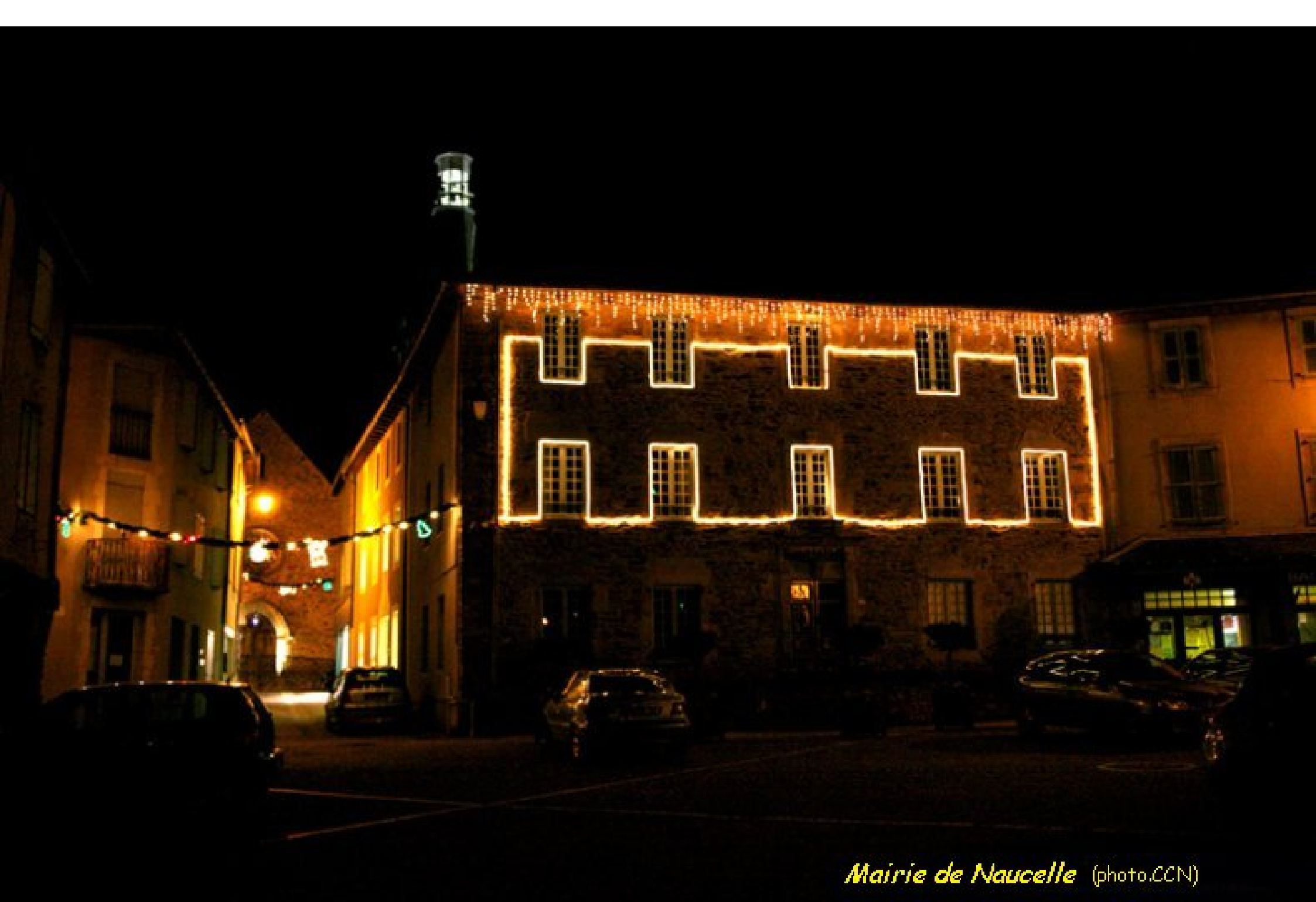
Mairie de Naucelle