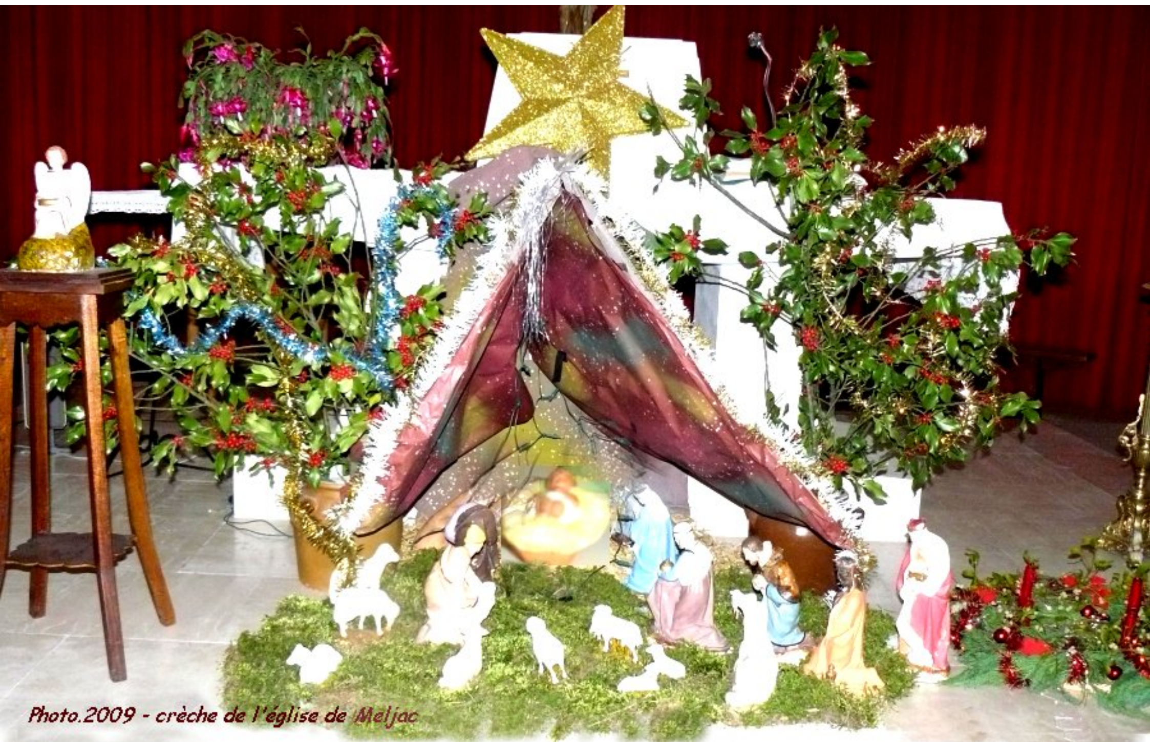
Photo.2009 - crèche de l'église de Meljac