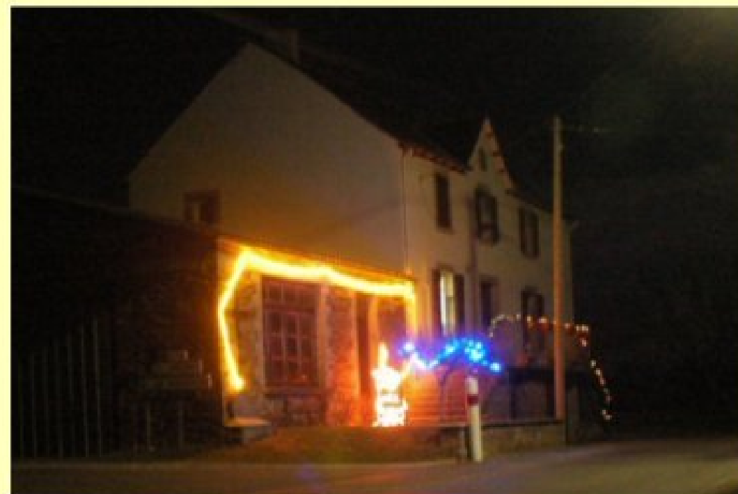
Lumières de Noël 2007 à Meljac et Grascazes - Joyeuse Fêtes !!!