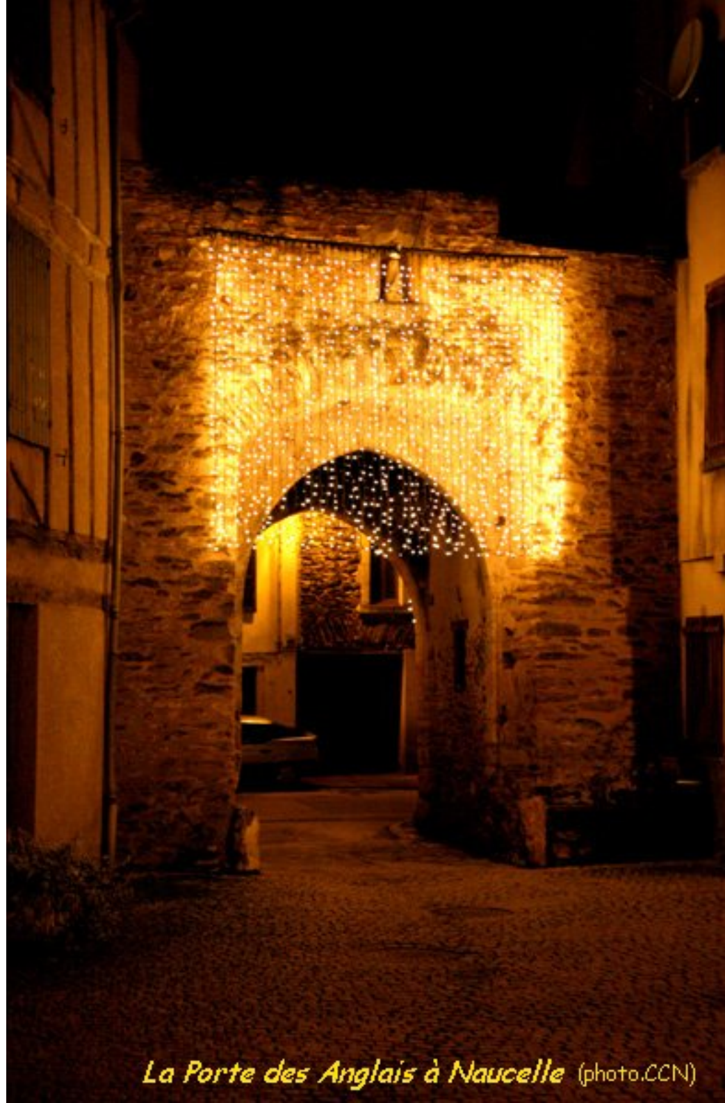
La Porte des Anglais à Naucelle