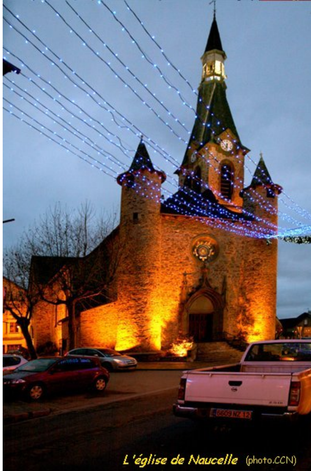
L'église de Naucelle