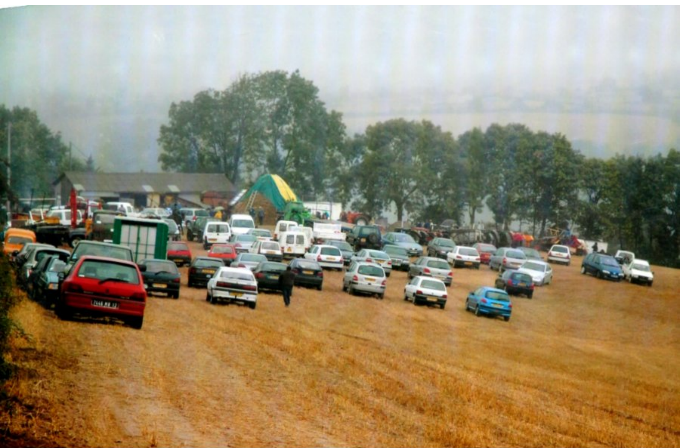
Les voitures des "invités" sur le parking de la Pesse