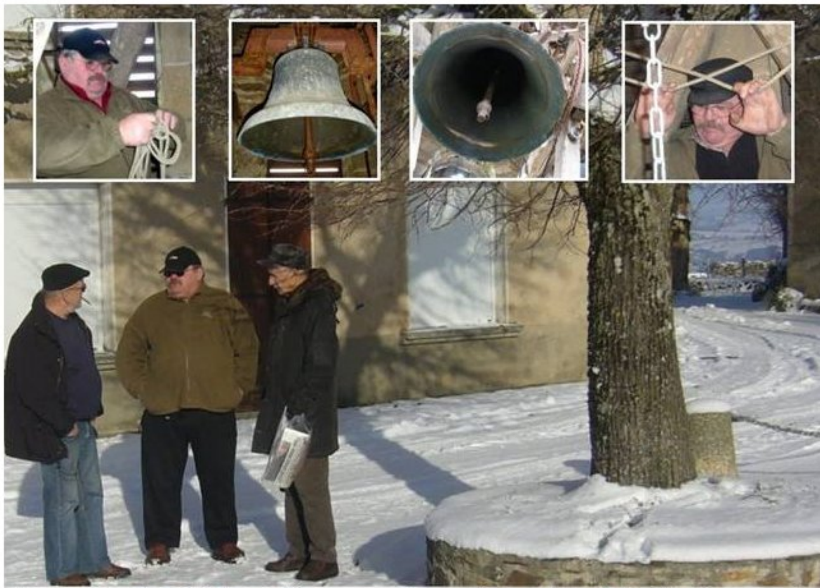
Pour Noël 2009, Meljac sous la neige attend les "trignous"