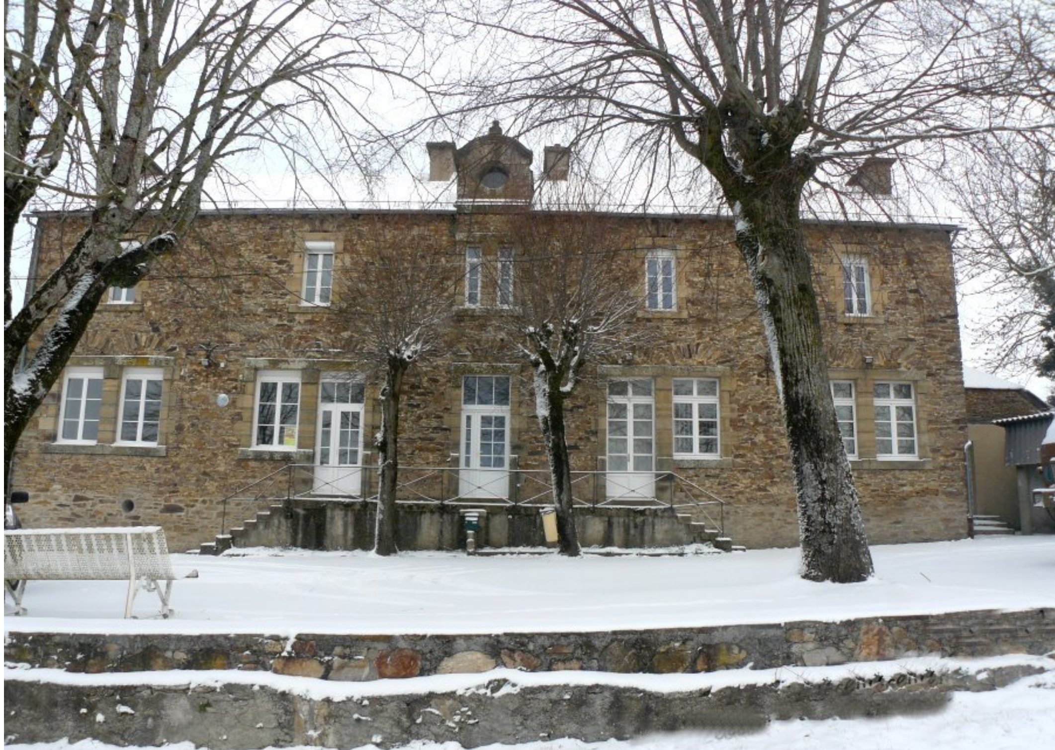
Meljac janvier 2010