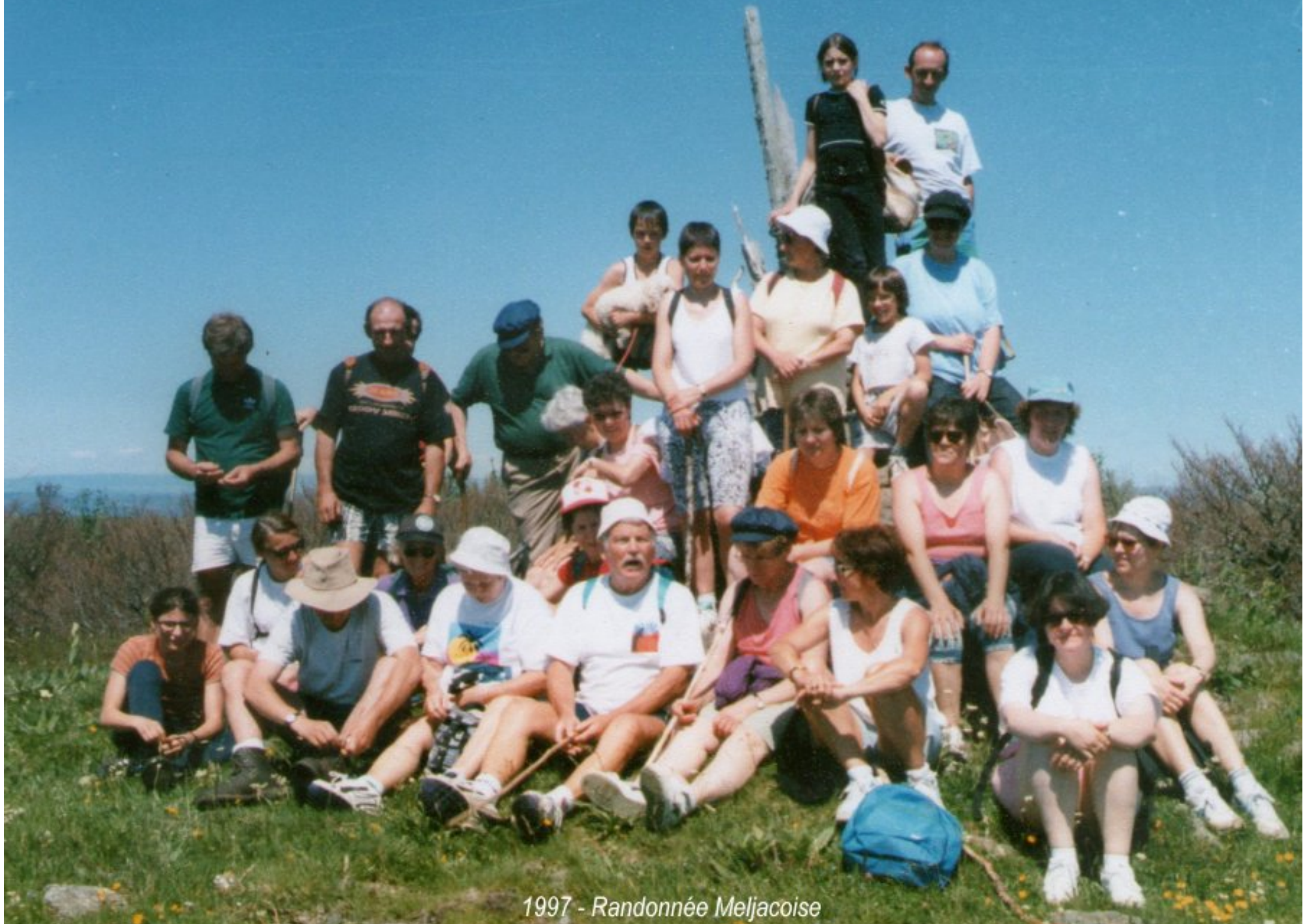
1997 - Randonnée Meljacoise