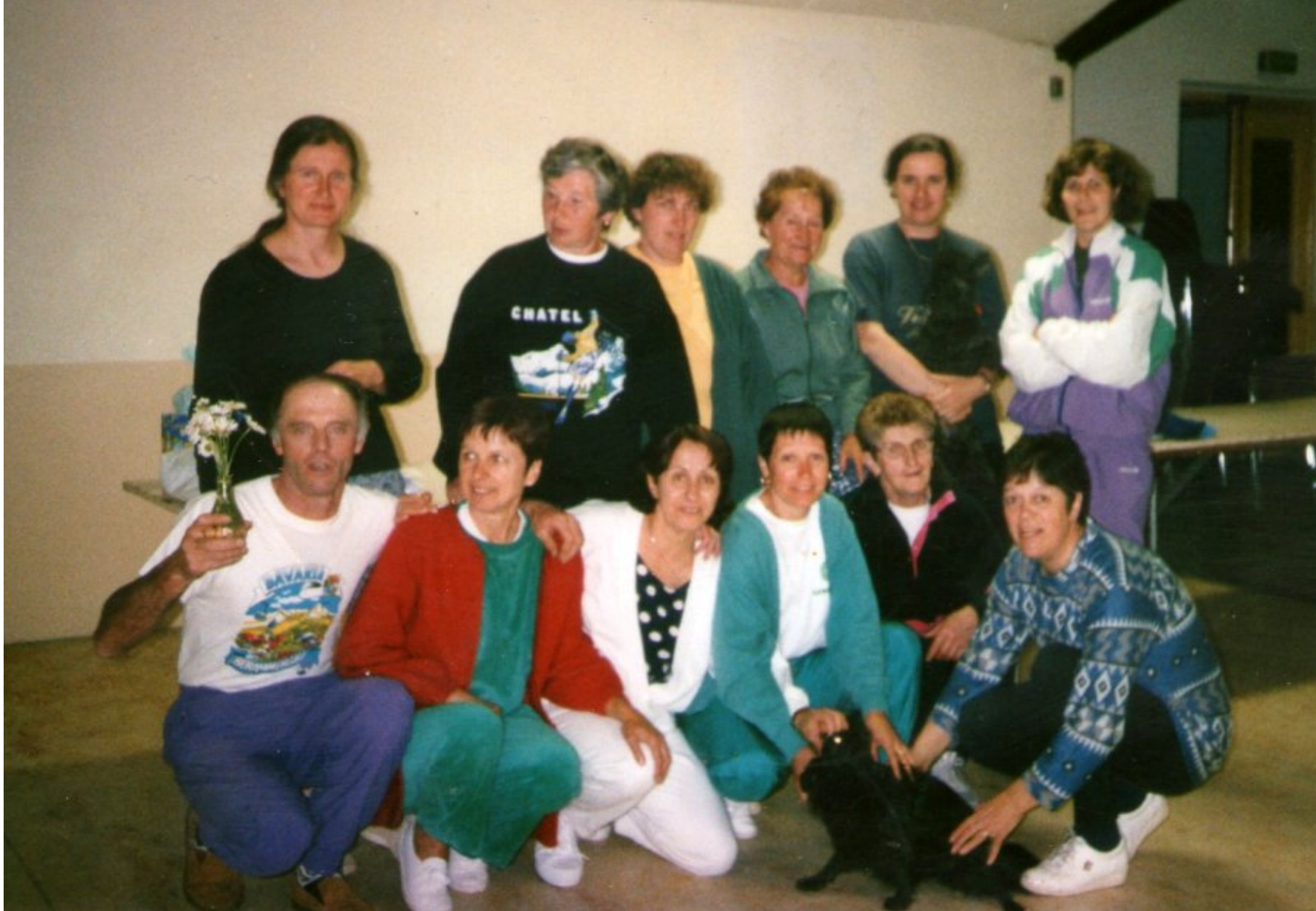
1998 - gymnastique meljacoise