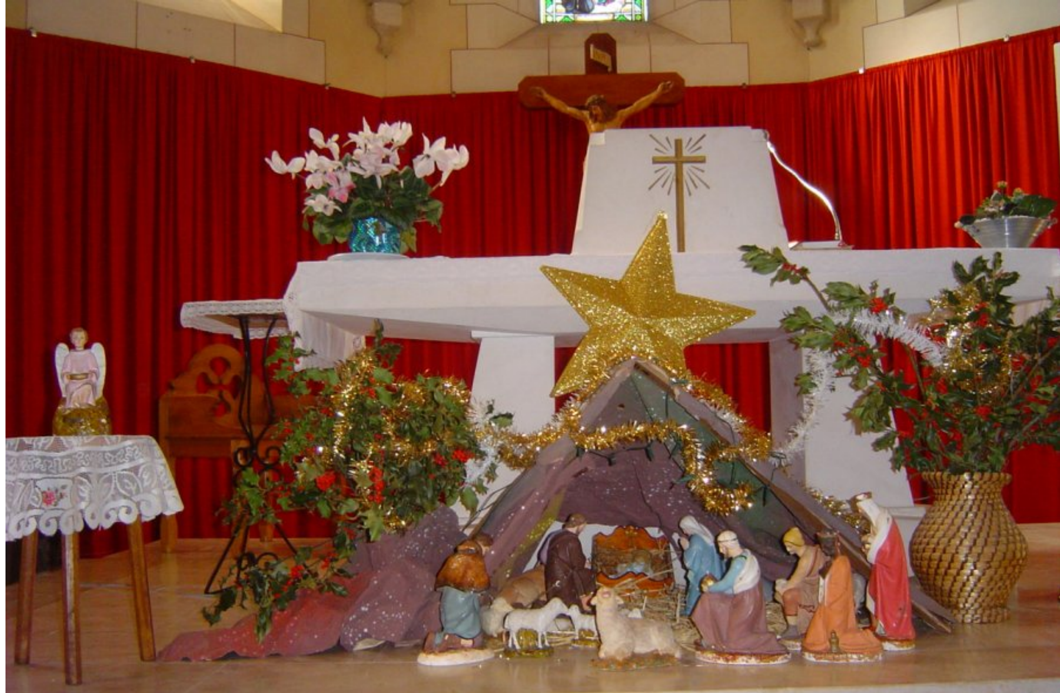
Crèche de l'église de Meljac - Année 2007