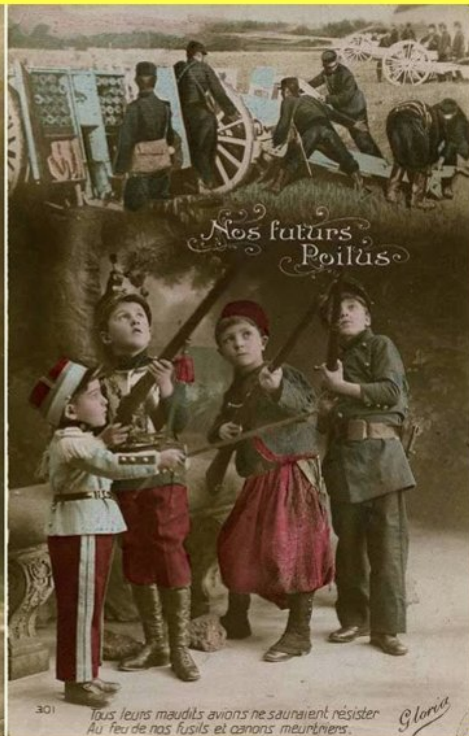
Cartes postales de propagande - guerre de 1914-1918