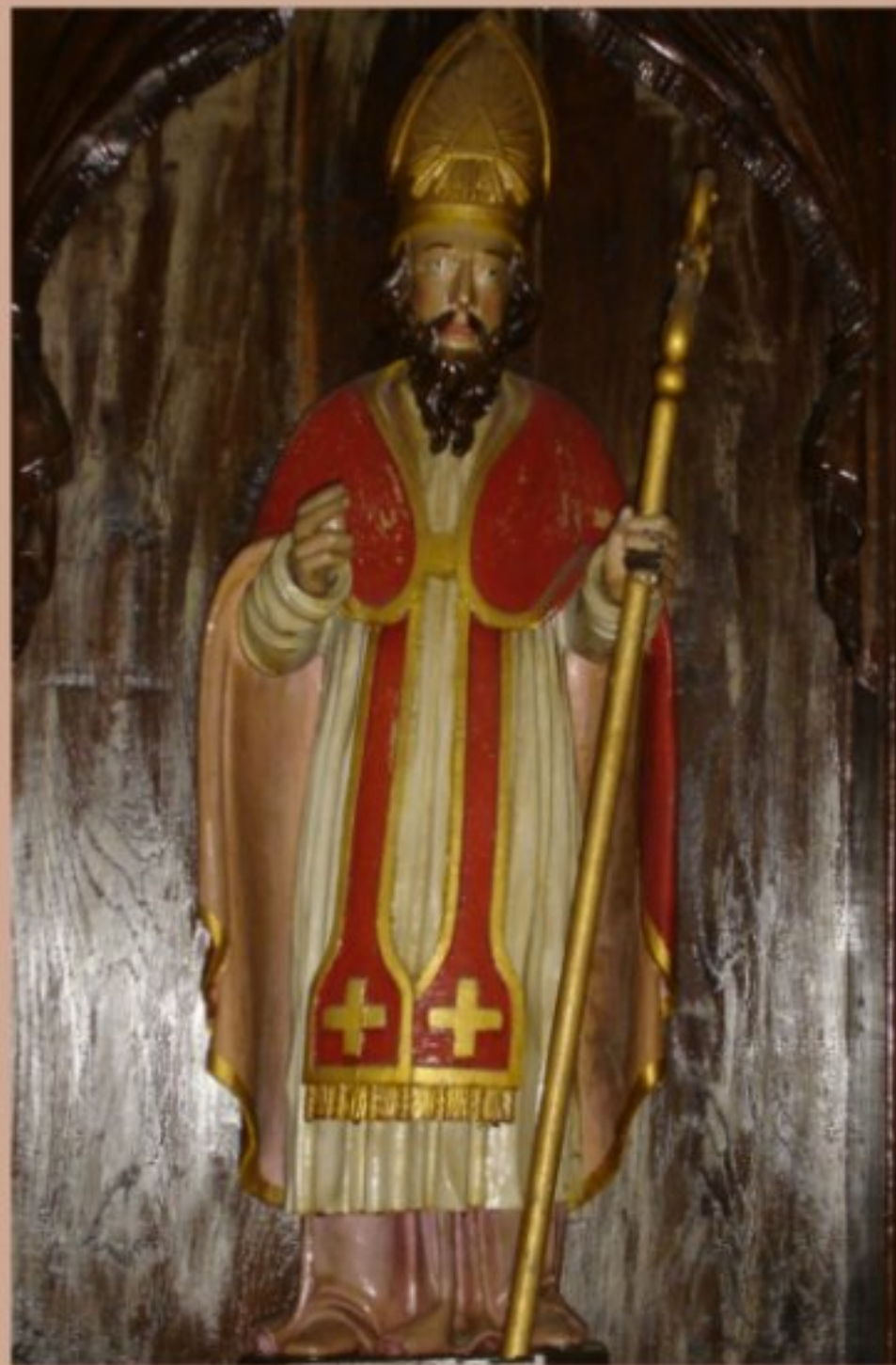
Statue en bois de Saint-Blaise protecteur de Meljac (Aveyron)