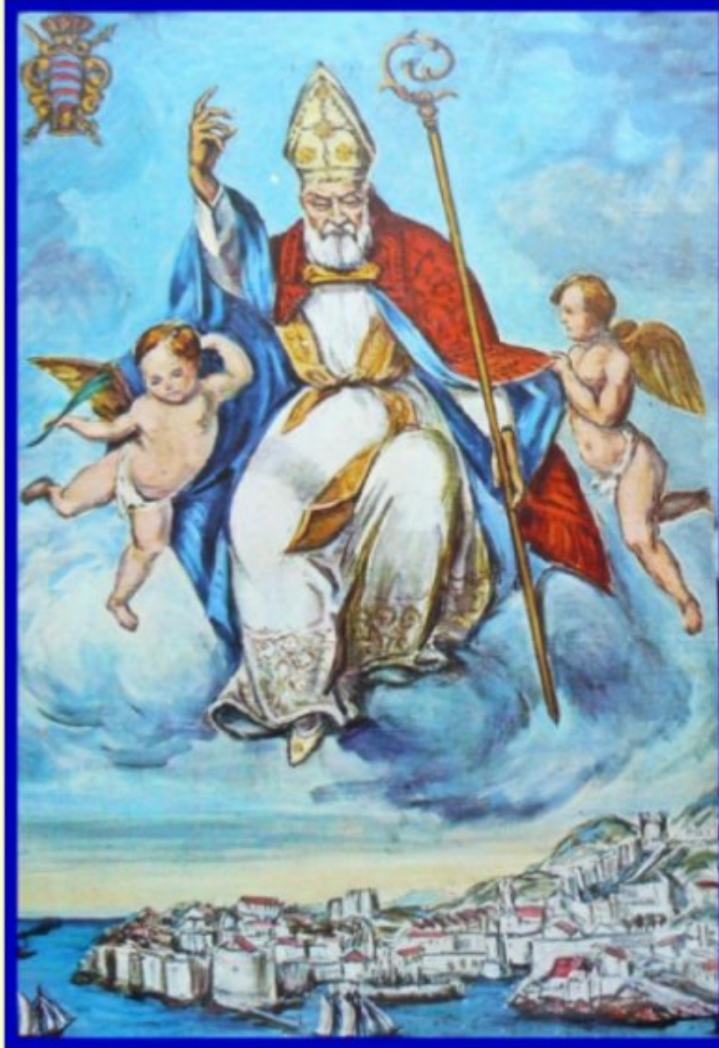
Icône de Saint-Baise protecteur depuis 972 de Dubrovnik (Croatie)