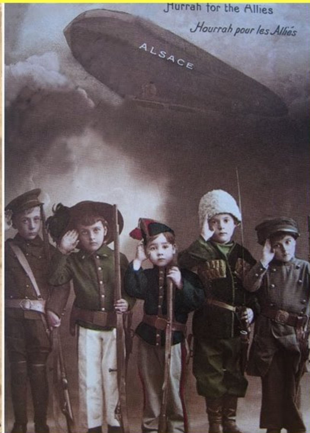
Cartes postales de propagande - guerre de 1914-1918