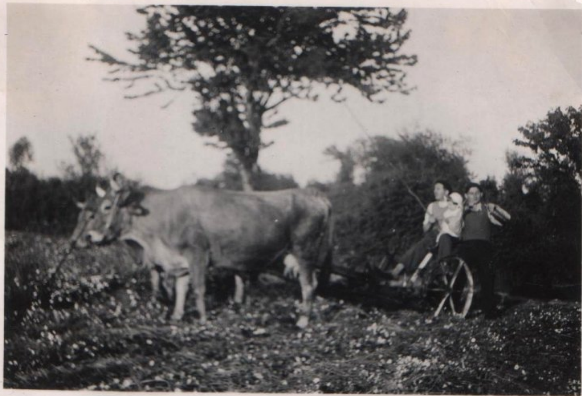
Année 1939 - chez Azam du Puech Issaly