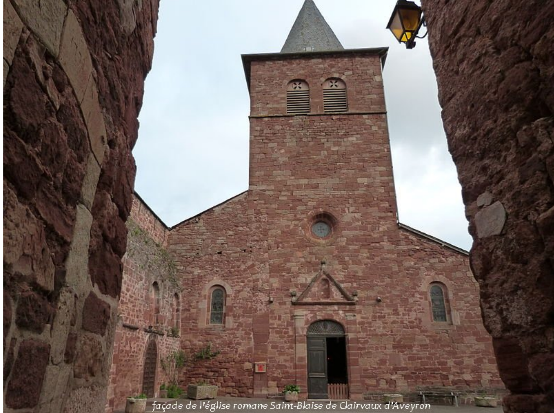
façade de l'église romane Saint-Blaise de Clairvaux d'Aveyron