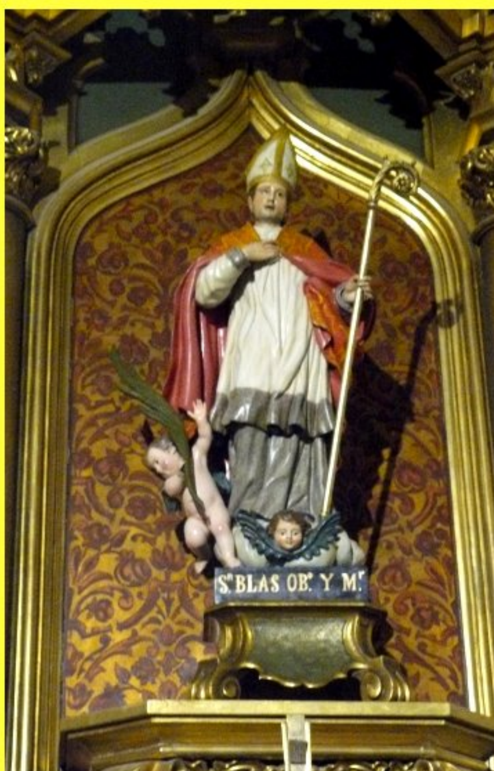
cathédrale de Madrid - Espagne