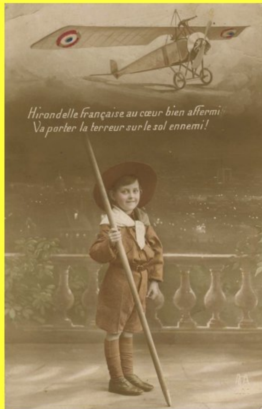
Cartes postales de propagande - guerre de 1914-1918