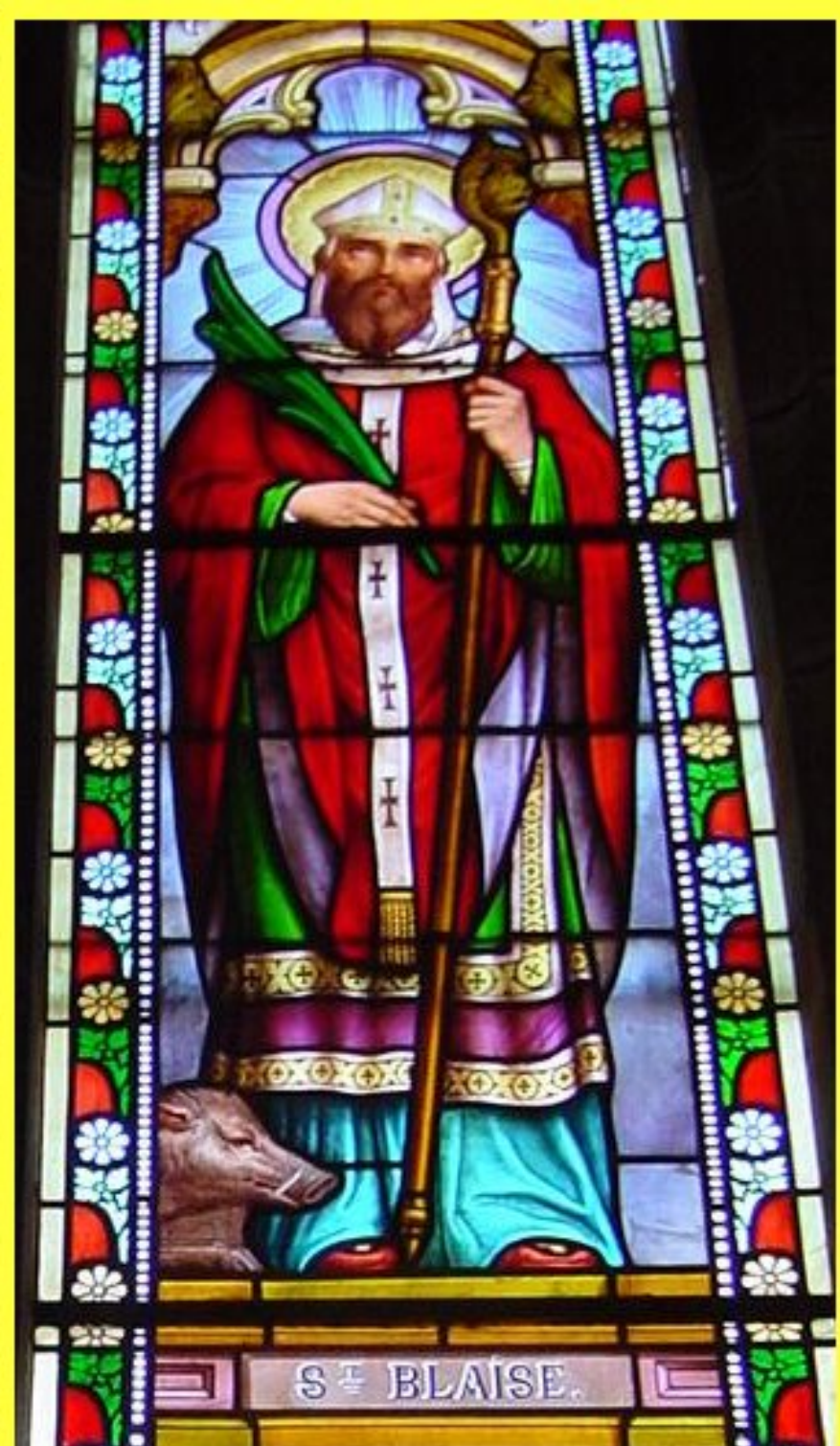
église de Meljac - France