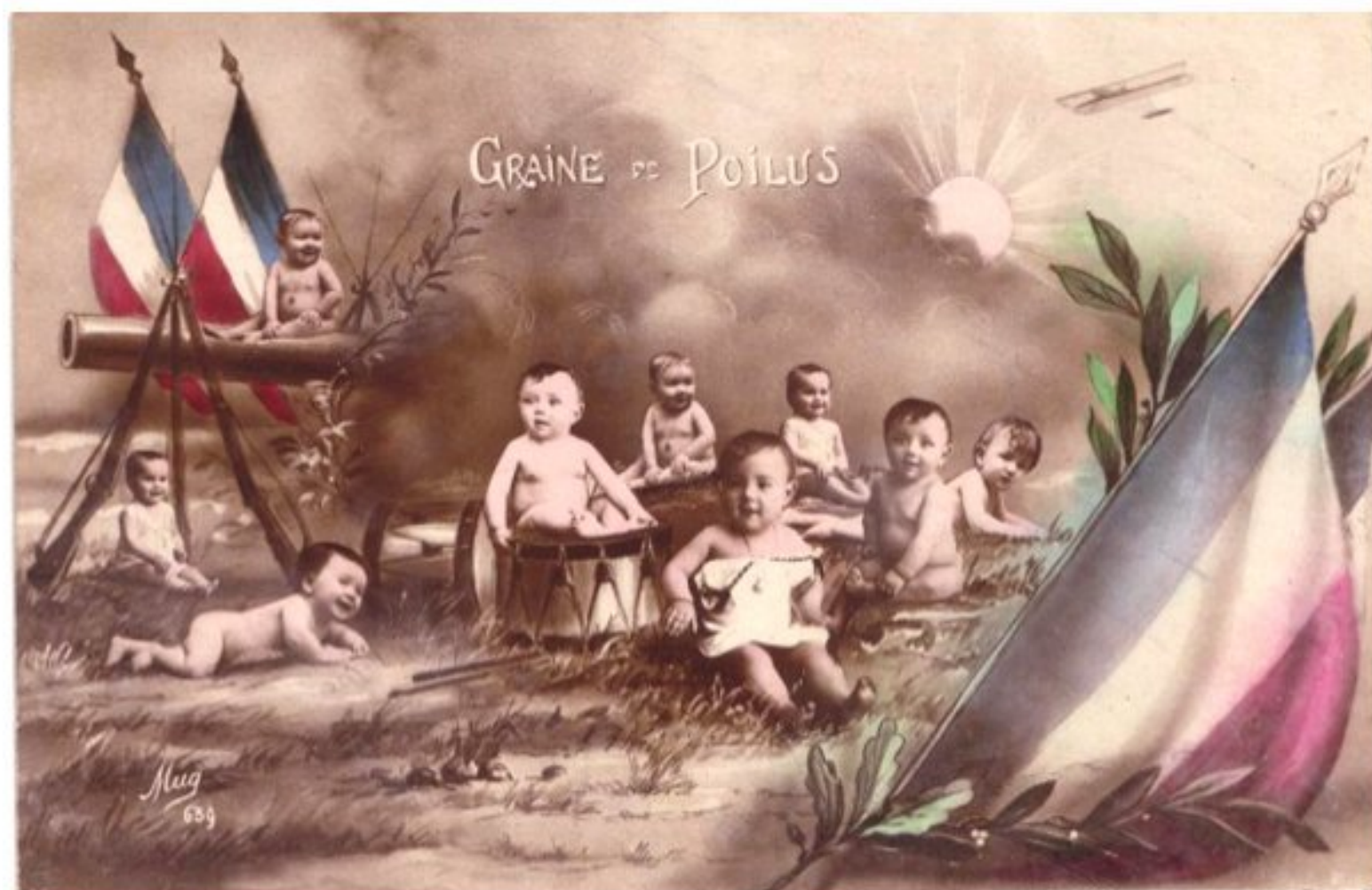
Cartes postales de propagande - guerre de 1914-1918