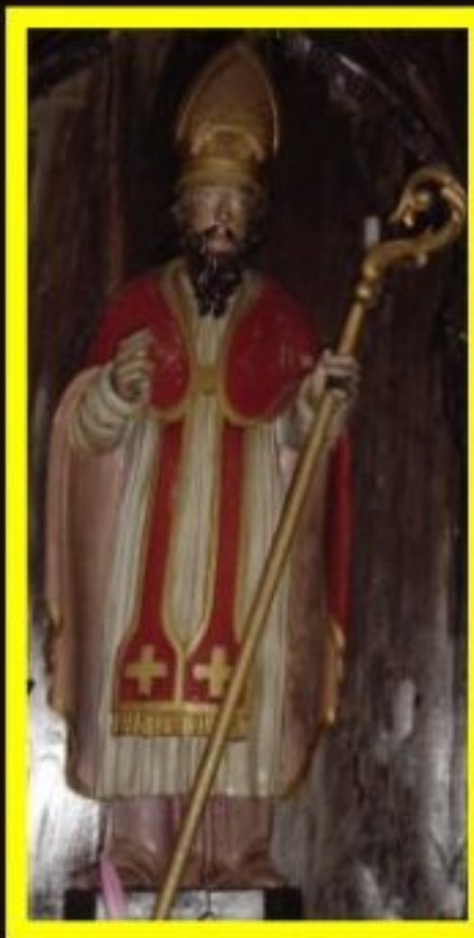
statue en bois de St-Blaise église de Meljac

Le monde sait les luttes héroïques Que par la foi soutinrent nos aïeux Pour mériter le nom de catholiques Jusqu'à sa mort nous lutterons comme eux