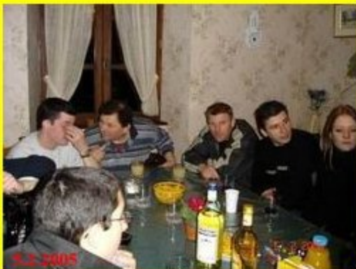
les aubades, le bal du samedi...