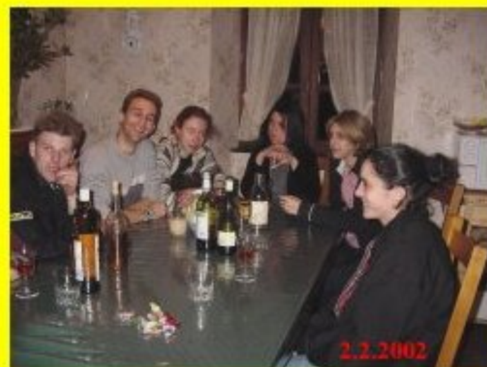
la randonnée du dimanche...