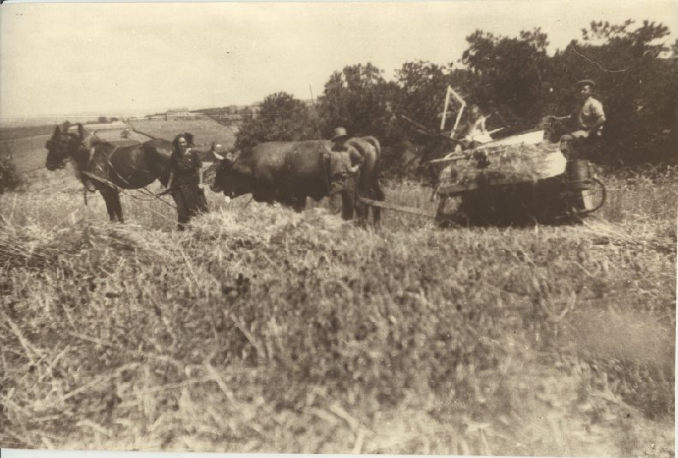
-Moisson chez Boyer de la Treillie - Année 1942 - (source Robert Bousquet)