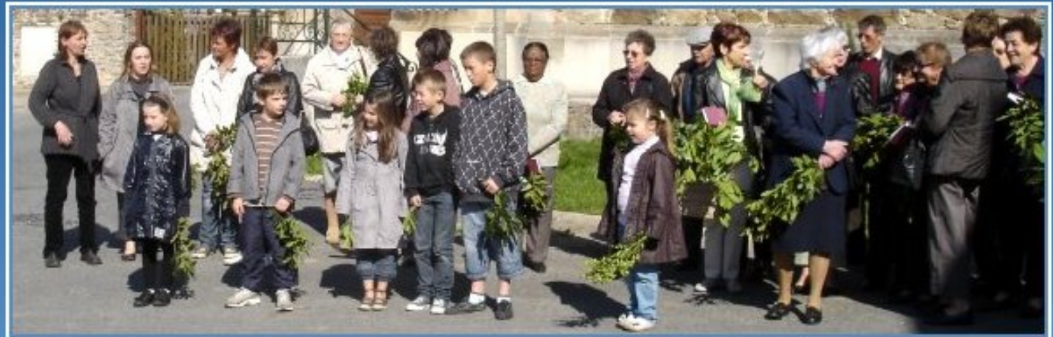
Meljac - 17 avril 2011: bénédiction des Rameaux et de la Croix du Jubilé rénovée fin 2010