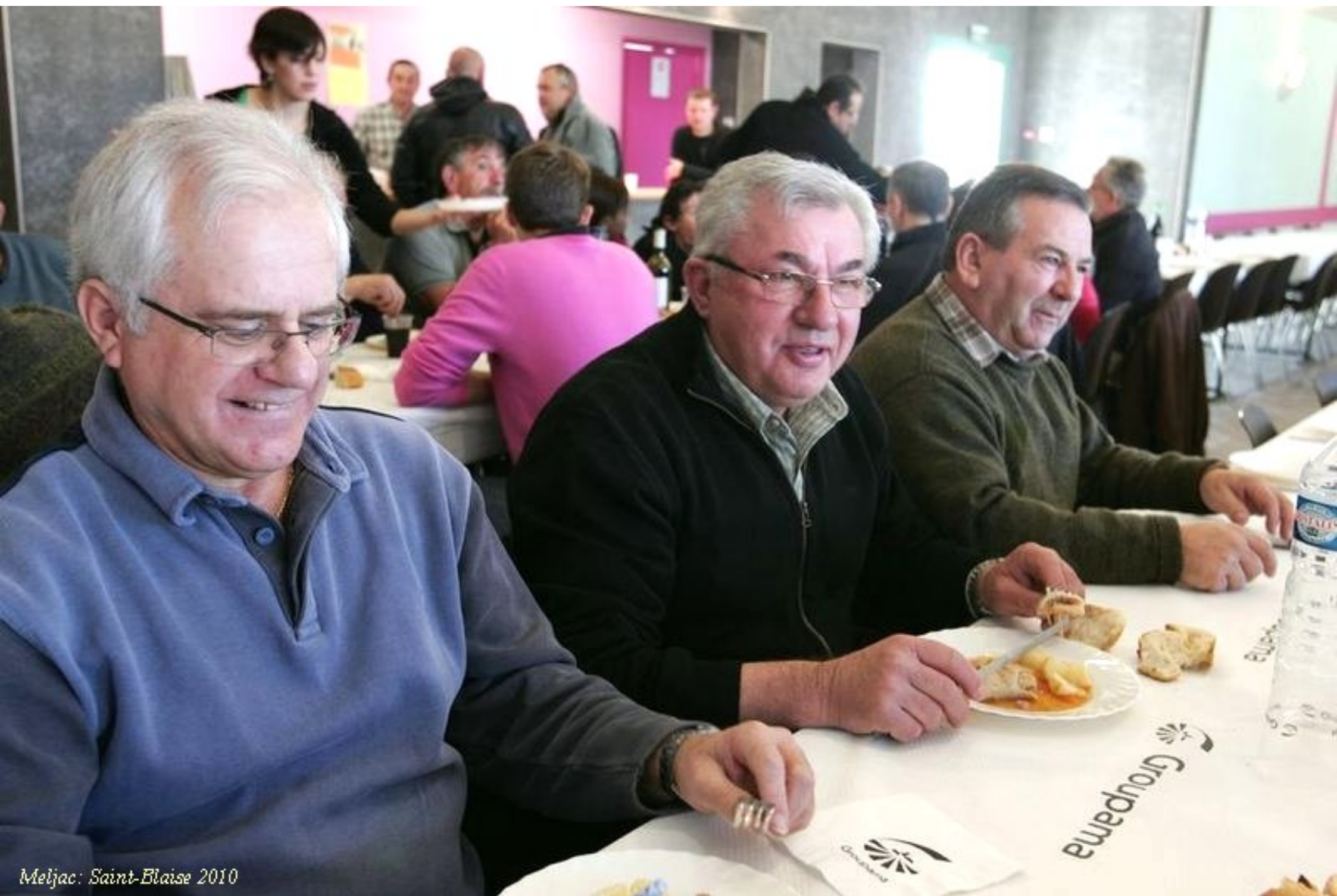
Meljac: Saint-Blaise 2010