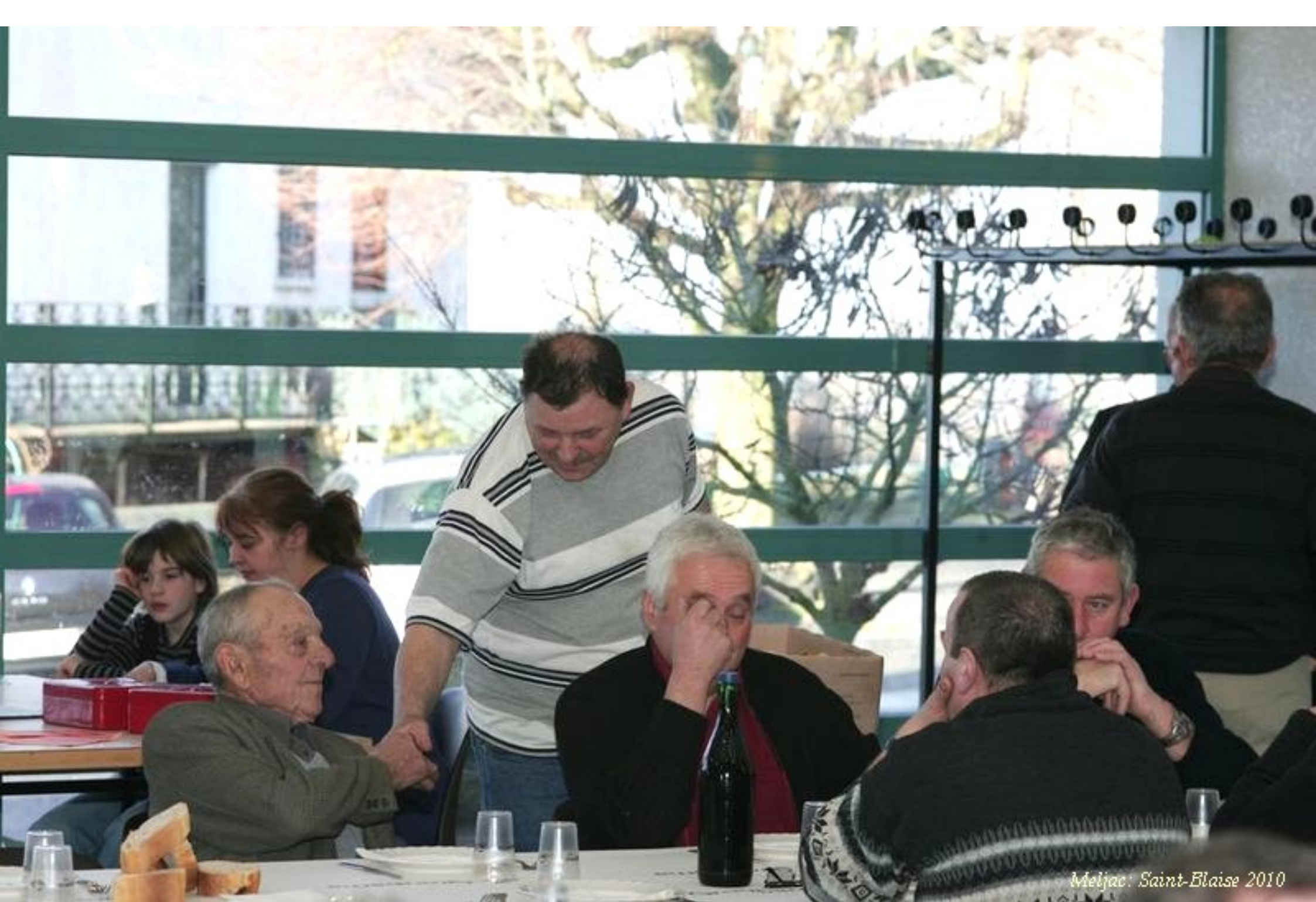
Meljac: Saint-Blaise 2010