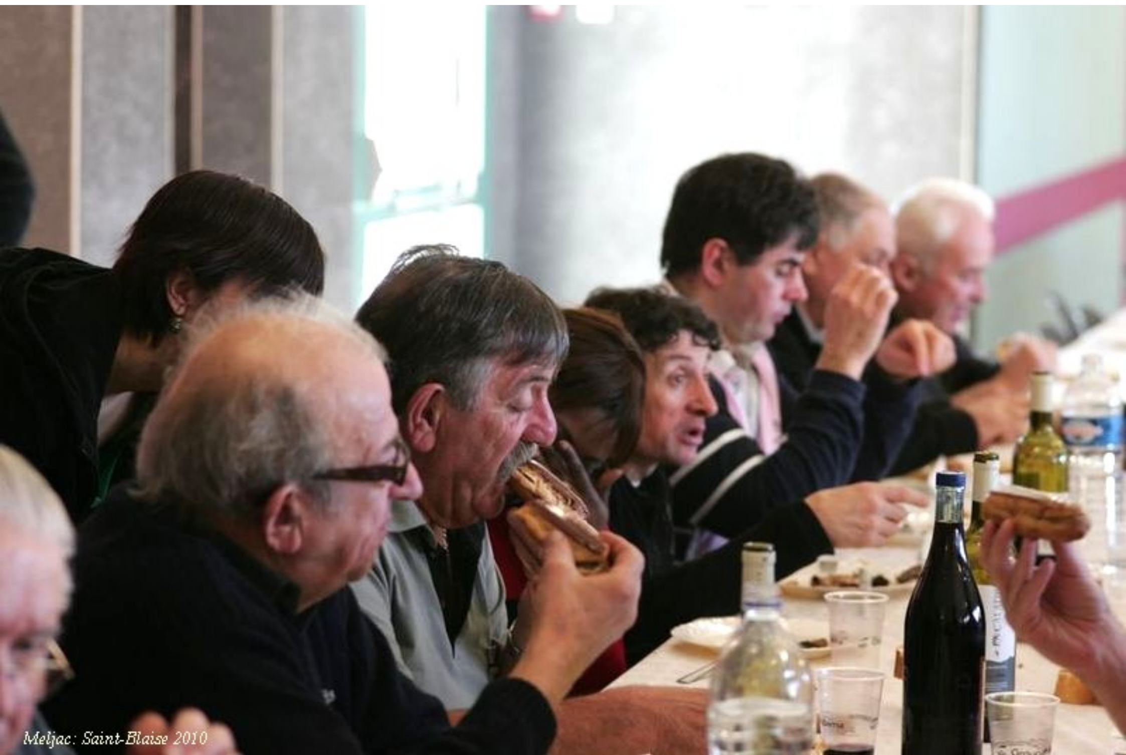
Meljac: Saint-Blaise 2010