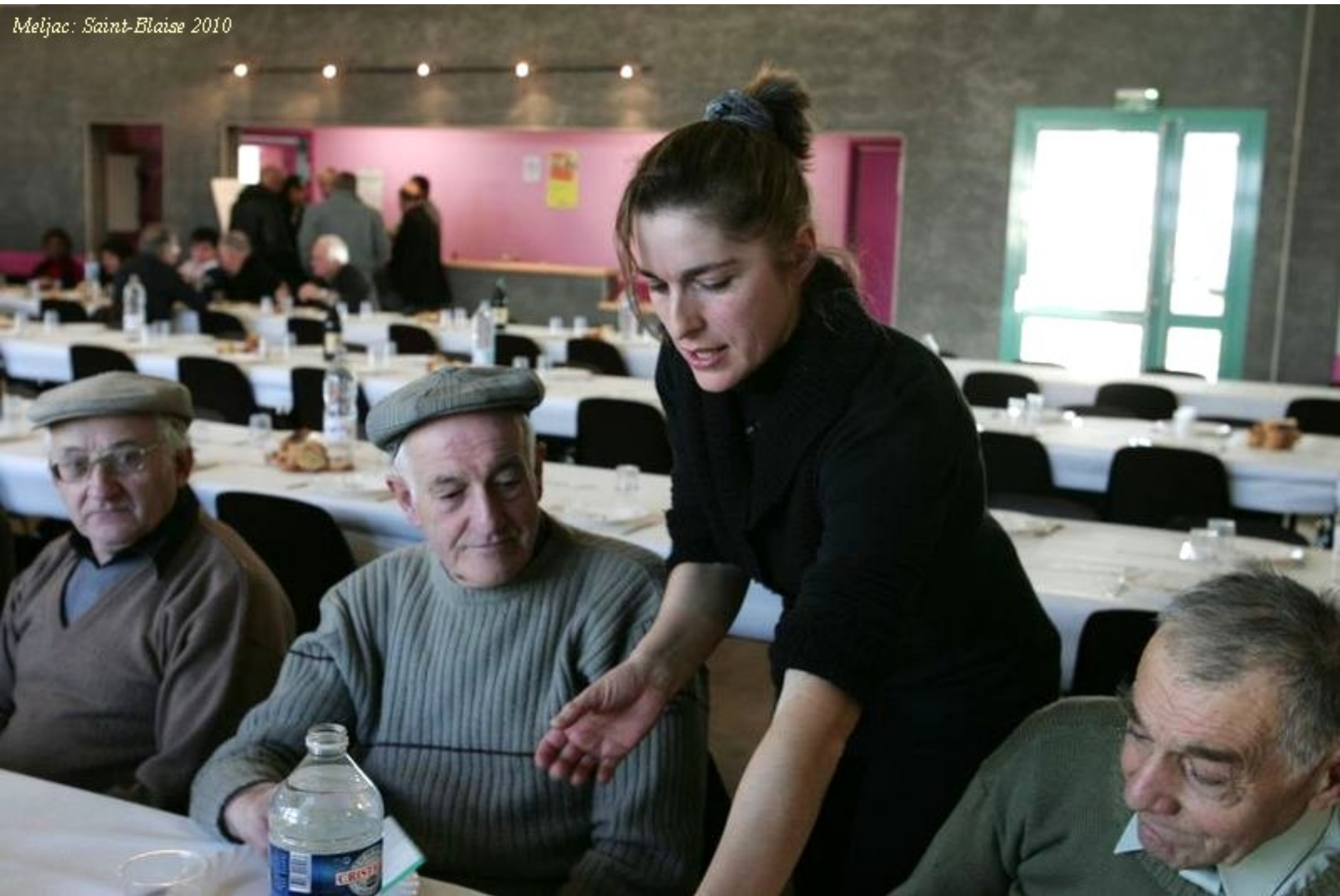
Meljac: Saint-Blaise 2010