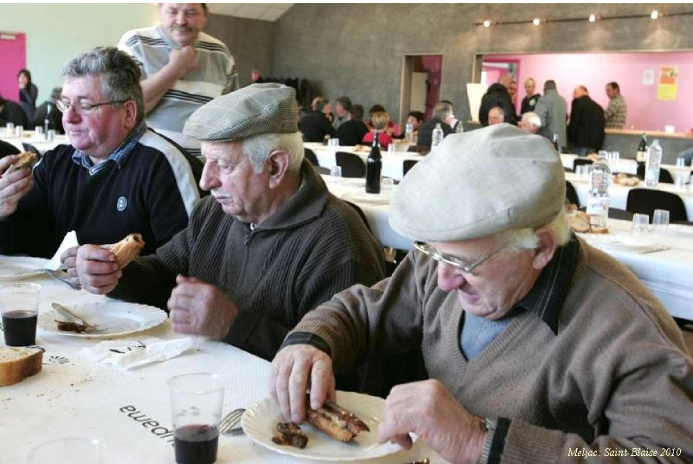
Meljac: Saint-Blaise 2010