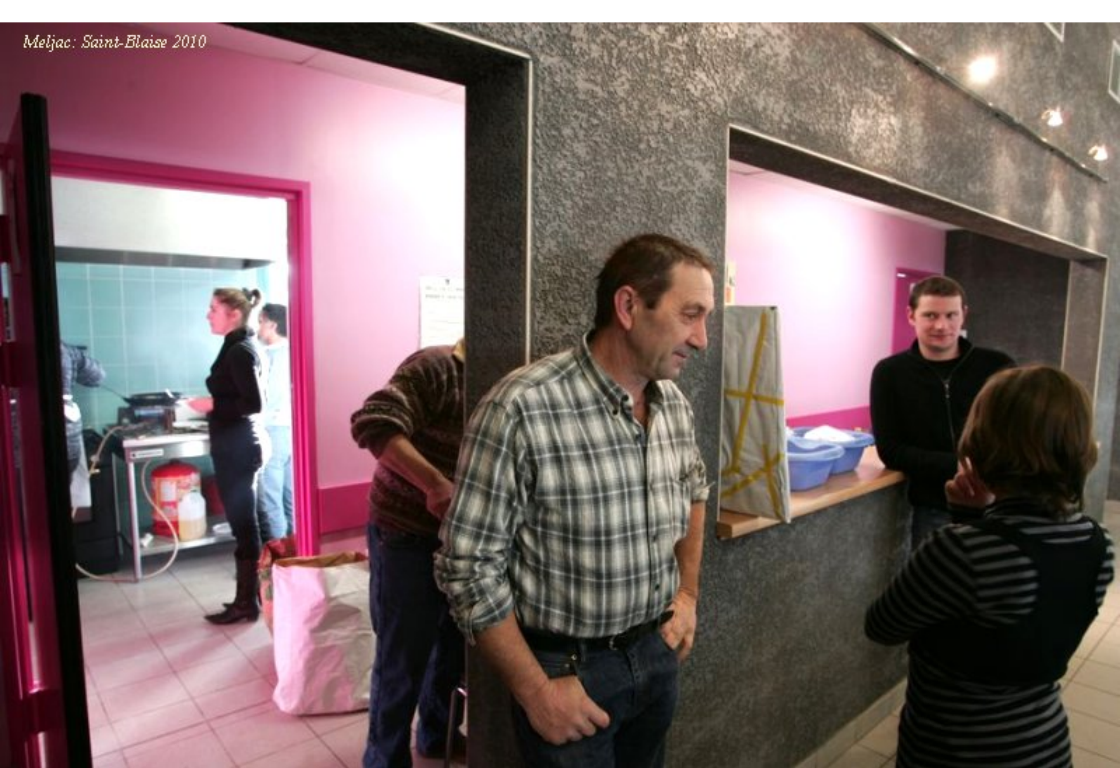
Meljac: Saint-Blaise 2010