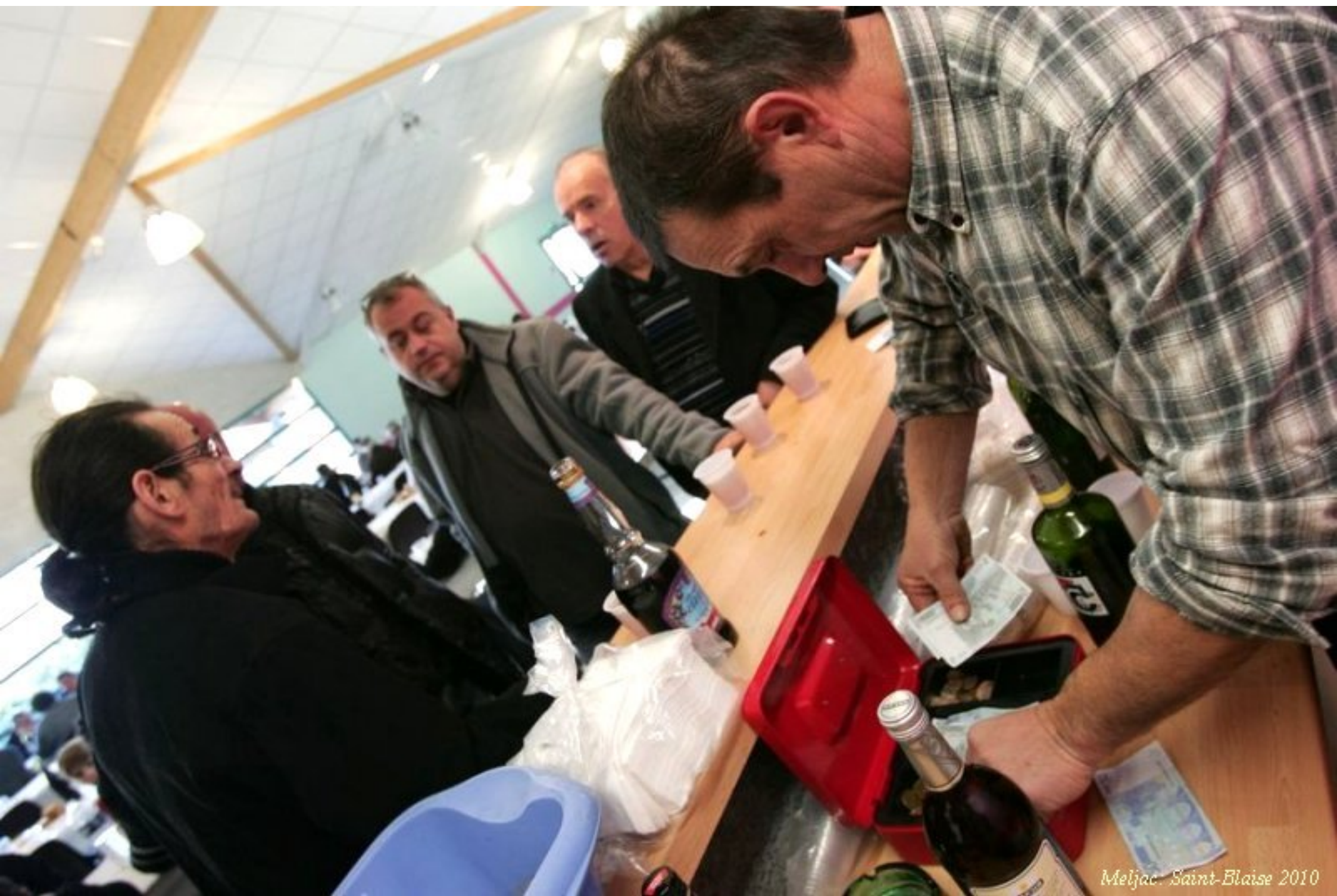
Meljac: Saint-Blaise 2010