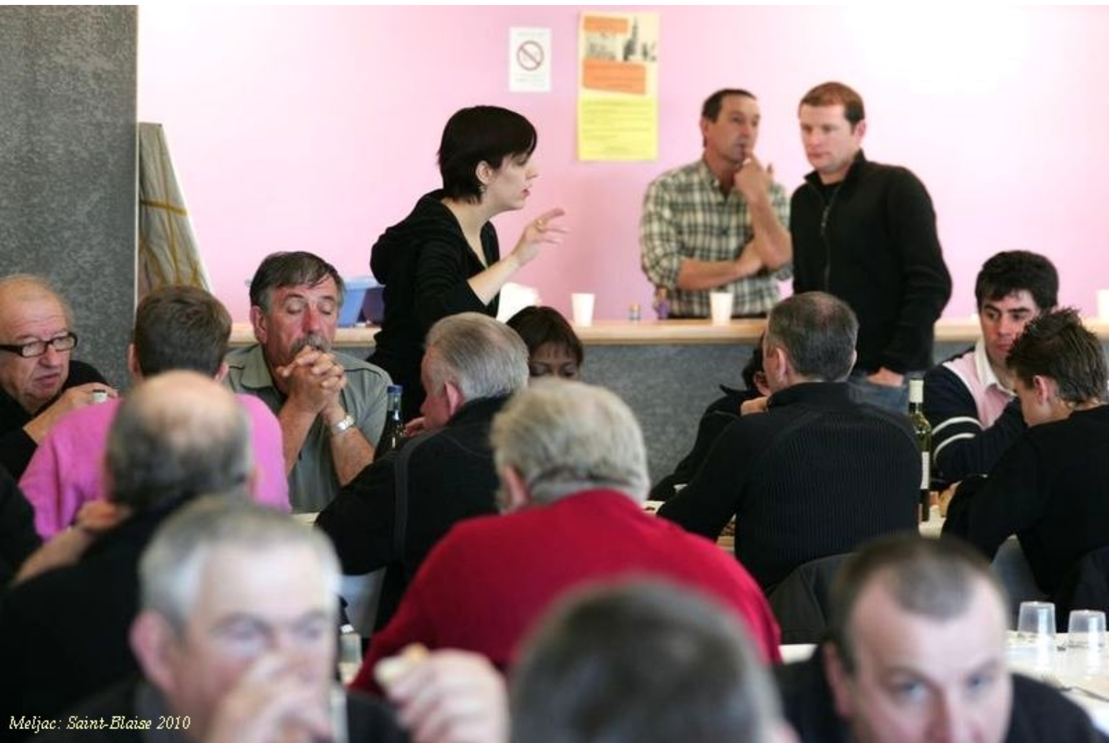
Meljac: Saint-Blaise 2010