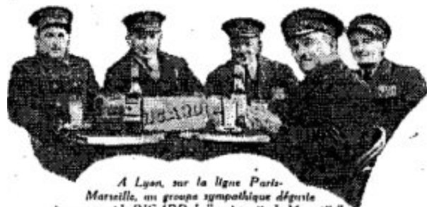
A Lyon, sur la ligne Paris- Marseille, un groupe sympathique déguste joyeusement le RICARD, le "vrai pastis de Marseille".