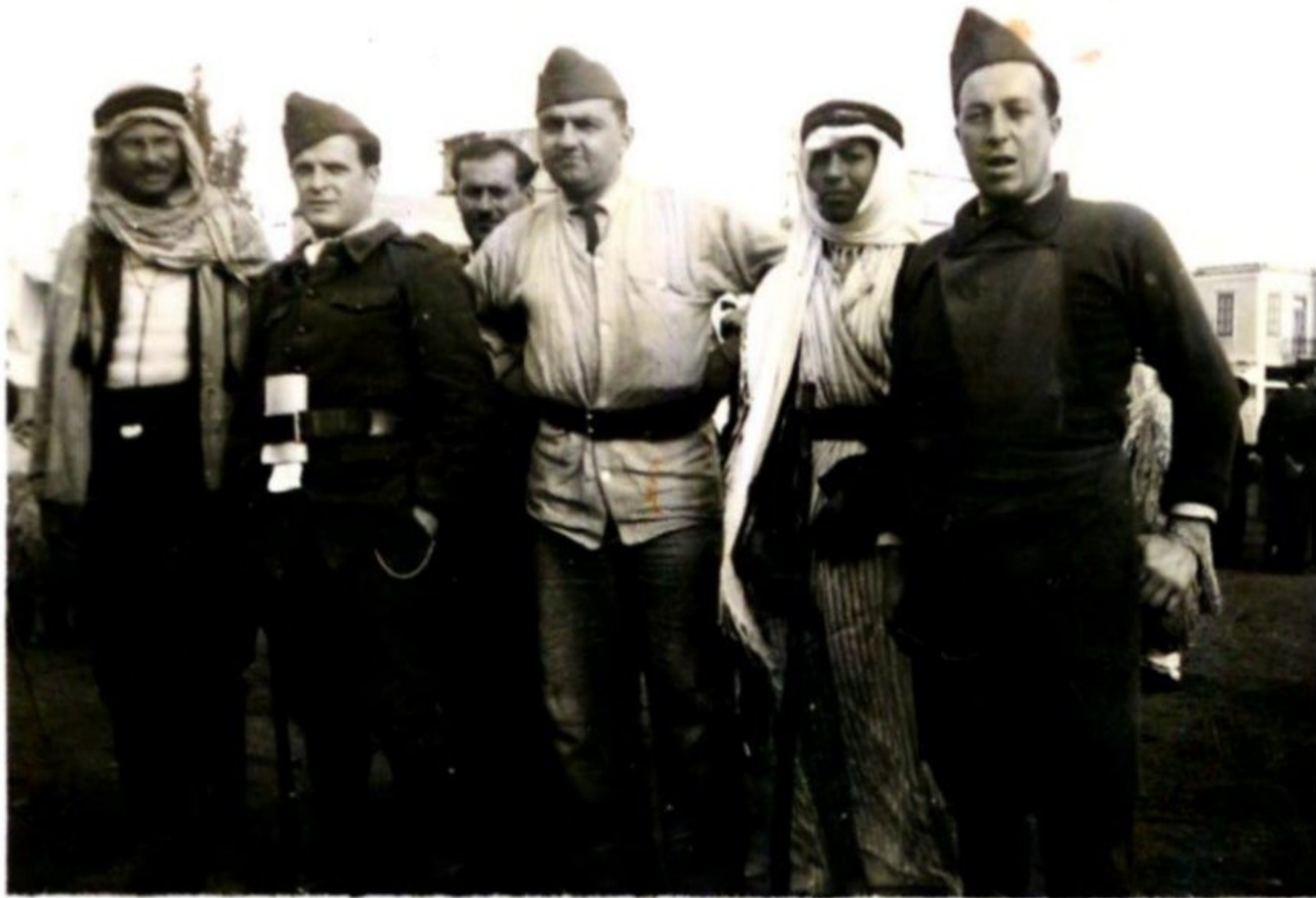
Au marché arabe en Syrie Au centre Louis Mazars