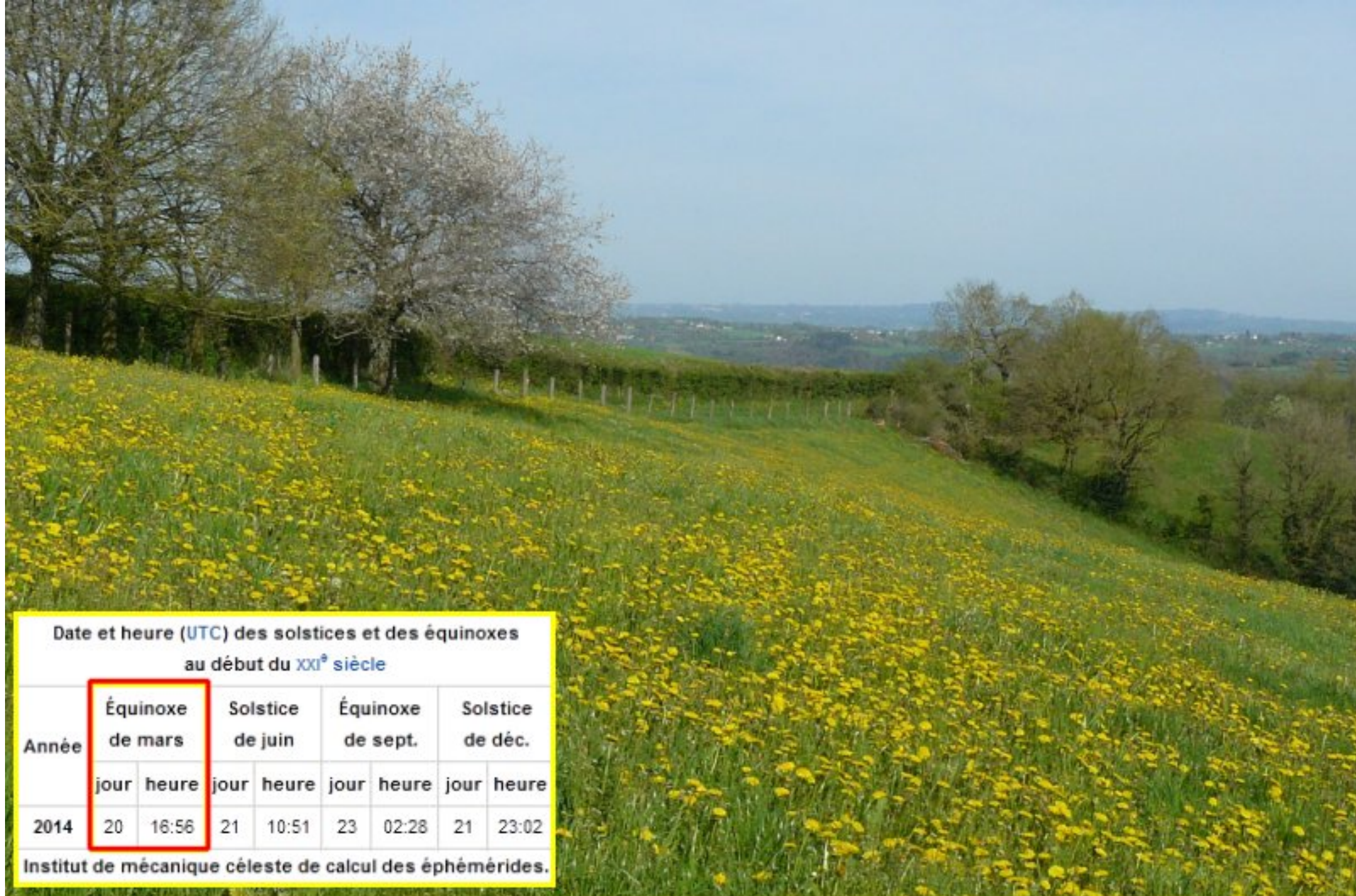
Date et heure (UTC) des solstices et des équinoxes au début du XXI e siècle